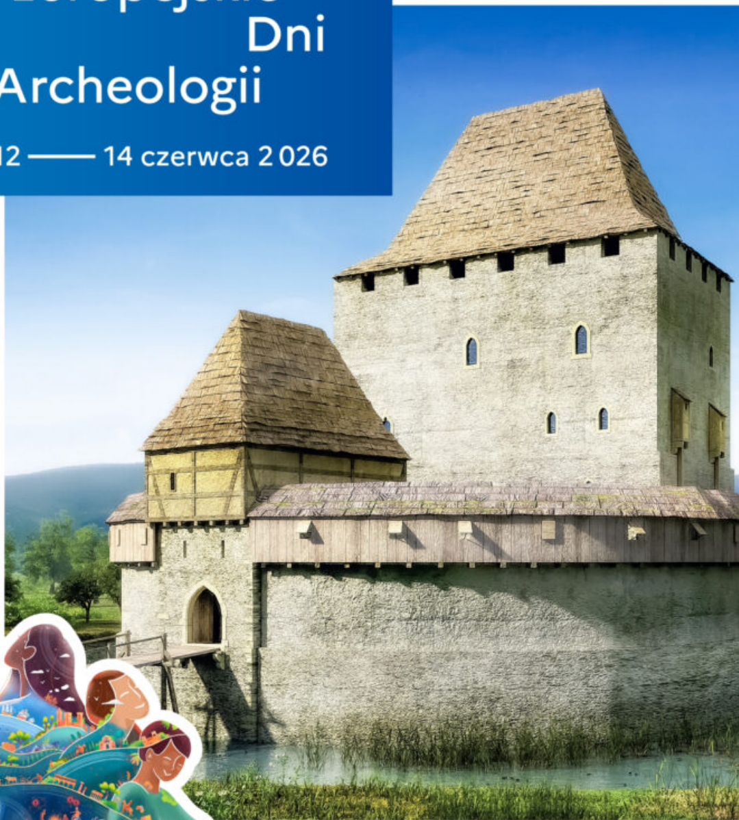
Wieża w Siedleńcu w XV wieku, oprac. Paweł Rajski, Przemysław Nocuń; materiały ze zbiorów Stowarzyszenia „Wieża Książęca w Siedleńcu”.