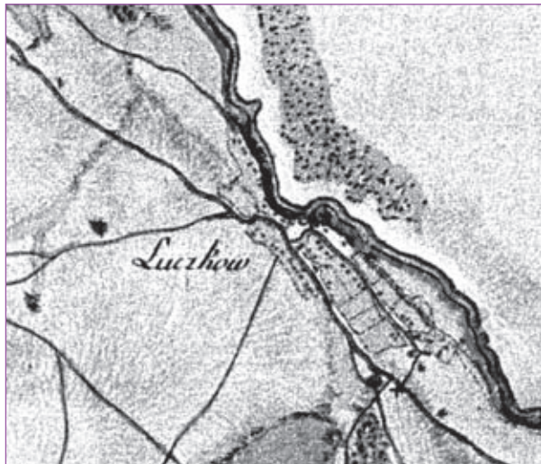
4. Łuszków. Widok na nawsie od płn.-zach.