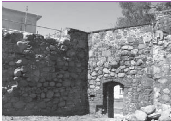
6. Sulęcín. Fragment północnego odcinka murów obronnych w trakcie konserwacji.