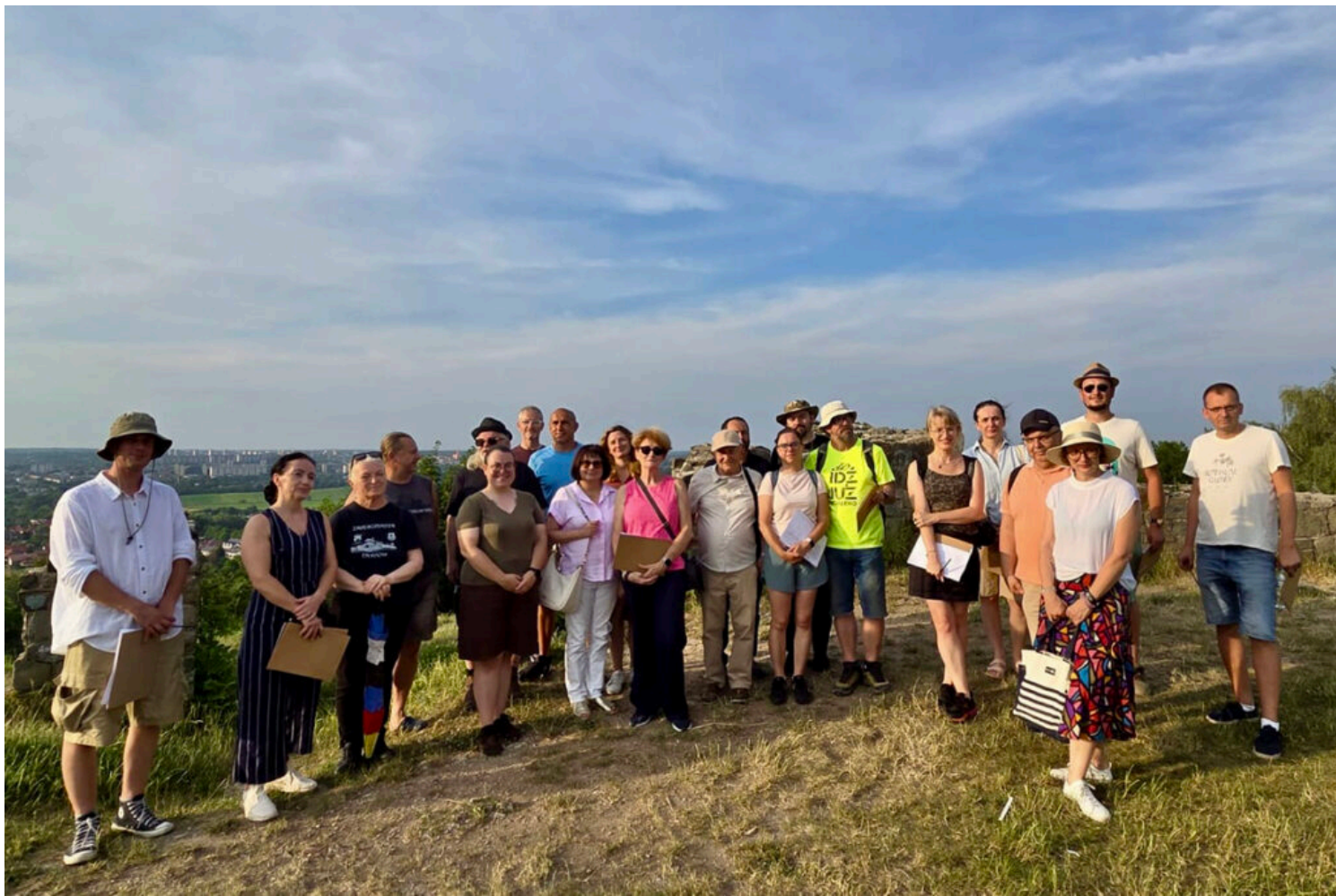
Spaceru badawczy po ruinach Zamku Tarnowskich