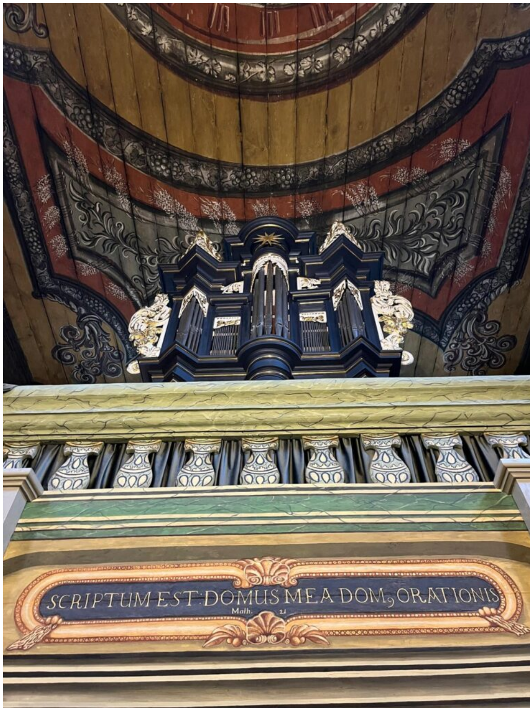
organy w kościele Matki Bożej Bolesnej w Mariańskim Porzeczcu