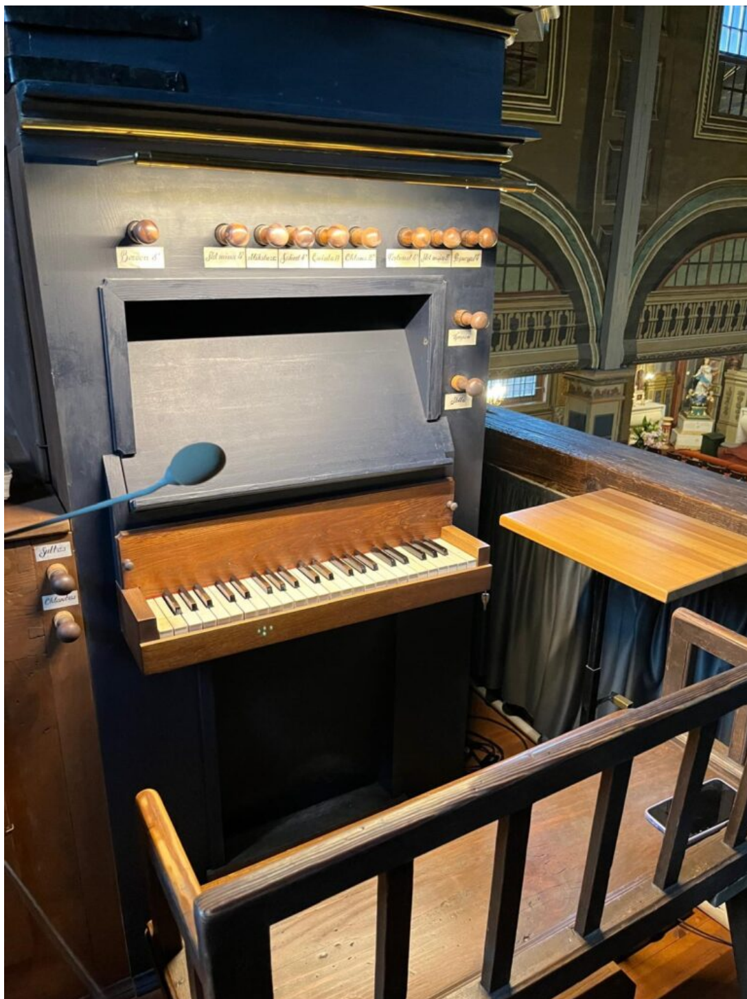
organy w kościele Matki Bożej Bolesnej w Mariańskim Porzeczcu