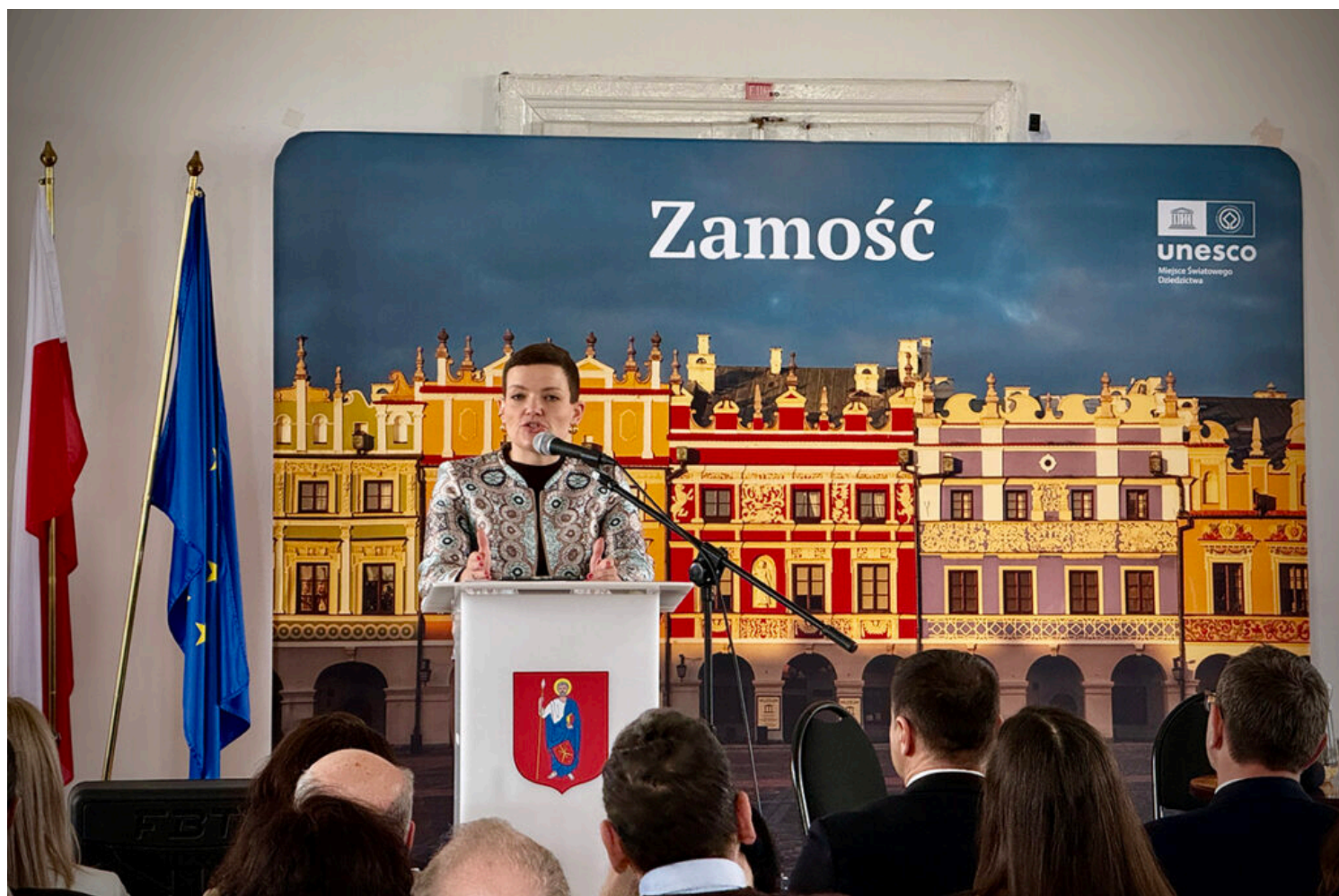
Ministra kultury i dziedzictwa narodowego Marta Cienkowska