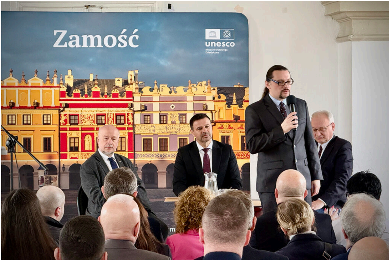
446 lat historii Zamościa, Konferencja oraz panel ekspercki poświęcone historii obiektu