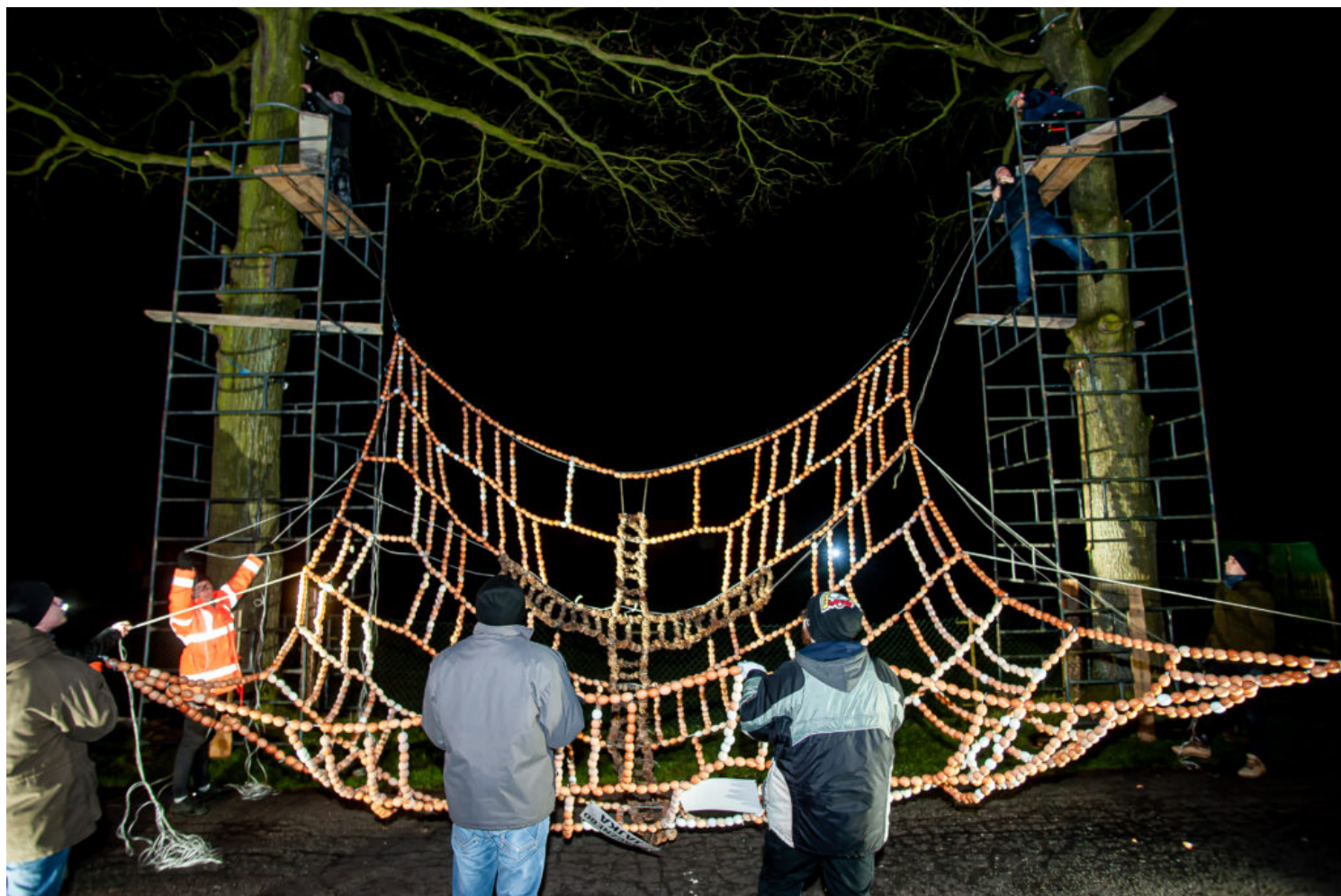
Wieszanie bramy wielkanocnej