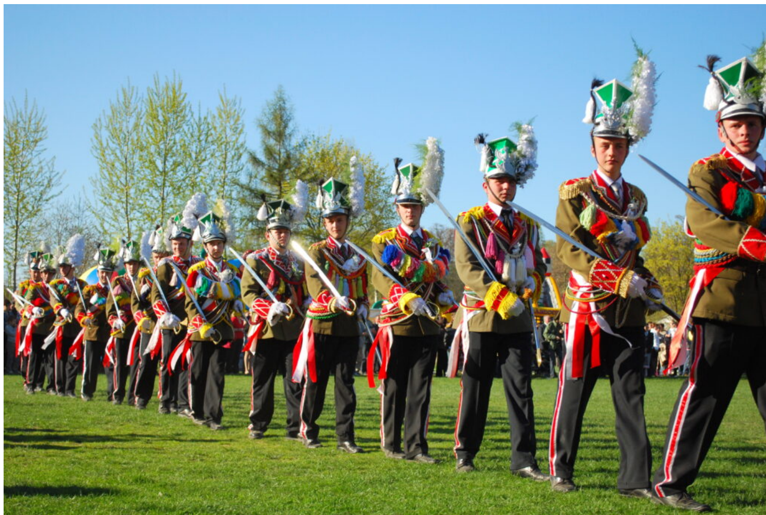
Turki grodziskie