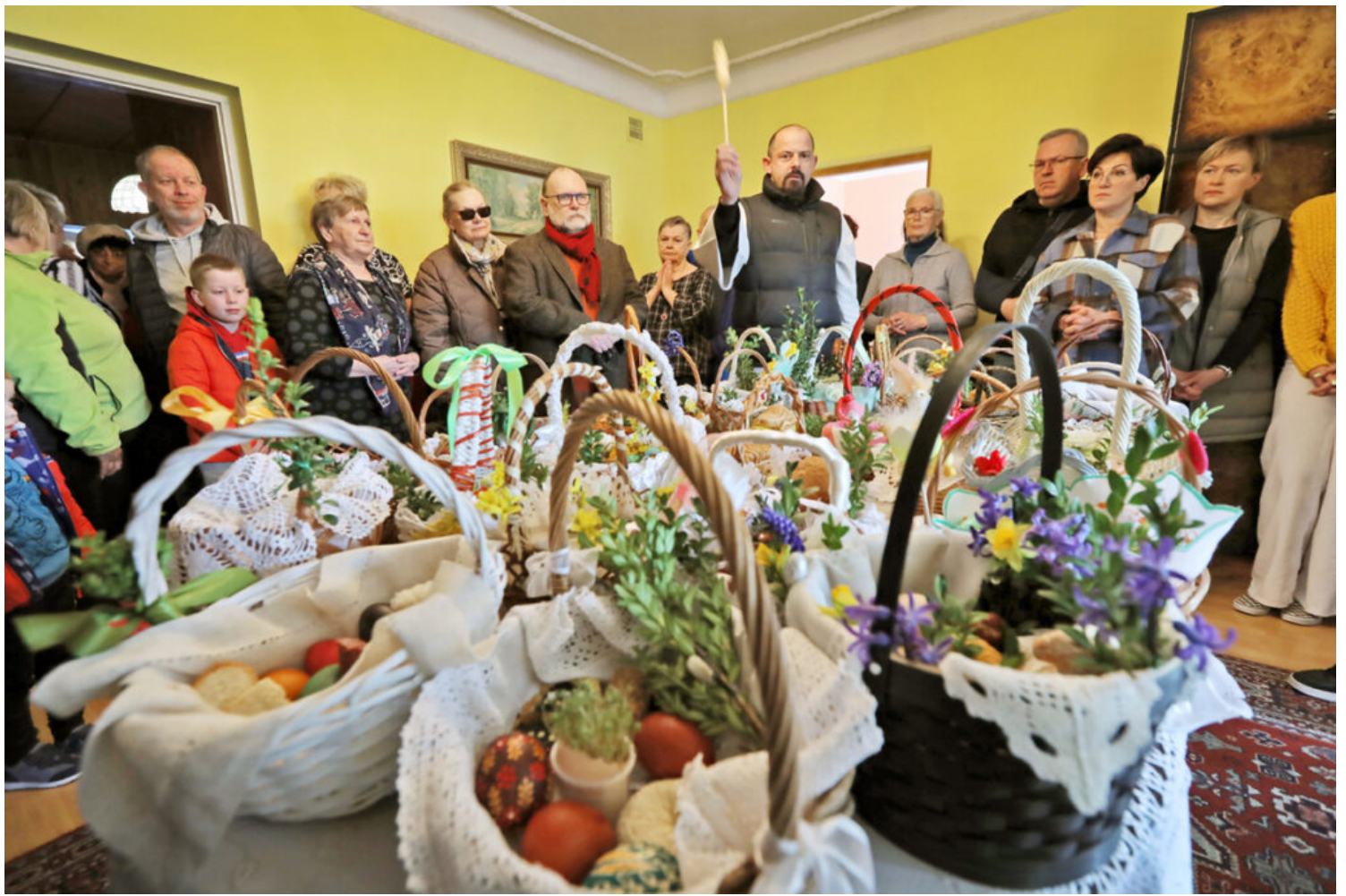
Święcenie pokarmów w Dąbrowie Chotomowskiej, P. Tołwiński