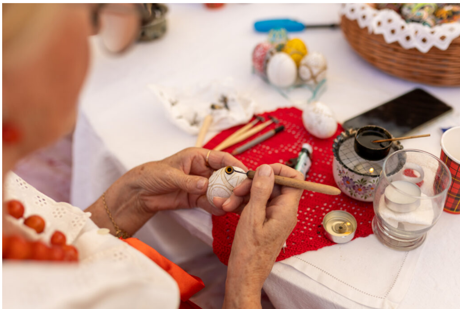
Pisanki batikowe