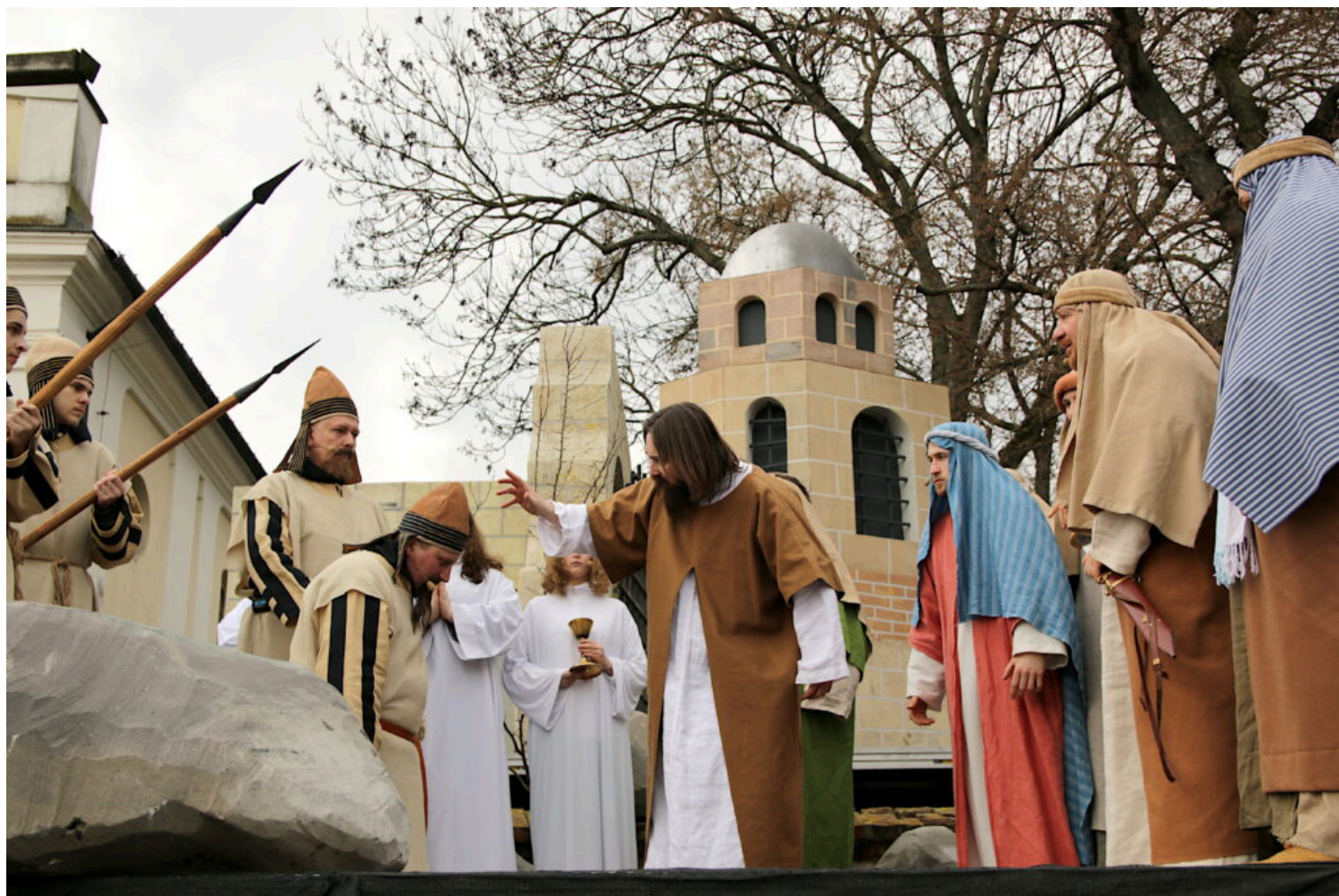
Misterium Męki Pańskiej na rynku Miejskim w Górze Kalwarii

W Polsce, popularne są widowiska teatralne upamiętniające wielkopiątkowe wydarzenia sprzed ponad 2000 lat – Misteria Męki Pańskiej. Odbywają się w kilku polskich sanktuariach zwanych kalwariami. W XVII wieku miały one zastępować wiernym pielgrzymki do Ziemi Świętej. Dzięki lokalnym kalwariom i odbywającym się w nich misteriom wierni mogli bezpiecznie, nie jadąc w daleką podróż przeżywać pobożnie tajemnice odkupienia. Jedno z nich – Misterium Męki Pańskiej na rynku Miejskim w Górze Kalwarii – decyzją Ministra Kultury i Dziedzictwa Narodowego zostało wpisane do Krajowego rejestru dobrych praktyk w ochronie niematerialnego dziedzictwa kulturowego.