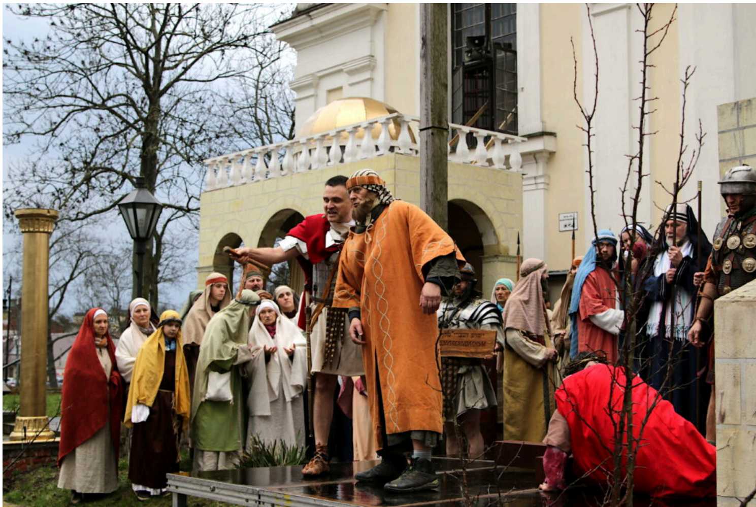
Misterium Męki Pańskiej na rynku Miejskim w Górze Kalwarii