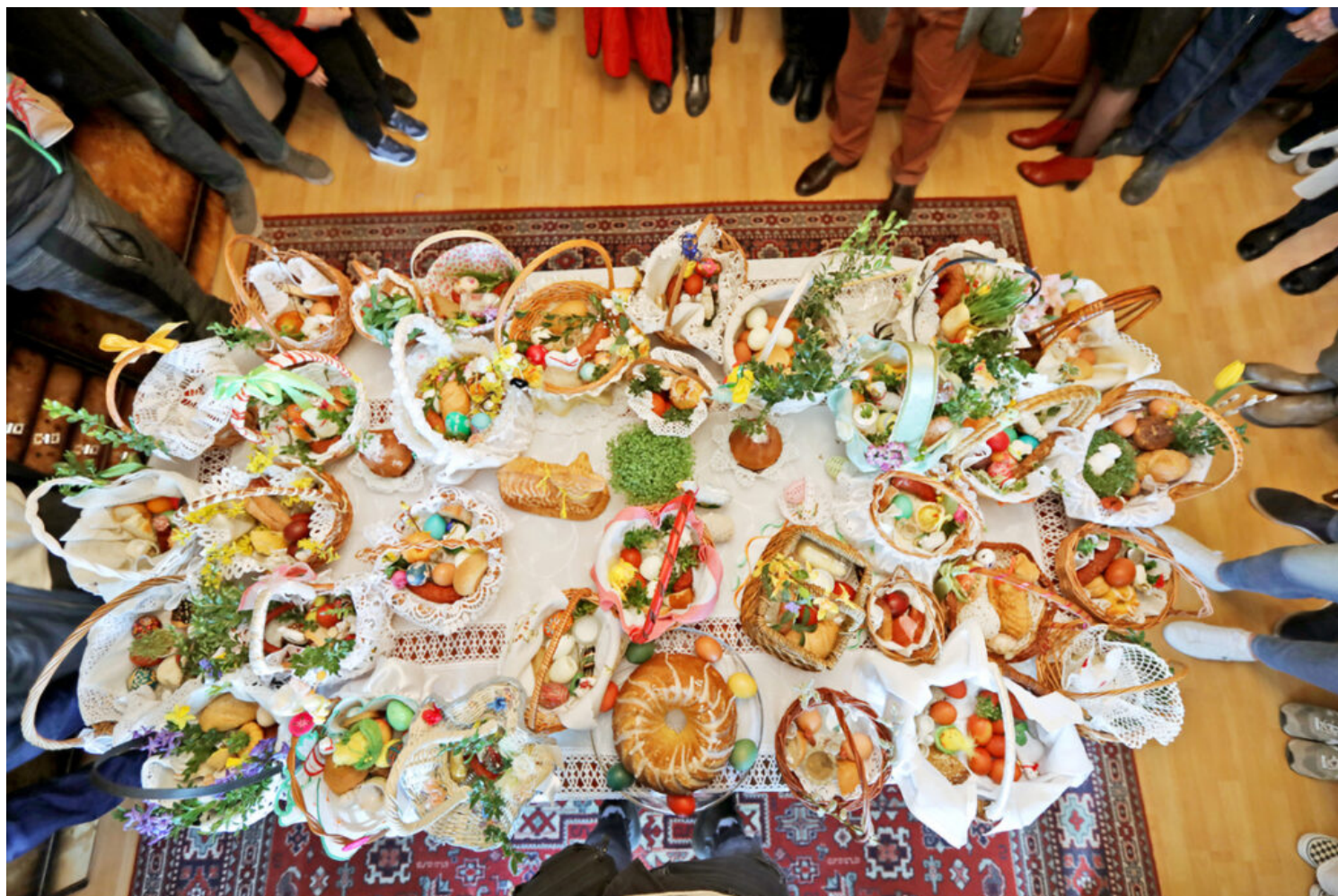
Święcenie pokarmów w Dąbrowie Chotomowskiej, P. Tołwiński