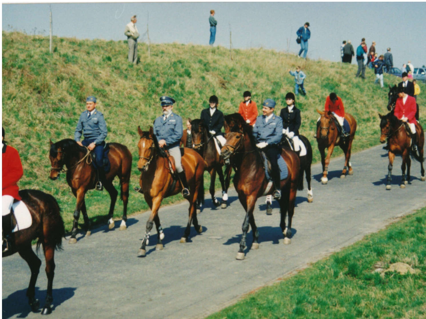
Pochód konny w Pietrowicach Wielkich