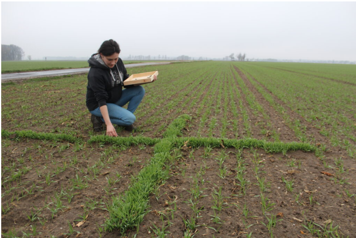
Krzyżyki z palmy