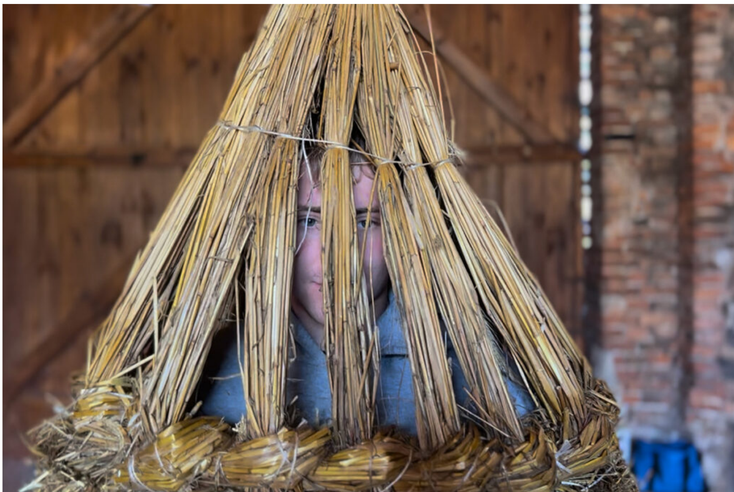
Niedźwiedzie wielkanocne z Góry

Poganiaczami, a na końcu Kominiarze. Przebierańcy odwiedzają domy, zbierają datki i „murzą” twarze sadzą, co szczególnie cieszy dzieci. Stroje są bogate w symbolikę, a najbardziej pracowite są kostiumy Niedźwiedzi wykonywane ze słomy. Zebrane datki przeznacza się częściowo na cele charytatywne, a sama tradycja integruje mieszkańców i pozostaje ważnym elementem lokalnej tożsamości.