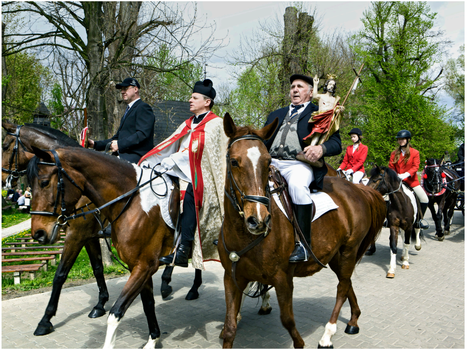
Pietrowice Wielkie, fot. Marek Maruszak