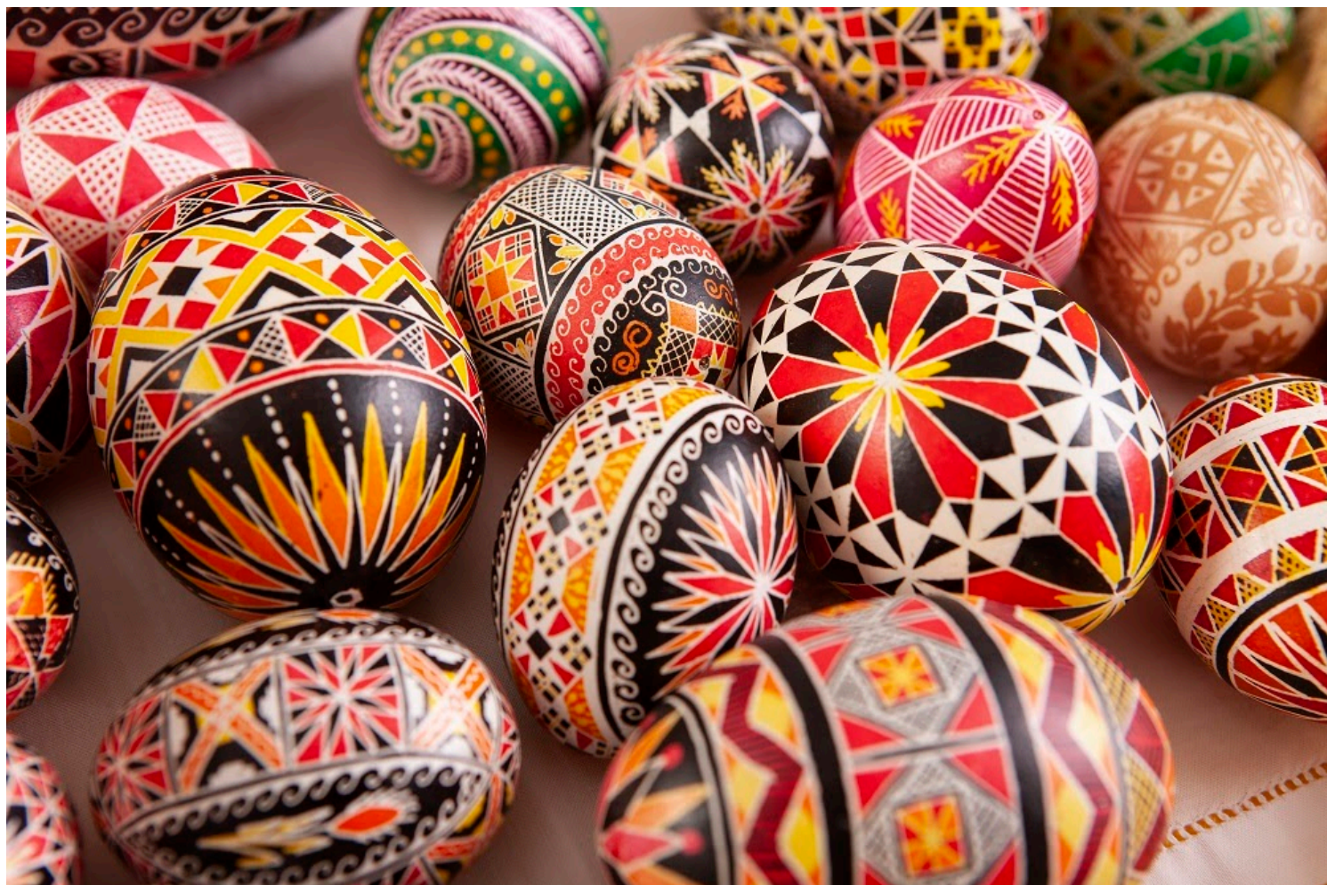
Pisanki batikowe