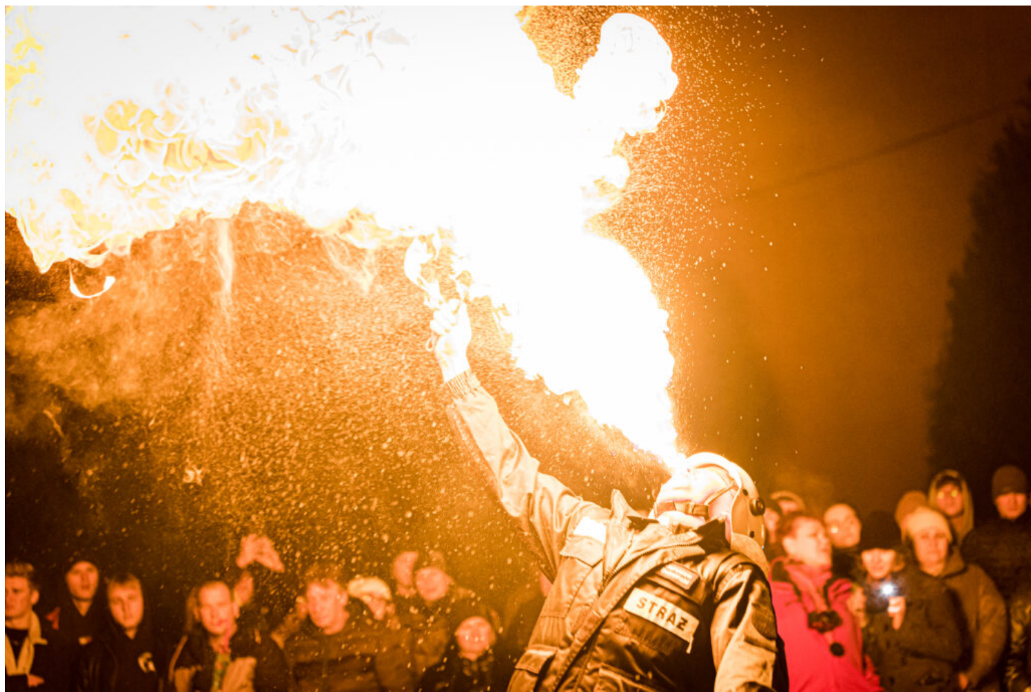
Bziuki, fot. Adam Gawroński