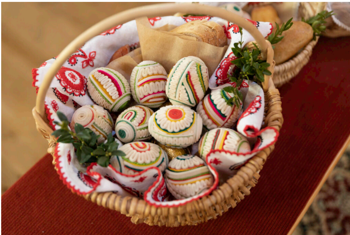
Oklejanka