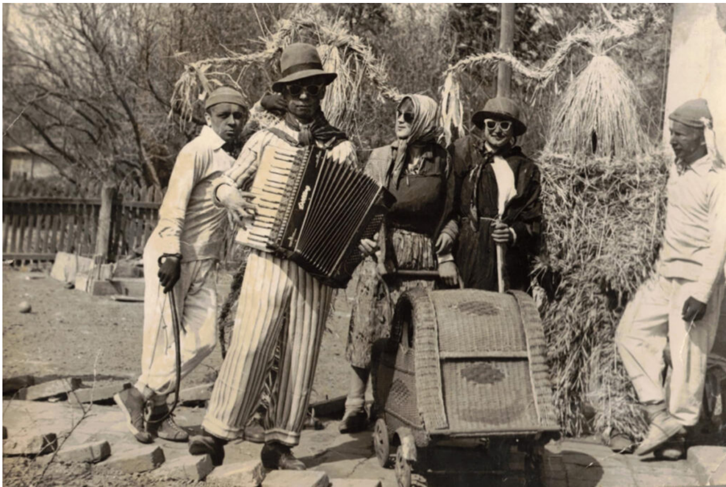
Nieźwiedzie wielkanocne z Góry, fot. archiwalna