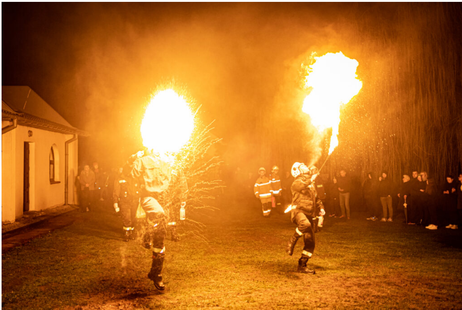
Bziuki, fot. Adam Gawroński