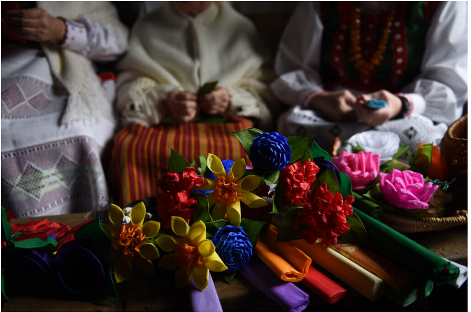
Tworzenie ozdób na palmy

Z kolei na Opolszczyźnie kultywuje się niezwykłą tradycję wytwarzania tzw. „krzyżyków z palmy wielkanocnej” . Poświęcone palmy wykorzystywane są do tworzenia małych krzyżyków, które później umieszcza się na polach , mając nadzieję na urodzaj. Krzyżyki z palmy wielkanocnej – zwyczaj z terenów Opolszczyzny - trafił na Krajową listę w 2022 roku.