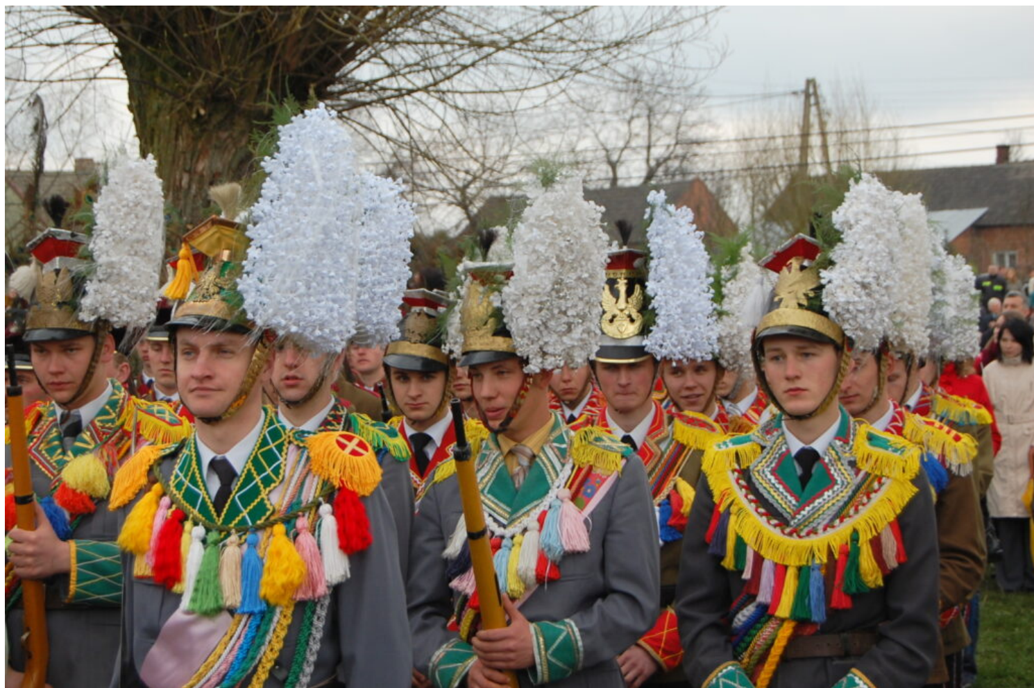
Turki grodziskie