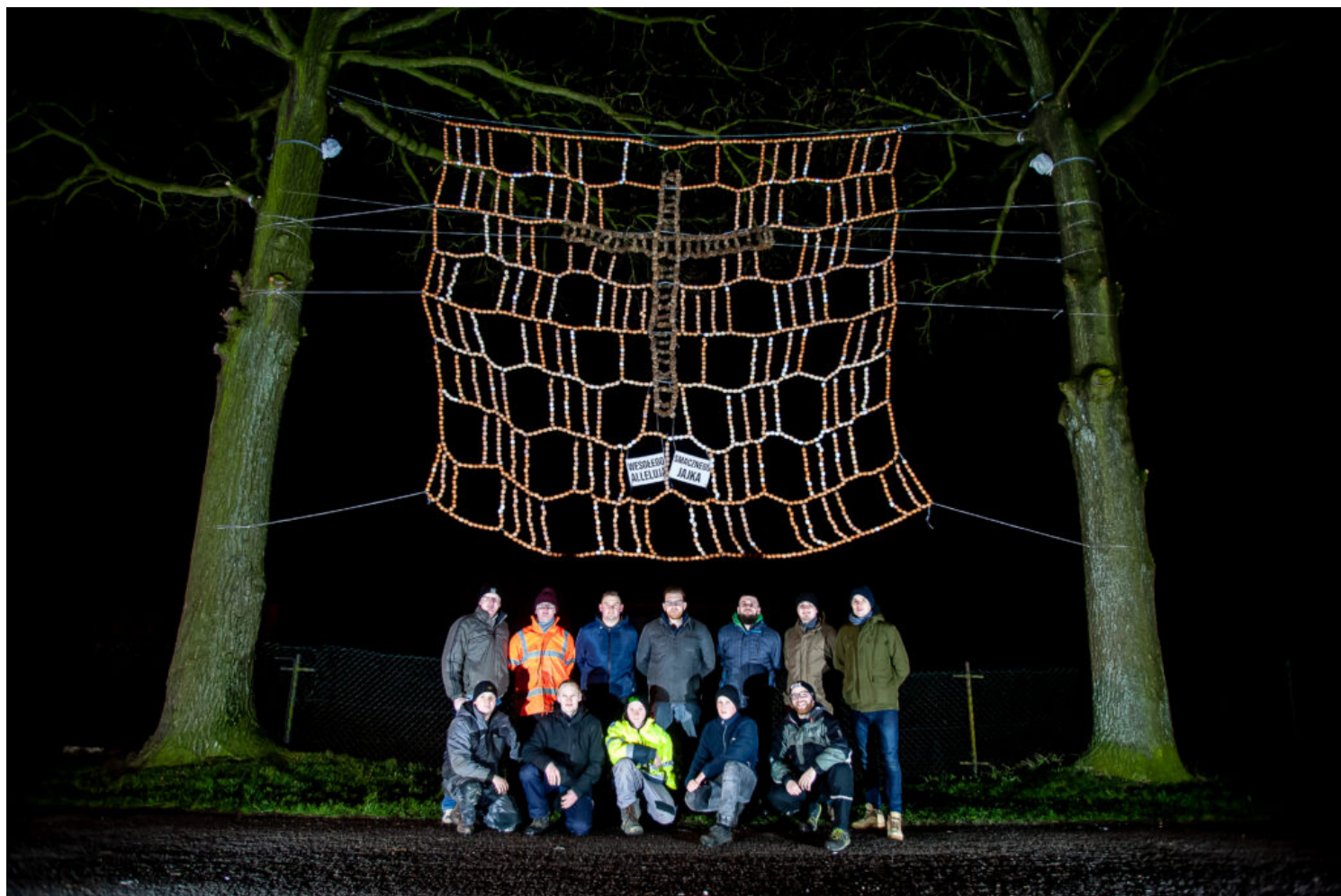
Wieszanie bramy wielkanocnej