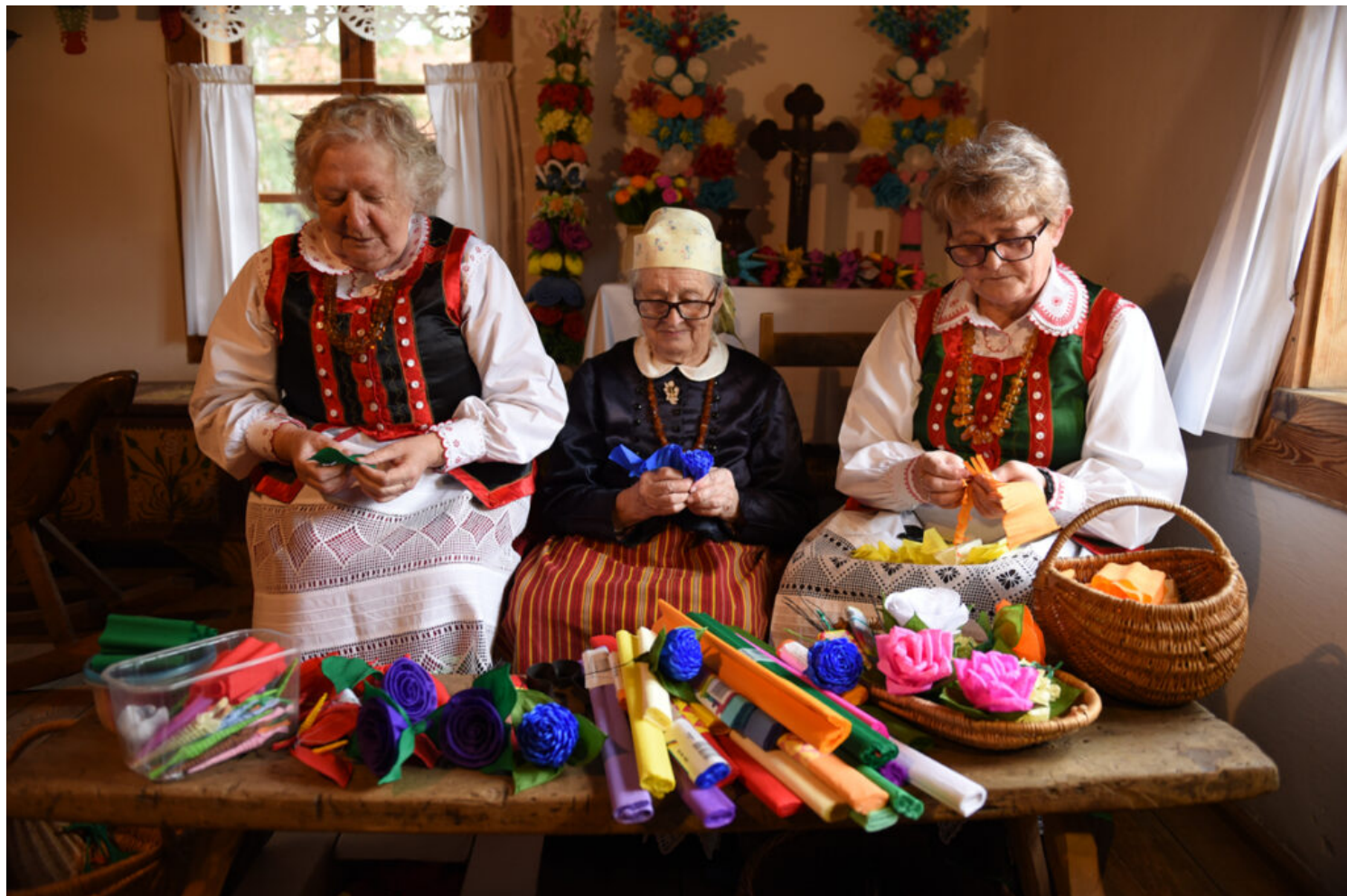
Tworzenie ozdób na palmy

białego (niewinność, czystość i życie bez grzechu). Tradycja wykonywania palm wielkanocnych Kurpiów Puszczy Zielonej została wpisana na Krajową listę w 2024 roku.