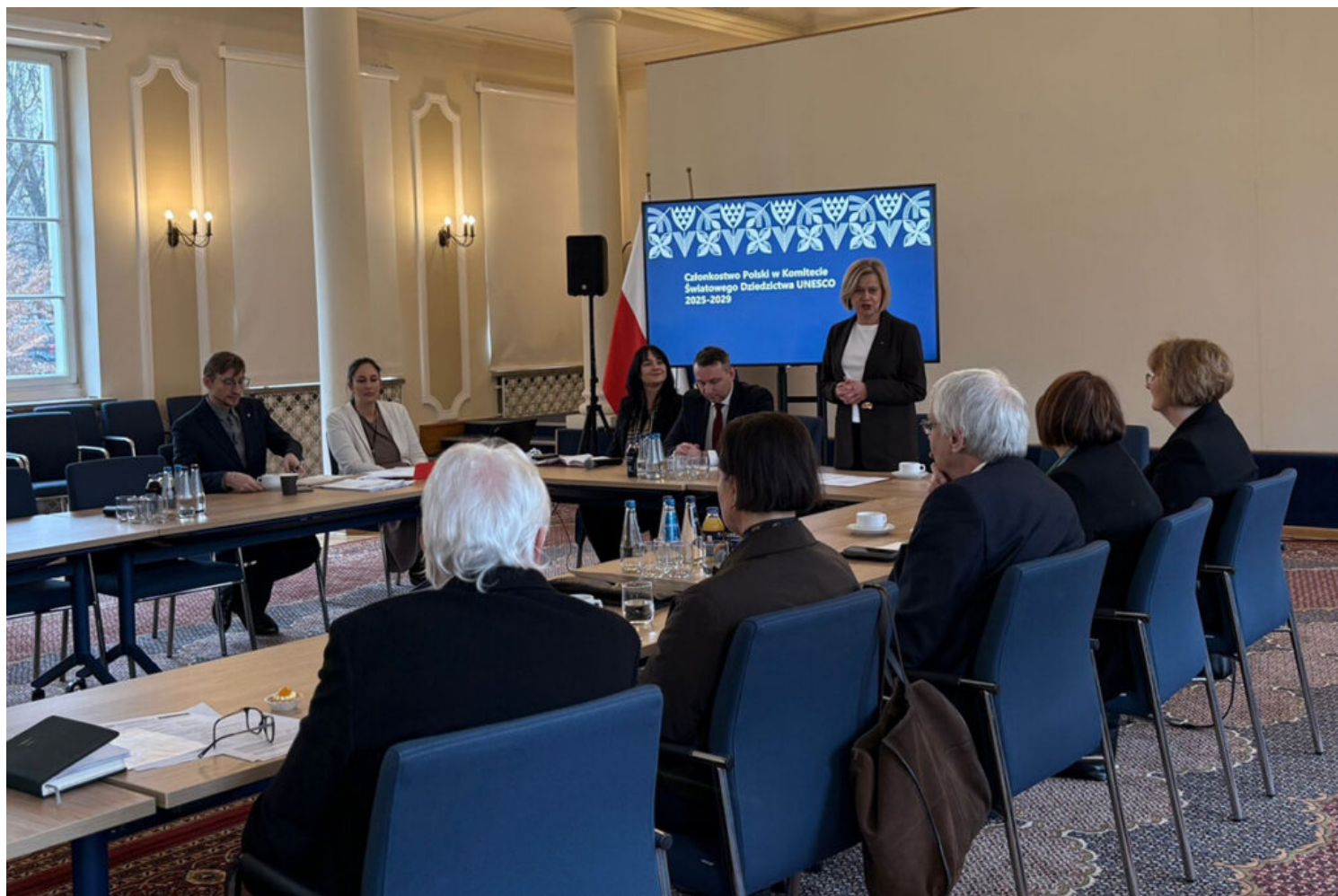
Zespół ds. członkostwa Polski w Międzrządowym Komitecie Ochrony Dziedzictwa Kulturalnego i Naturalnego

Polska sprawowała mandat członka Komitetu Światowego Dziedzictwa UNESCO w latach 1976–1978 oraz 2013–2017. Wybór na kolejną kadencję w latach 2025–2029 stanowi wyraz uznania dla dorobku naszego kraju w zakresie ochrony dziedzictwa, a zarazem zobowiązanie do aktywnego i odpowiedzialnego współtworzenia systemu ochrony ustanowionego na mocy Konwencji z 1972 roku.