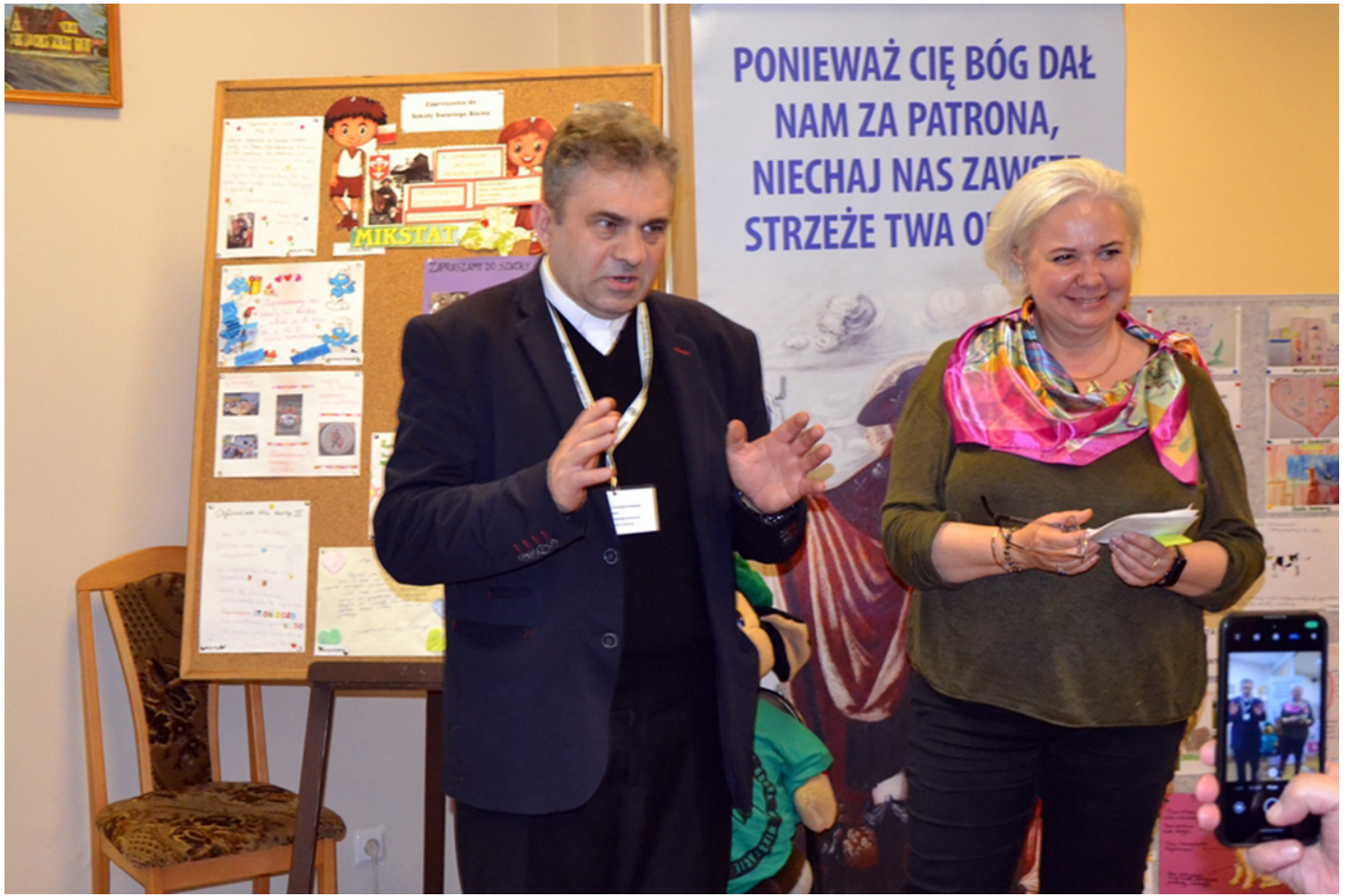
I Mikstackie Seminarium o Niematerialnym Dziedzictwie Kulturowym