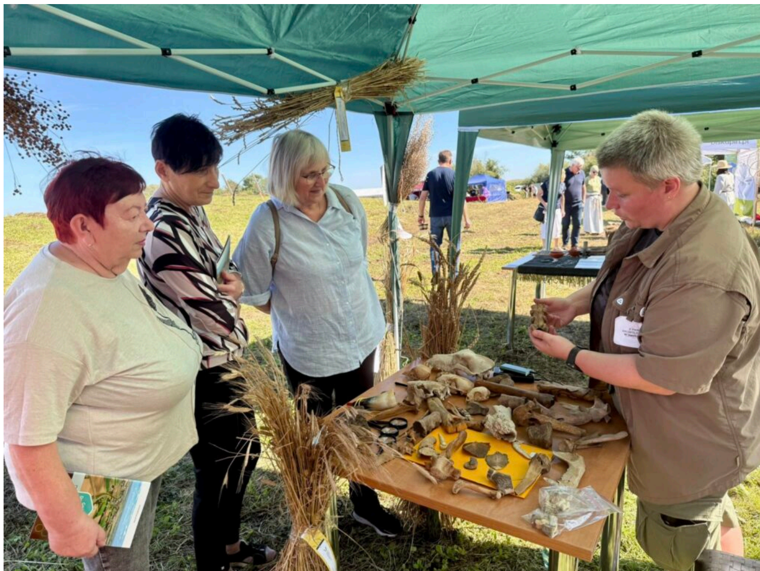
II Piknik Archeologiczny w Smuszewie, fot. Magdalena Karpińska/NID