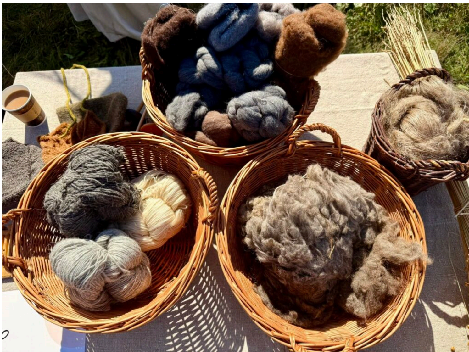
II Piknik Archeologiczny w Smuszewie