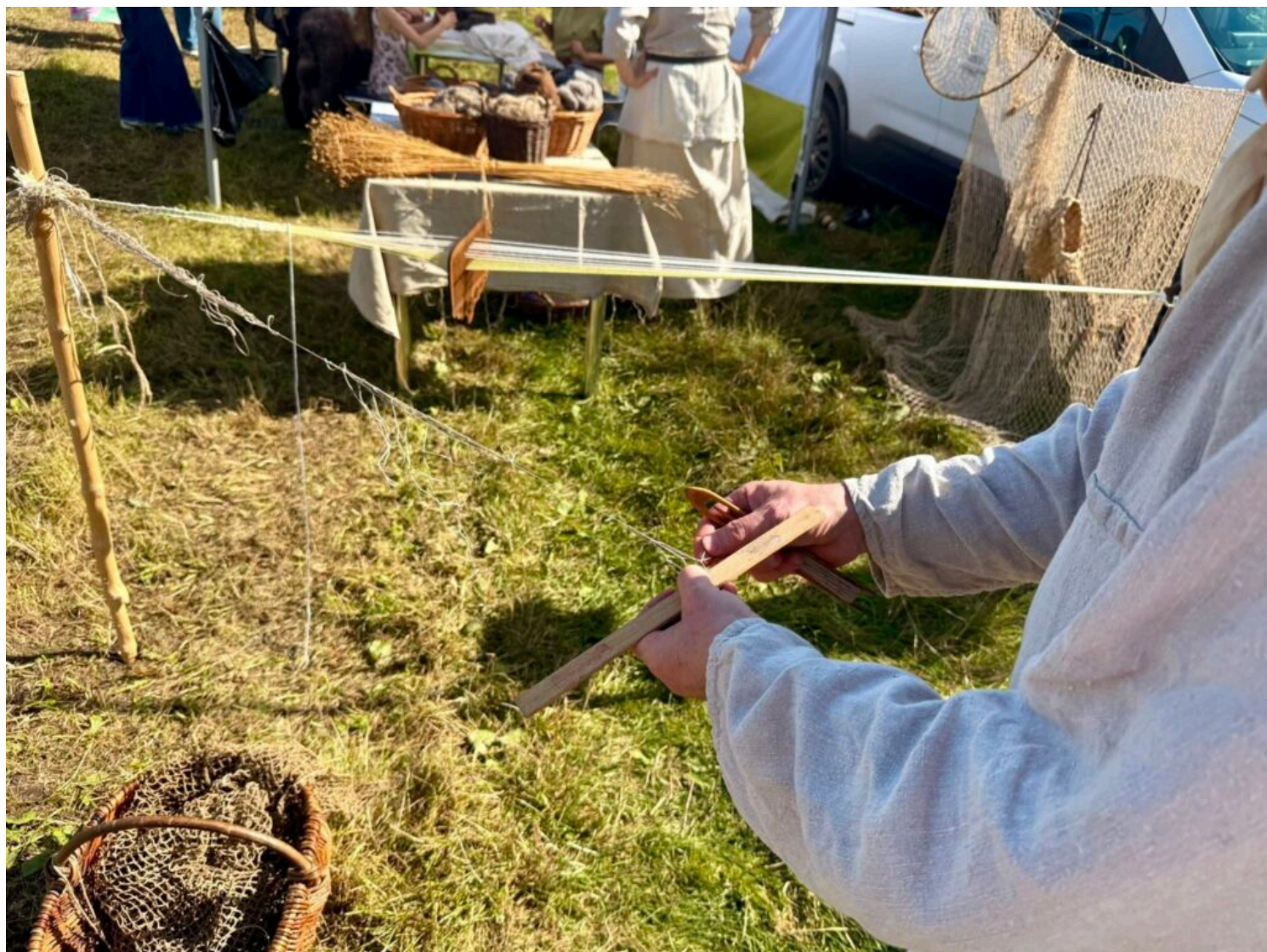
II Piknik Archeologiczny w Smuszewie, fot. Magdalena Karpińska/NID