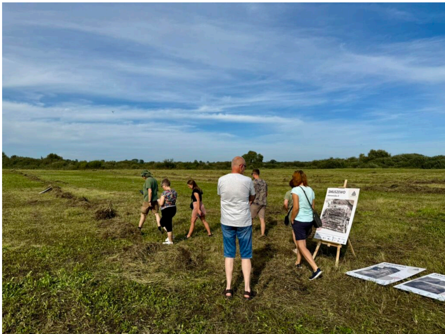
II Piknik Archeologiczny w Smuszewie