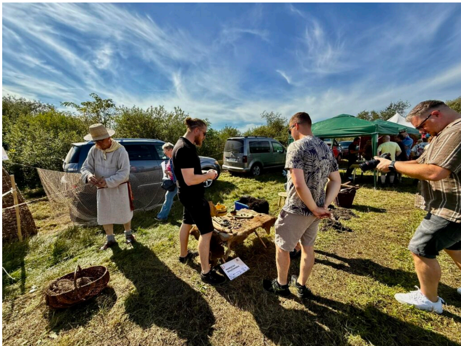
II Piknik Archeologiczny w Smuszewie, fot. Patrycja Adamczyk/NID