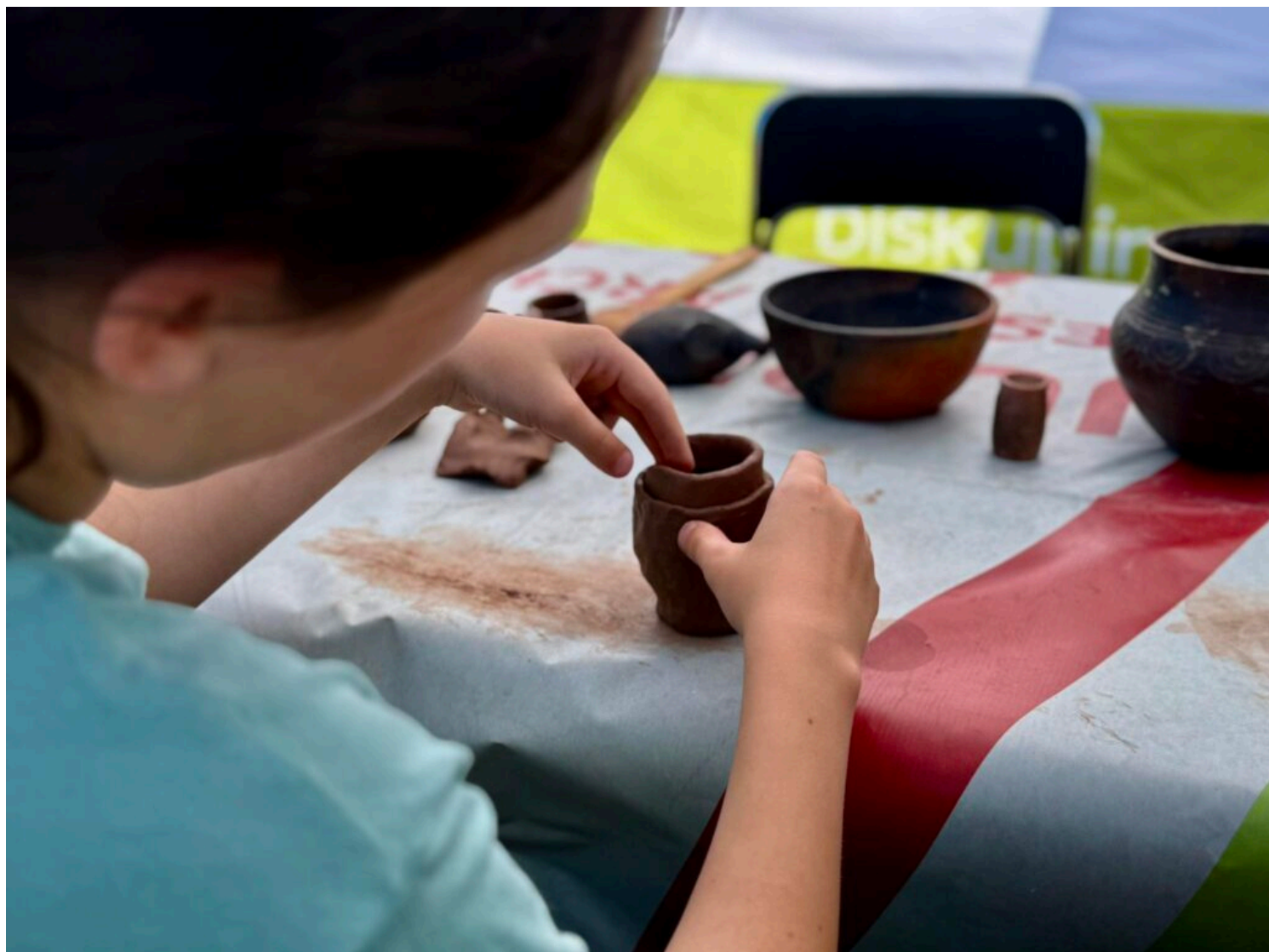
II Piknik Archeologiczny w Smuszewie