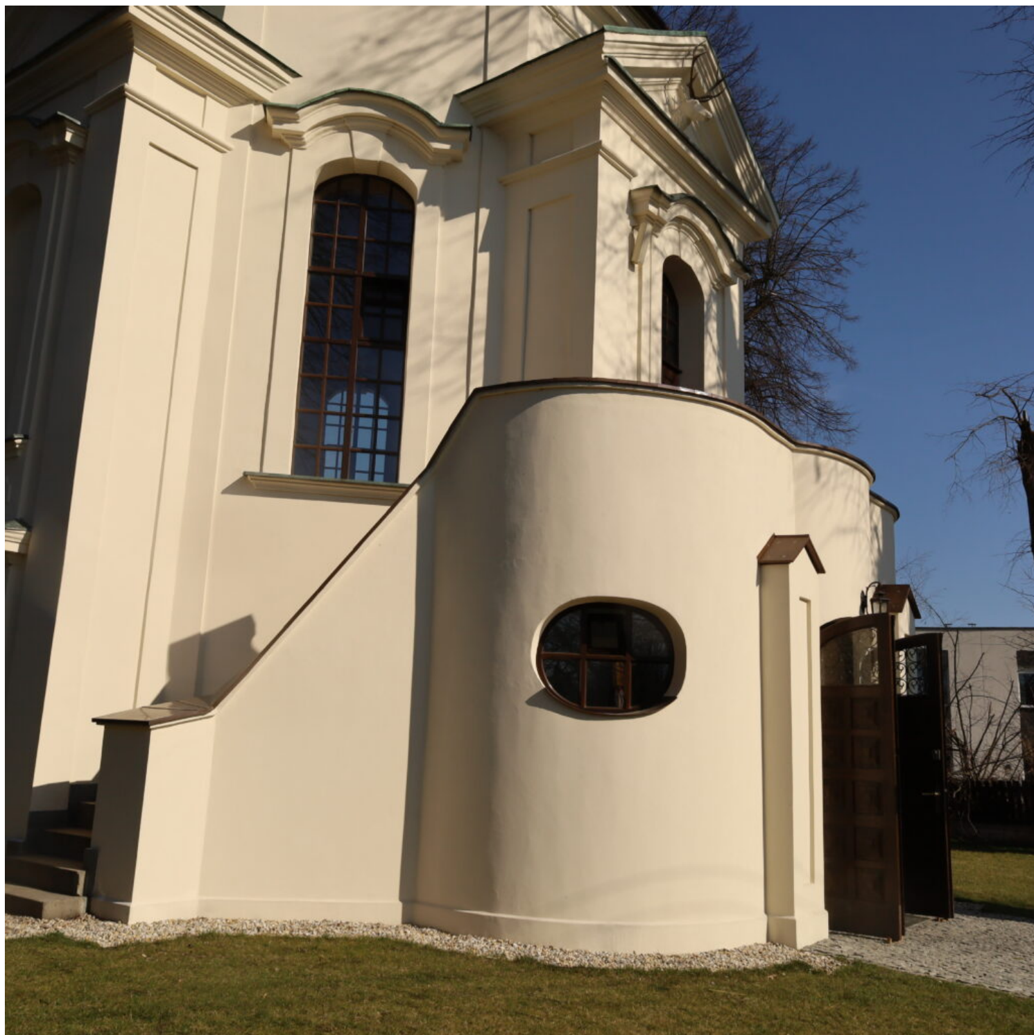
Rzeszów - Kaplica św. Huberta