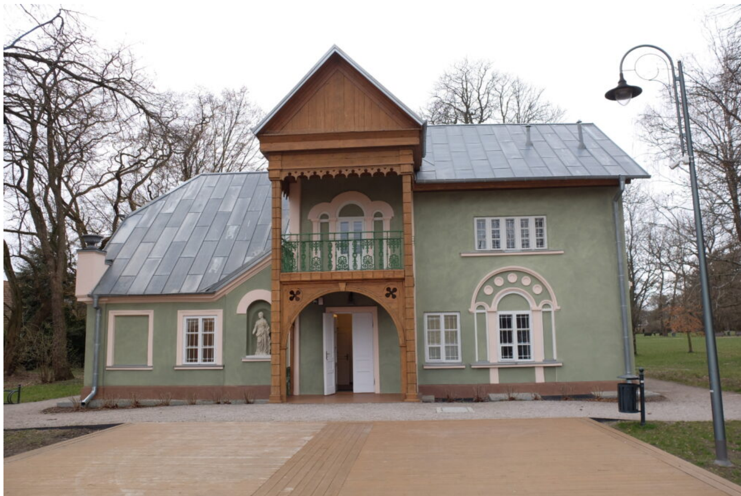
Piaseczno, Poniatówka, fot. NID/Z. Rejewska