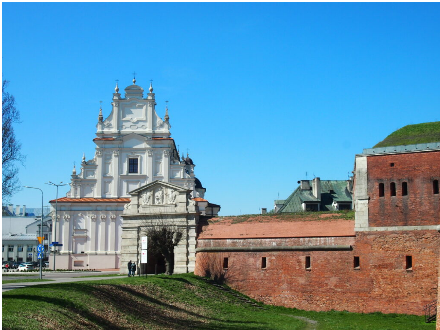
Zamość, Brama Lwowska Stara, fot. NID/E. Prusicka