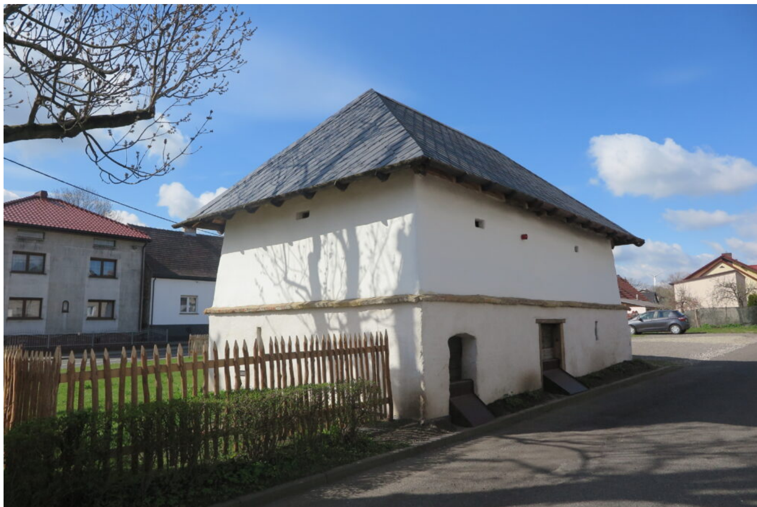
Racibórz-Sudół, spichlerz, fot. NID/D. Folan