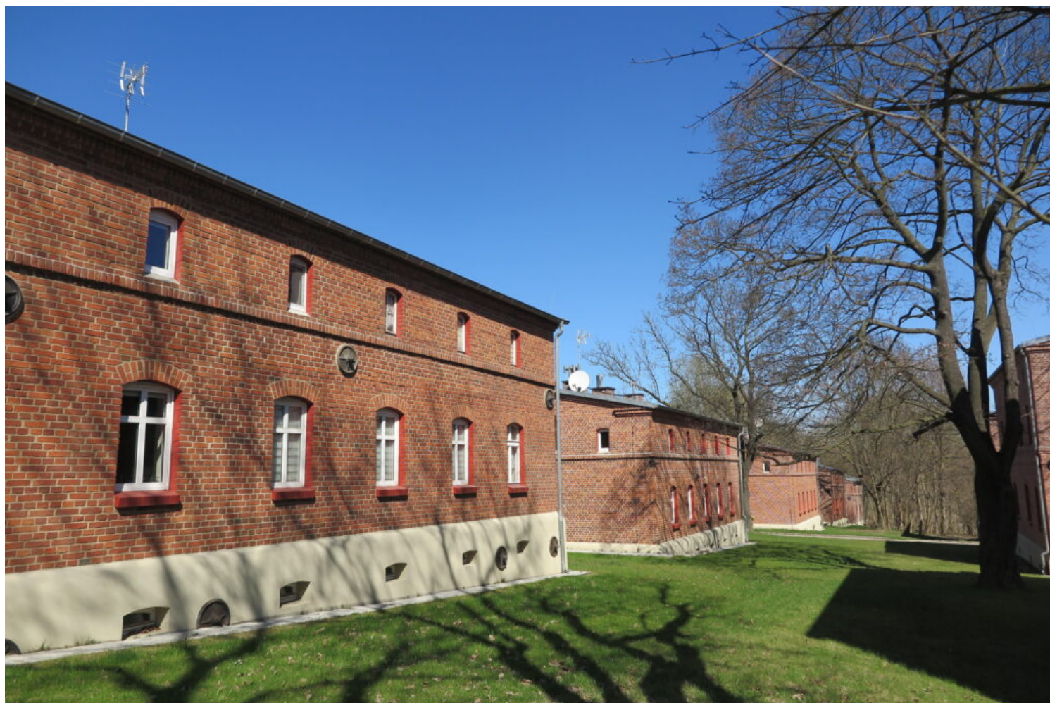
Bytom, Kolonia Zgorzelec