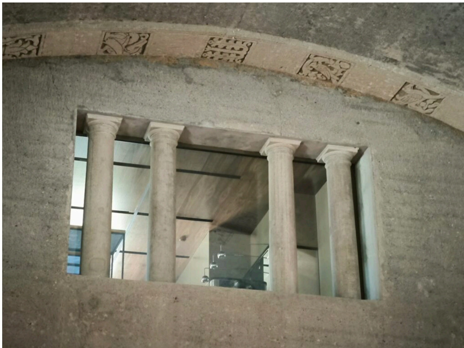
Poznań, pawilon wystawowy