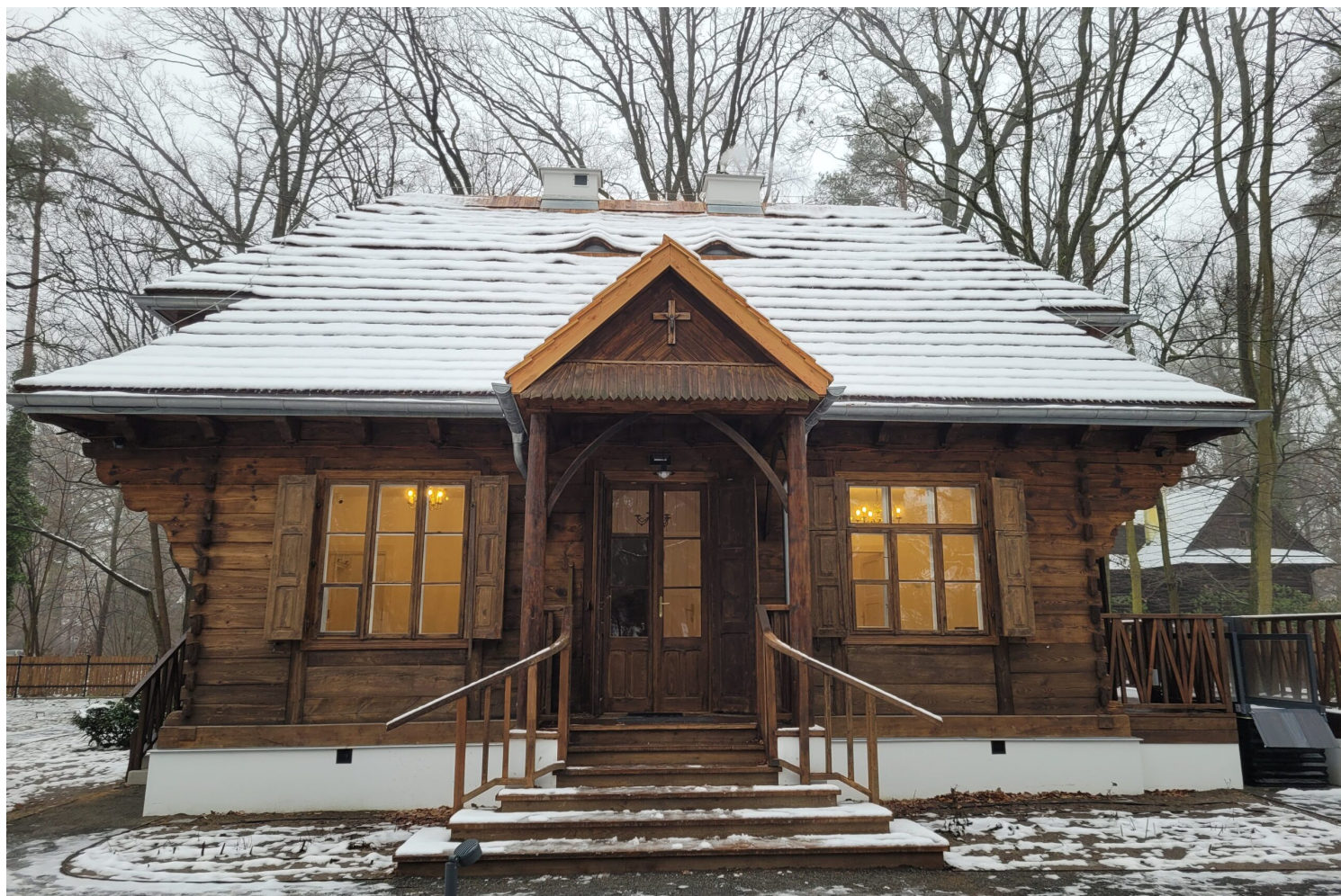
Piaseczno, Dom Zośki, fot. Archiwum Gminy Piaseczno