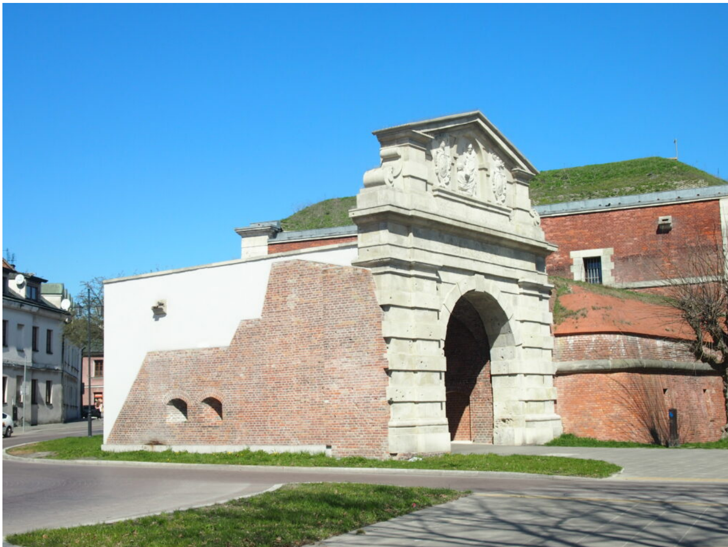
Zamość, Brama Lwowska Stara