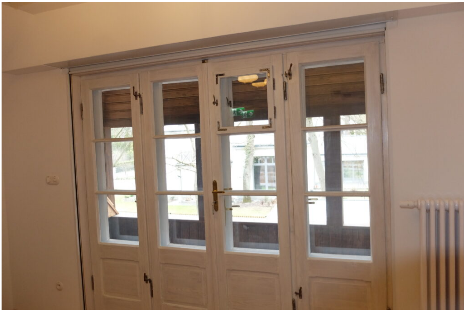
Piaseczno, Dom Zośki