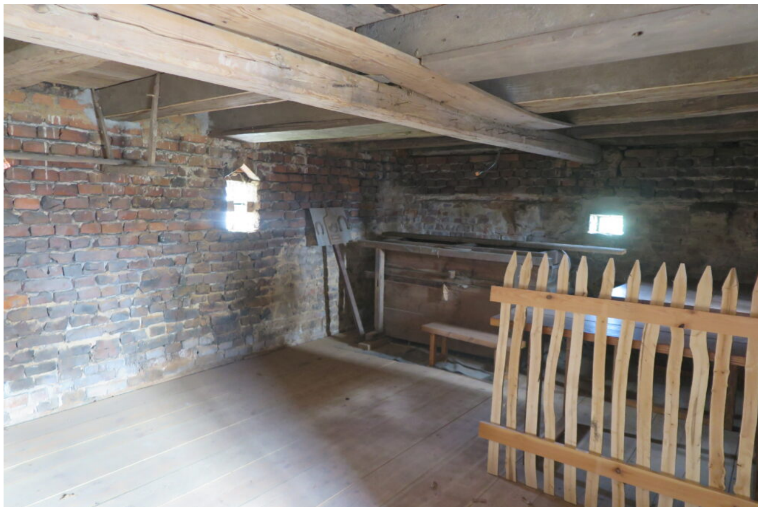
Racibórz-Sudół, spichlerz