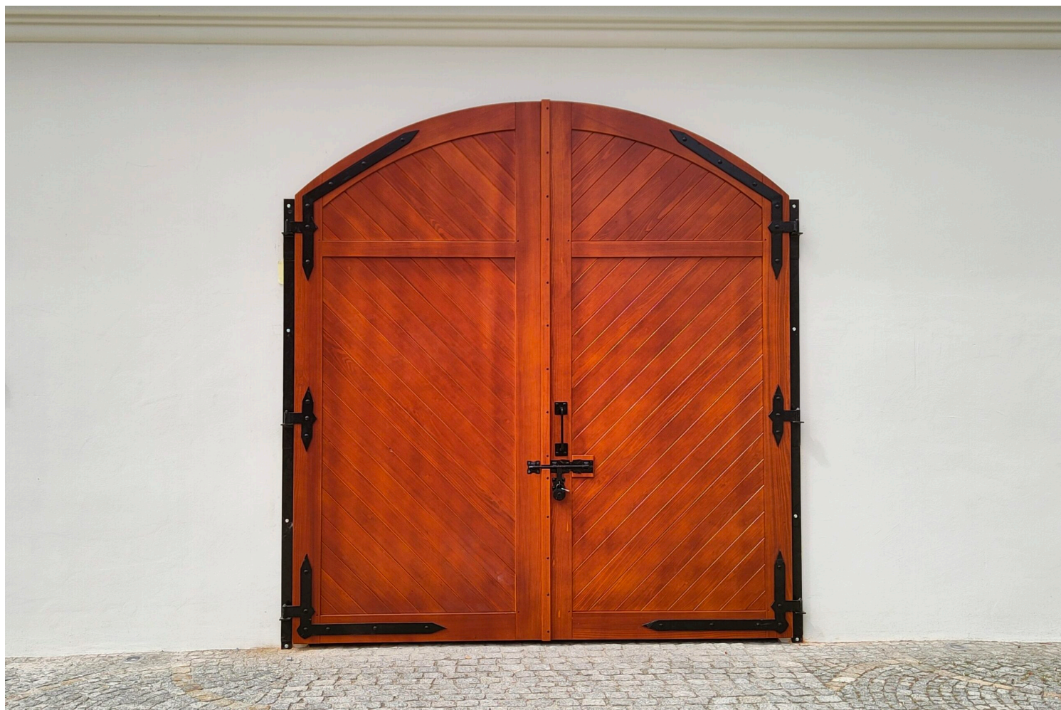
Nowa Sól, magazyn solny, fot. NID/K. Słowiński