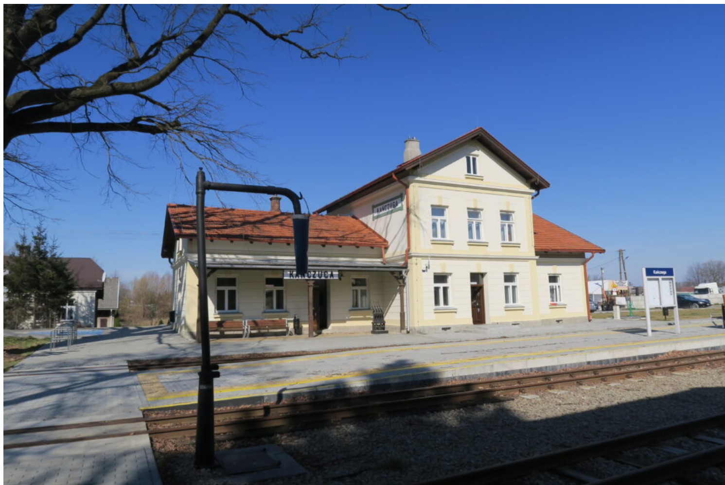
Kańczuga, zespół stacji, fot. NID/A. Kušta