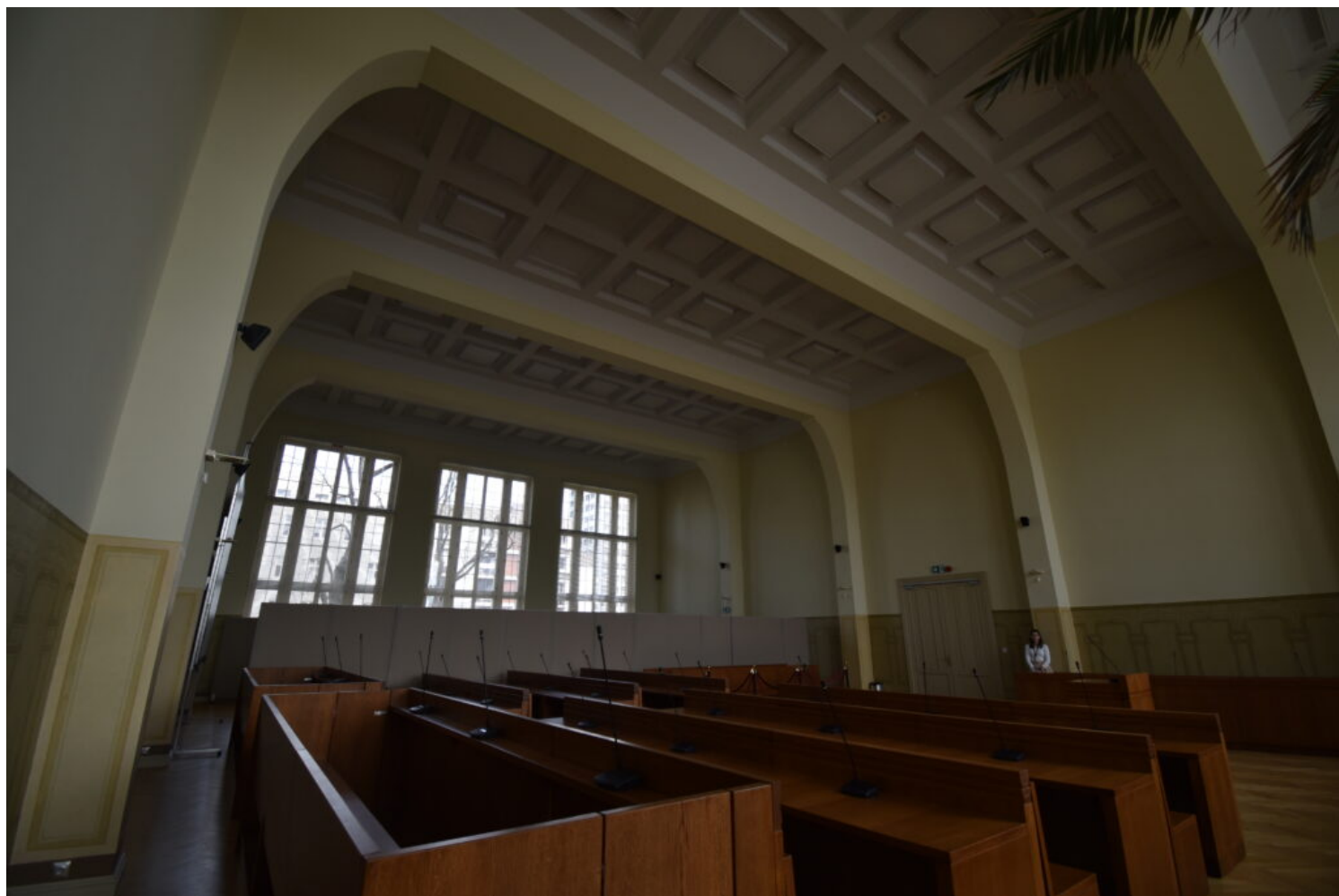
Łódź, gimnazjum, ob. Sąd Apelacyjny