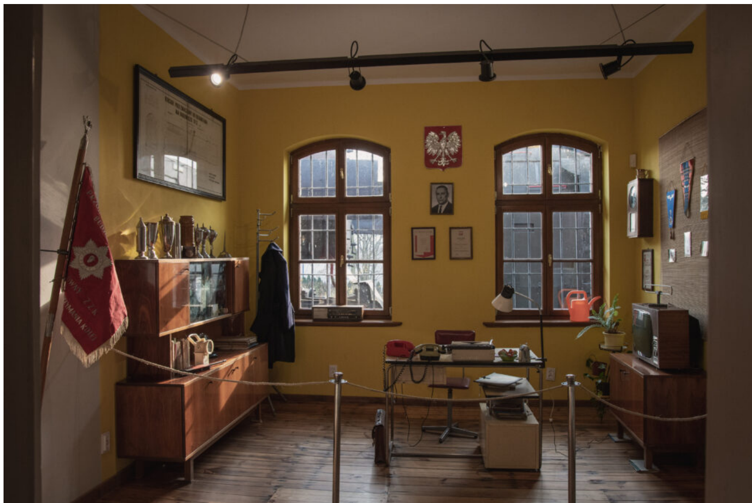
Muzeum Kolejnictwa, fot_ Joanna Witek