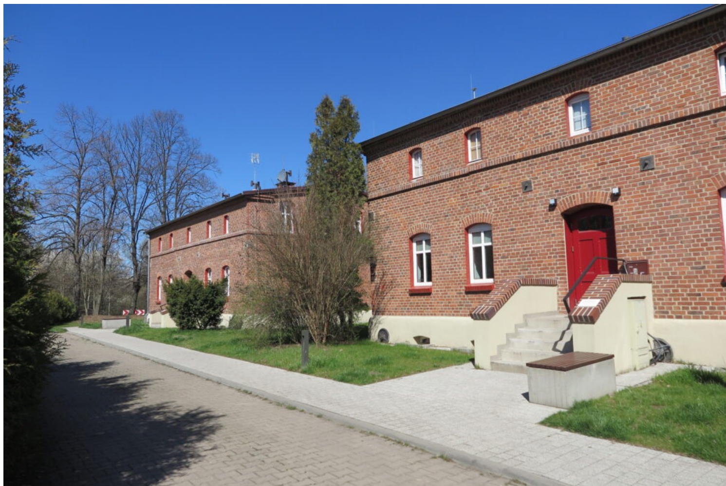
Bytom, Kolonia Zgorzelec