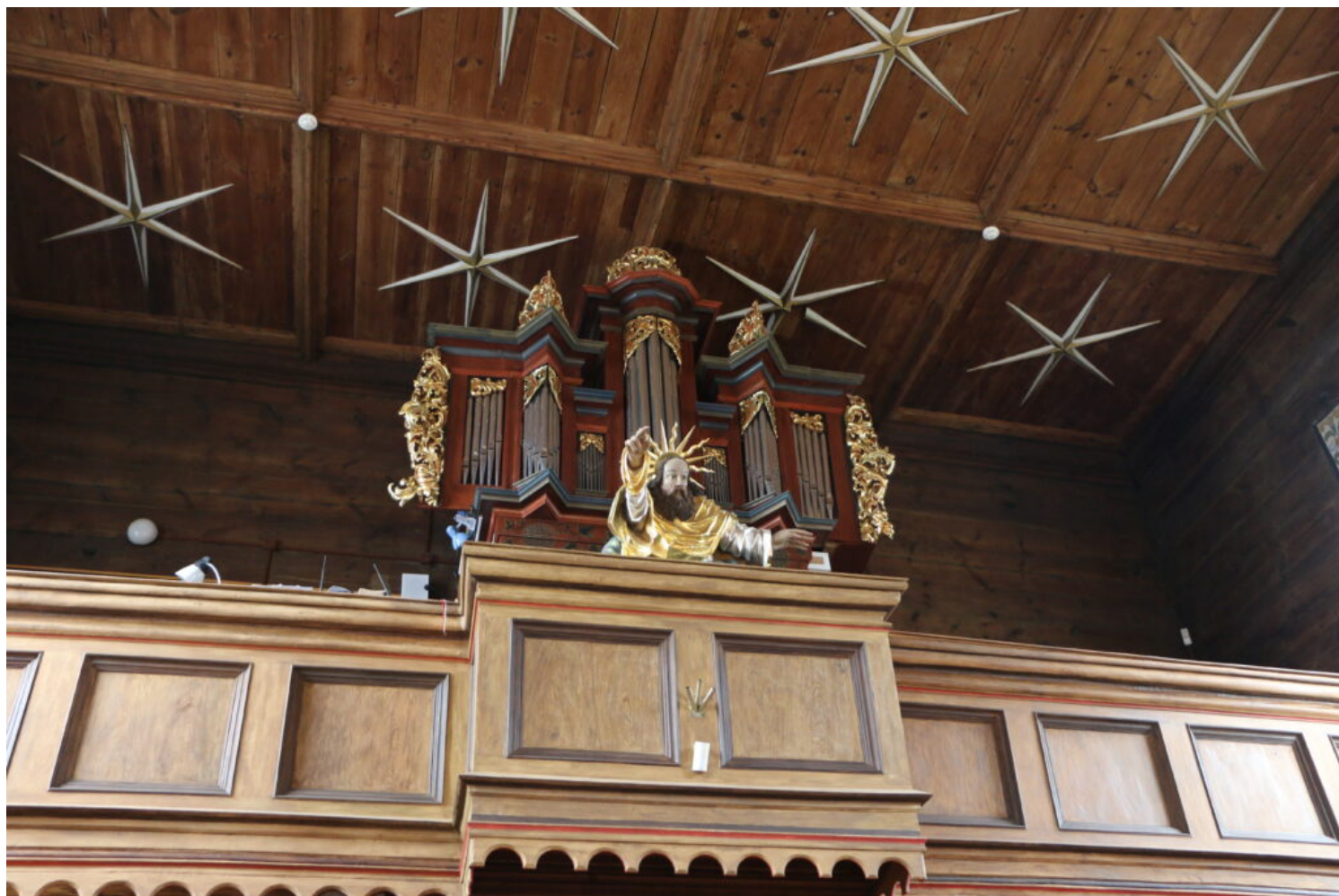
Oporowo, kościół