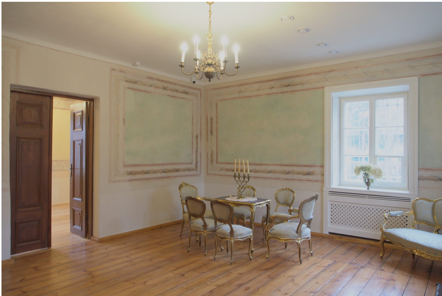
Piaseczno, Poniatówka