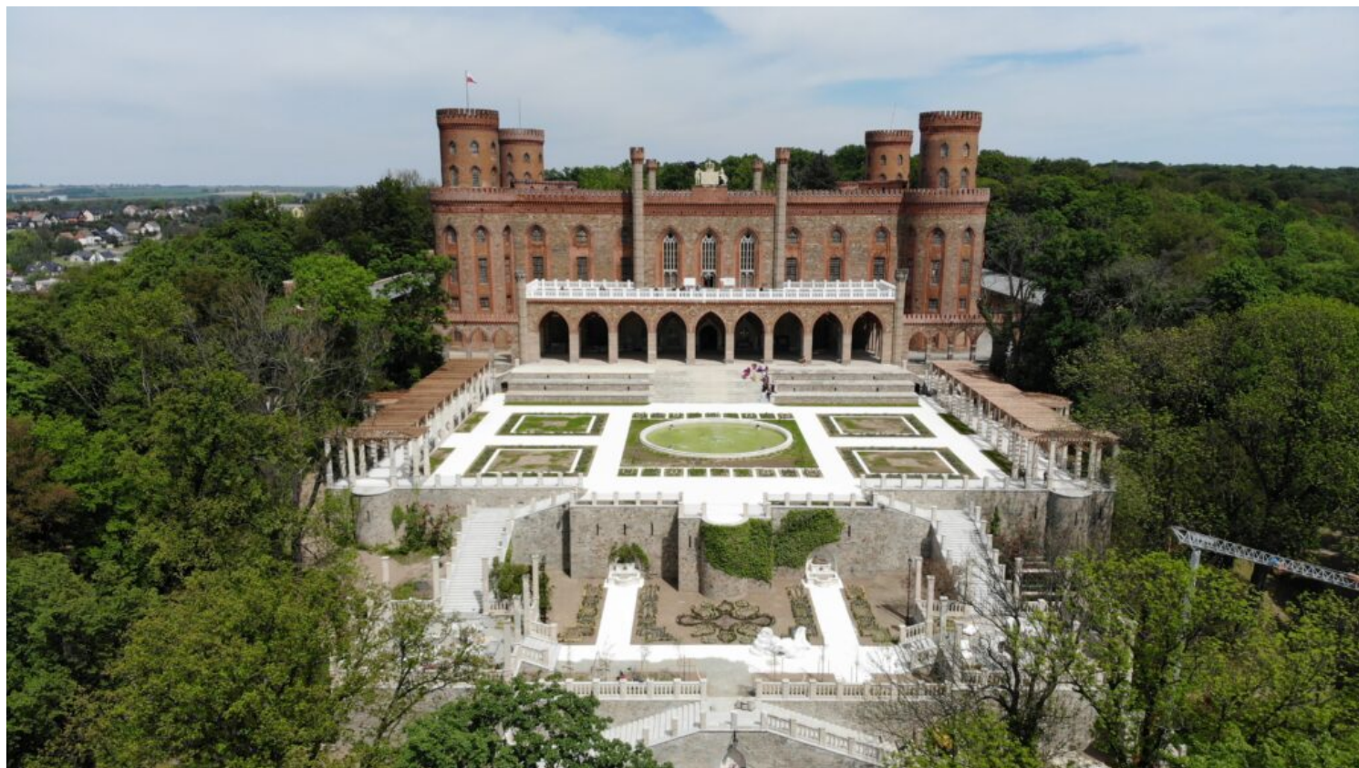
Kamieniec Żąbkowicki - ogrody

Pałac w Kamieńcu Żąbkowickim wzniesiono wg projektu Karla Friedricha Schinkla dla księcia Albrechta Pruskiego i jego żony księżniczki Marianny Orańskiej, inicjatorki budowy rezydencji. Równocześnie z położeniem w 1838 roku kamienia węgielnego rozpoczęto formowanie rozległego parku krajobrazowego ze zwierzyńcem. W 1859 roku rozpoczęto budowę wielopoziomowych tarasów ogrodowych z licznym elementami architektury ogrodowej i układem wodnym basenów i fontann. Całość prac zakończono w 1872 roku.