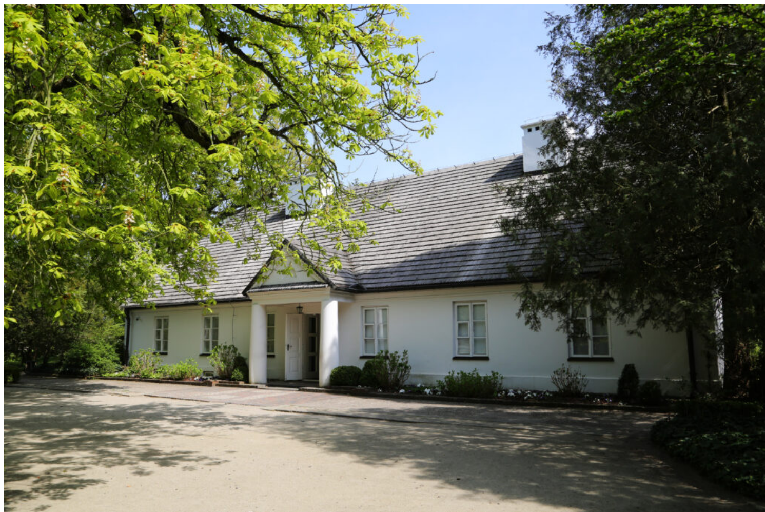
Żelazowa Wola, Dom Chopina, fot. NID/P.Kobek