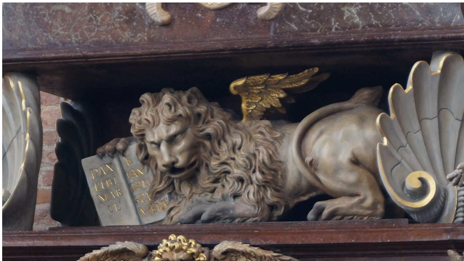
Gdańsk, kościół św. Jana, fot. NCK/Iwona Berent