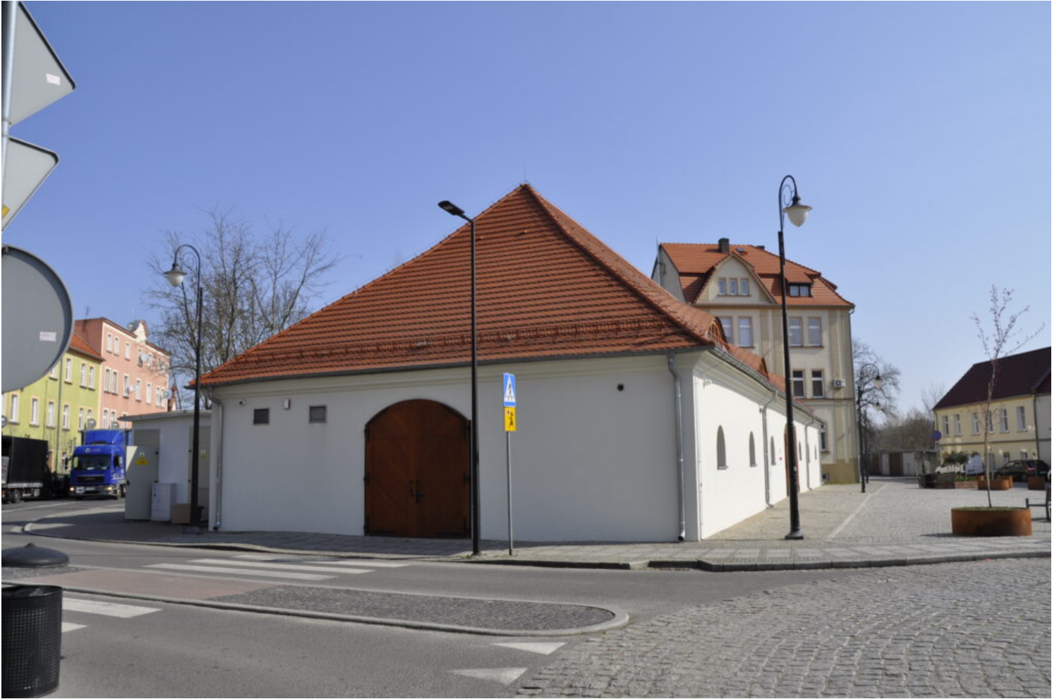
Nowa Sól, magazyn solny