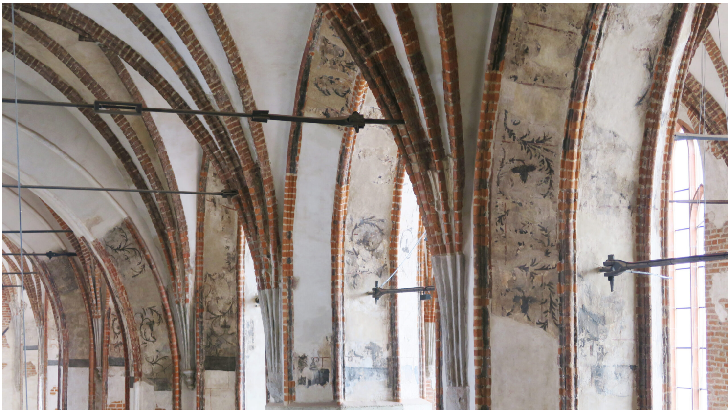
Gdańsk, kościół św. Jana, fot. NID/T. Błyszkosz