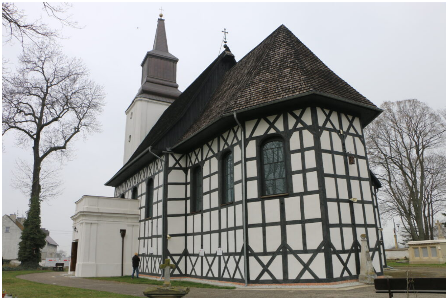
Oporowo, kościół