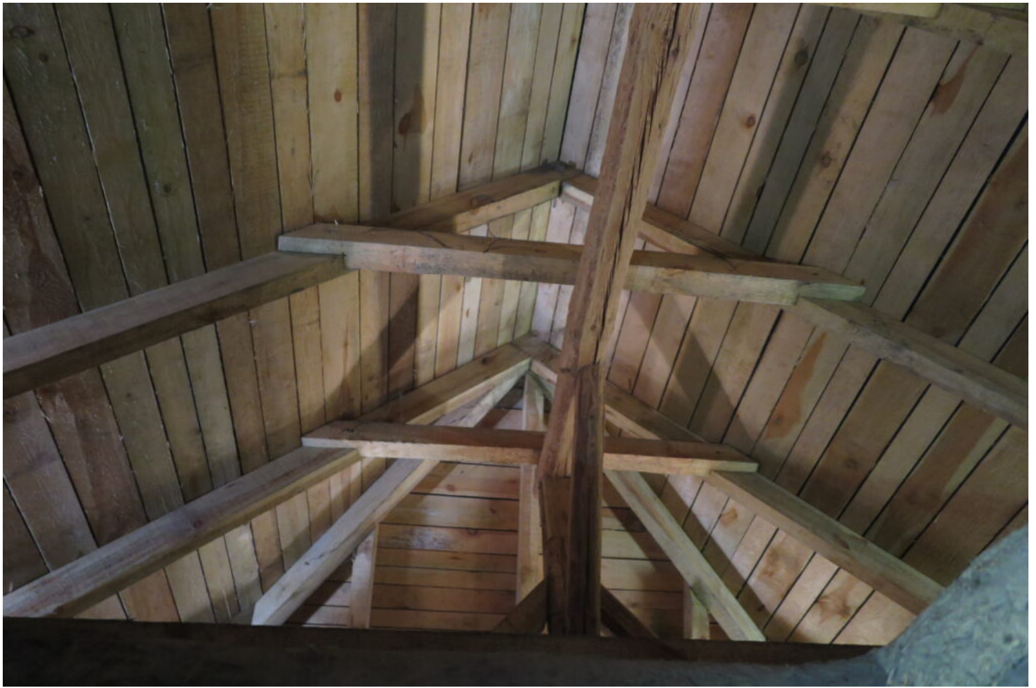
Racibórz-Sudół, spichlerz