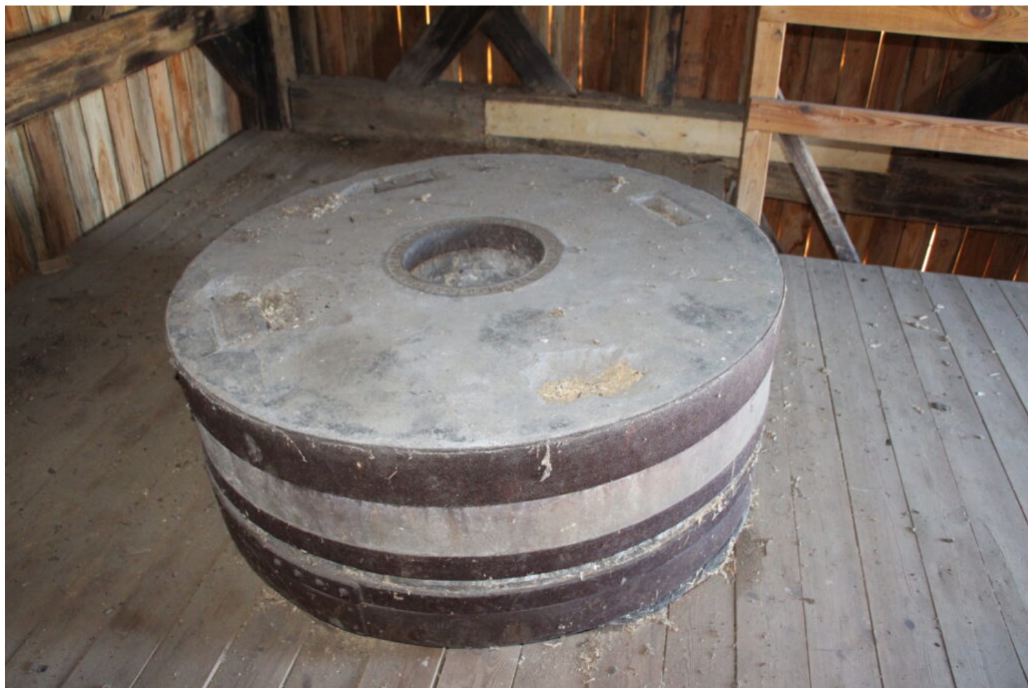
Lubięcín, wiatrak