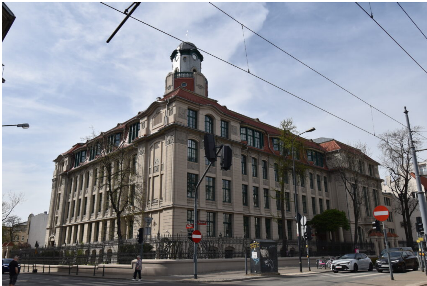
Łódź, gimnazjum, ob. Sąd Apelacyjny