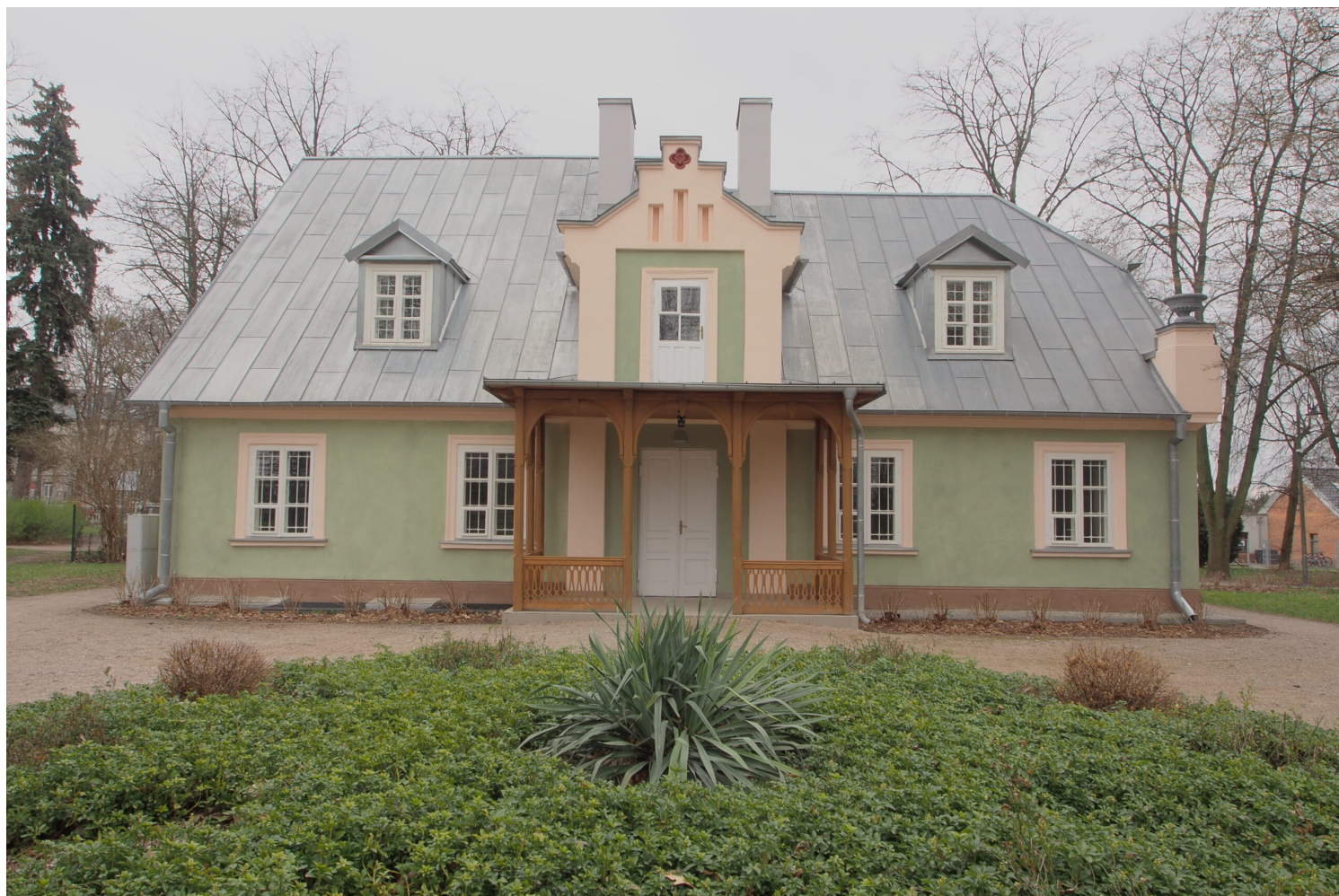
Piaseczno, Poniatówka, fot. NID/Z. Rejewska