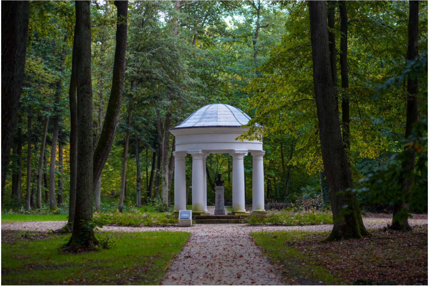
Pokój - park