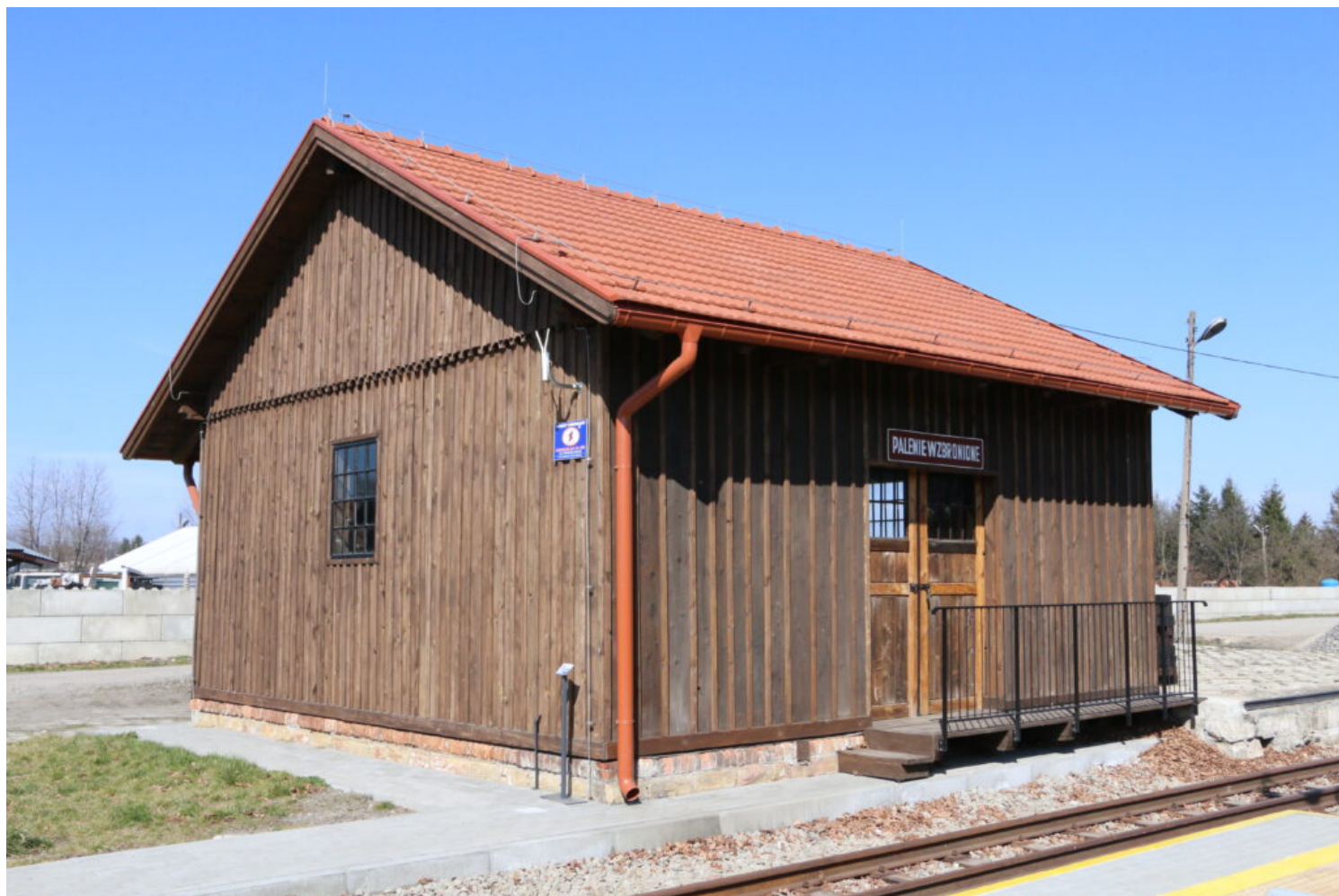
Kańczuga, zespół stacji