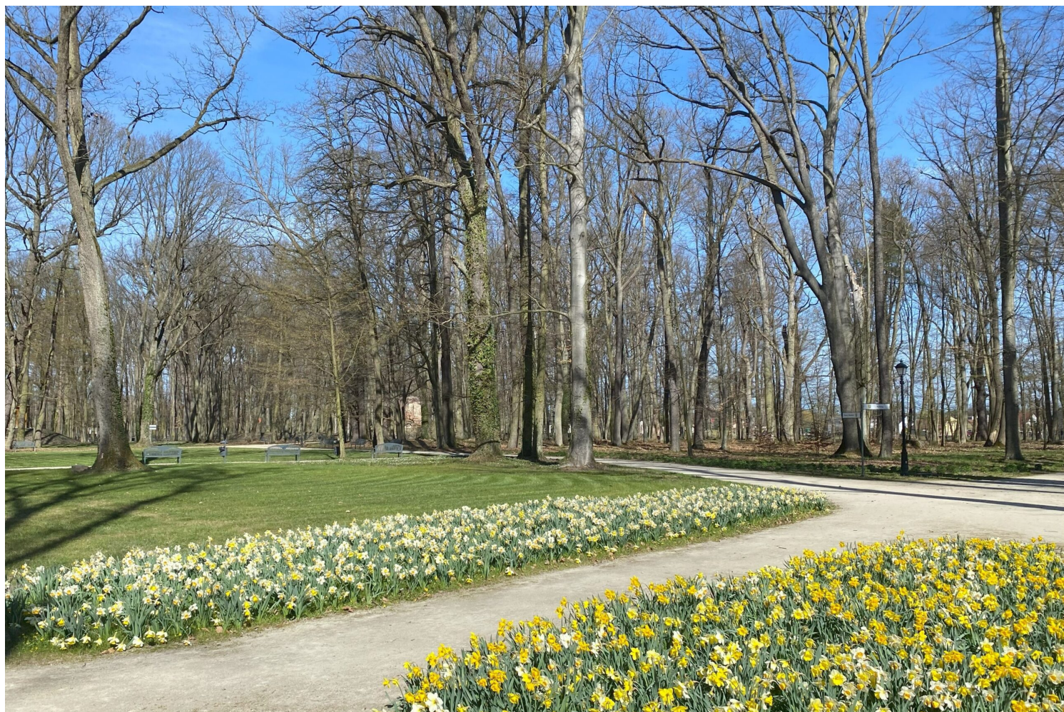
Pokój - park