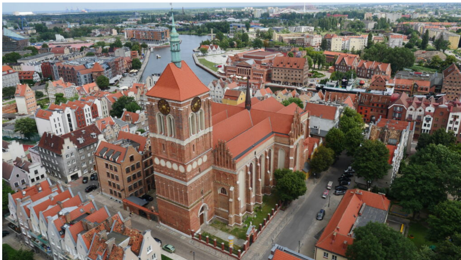
Gdańsk, kościół św. Jana