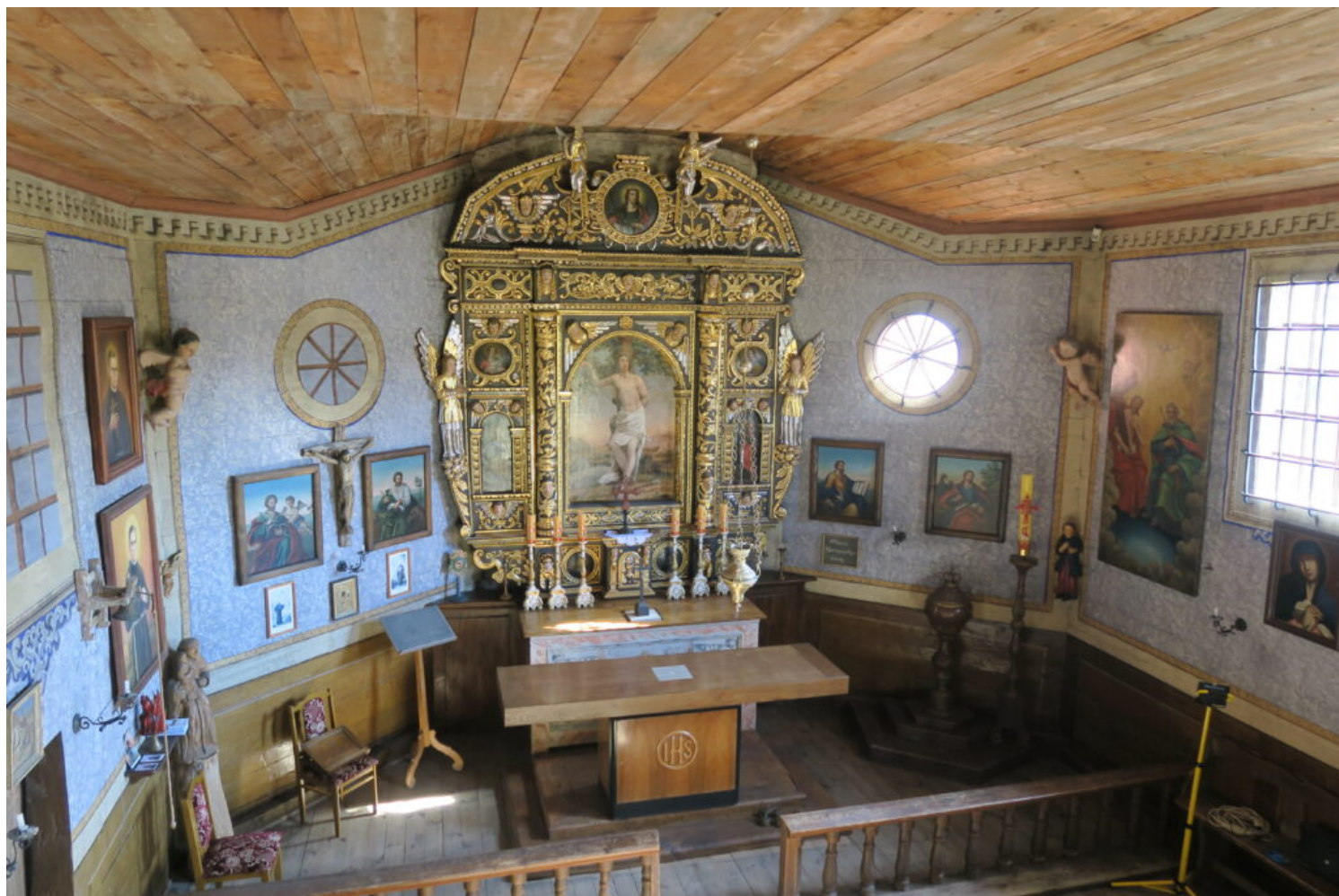
Kosina, kościół filialny, fot. NID/A. Fortuna-Marek