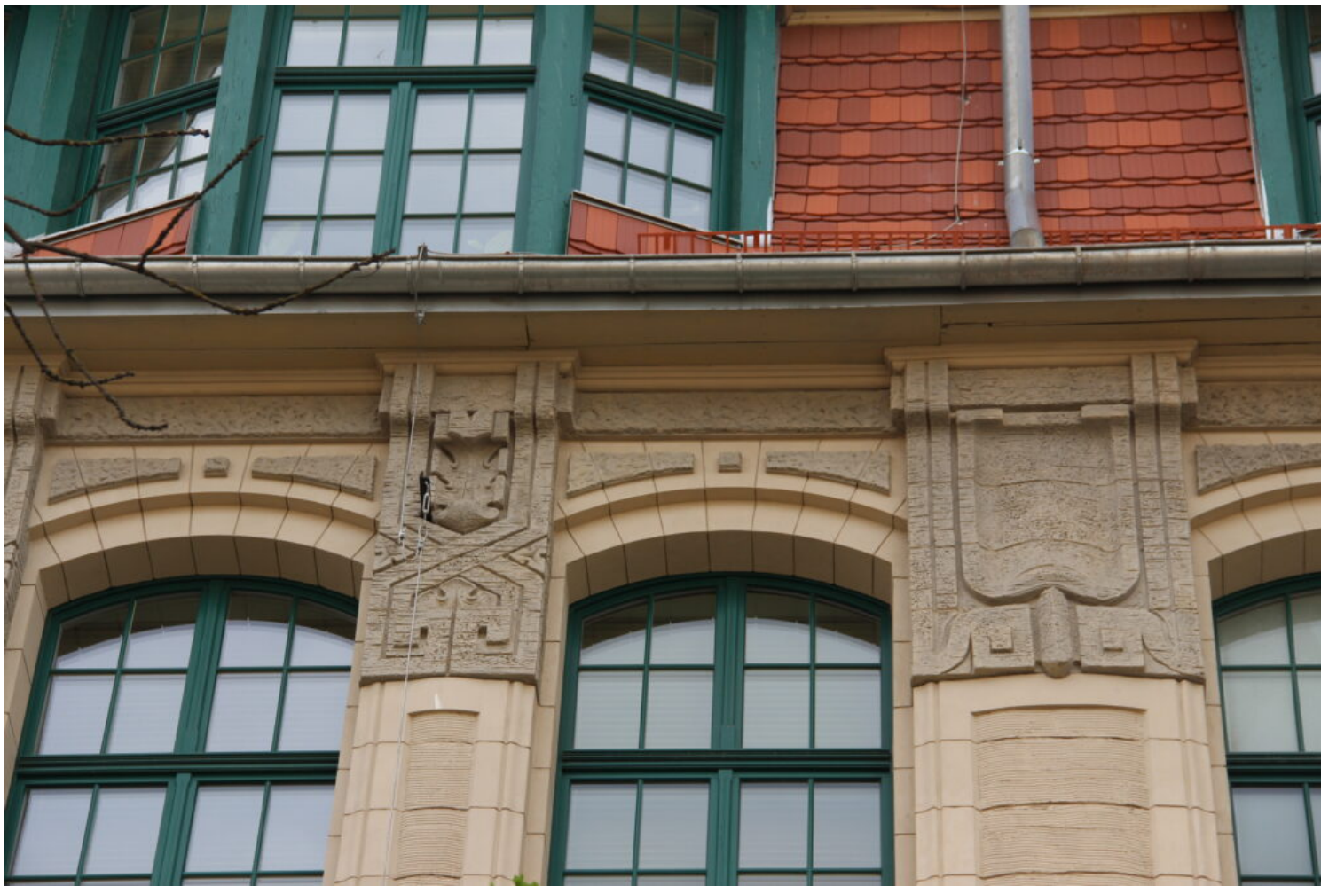
Łódź, gimnazjum, ob. Sąd Apelacyjny