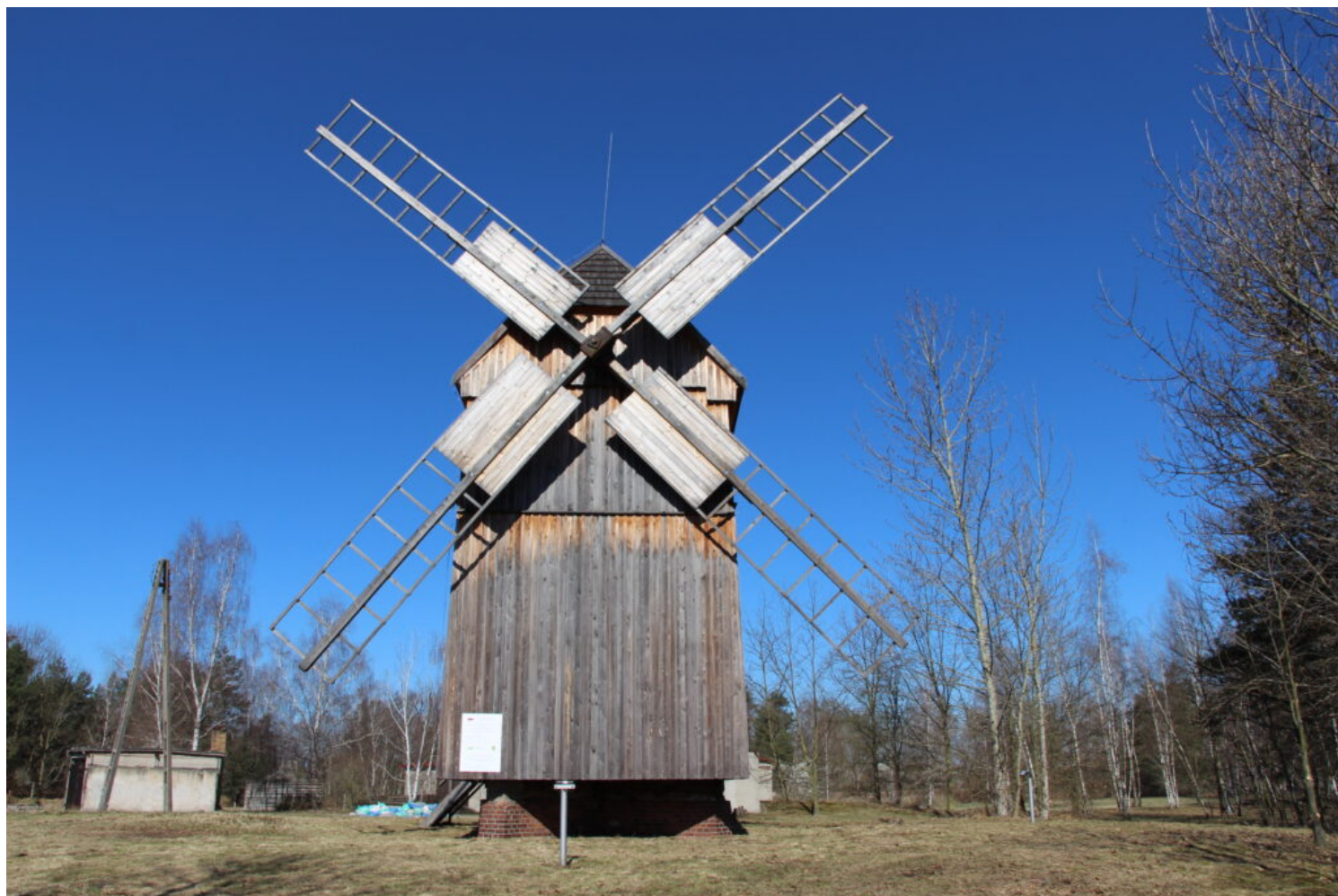
Lubięcín, wiatrak