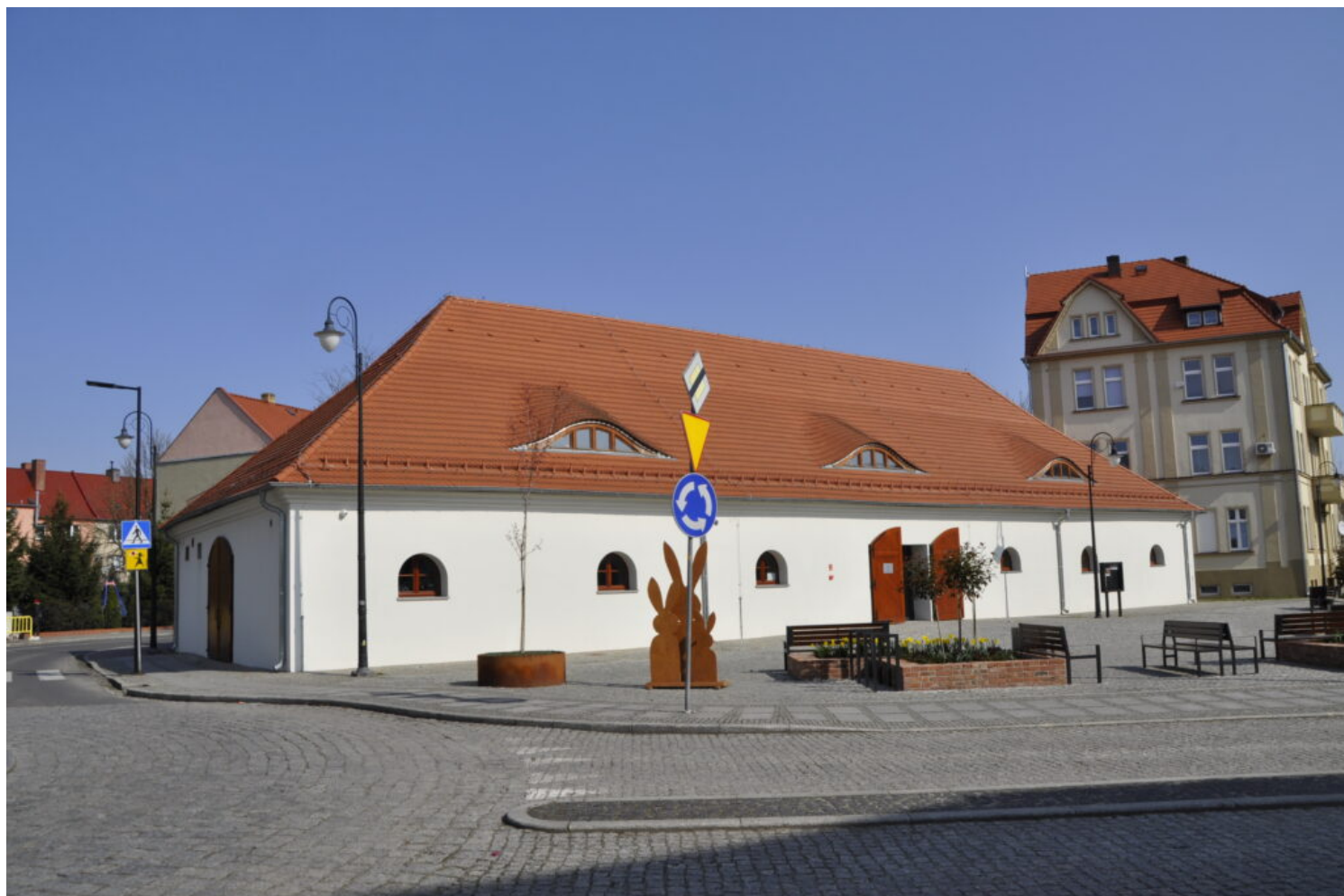
Nowa Sól, magazyn solny