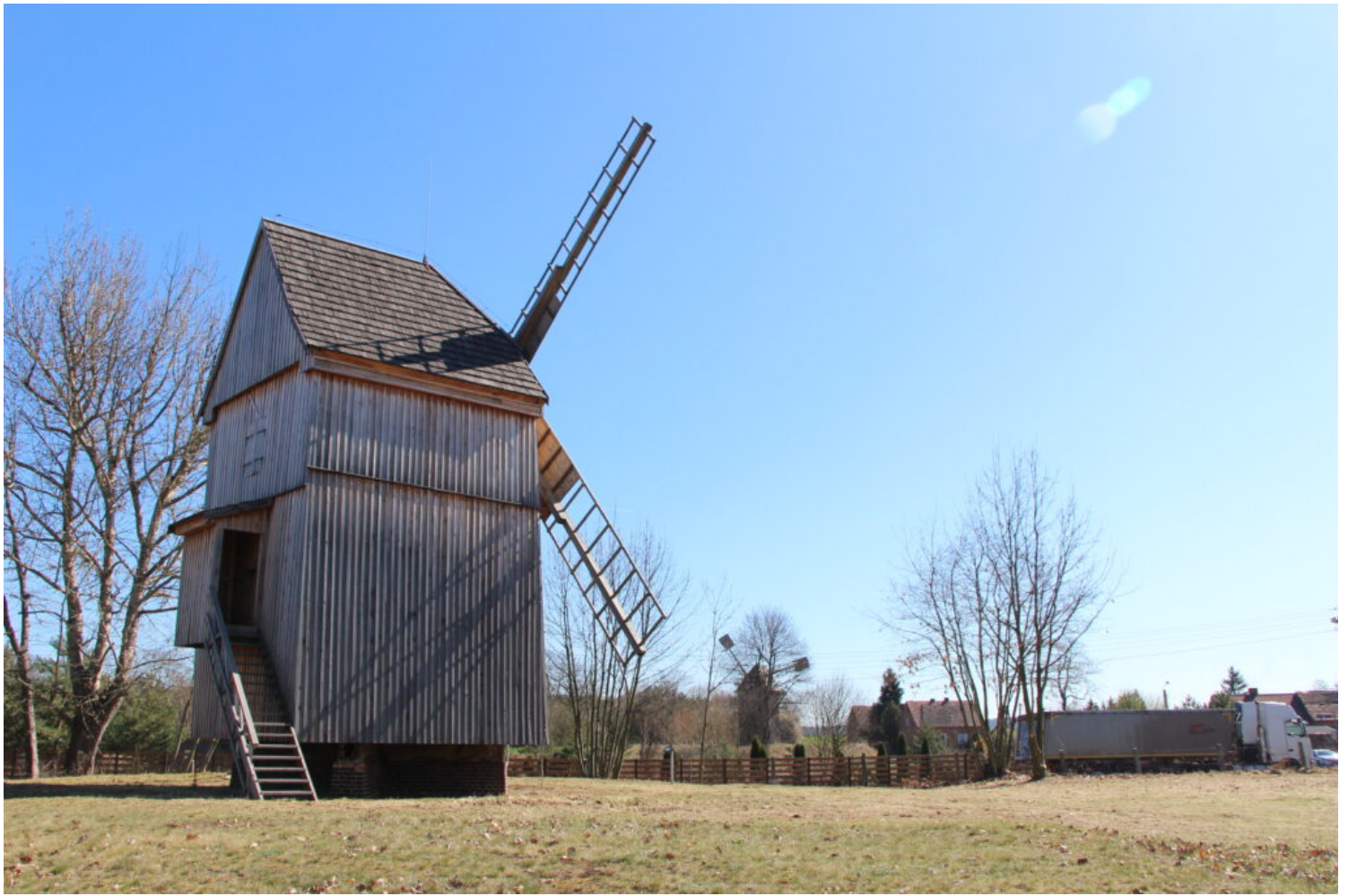
Lubięcín, wiatrak, fot. NID/M. Kłaczowska