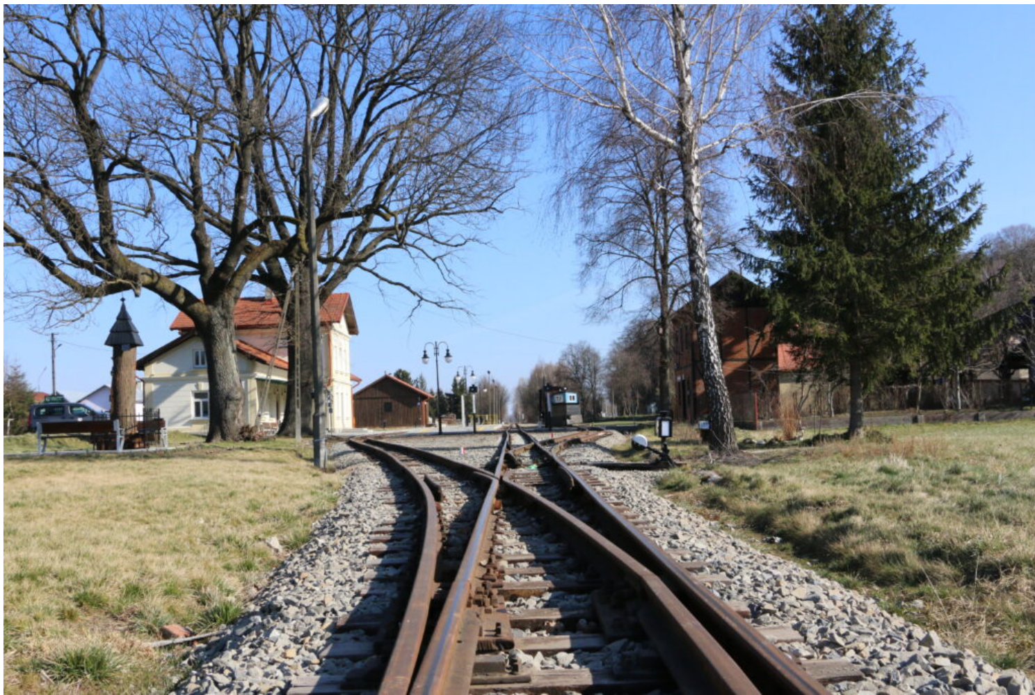
Kańczuga, zespół stacji