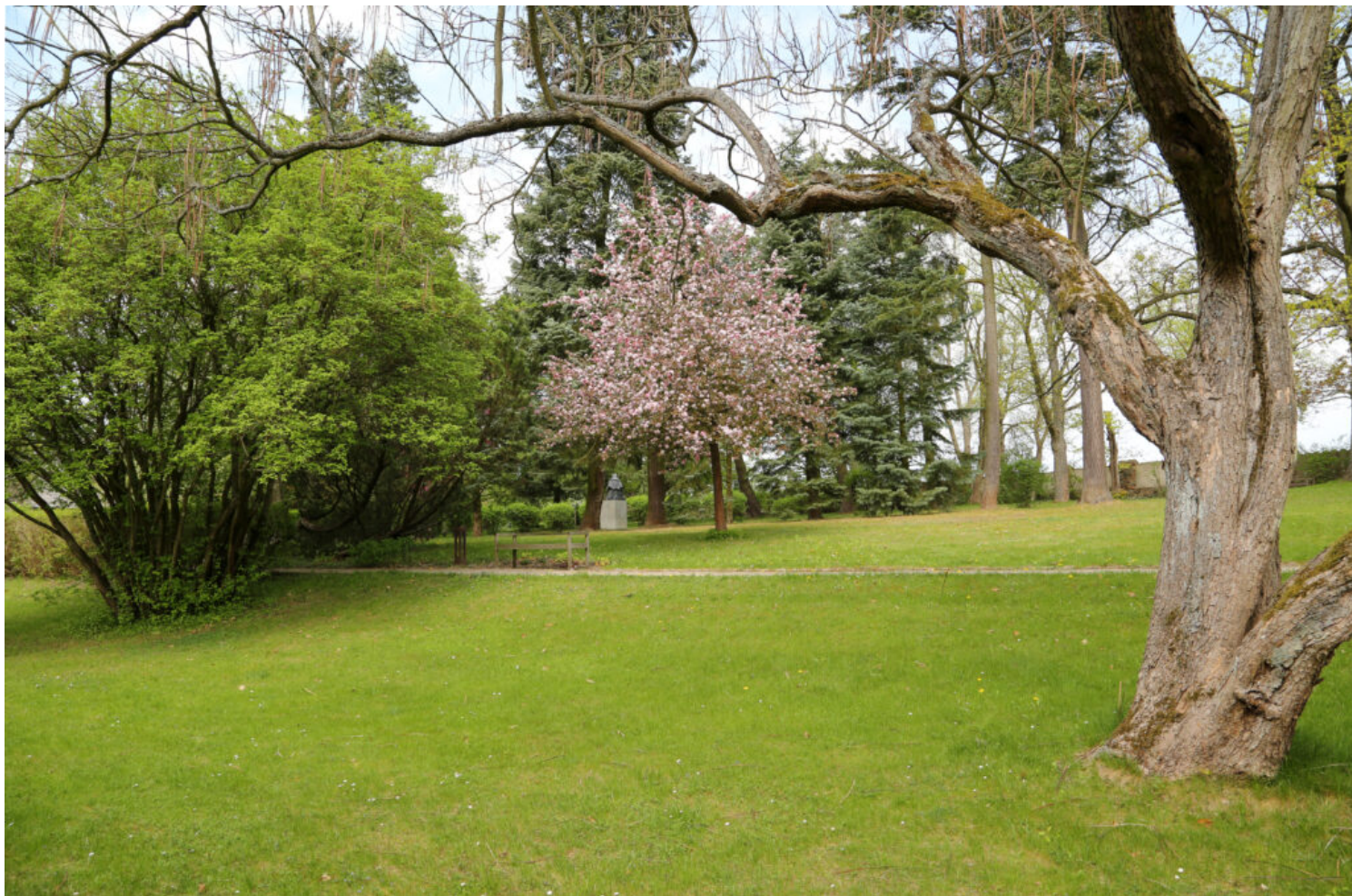
Żelazowa Wola, Dom Chopina