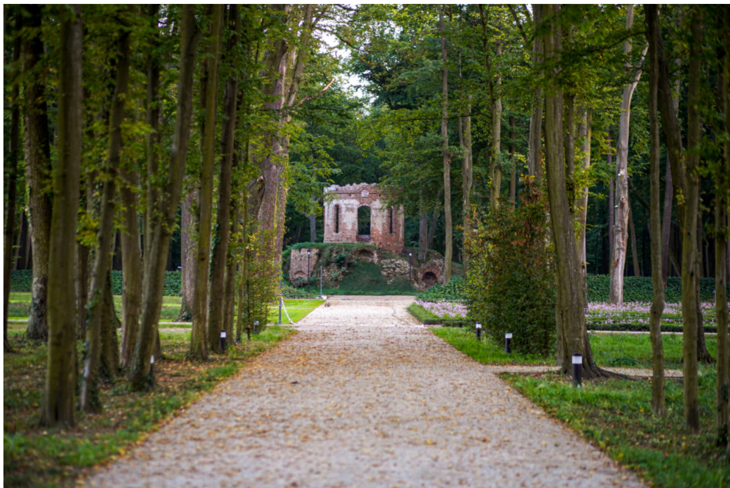
Pokój - park