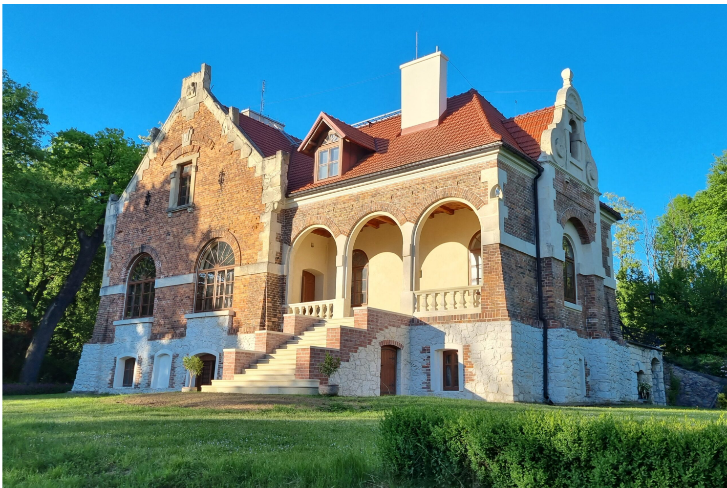
Michałowice, zespół dworsko-parkowy, fot. Monika Biernacka-Lorenz