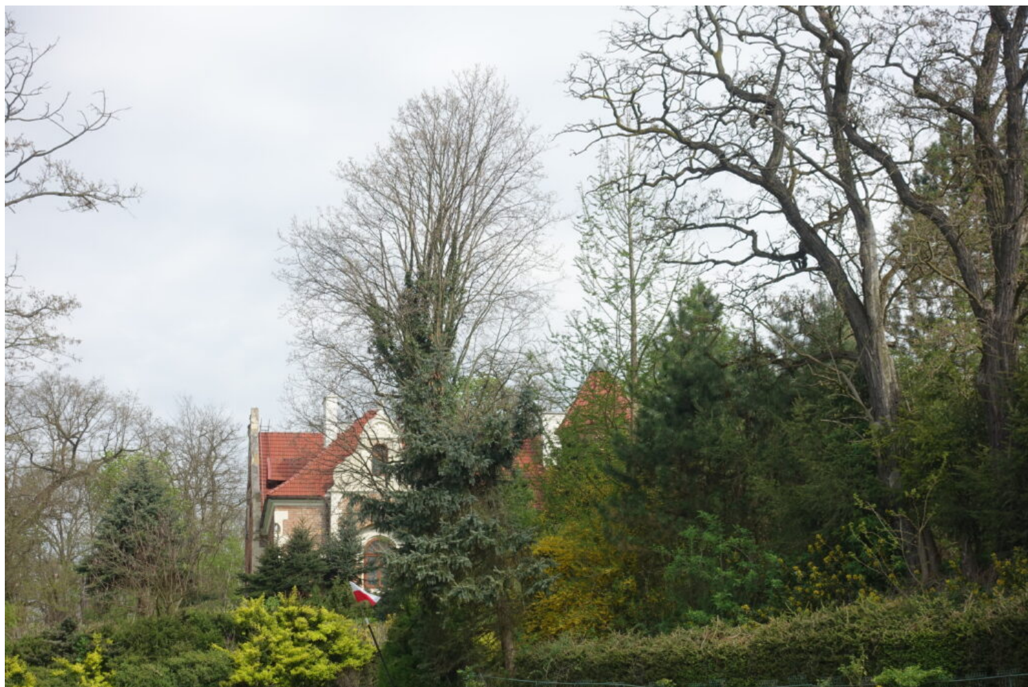
Michałowice, zespół dworsko-parkowy