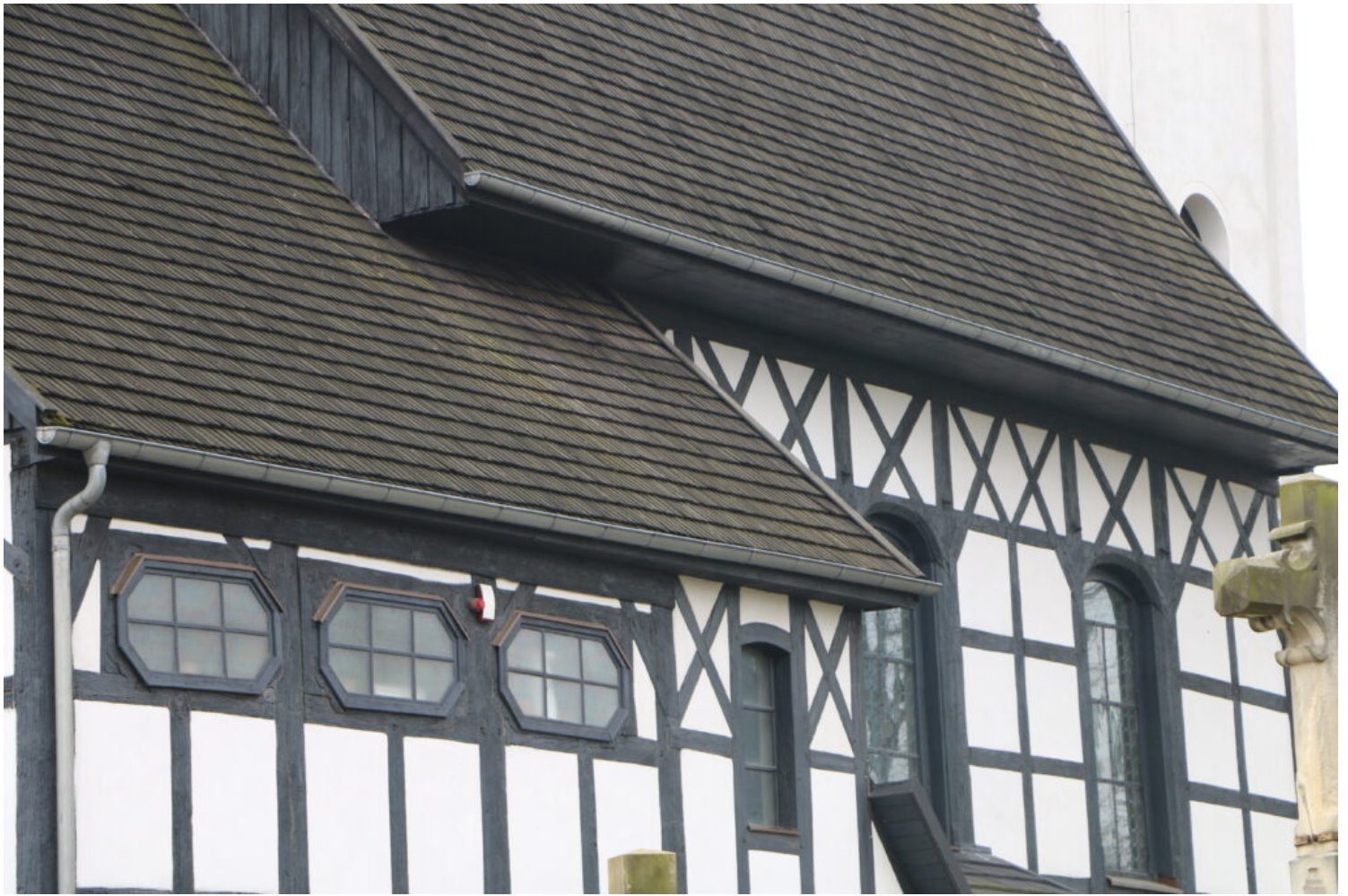
Oporowo, kościół