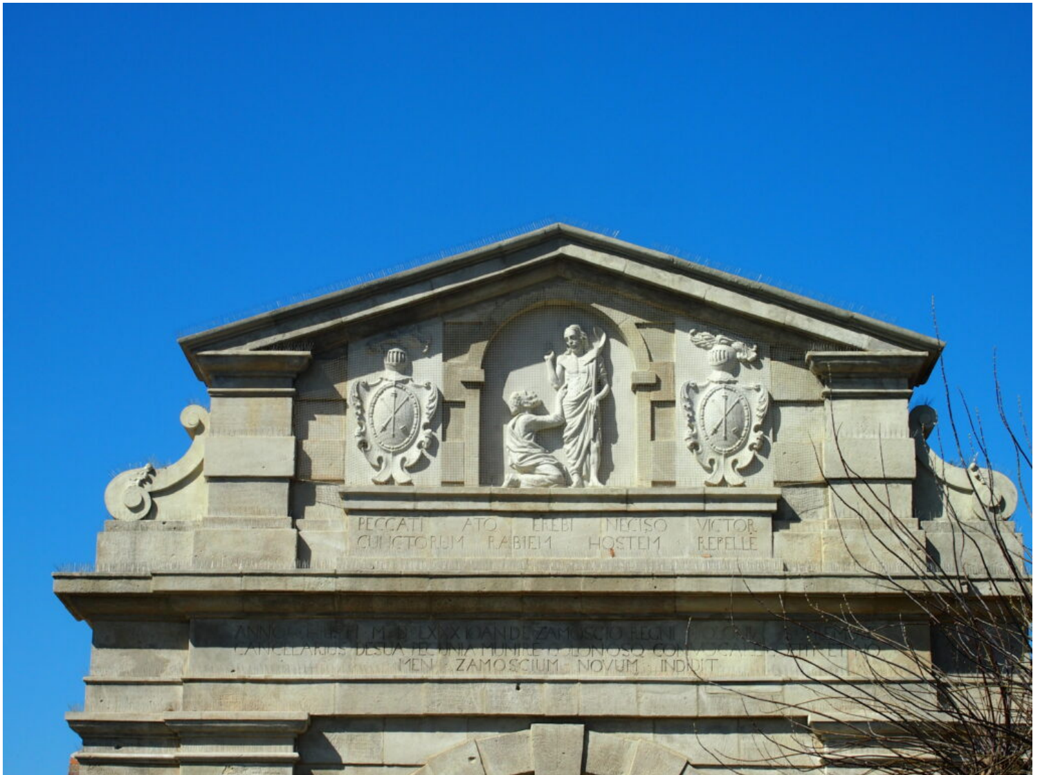
Zamość, Brama Lwowska Stara