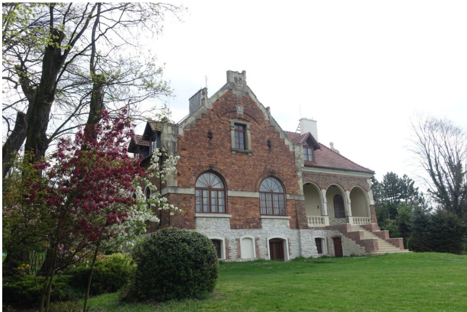
Michałowice, zespół dworsko-parkowy, fot. NID/M. Machynia