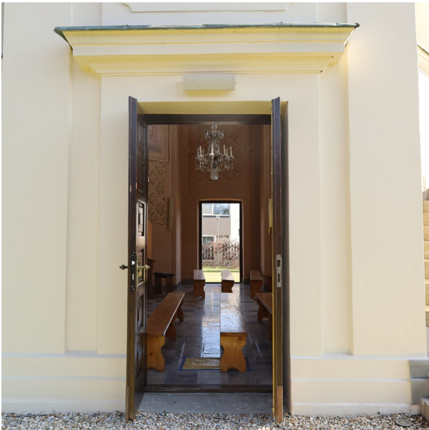
Rzeszów - Kaplica św. Huberta

Kategoria rewitalizacji przestrzeni kulturowej i krajobrazu (w tym założenia dworskie i pałacowe)