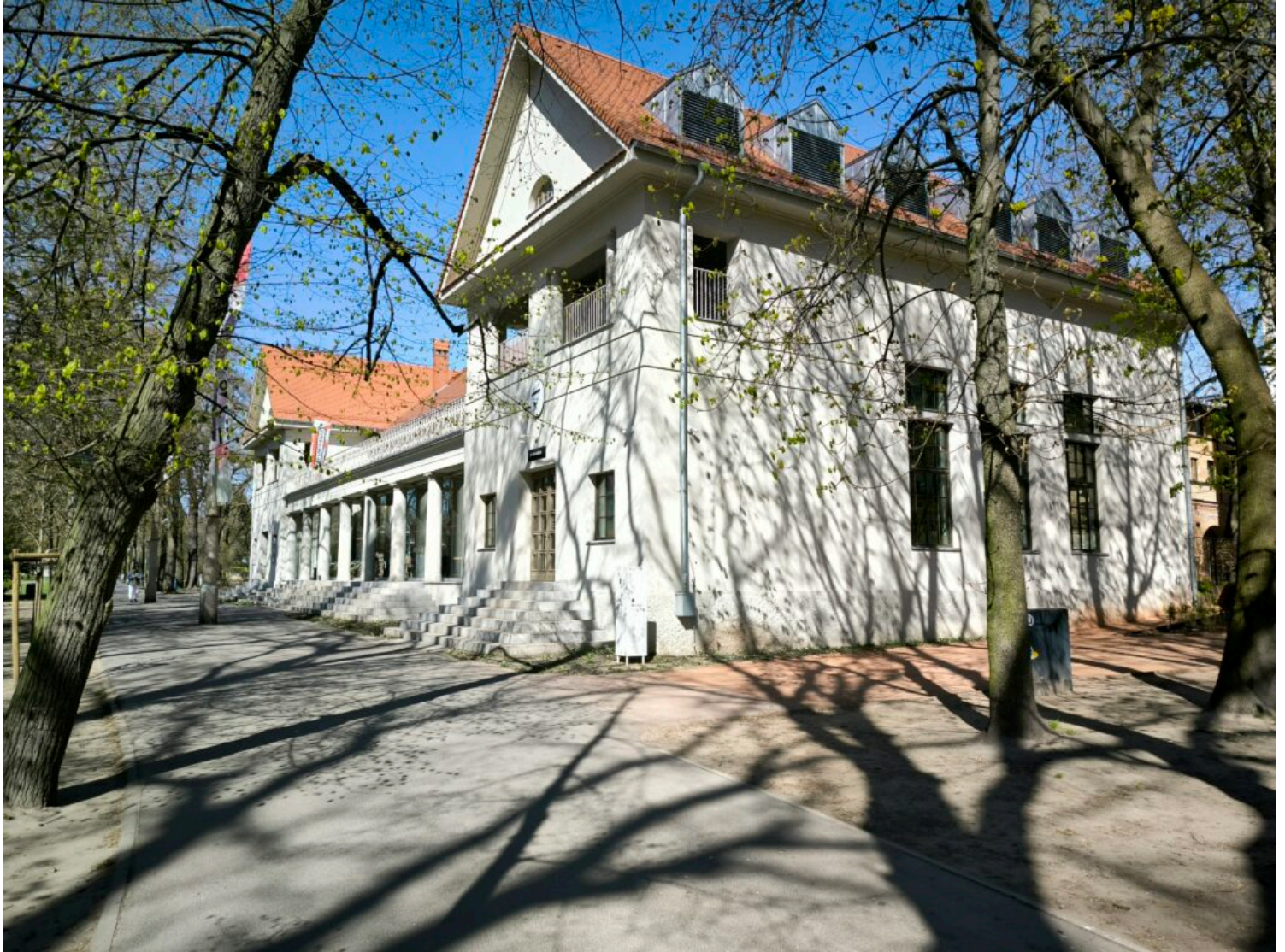
Poznań, pawilon wystawowy

Budynek Hali Betonowej tzw. Betonhaus powstał jako pawilon wystawowy na Wschodnioniemiecką Wystawę Przemysłu, Rzemiosła i Rolnictwa w 1911 roku. Zaprojektowany przez architektów Klotha i Schneidera należy do pionierskich budowli wykonanych w nowatorskiej technologii z żelbetonu. W 1930 roku budynek został przekształcony na sale gimnastyczne dla Uniwersytetu Poznańskiego. Do 2013 roku użytkowany był przez AWF.