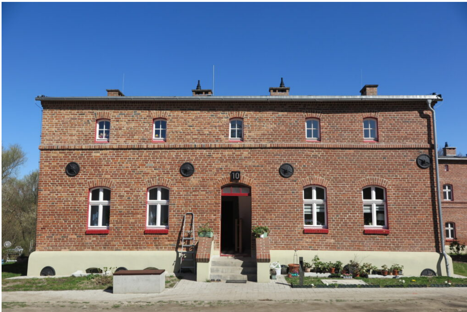
Bytom, Kolonia Zgorzelec