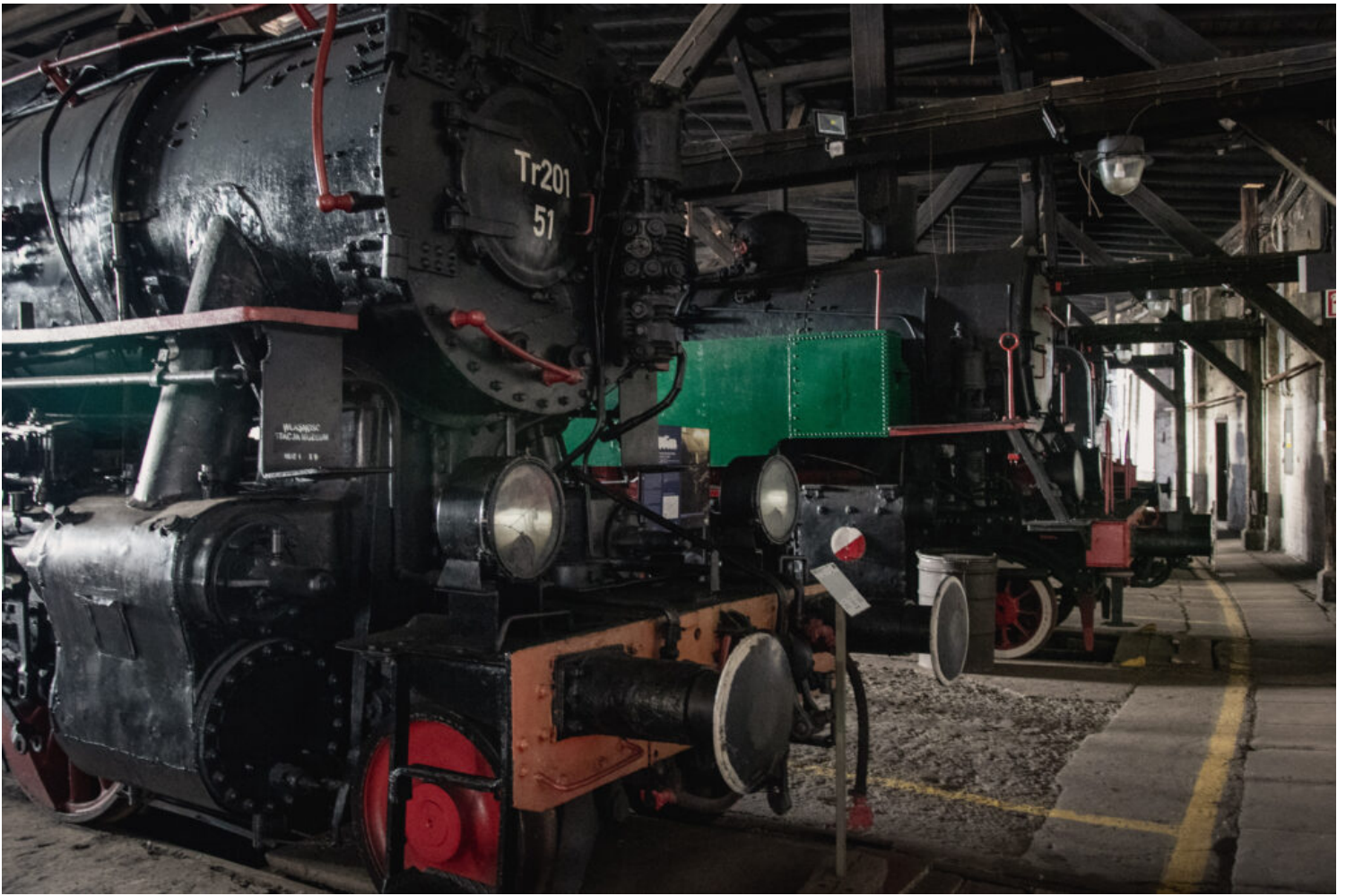
Jaworzyna, Muzeum Kolejnictwa