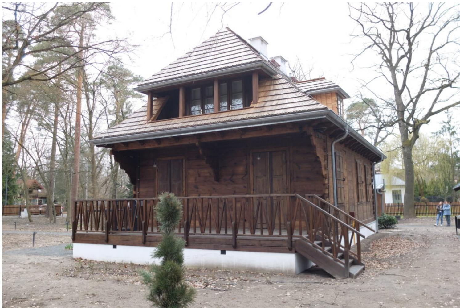
Piaseczno, Dom Zośki, fot. NID/M. Warchoł