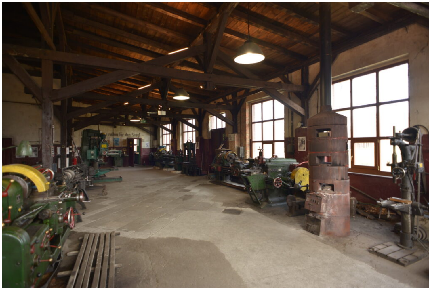
Muzeum Kolejnictwa, fot. NID/K. Czartoryski