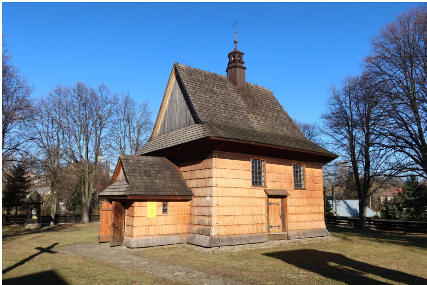
Kosina, kościół filialny, fot. WUOZ Rzeszów/Bartosz Podubny.