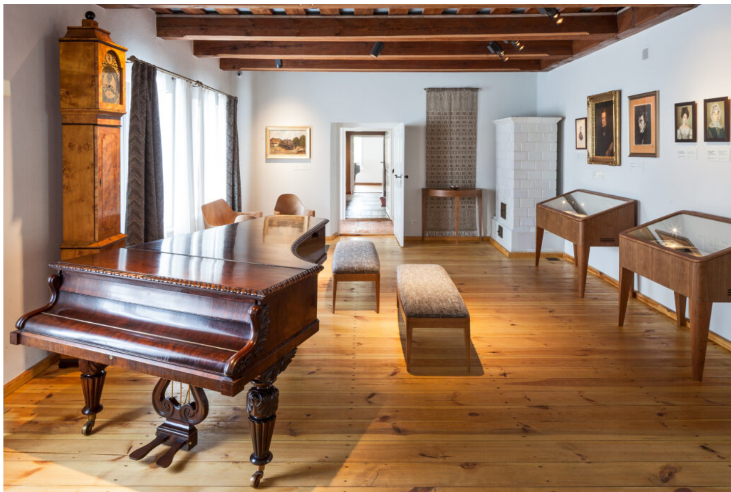
Żelazowa Wola, Dom Chopina, fot. NIFC/M. Czechowicz