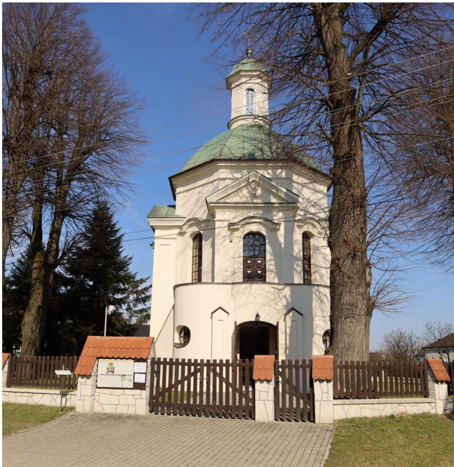
Rzeszów - Kaplica św. Huberta