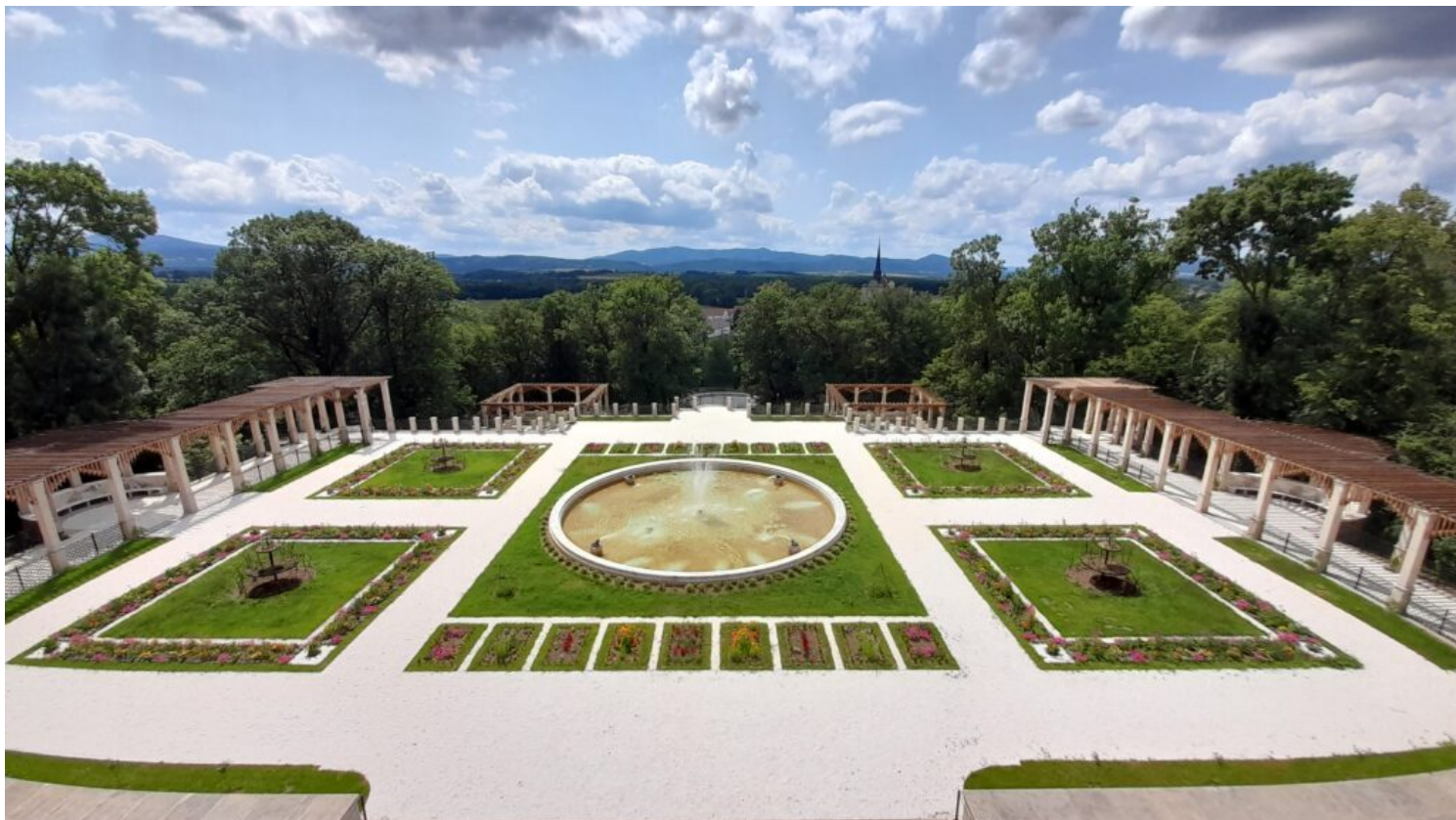
Kamieniec Ząbkowicki - ogrody, fot. Archiwum Creoproject Sp. z o.o.