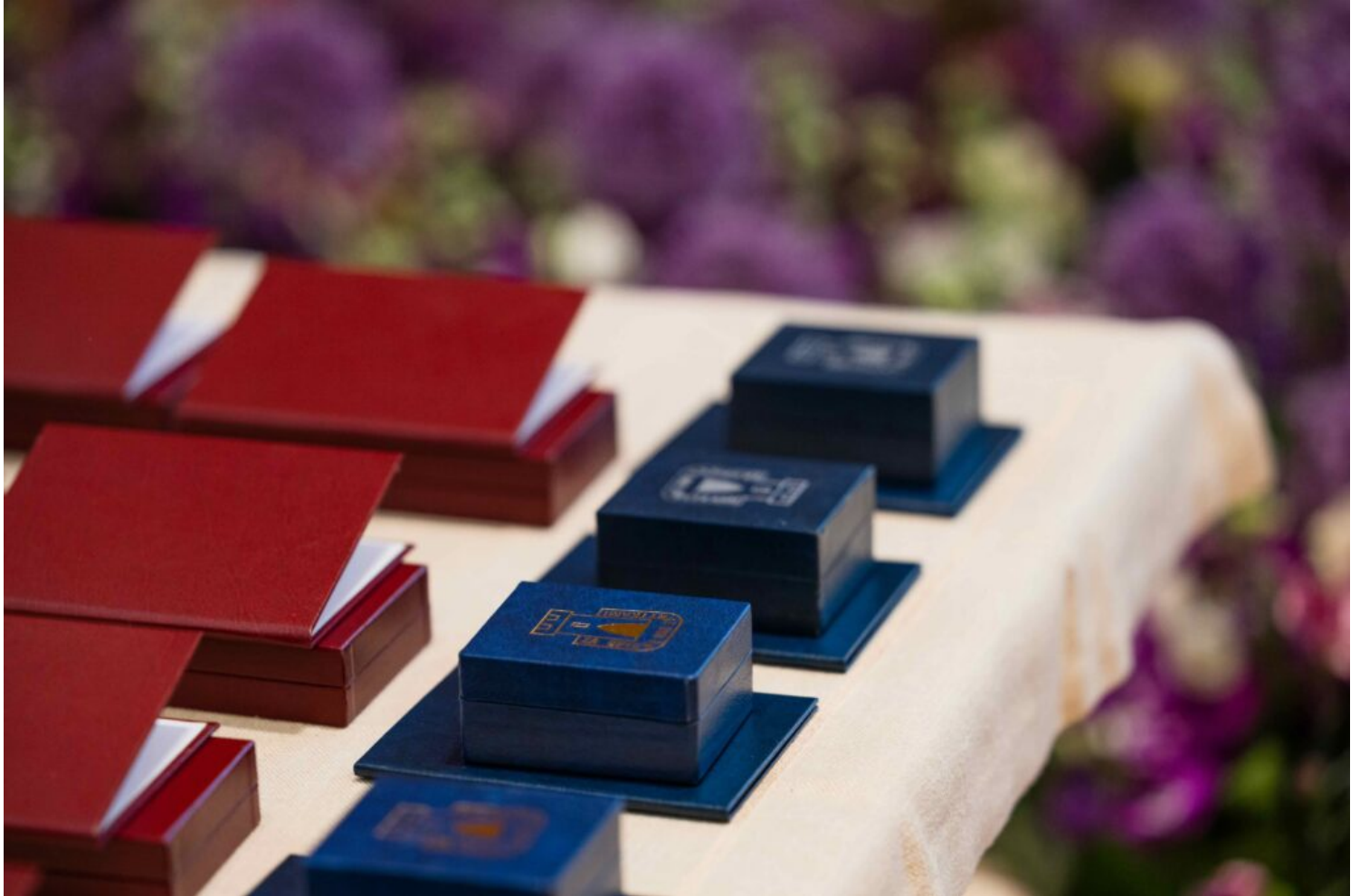
Odnaczenia wręczone na gali z okazji 20-lecia wpisu Parku Mużakowskiego na Listę światowego dziedzictwa UNESCO

Gala była okazją do wręczenia nagród osobom zasłużonym dla kultury i dziedzictwa, w tym zaangażowanym w ochronę Parku zarówno po stronie polskiej, jak i niemieckiej. Odnaznę honorową „Zasłużony dla Kultury Polskiej” otrzymali: