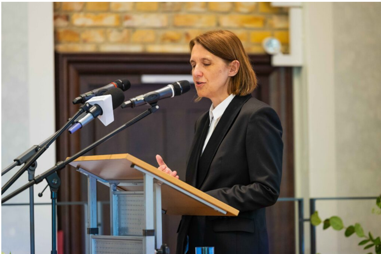
Przemówienie ministry kultury i dziedzictwa narodowego Hanny Wróblewskiej

– mówiła Hanna Wróblewska, ministra kultury i dziedzictwa narodowego.