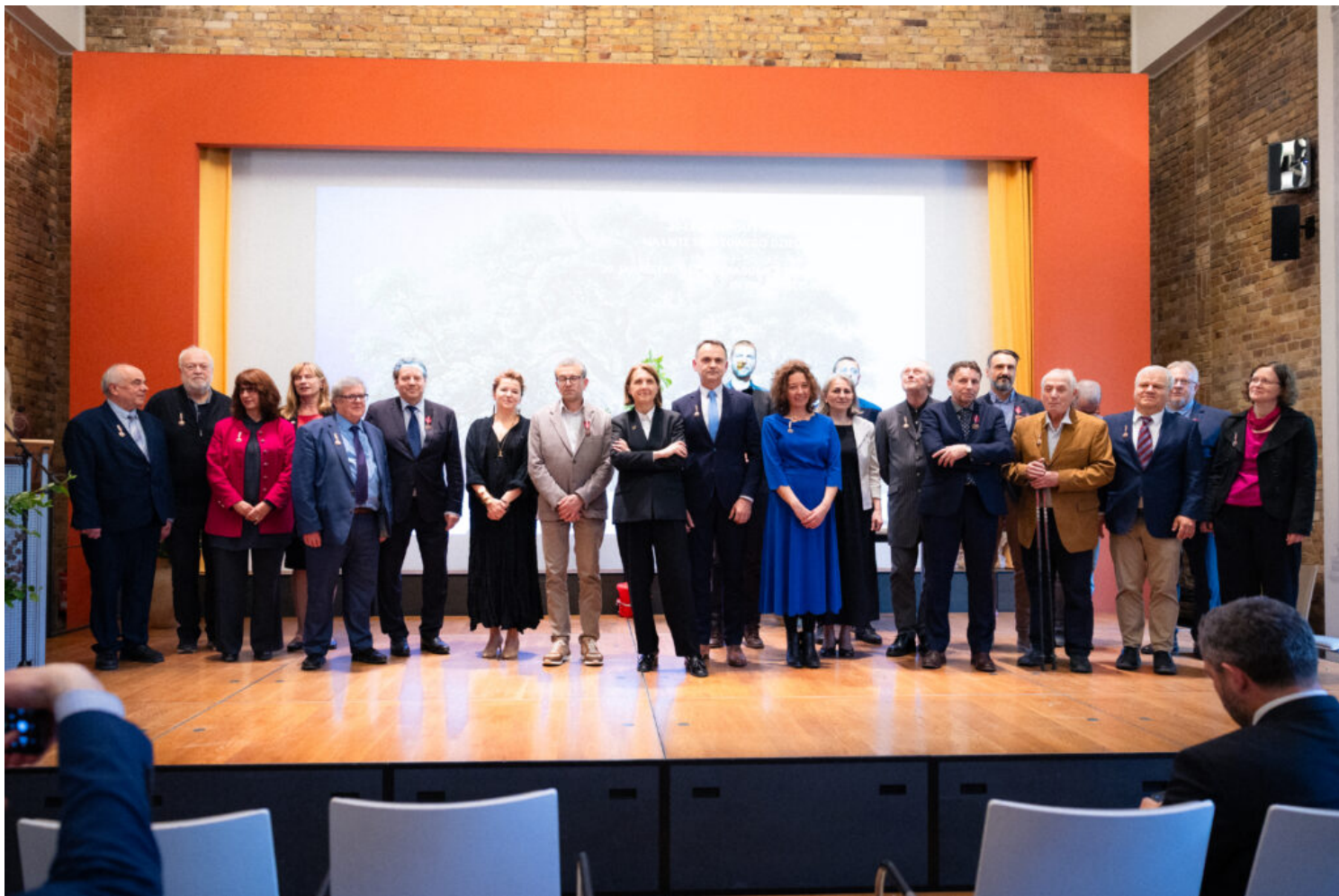
osoby odznaczone

Uroczystości zakończył koncert Drezdeńskiej Orkiestry Rezydencyjnej (Dresdner Residenz Orchester). W programie znalazły się „Masterpieces of Classic” – arcydzieła największych kompozytorów, takich jak Wolfgang Amadeus Mozart czy Ludwig van Beethoven, a także mistrzów włoskiej opery – Giacomo Puccini i Pietro Mascagni. Publiczność usłyszała zarówno utwory symfoniczne, jak i arie operowe w wykonaniu solistki – sopranistki, której głos dopełnił brzmienia orkiestry.