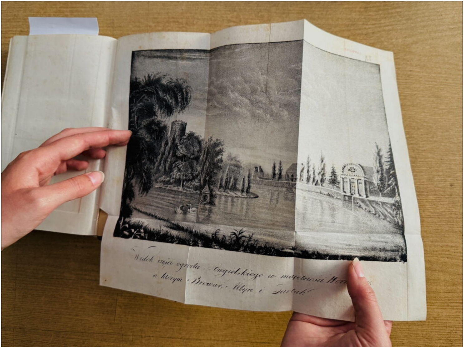
Jeden z tomów publikacji Krzysztofa Kluka