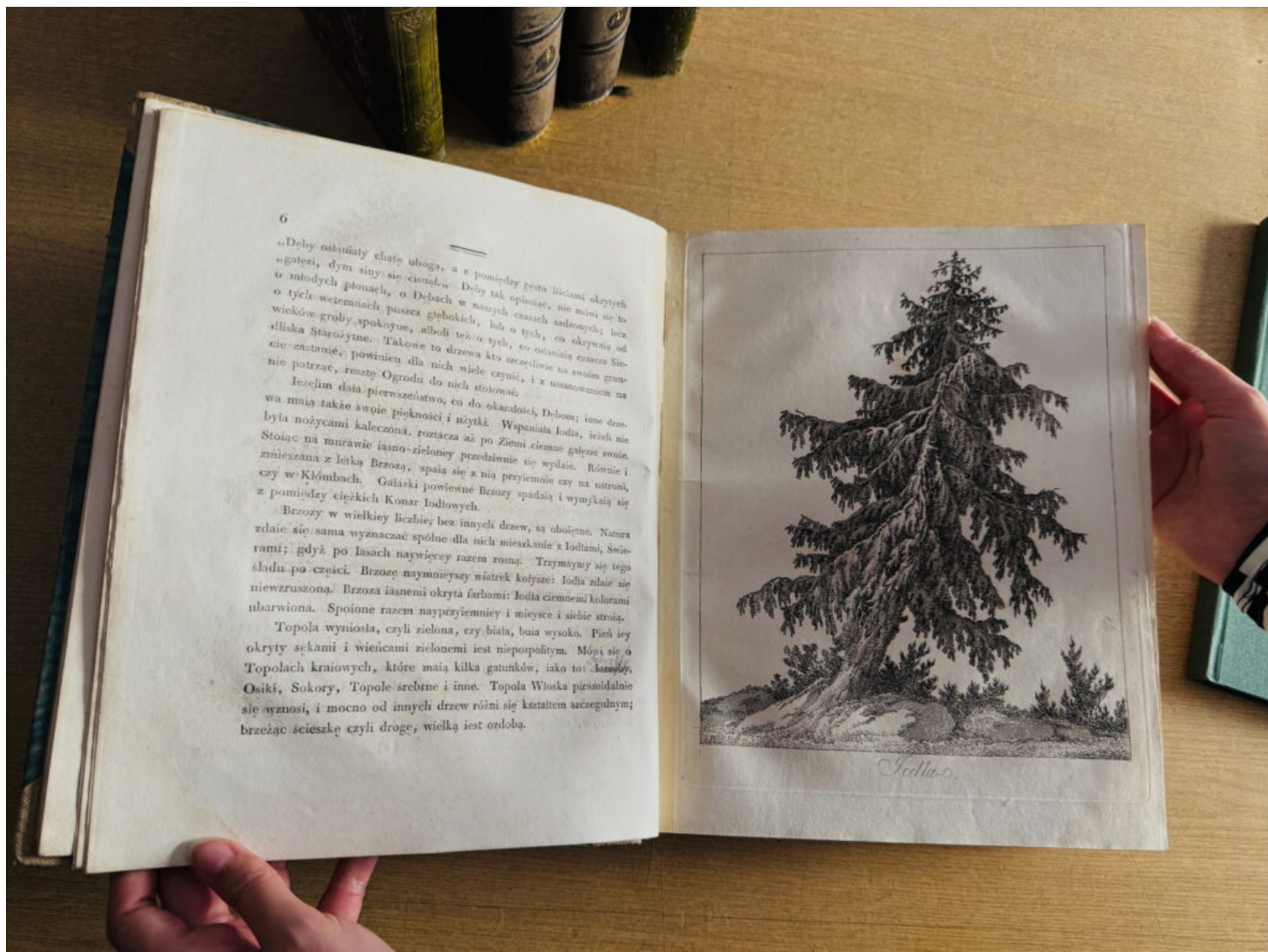
„Myśli różne o sposobie zakładania ogrodów” Izabeli Czartoryskiej, fot. NID/Patrycja Adamczyk

Unikalne pozycje w Bibliotece NID, fot. NID/Patrycja Adamczyk