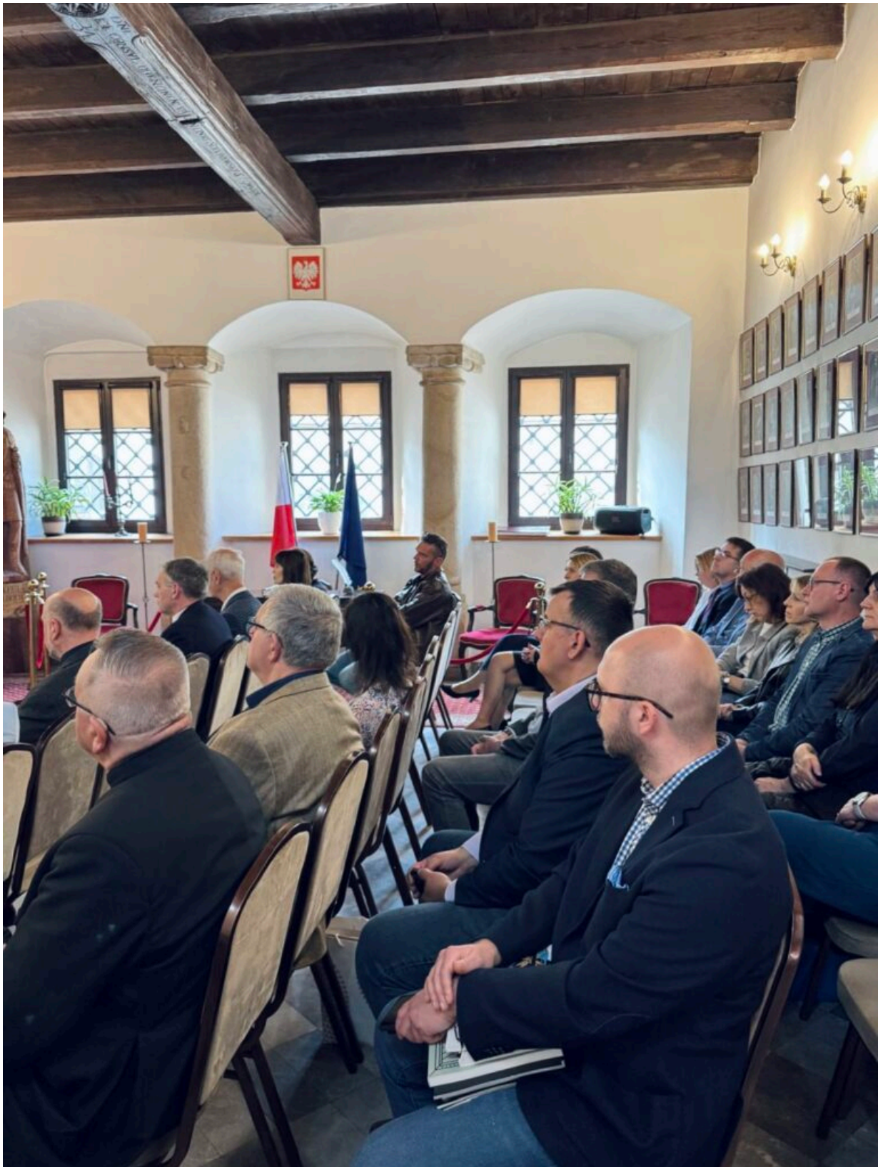
Uczestnicy konferencji