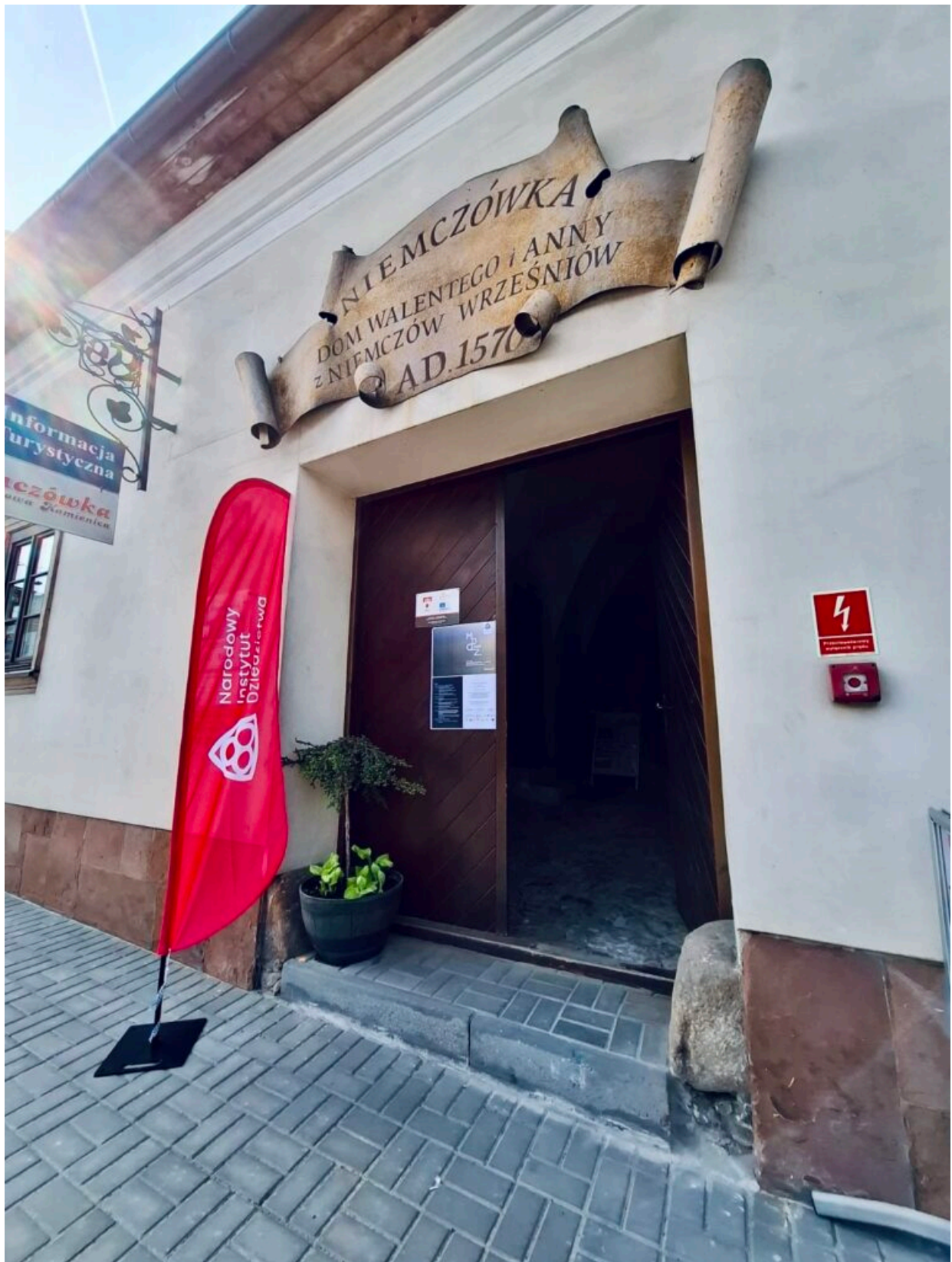
Zabytkowa kamienica Niemczówka