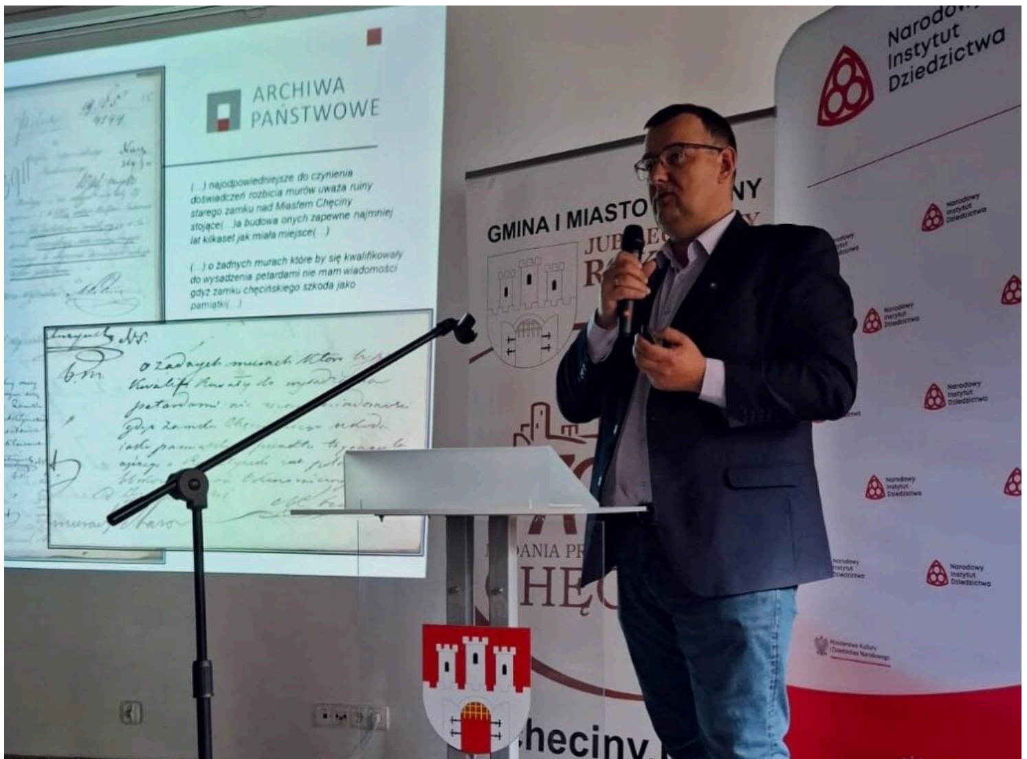
Konrad Maj - Archiwum Państwowe w Kielcach, fot. Wioletta Jankowska/NID