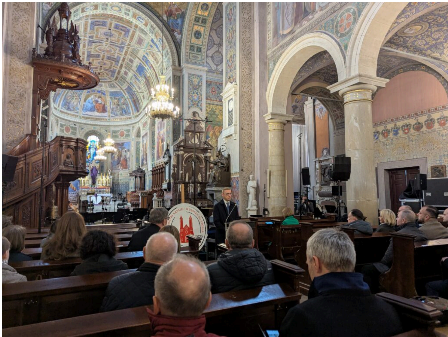
Mazowiecki Wojewódzki Konserwator Zabytków, Marcin Dawidowicz, fot. NID/A.Pogorzelska

Sekretarz Stanu w Ministerstwie Kultury i Dziedzictwa Narodowego, Generalna Konserwator Zabytków, Bożena Żelazowska, fot. NID/A.Pogorzelska