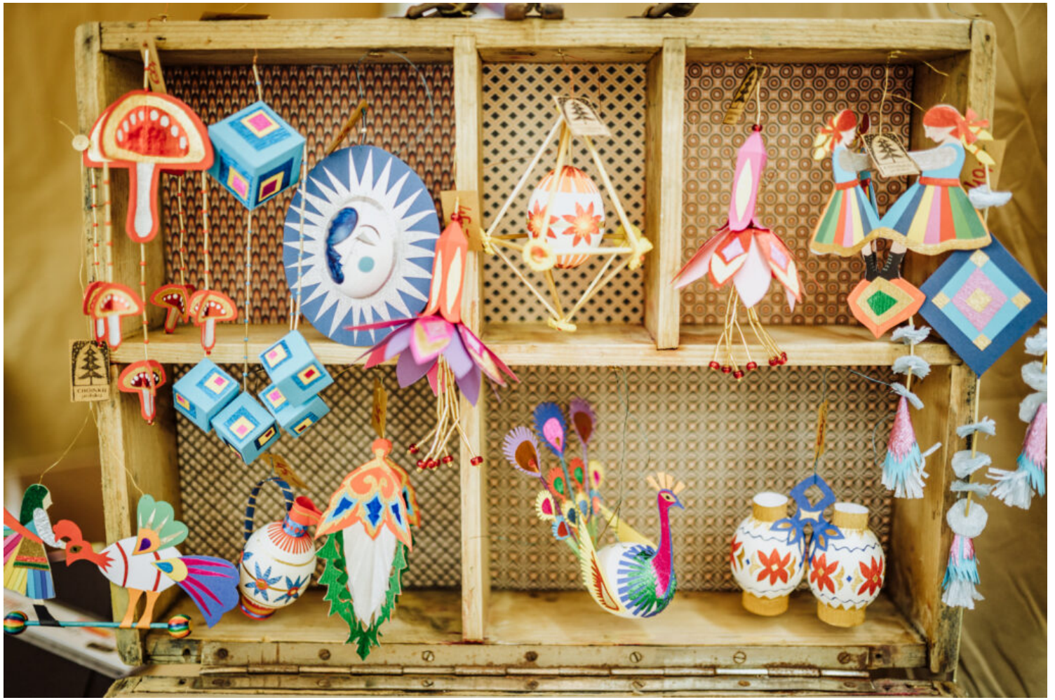
Ozdoby J. Nastala