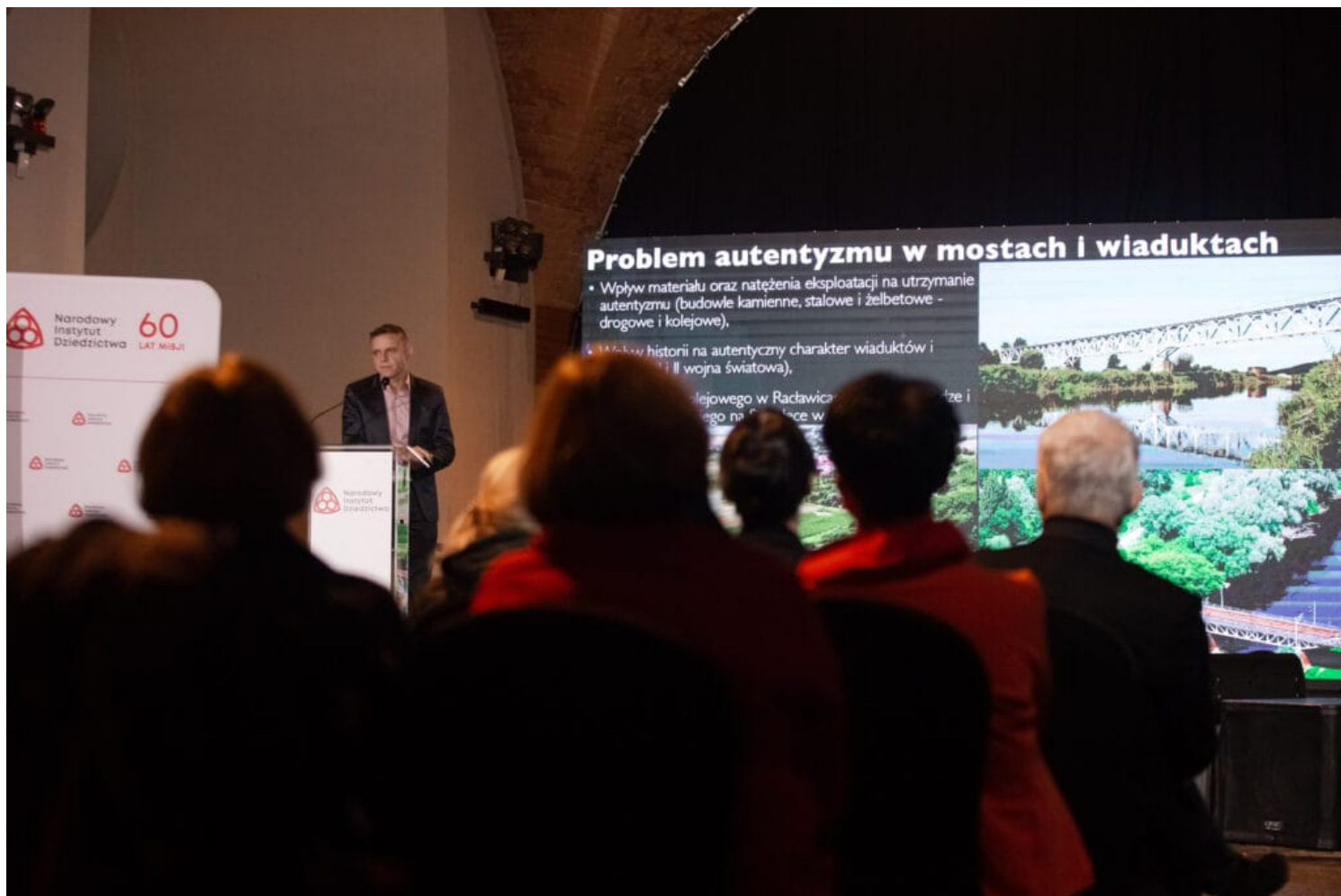
Konferencja ICOMOS pt. „Autentyzm zabytków – 30 lat Dokumentu z Nara o autentyczności”, fot. NID/ Patrycja Adamczyk