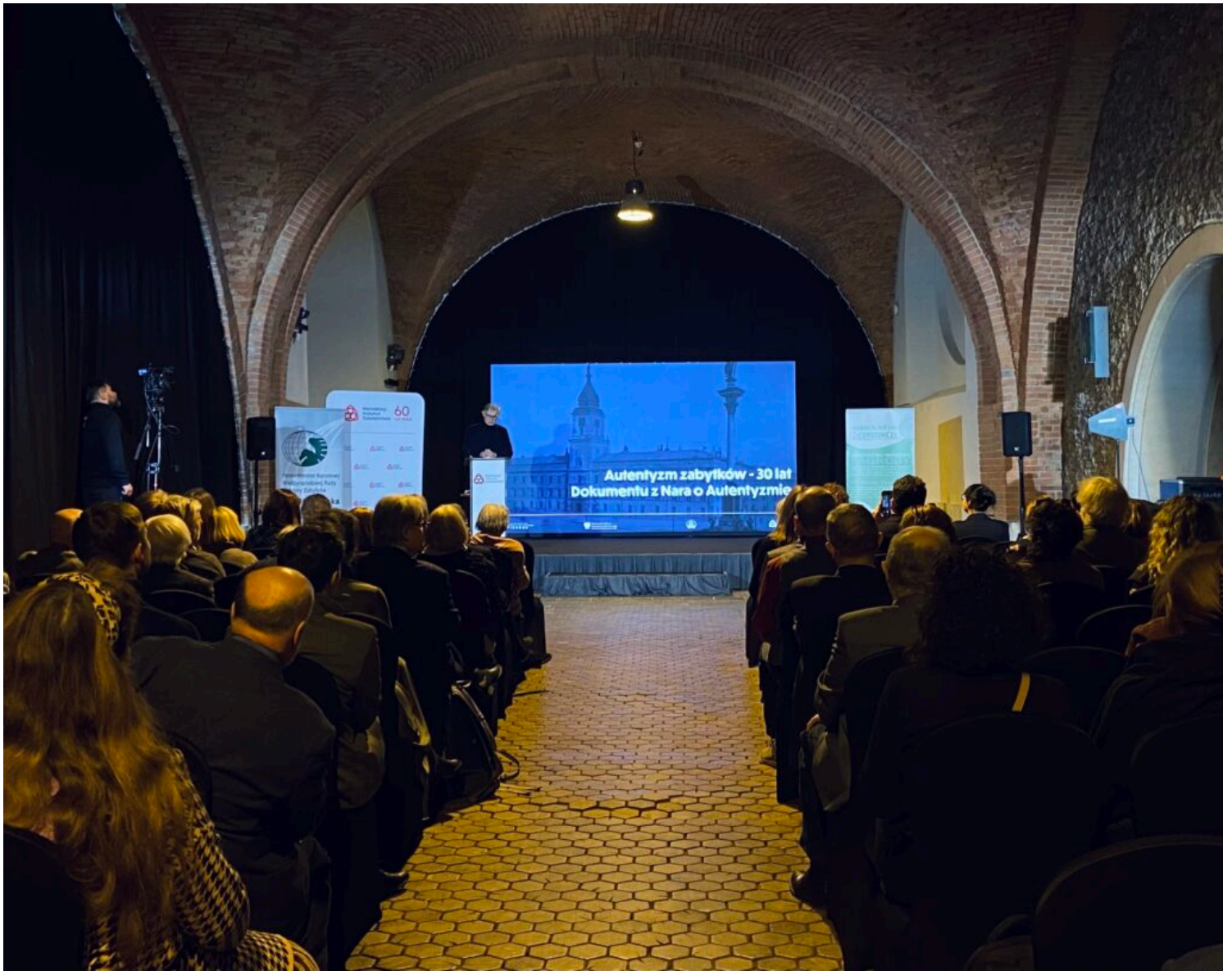
Konferencja ICOMOS pt. „Autentyzm zabytków – 30 lat Dokumentu z Nara o autentyzmie”