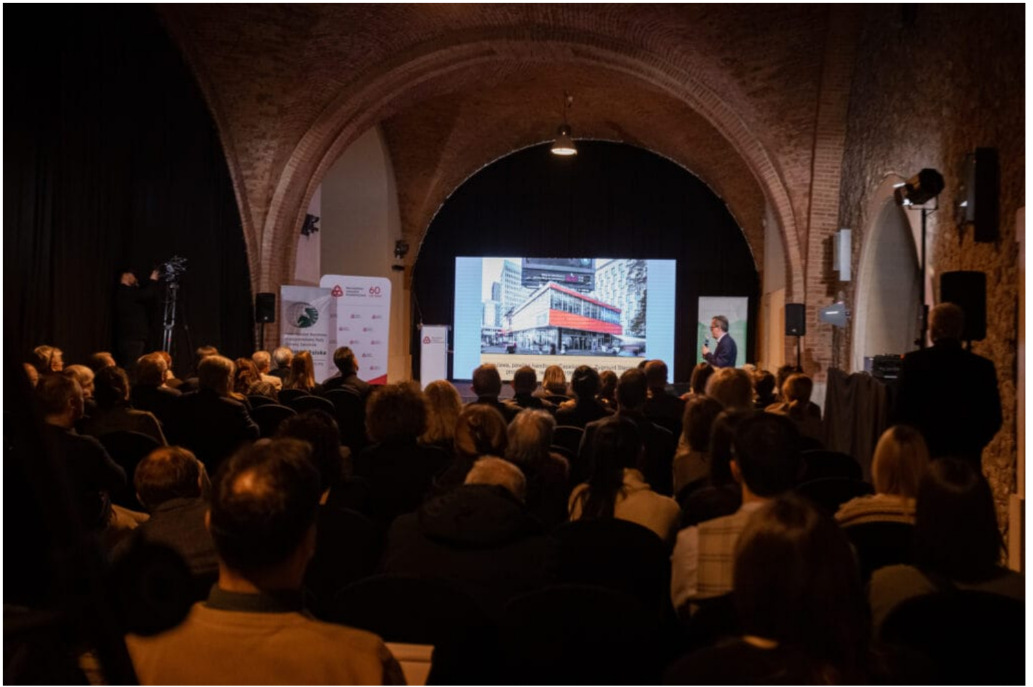
Konferencja ICOMOS pt. „Autentyzm zabytków – 30 lat Dokumentu z Nara o autentyczności”