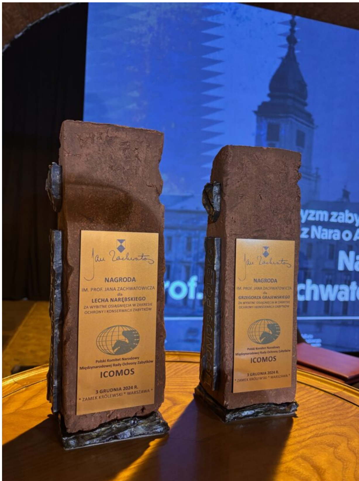
nagrody Generalnego Konserwatora Zabytków i PKN ICOMOS im. profesora Jana Zachwatowicza za wybitne osiągnięcia w dziedzinie