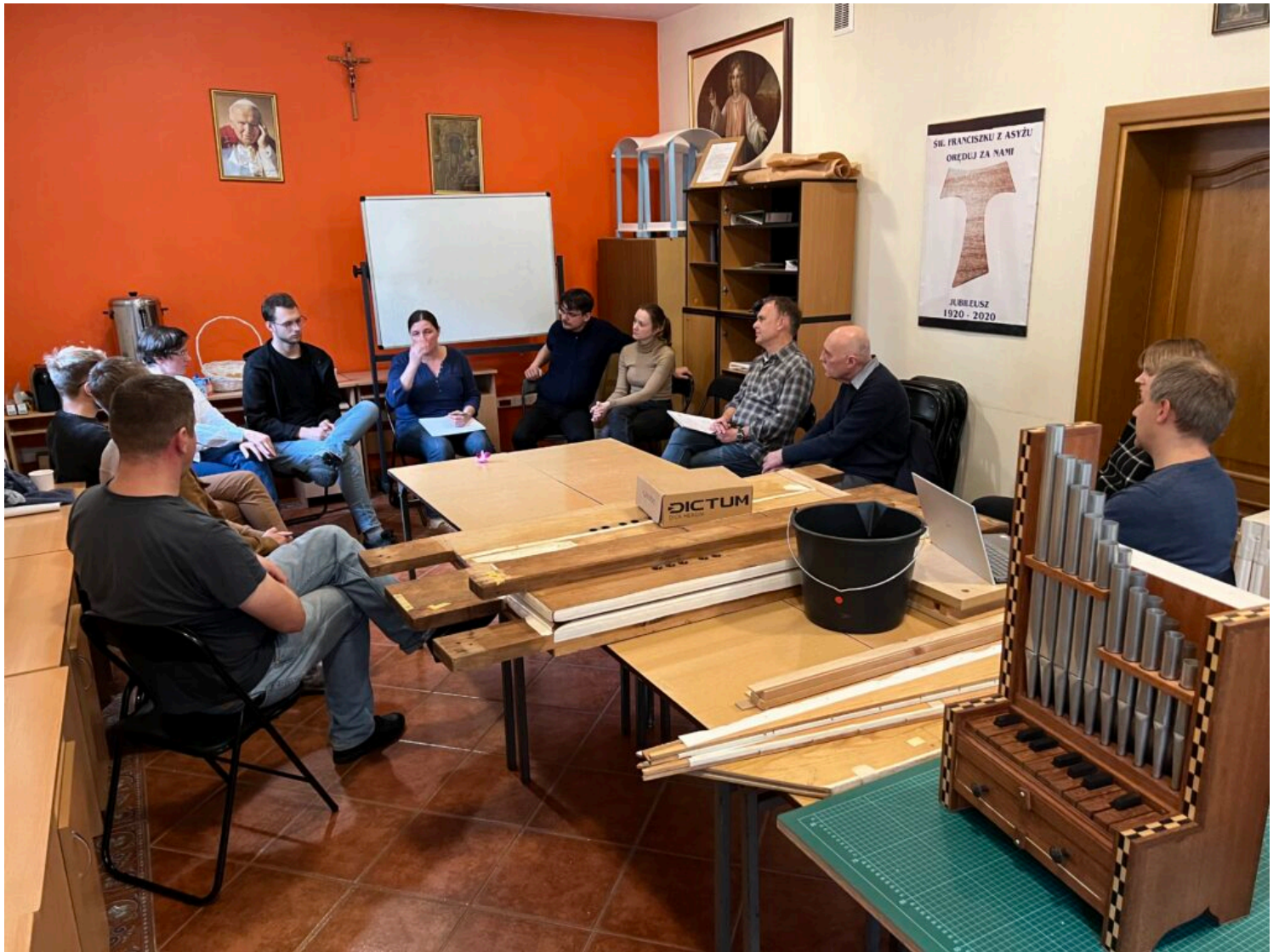
Warsztaty organmistrzowskie konserwacji miechów klinowych