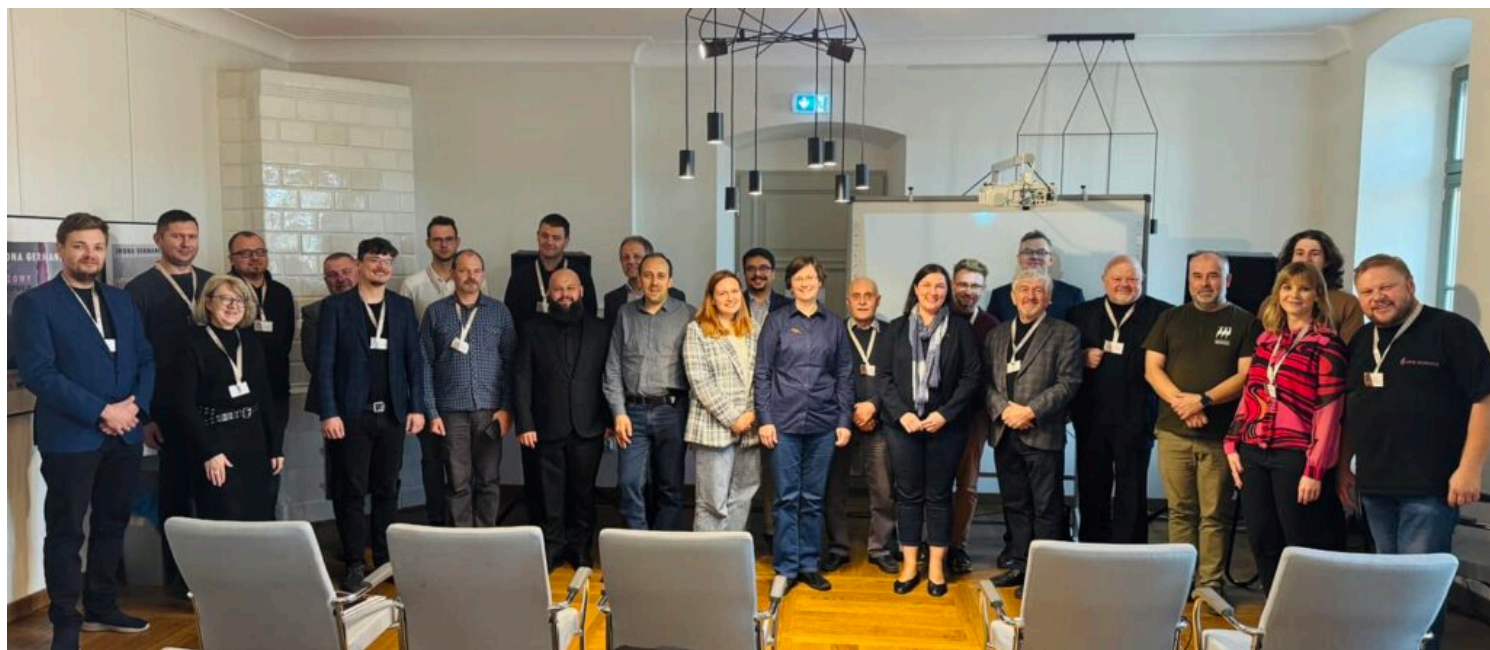
Uczestnicy konferencji