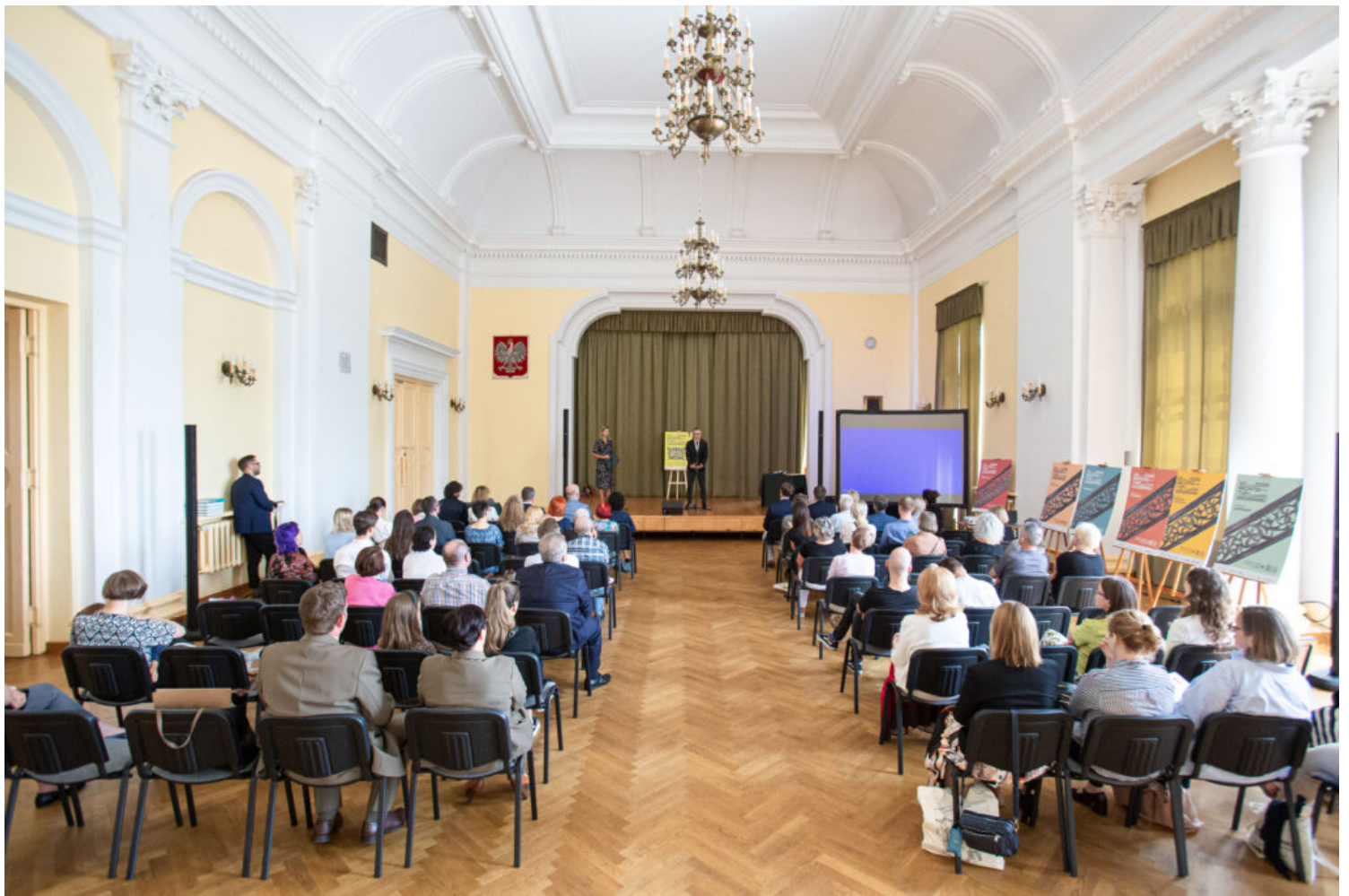
Oficjalna inauguracja DAD 2024 w Otwocku