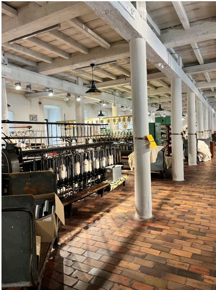
Wizyta z Centralnym Muzeum Włókiennictwa w Łodzi, fot. NID/Sylwia Bielicka