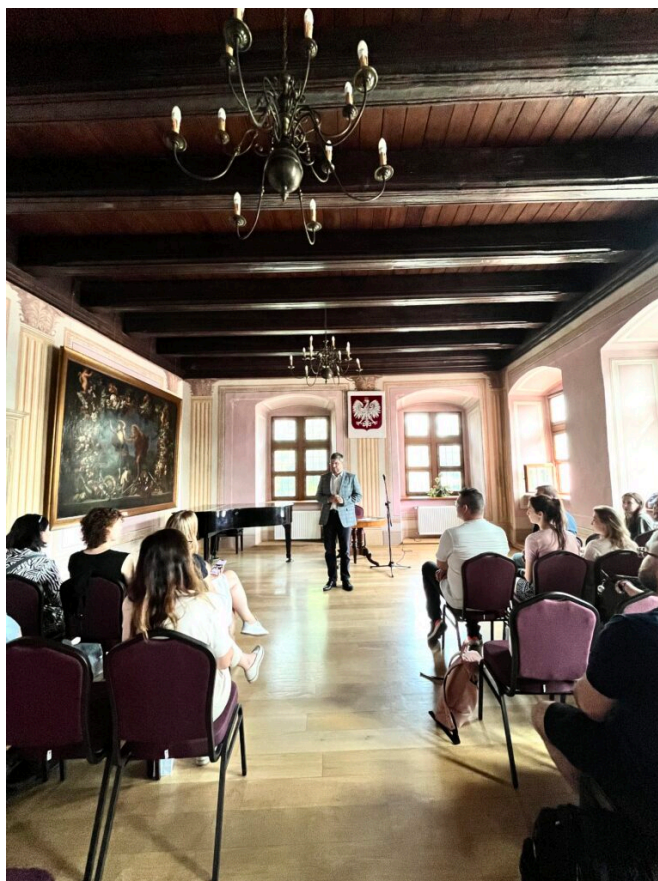
oficjalne zakończenie Szkoły Letniej ICOMOS 2024 w Muzeum Miasta Pabianice z udziałem Grzegorza Mackiewicza, prezydenta Pabianic, fot. NID/Sylwia Bielicka

Dziękujemy wszystkim zaangażowanym w prezentację zabytków przemysłu Łodzi i okolic oraz mamy nadzieję, że doświadczenia zebrane przez nowe pokolenie osób związanych z ochroną dziedzictwa zaowocują w przyszłości jeszcze lepszym rozpoznaniem wartości i potencjału tego typu obiektów nie tylko w Łodzi, ale i w całej Polsce.