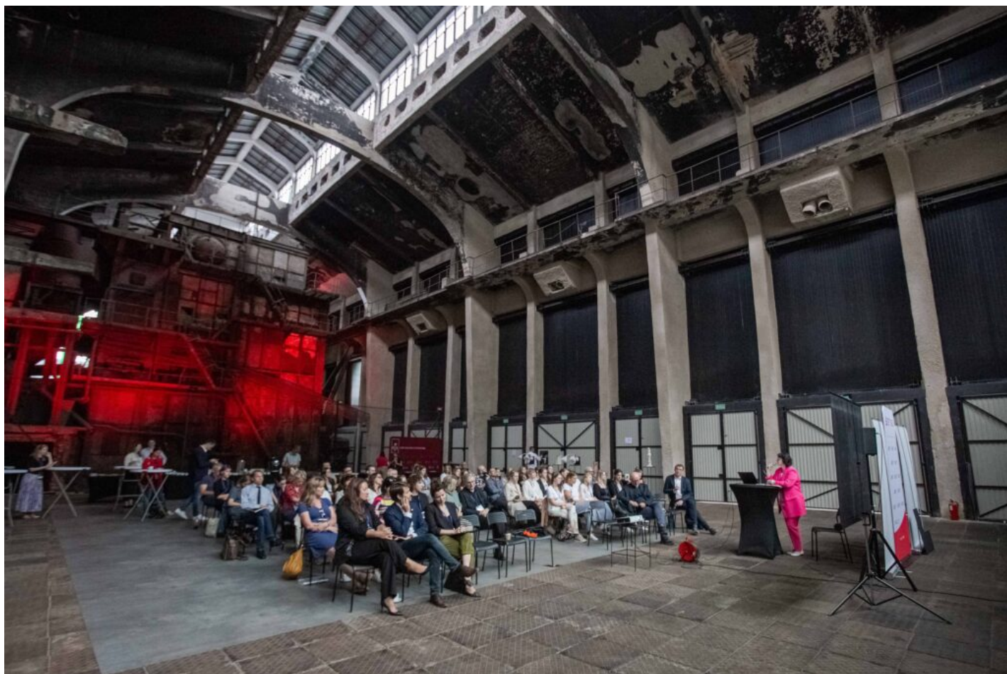
Otwarcie Szkoły Letniej ICOMOS