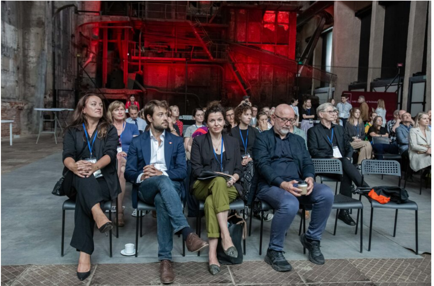
Otwarcie Szkoły Letniej ICOMOS, fot. Magda Starowieyska

Szkoła Letnia ICOMOS 2024 jest finansowana ze środków Ministra Kultury i Dziedzictwa Narodowego w ramach działań Narodowego Instytutu Dziedzictwa, wcześniej Narodowego Instytutu Konserwacji Zabytków.