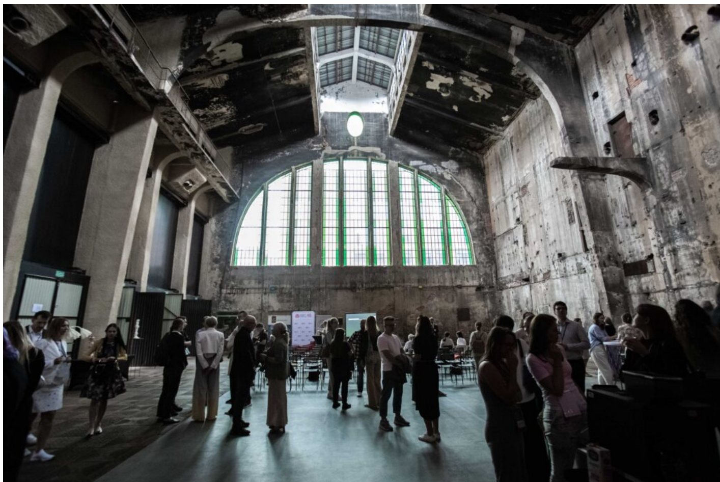
Otwarcie Szkoły Letniej ICOMOS