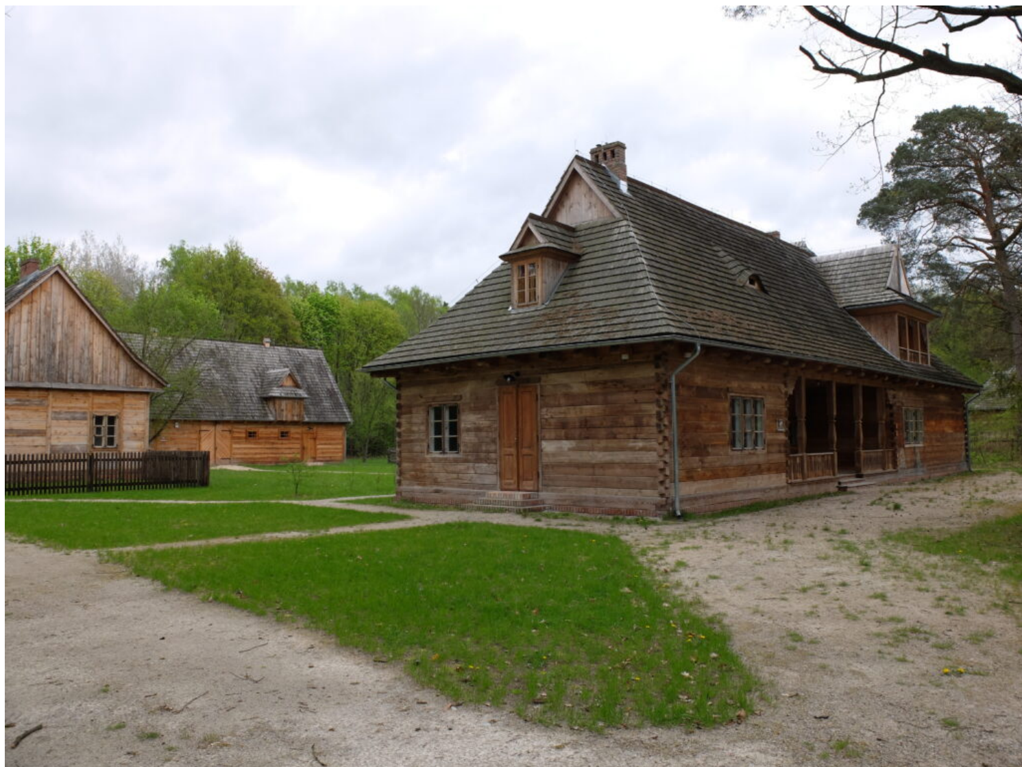
Kategoria adaptacji obiektów zabytkowych, wyróżnienie Kampinoski Park Narodowy