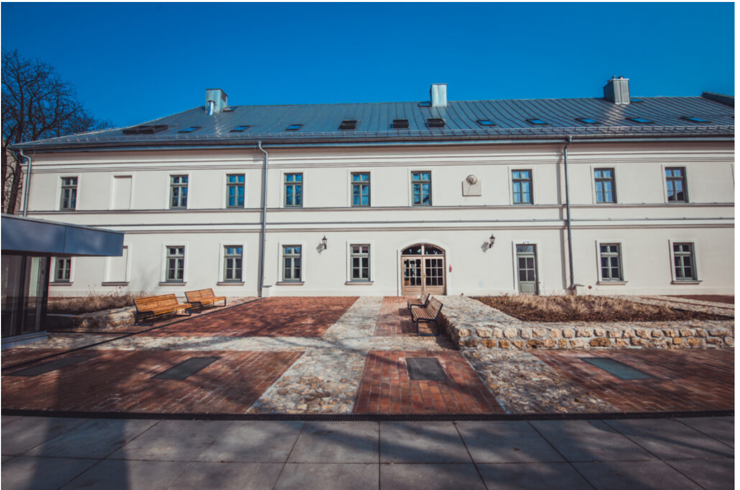
Kategoria adaptacji obiektów zabytkowych, wyróżnienie Gmina Olkusz, fot. Gmina Olkusz