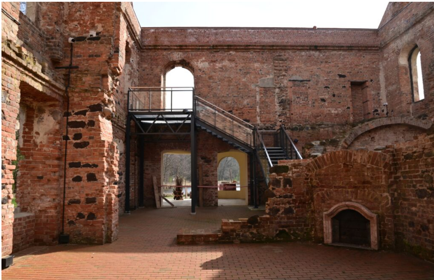
Kategoria rewaloryzacji przestrzeni kulturowej i krajobrazu, wyróżnienie Gmina Twardogóra, fot. NID/ ZZ OT Wrocław