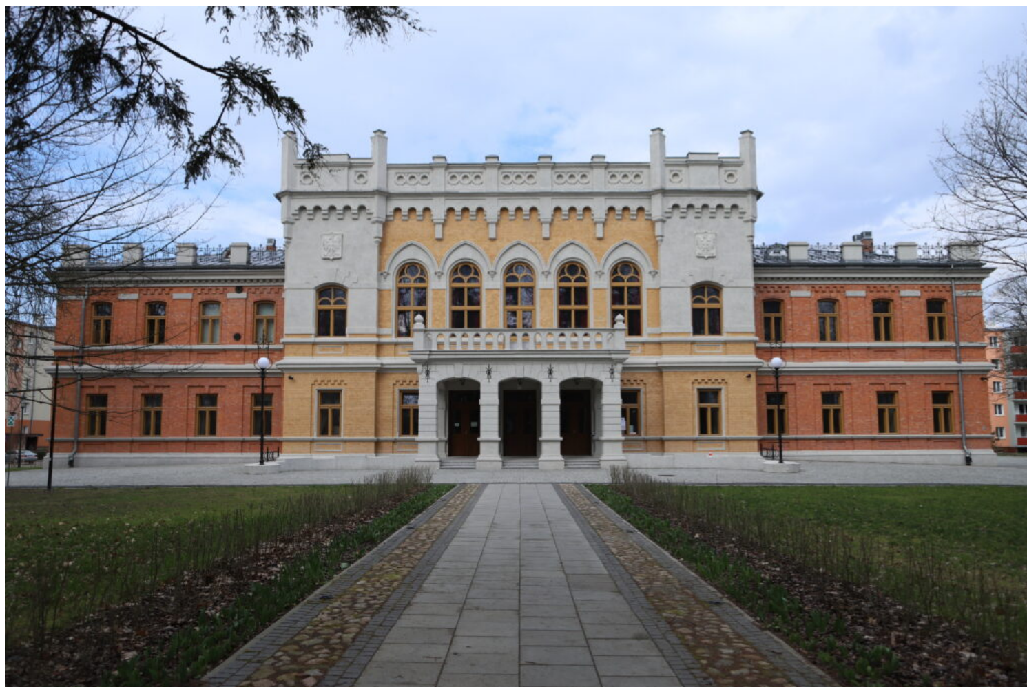
Kategoria utrwalenia wartości zabytkowej obiektu, laureat Miasto Nowy Dwór Mazowiecki, fot. NID/ ZZ OT Warszawa