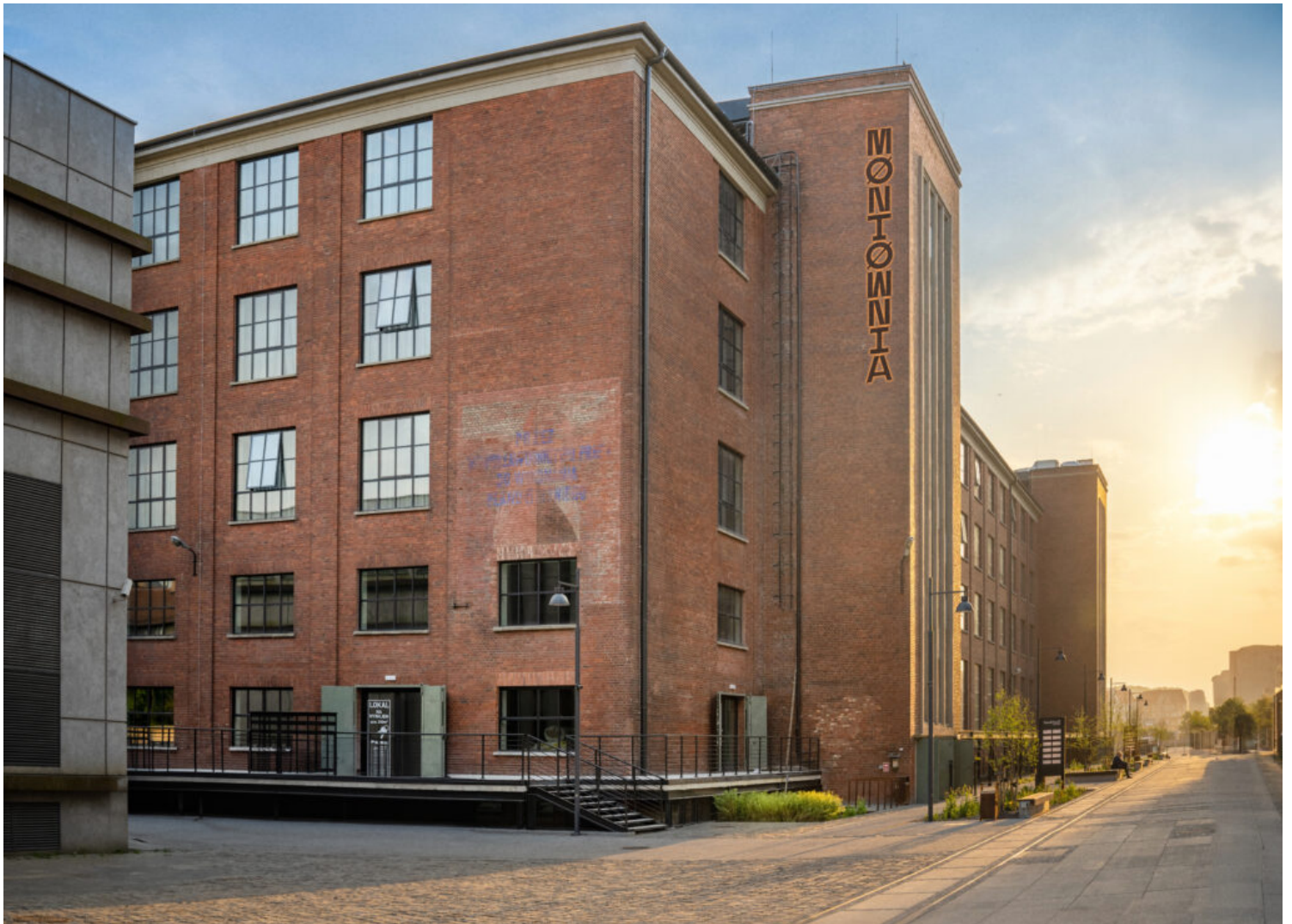
Kategoria adaptacji obiektów zabytkowych, laureat Euro Styl Montownia - Spółka z ograniczoną odpowiedzialnością, fot. Euro Styl Montownia - Spółka z o.o.