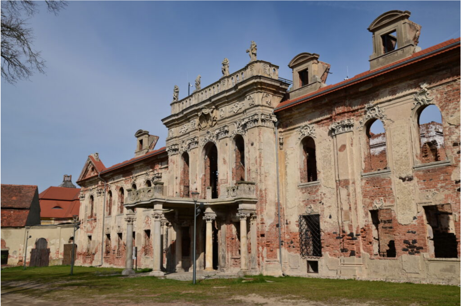
Kategoria rewaloryzacji przestrzeni kulturowej i krajobrazu, wyróżnienie Gmina Twardogóra