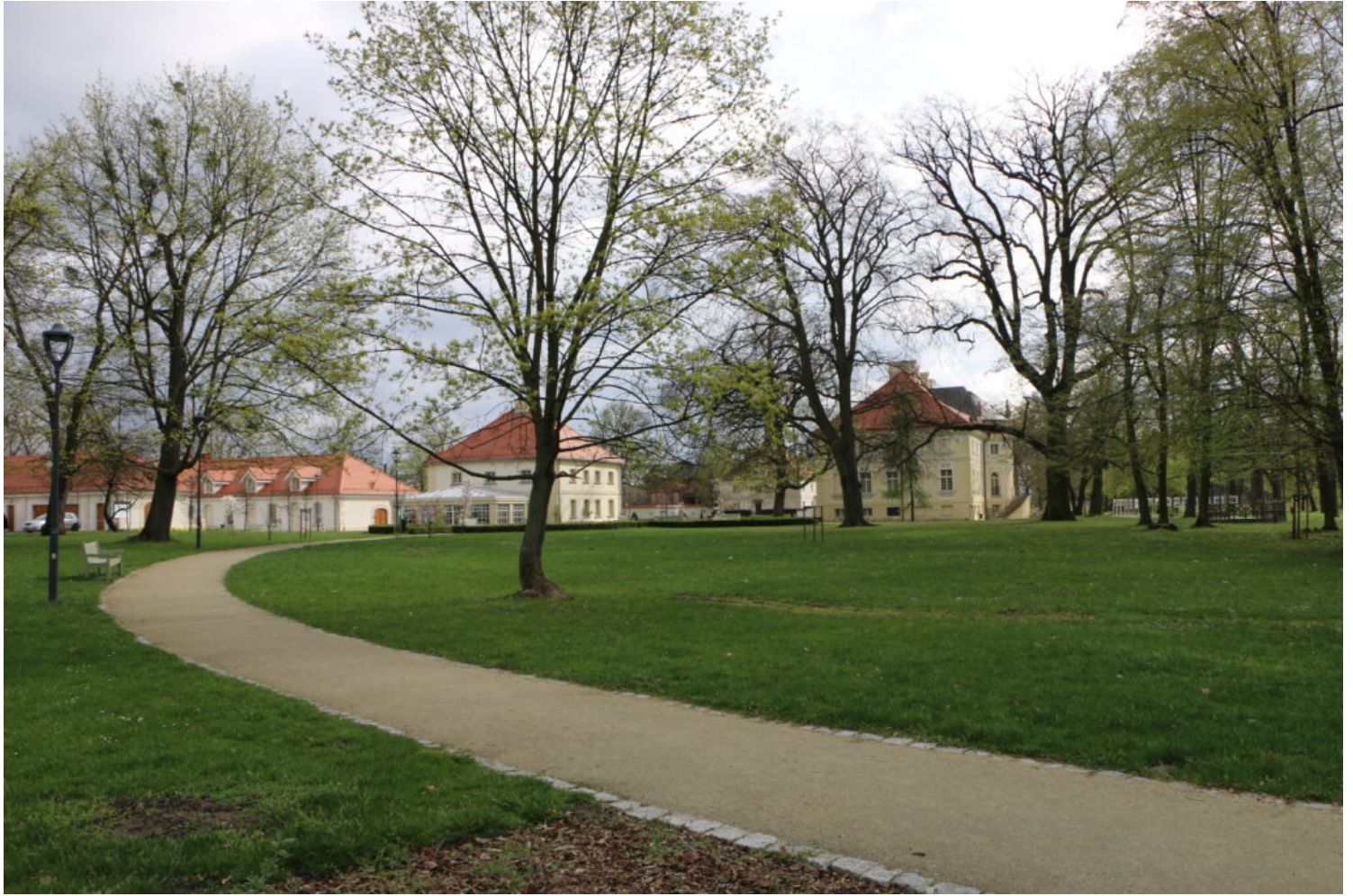
Kategoria rewaloryzacji przestrzeni kulturowej i krajobrazu, laureat Muzeum w Lewkowie - Zespół Pałacowo-Parkowy

Wyróżnienia w kategorii rewaloryzacji przestrzeni kulturowej i krajobrazu przyznano: