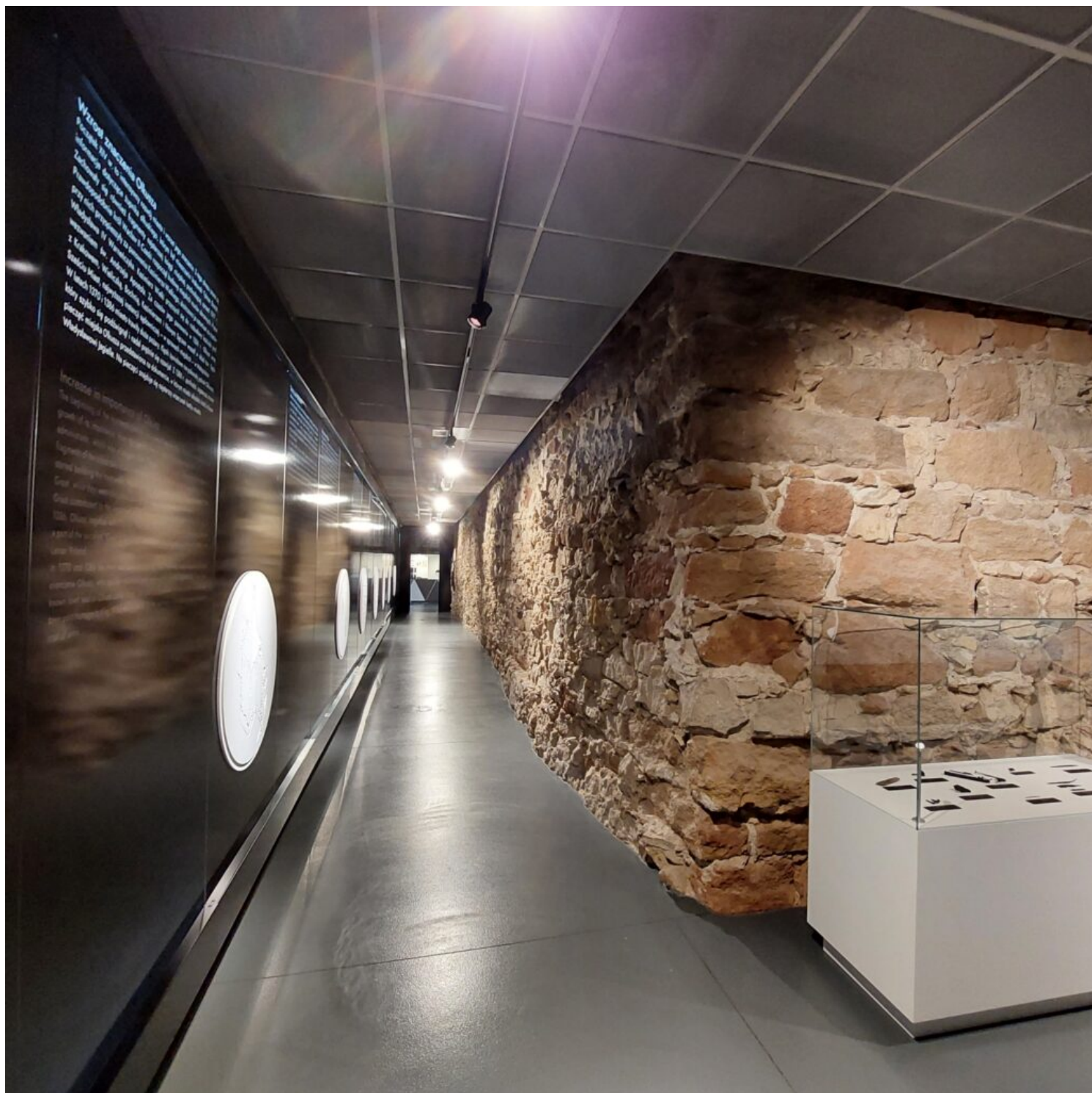
Kategoria adaptacji obiektów zabytkowych, wyróżnienie Gmina Olkusz