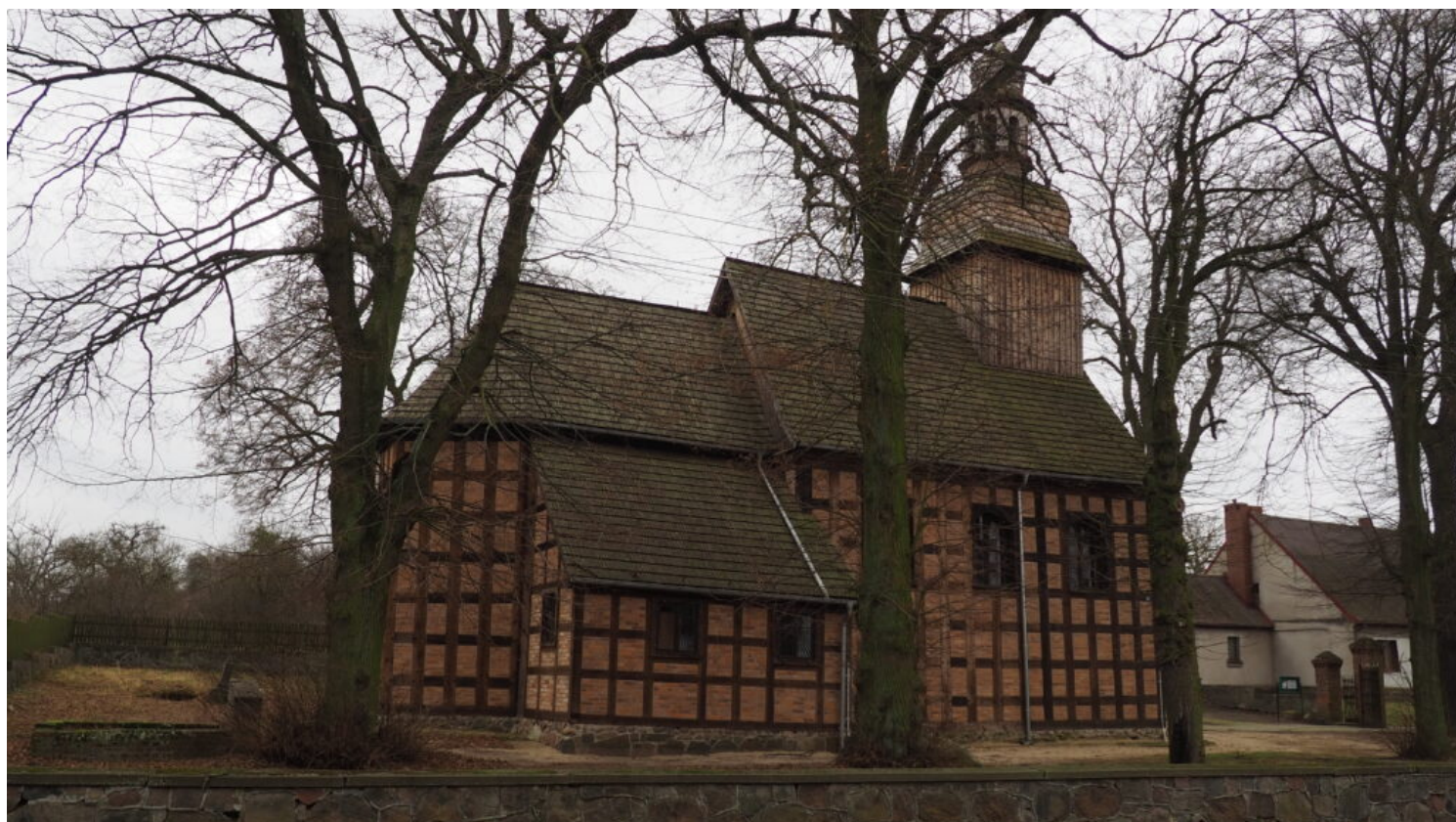
Kategoria architektury i budownictwa drewnianego, wyróżnienie Parafia Rzymskokatolicka Świętej Anny w Jaktorowie, fot. Iwona Żerebiło