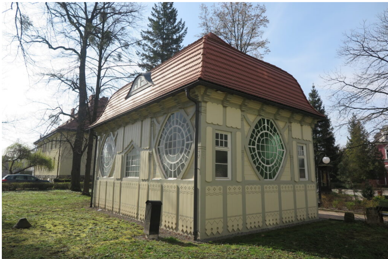
Kategoria architektury i budownictwa drewnianego, wyróżnienie Uzdrowisko Goczałkowice-Zdrój - Spółka z o.o.