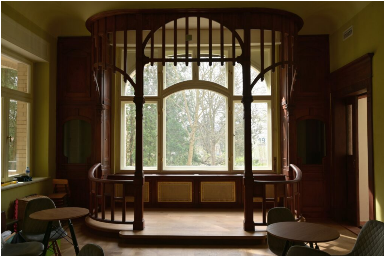
Kategoria utrwalenia wartości zabytkowej obiektu, laureat Miasto Jelenia Góra