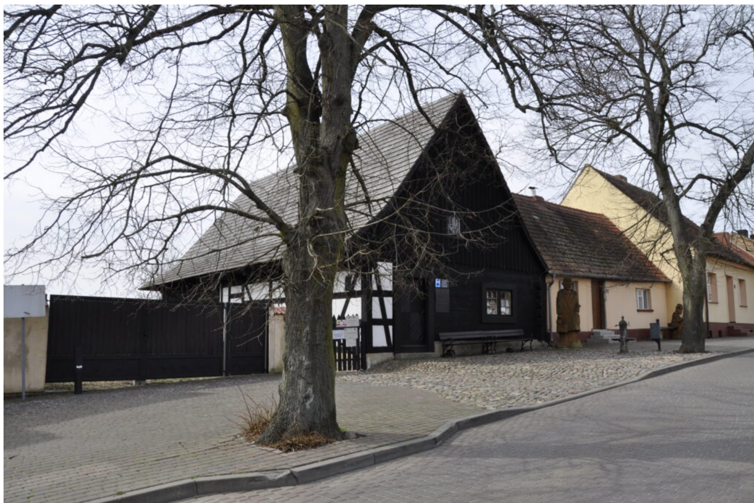
Kategoria specjalna właściwego użytkowania i stałej opieki nad zabytkami, laureat Gminny Ośrodek Kultury w Pszczewie

Jury nie przyznało nagród w nowo utworzonej kategorii „Zabytek dostępny”, która pojawiła się po raz pierwszy w tegorocznej edycji Konkursu.