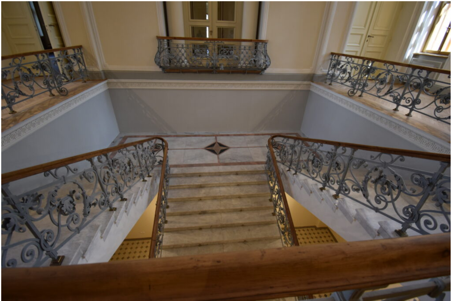
Kategoria utrwalenia wartości zabytkowej obiektu, laureat Miasto Nowy Dwór Mazowiecki

Wyróżnienia w kategorii utrwalenia wartości zabytkowej obiektu przyznano: