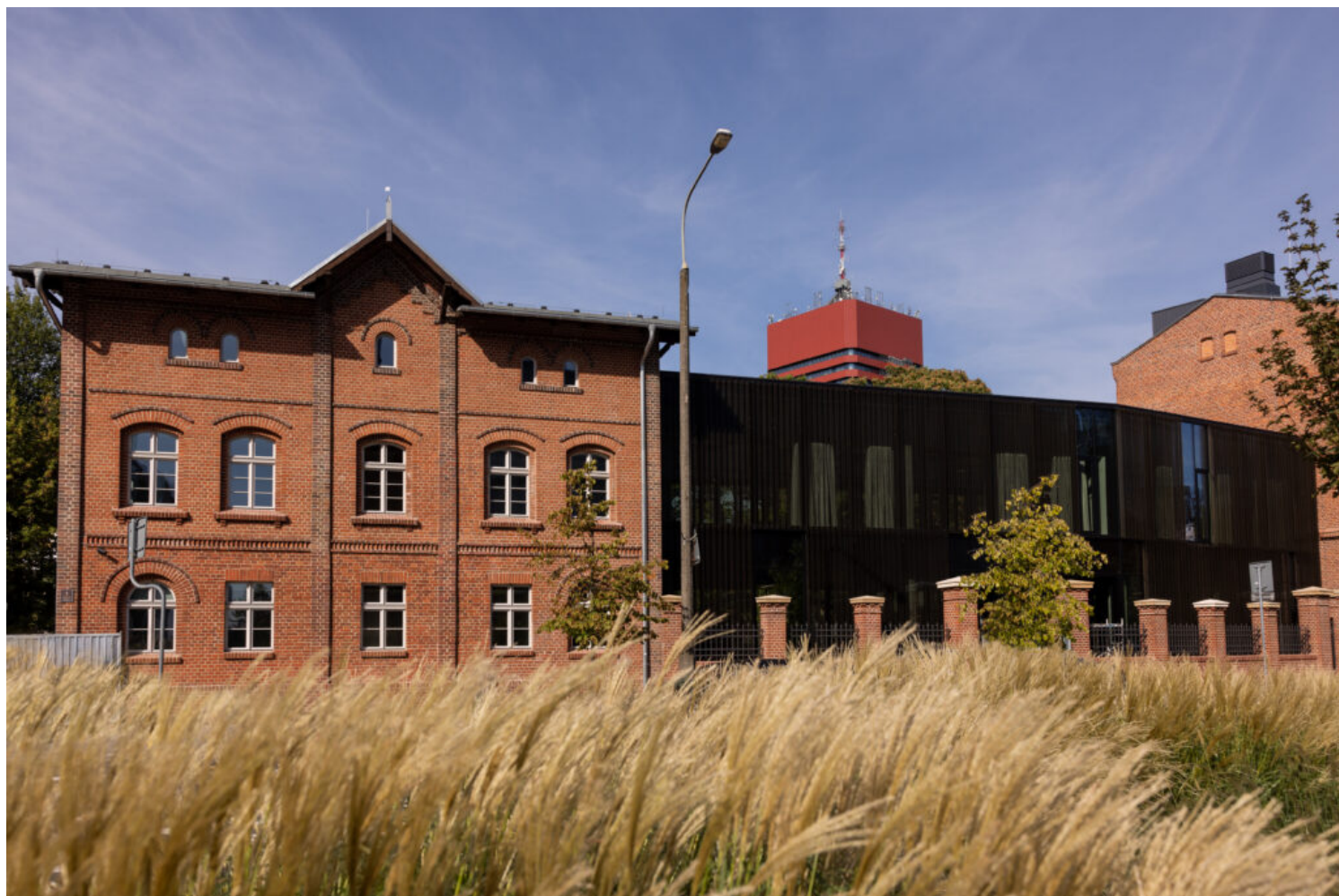
Kategoria adaptacji obiektów zabytkowych, wyróżnienie Uniwersytet WSB Merito w Poznaniu