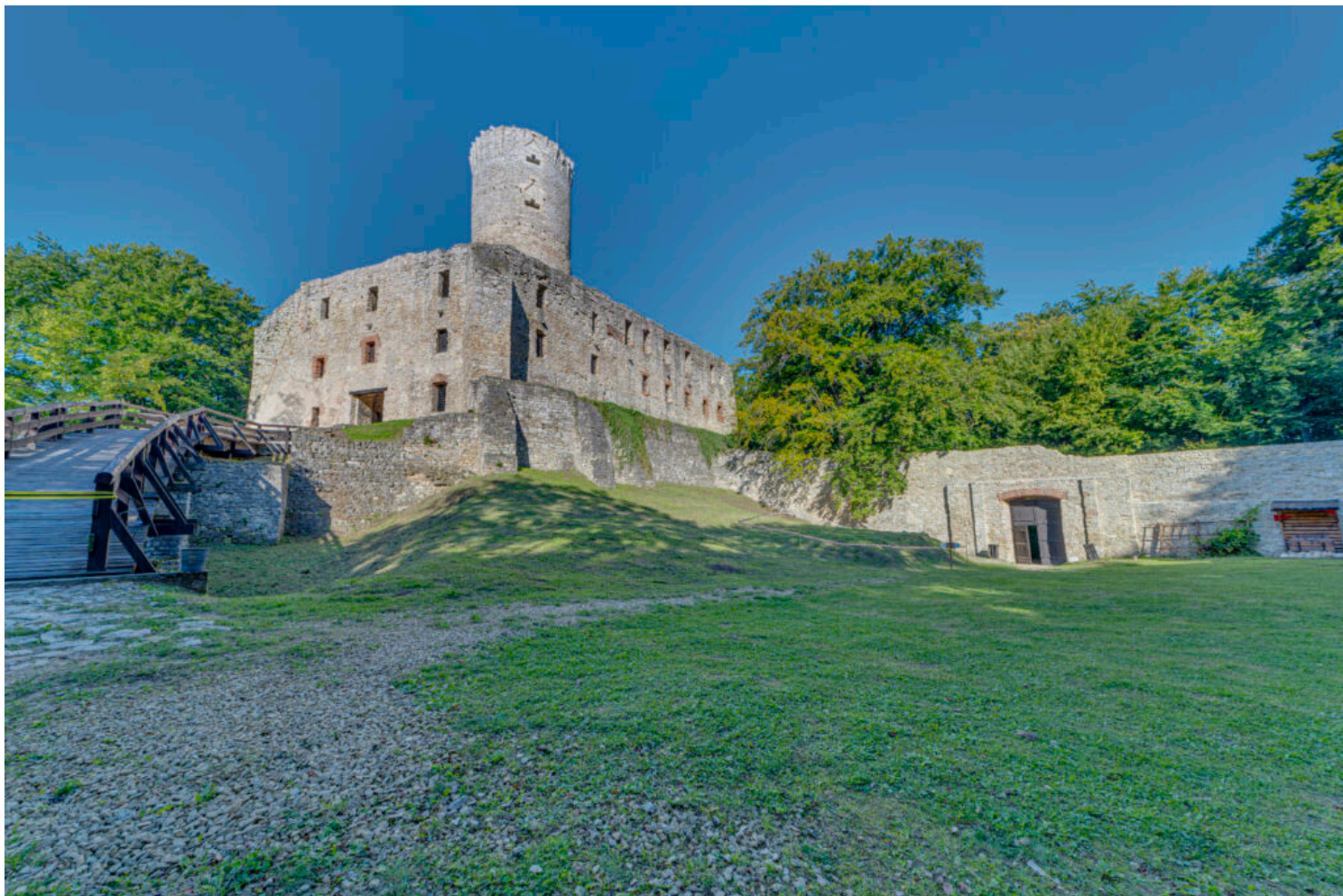
Kategoria rewaloryzacji przestrzeni kulturowej i krajobrazu, wyróżnienie Muzeum Małopolski Zachodniej w Wygiełzowie