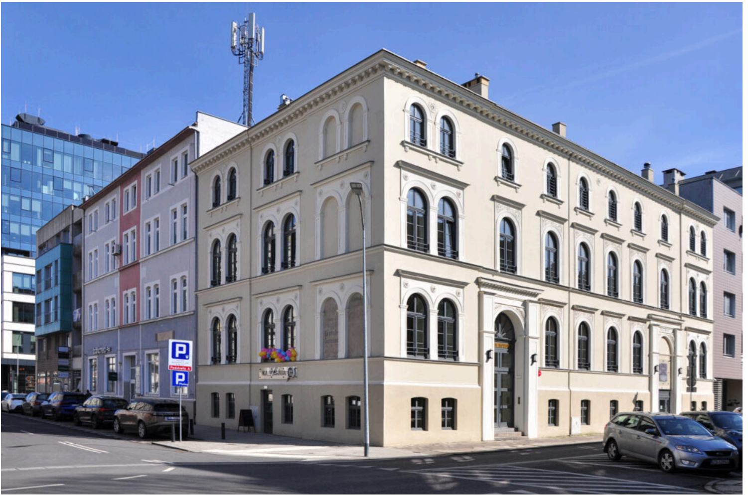
Kategoria utrwalenia wartości zabytkowej obiektu, wyróżnienie Zbór w Szczecinie Kościoła Chrześcijan Baptystów Rzeczypospolitej Polskiej, fot. NID/ ZZ OT Szczecin