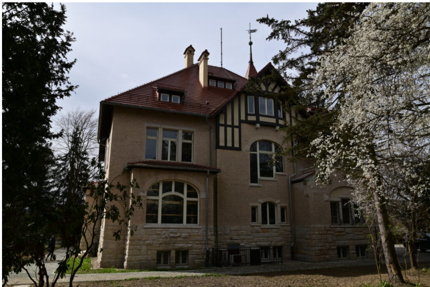
Kategoria utrwalenia wartości zabytkowej obiektu, laureat Miasto Jelenia Góra, fot. NID/ ZZ OT Wrocław