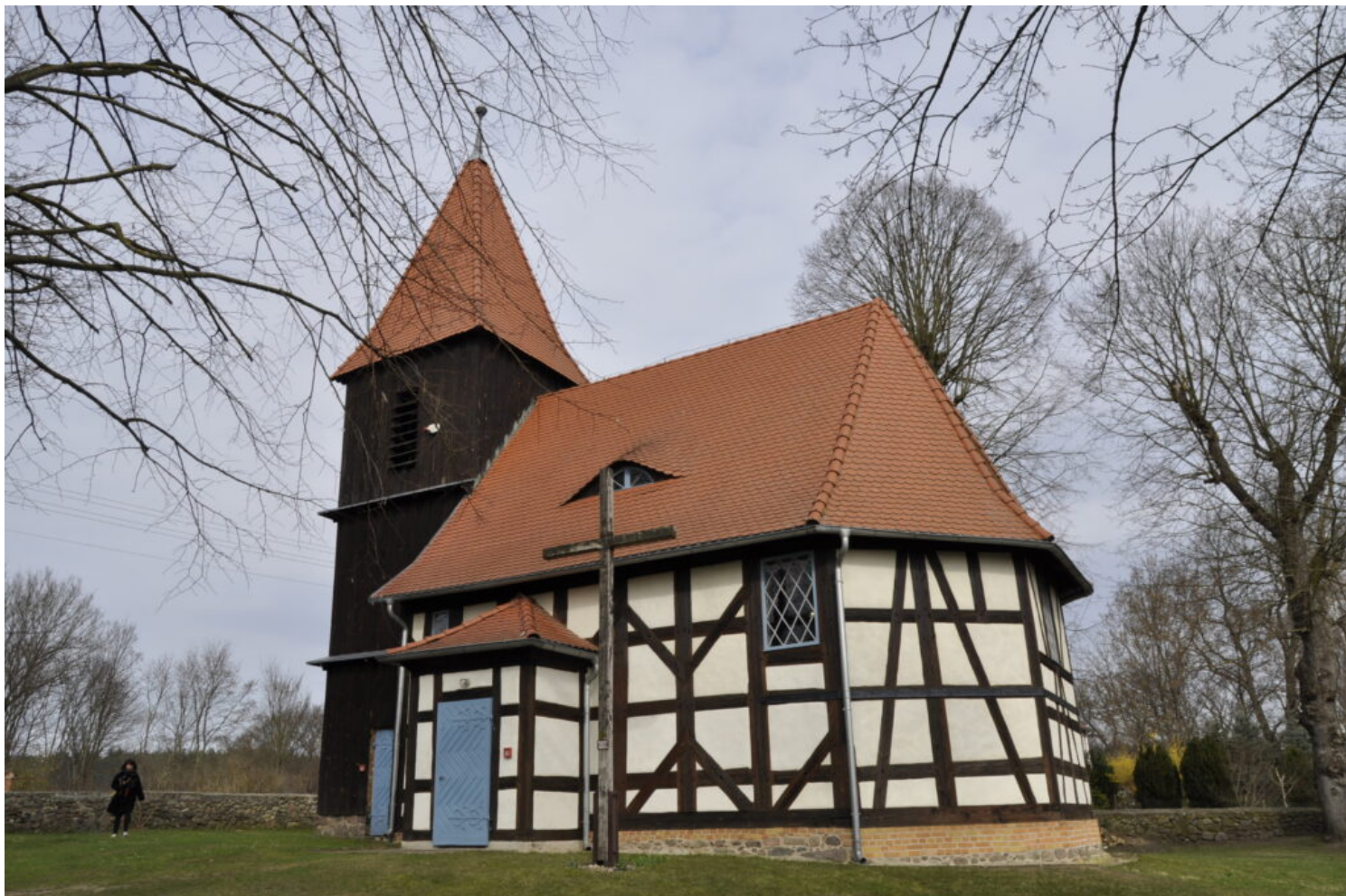
Kategoria architektury i budownictwa drewnianego, laureat Parafia Rzymskokatolicka Najświętszego Serca Pana Jezusa w Rzepinie, fot. NID/ ZZ OT Zielona Góra