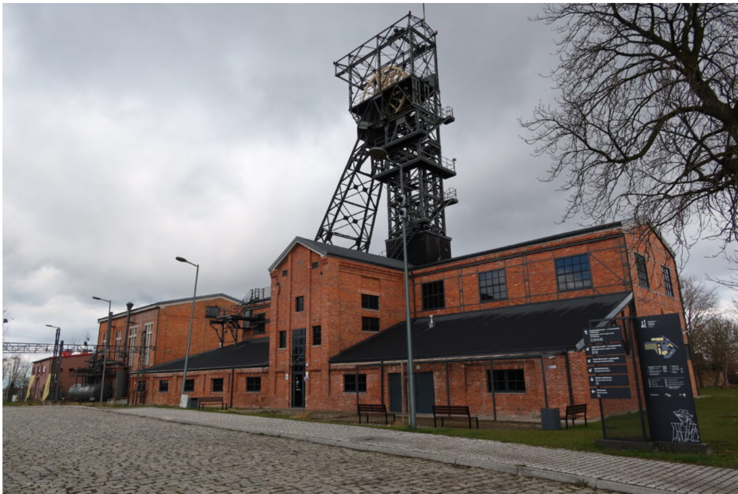
Kategoria zabytków techniki, laureat Zabytkowa Kopalnia Ignacy w Rybniku, fot. NID/ ZZ OT Katowice