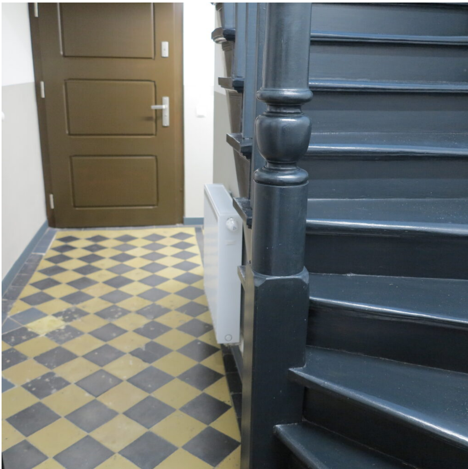
Kategoria adaptacji obiektów zabytkowych, wyróżnienie Uniwersytet WSB Merito w Poznaniu