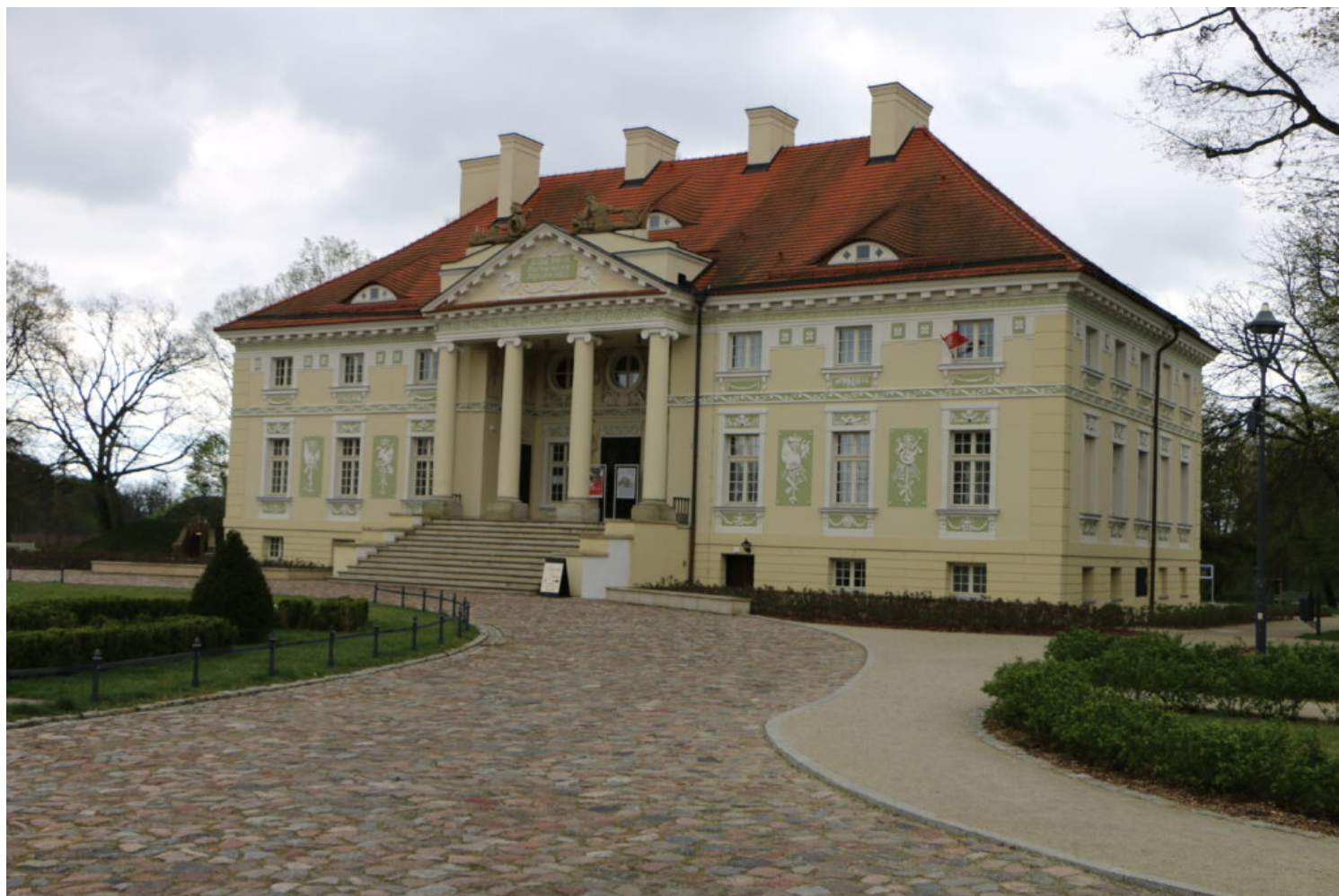
Kategoria rewaloryzacji przestrzeni kulturowej i krajobrazu, laureat Muzeum w Lewkowie - Zespół Pałacowo-Parkowy