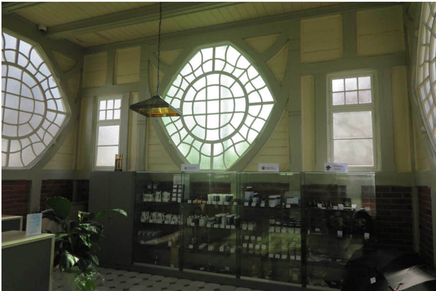
Kategoria architektury i budownictwa drewnianego, wyróżnienie Uzdrowisko Goczałkowice-Zdrój - Spółka z o.o.