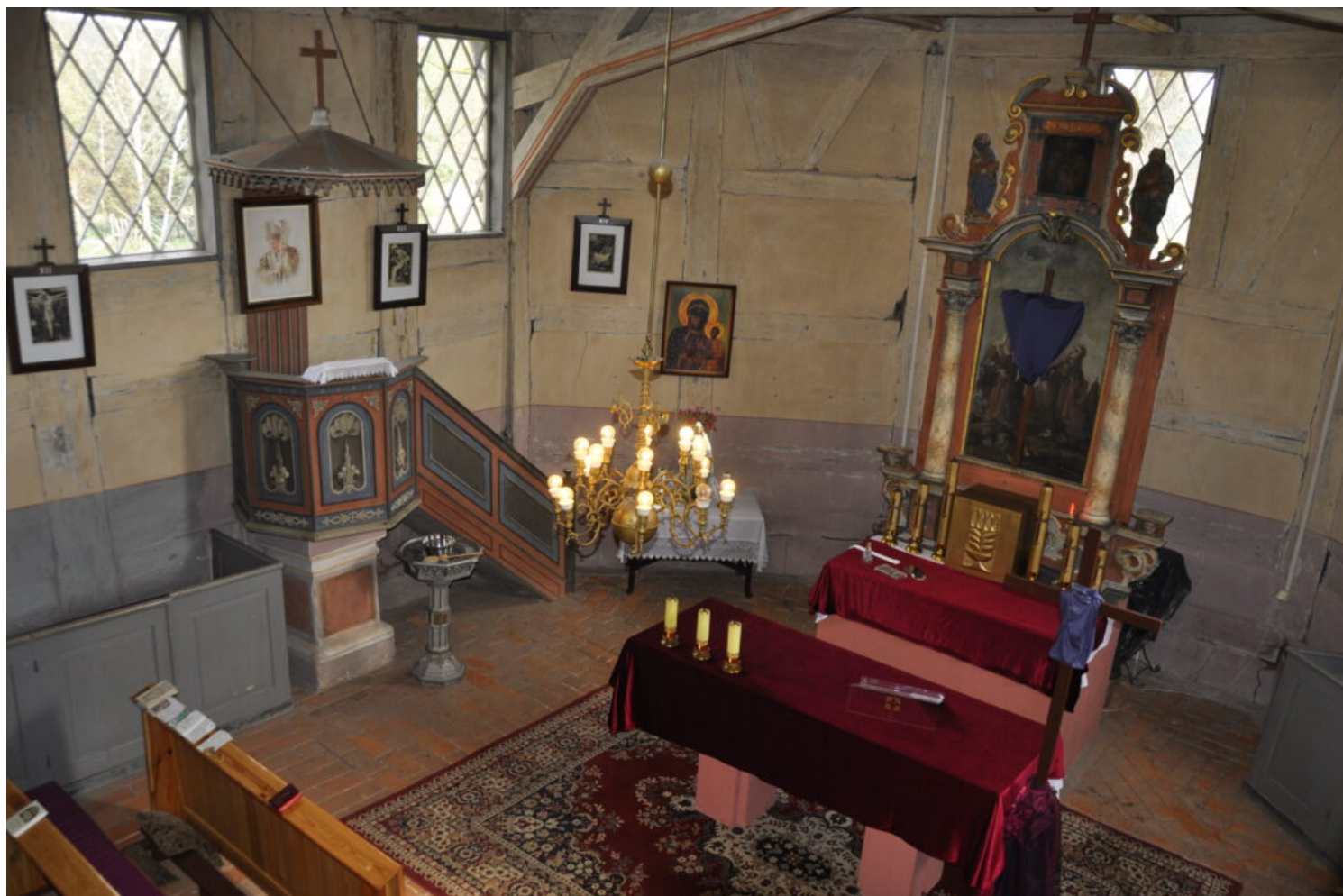
Kategoria architektury i budownictwa drewnianego, laureat Parafia Rzymskokatolicka Najświętszego Serca Pana Jezusa w Rzepinie

Wyróżnienia w kategorii architektury i budownictwa drewnianego przyznano: