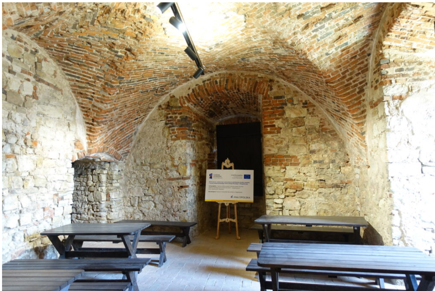
Kategoria rewaloryzacji przestrzeni kulturowej i krajobrazu, wyróżnienie Muzeum Małopolski Zachodniej w Wygiełzowie