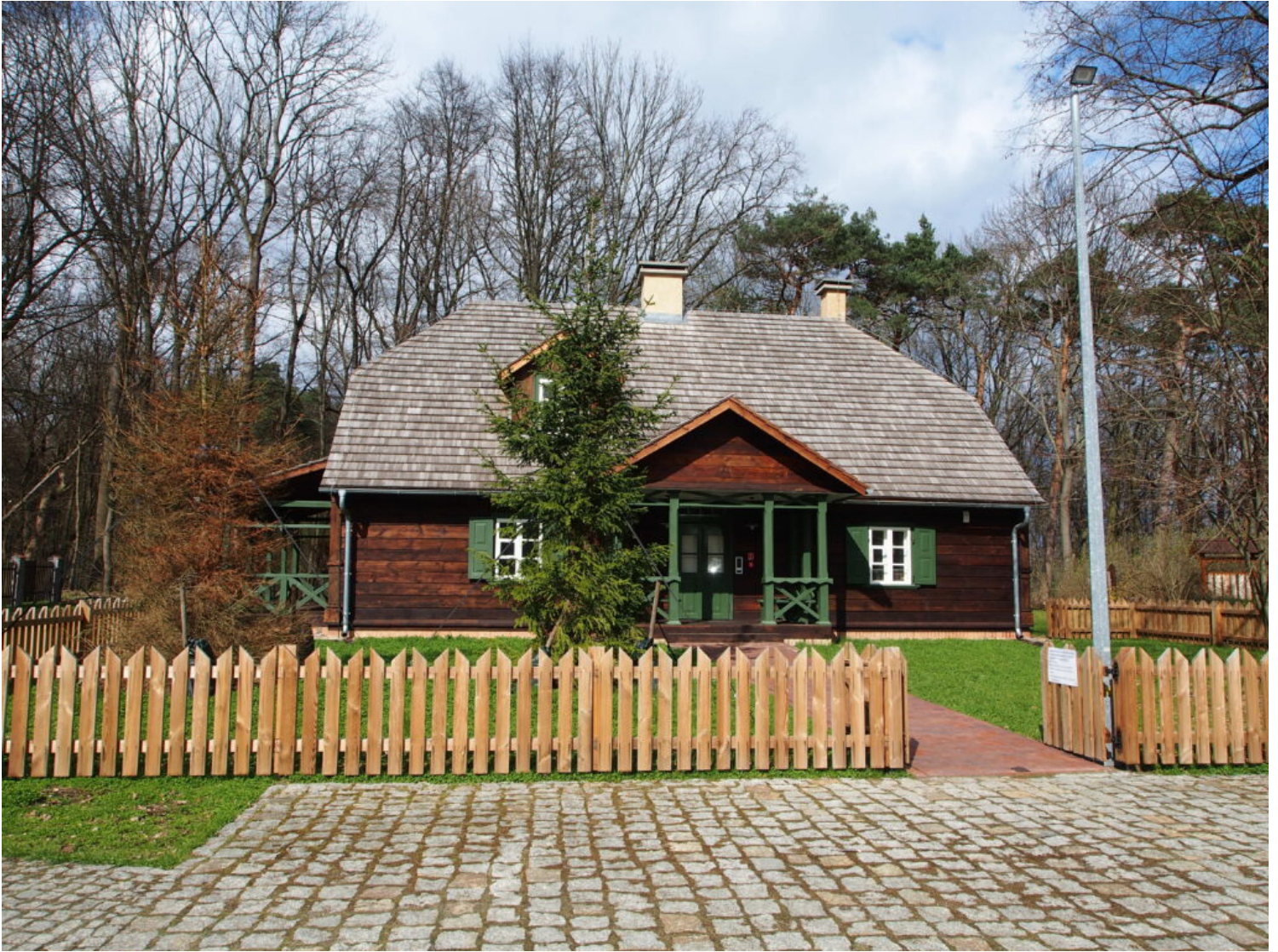
Kategoria architektury i budownictwa drewnianego, wyróżnienie Lasy Miejskie - Warszawa