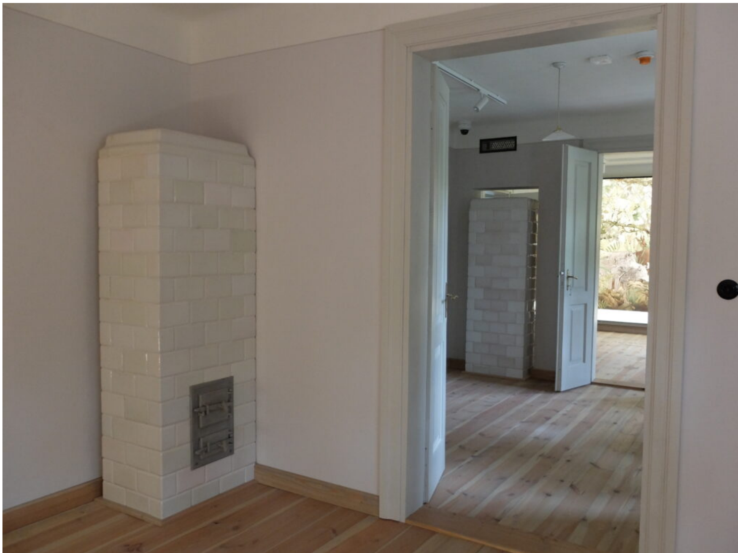
Kategoria adaptacji obiektów zabytkowych, wyróżnienie Kampinoski Park Narodowy