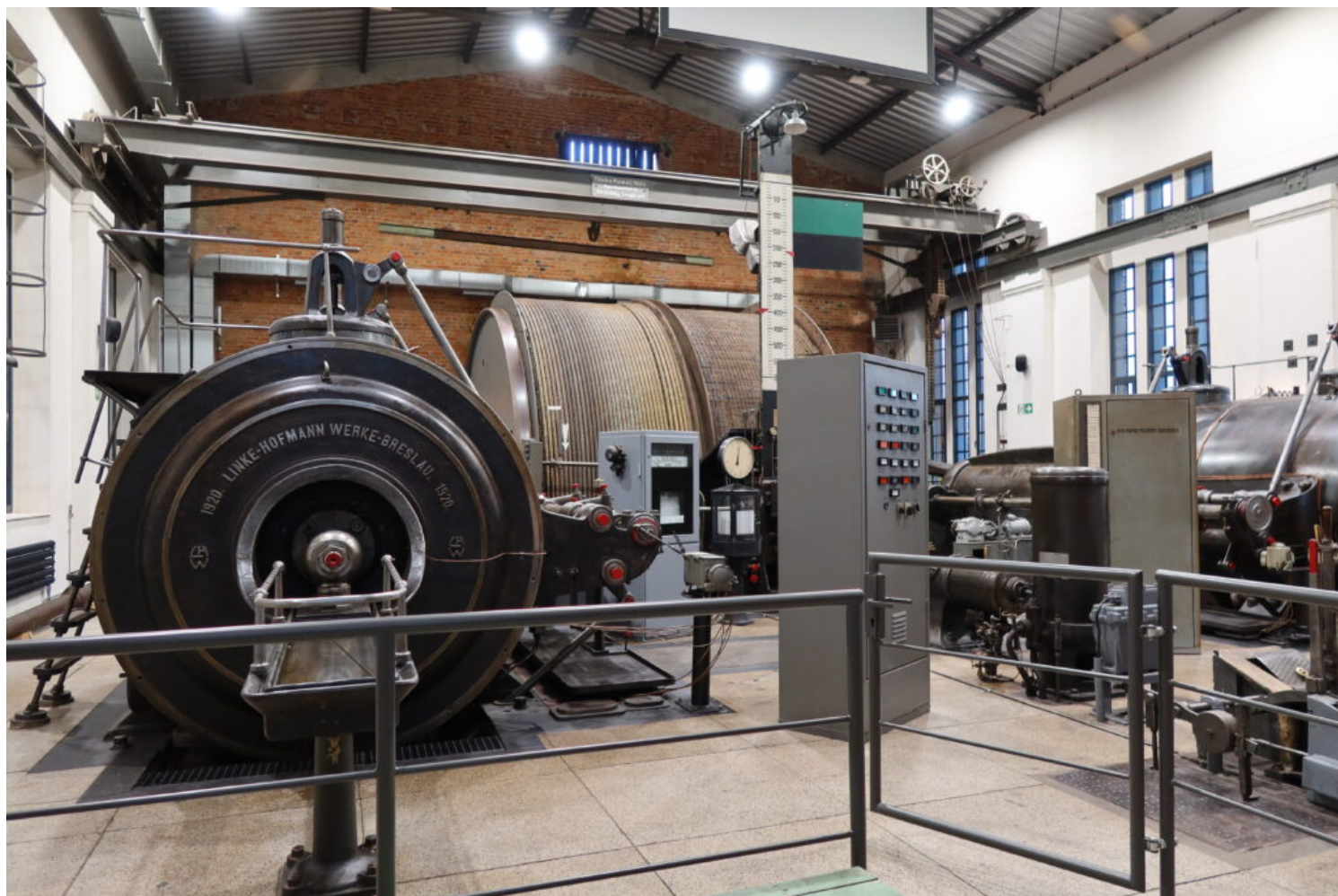
Kategoria zabytków techniki, laureat Zabytkowa Kopalnia Ignacy w Rybniku, fot. NID/ ZZ OT Katowice