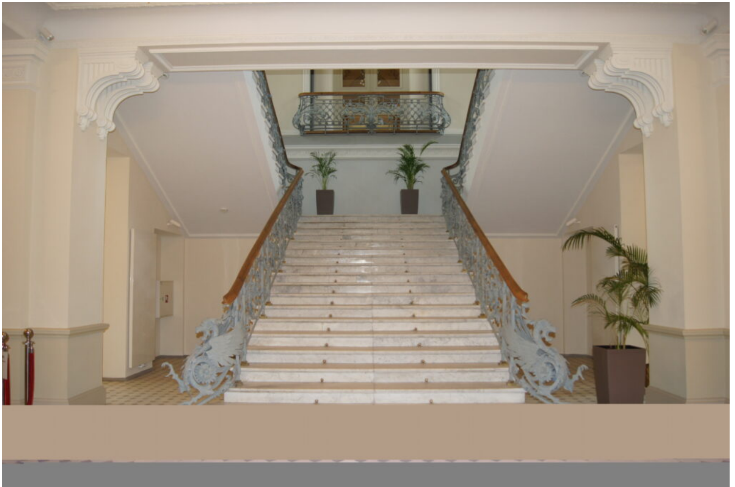
Kategoria utrwalenia wartości zabytkowej obiektu, laureat Miasto Nowy Dwór Mazowiecki

Wyróżnienia w kategorii utrwalenia wartości zabytkowej obiektu przyznano: