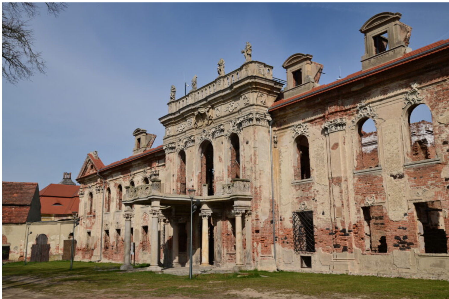
Kategoria rewaloryzacji przestrzeni kulturowej i krajobrazu, wyróżnienie Gmina Twardogóra