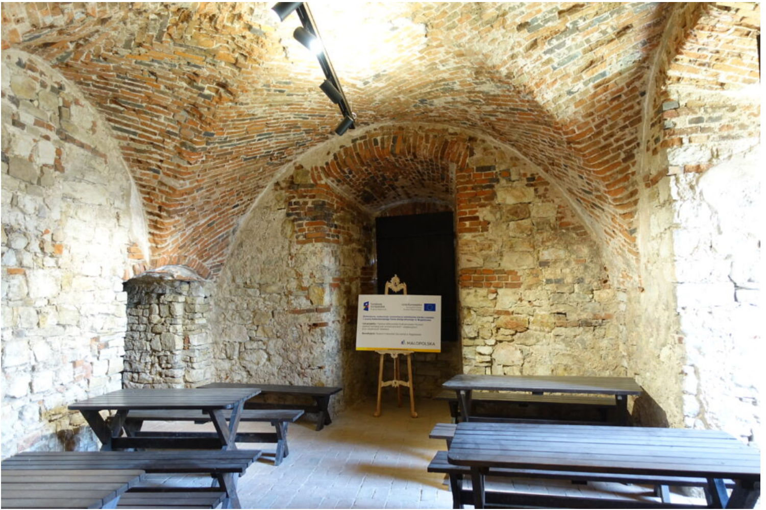
Kategoria rewaloryzacji przestrzeni kulturowej i krajobrazu, wyróżnienie Muzeum Małopolski Zachodniej w Wygiełzowie