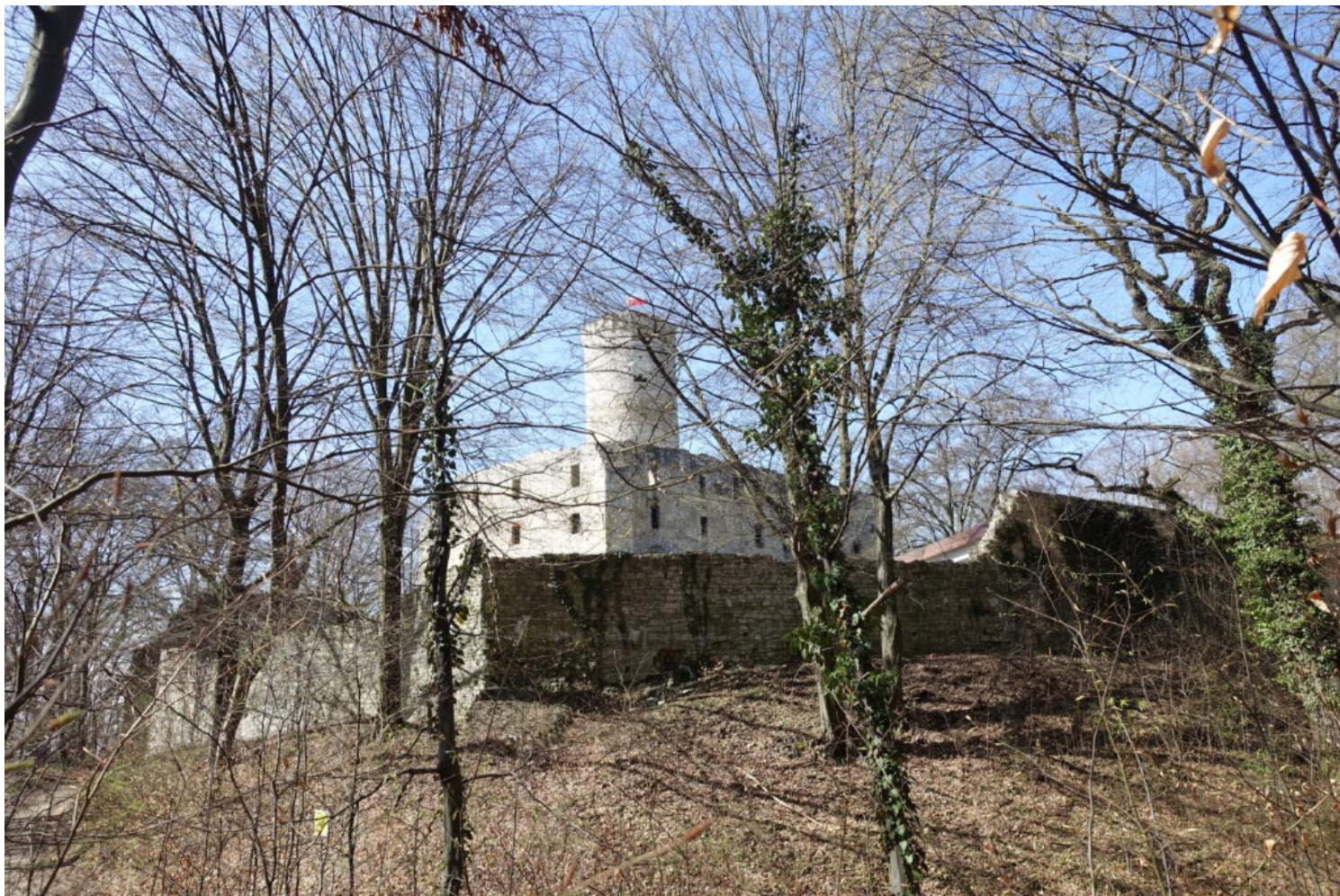
Kategoria rewaloryzacji przestrzeni kulturowej i krajobrazu, wyróżnienie Muzeum Małopolski Zachodniej w Wygiełzowie