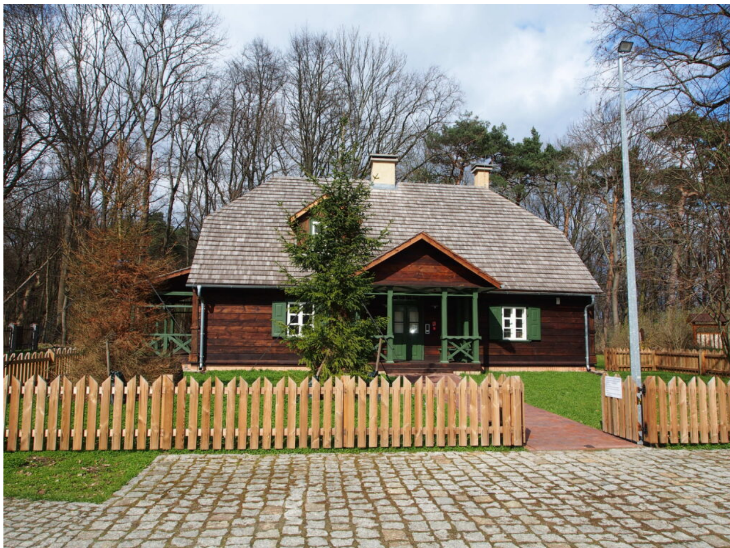
Kategoria architektury i budownictwa drewnianego, wyróżnienie Lasy Miejskie - Warszawa