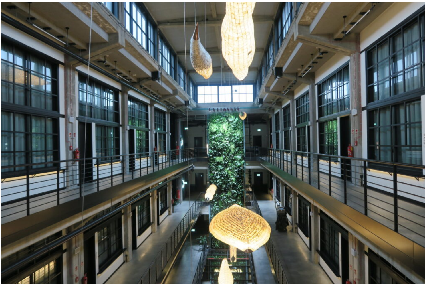
Kategoria adaptacji obiektów zabytkowych, laureat Euro Styl Montownia - Spółka z ograniczoną odpowiedzialnością

Wyróżnienia w kategorii adaptacji obiektów zabytkowych przyznano: