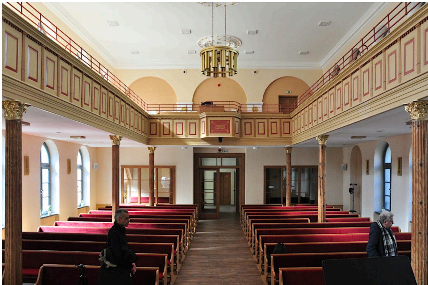
Kategoria utrwalenia wartości zabytkowej obiektu, wyróżnienie Zbór w Szczecinie Kościoła Chrześcijan Baptystów Rzeczypospolitej Polskiej