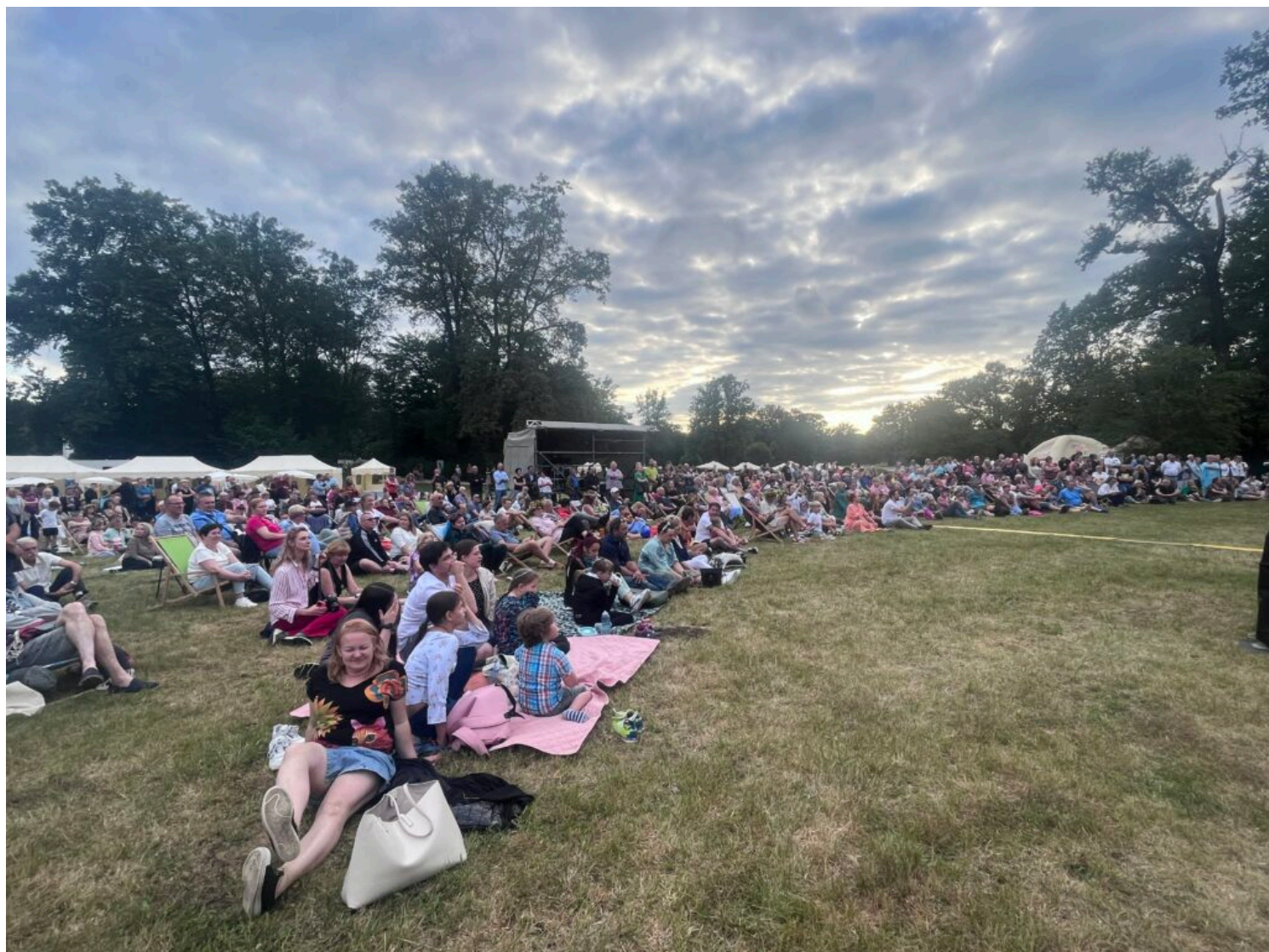
widownia podczas koncertu symfonicznego w wykonaniu Filharmonii Zielonogórskiej