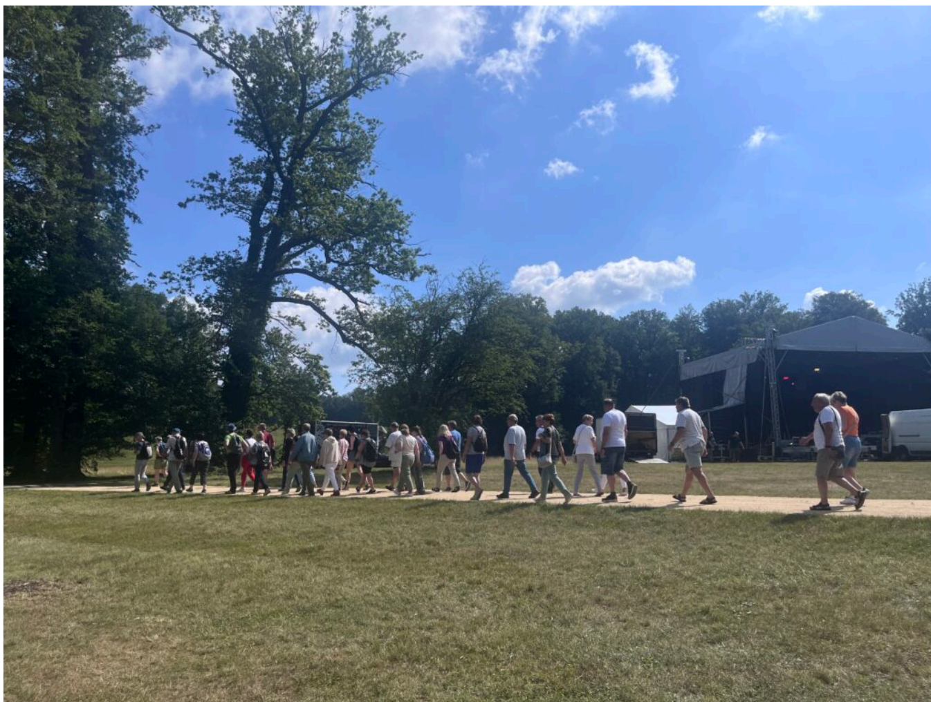
oprowadzanie z Przewodnikami Mużakowskimi