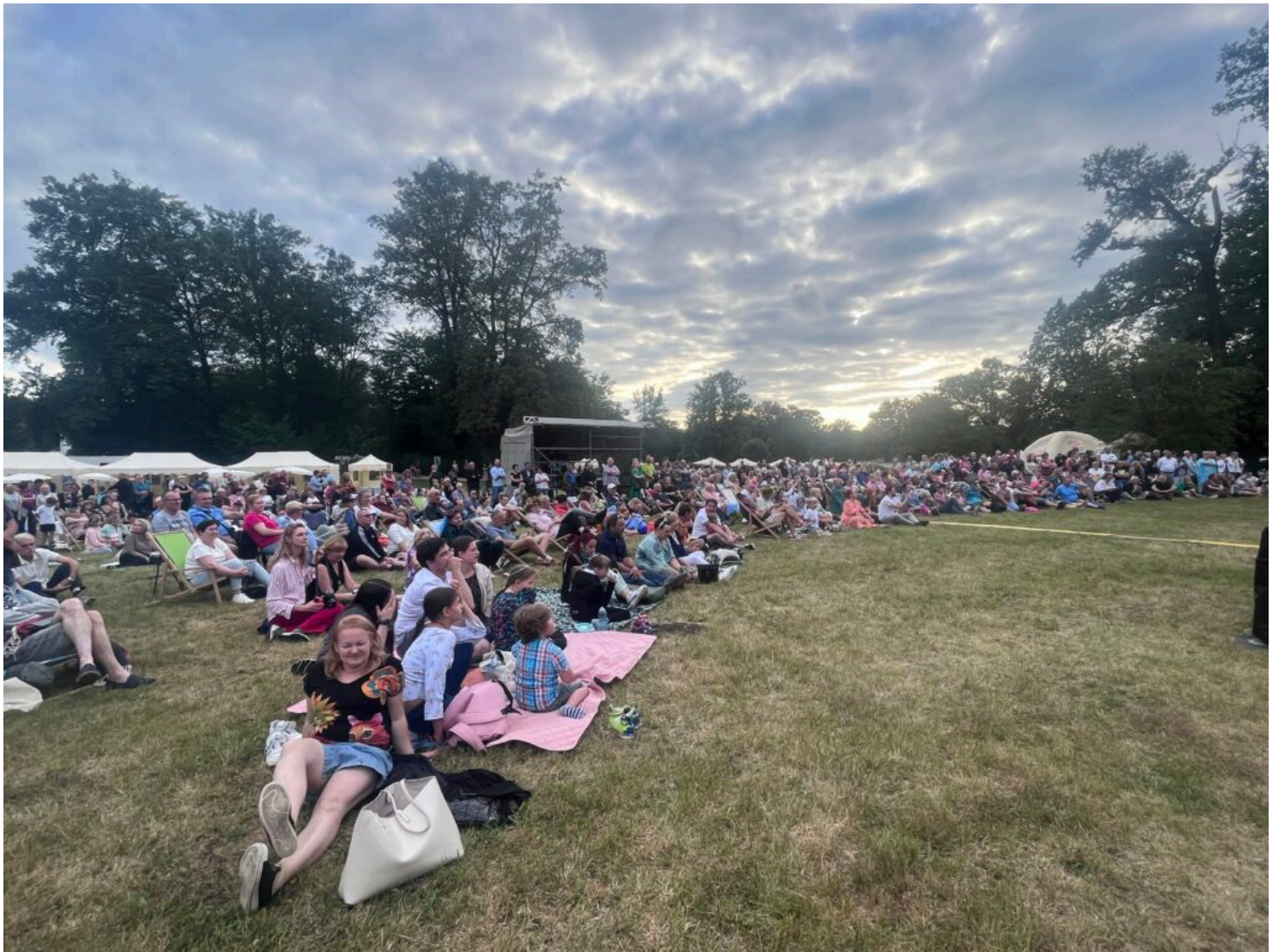
widownia podczas koncertu symfonicznego w wykonaniu Filharmonii Zielonogórskiej