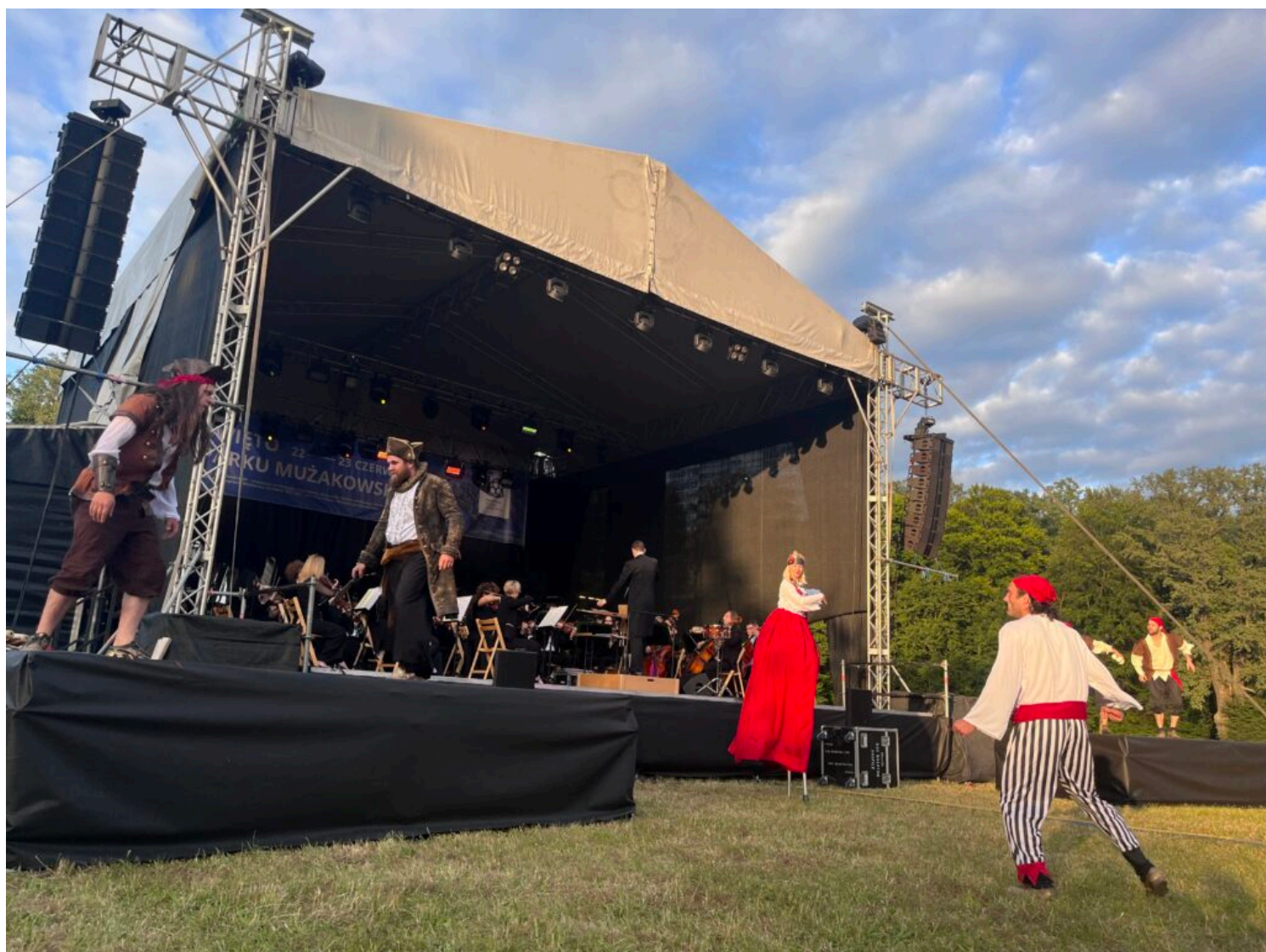
koncert Filharmonii Zielonogórskiej, fot. NID/Magdalena Karpińska