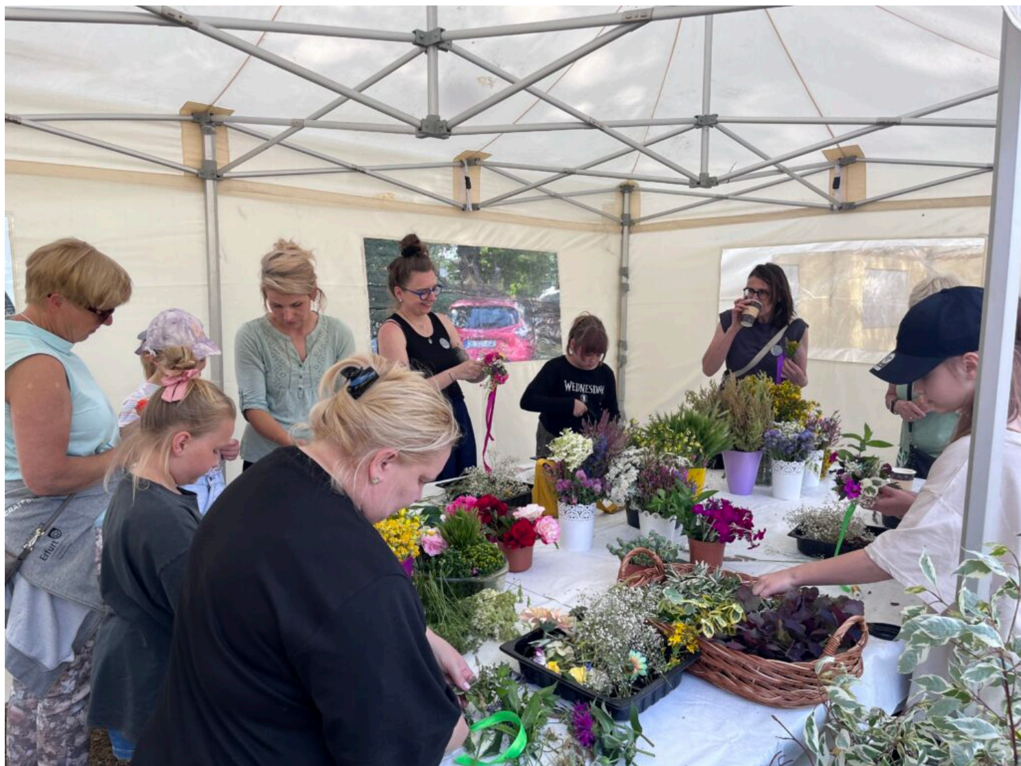
warsztaty z plecenia wianków

23 czerwca Park Mużakowski odwiedziło Lubuskie Centrum Produktu Regionalnego , które oferowało gościom m.in. lody rzemieślnicze czy produkty i warsztaty pszczelarskie. W trakcie obydwu dni, na najmłodszych uczestników czekali animatorzy, którzy zadbali, aby nie było czasu na nudę. W strefie zabaw przygotowane były wielkoformatowe klocki, przeciągnięte liny, zawody, malowanie twarzy i wiele innych.