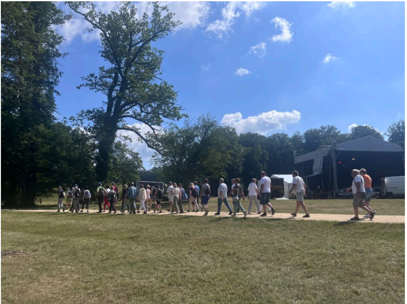
oprowadzanie z Przewodnikami Mużakowskimi