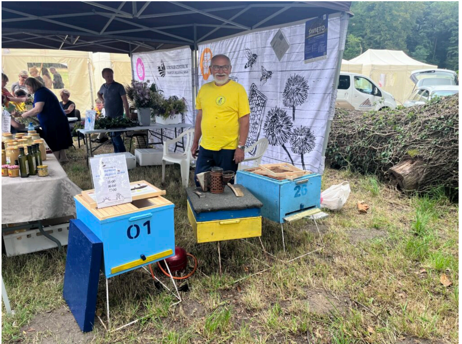
warsztaty pszczelarskie