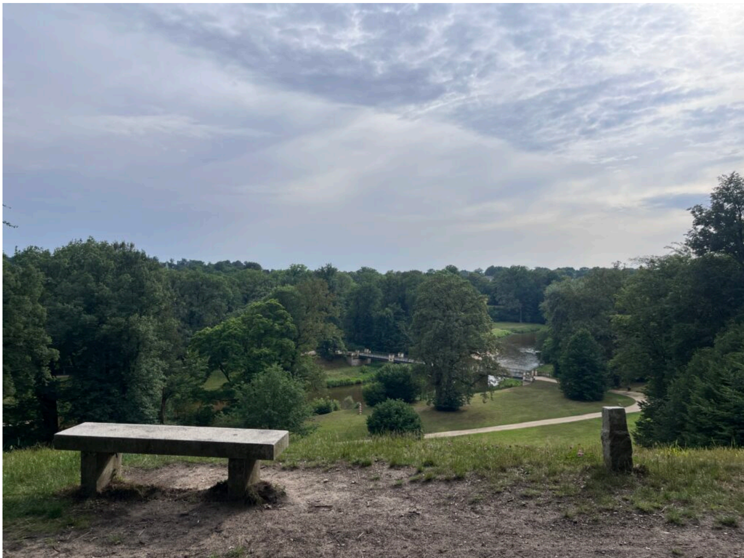
Park Mużakowski

Zachęcamy do śledzenia naszego Facebooka i Instagrama , aby być na bieżąco z nowymi wydarzeniami w Parku Mużakowskim.