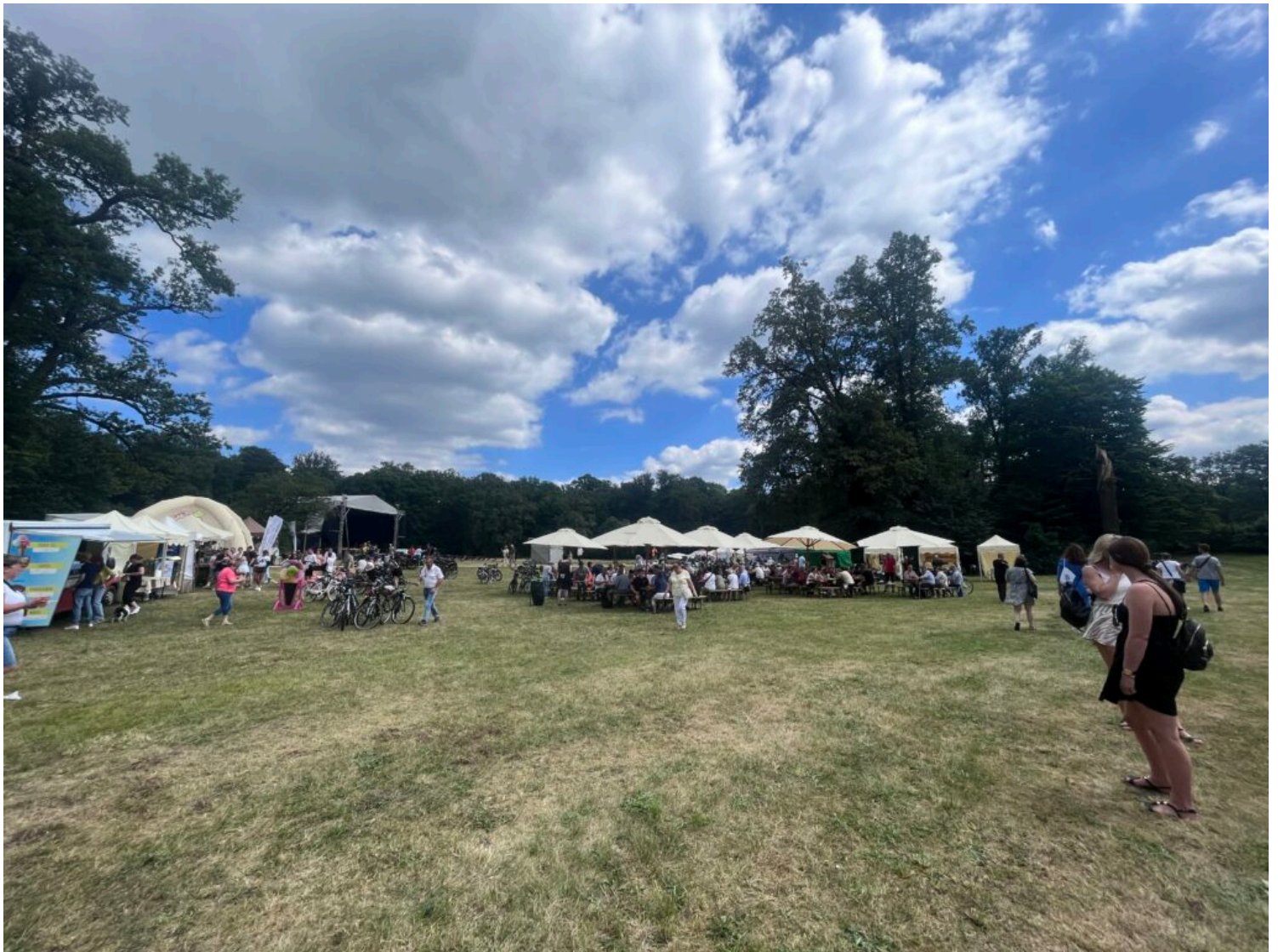
strefa piknikowa podczas Święta Parku Mużakowskiego, fot. NID/Magdalena Karpińska