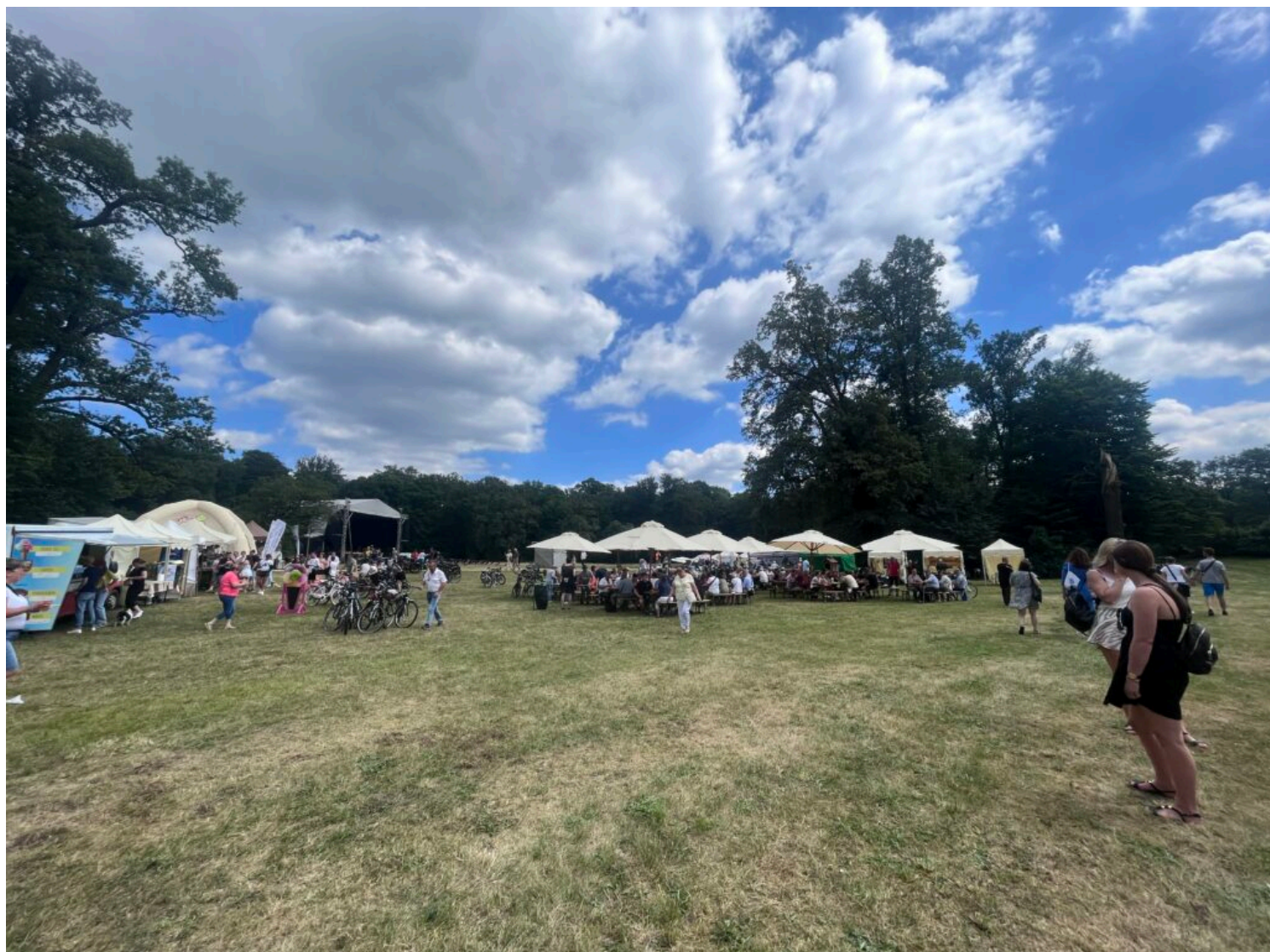
strefa piknikowa podczas Święta Parku Mużakowskiego