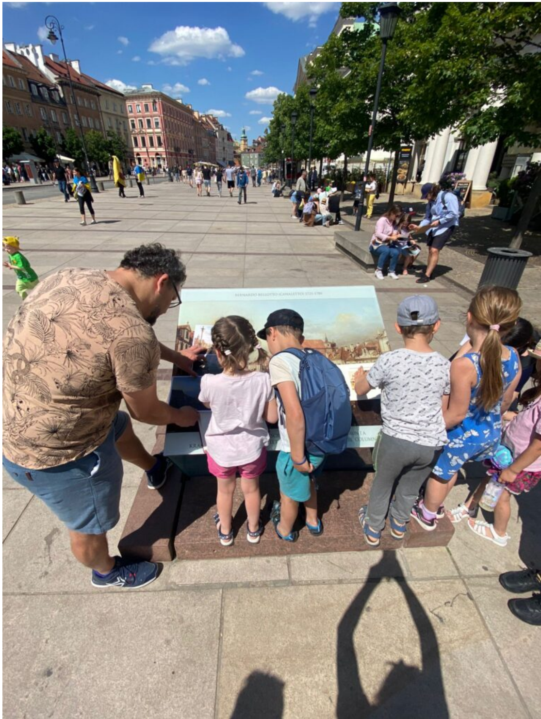
„Odkrywamy tajemnice Traktu Królewskiego” - spacer w ramach obchodów MDOZ 2024