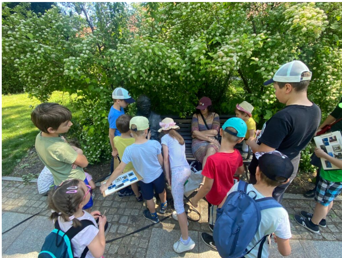
„Odkrywamy tajemnice Traktu Królewskiego” - spacer w ramach obchodów MDOZ 2024, fot. NID/ Patrycja Jastrzębska