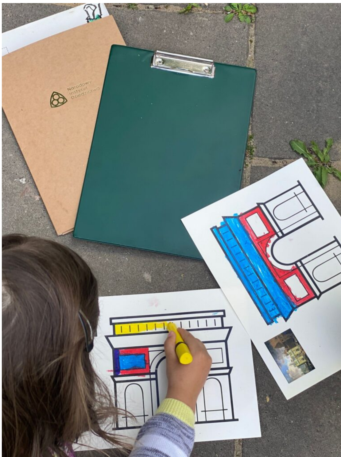
„Odkrywamy tajemnice Traktu Królewskiego” - spacer w ramach obchodów MDOZ 2024