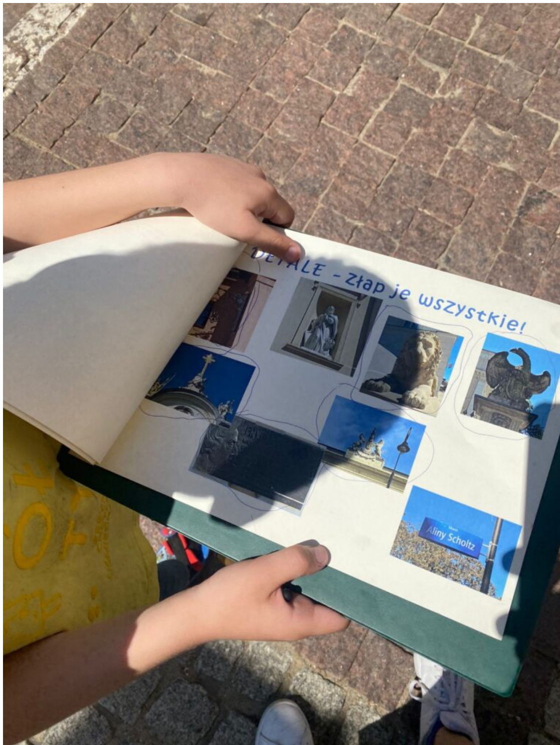
„Odkrywamy tajemnice Traktu Królewskiego” - spacer w ramach obchodów MDOZ 2024