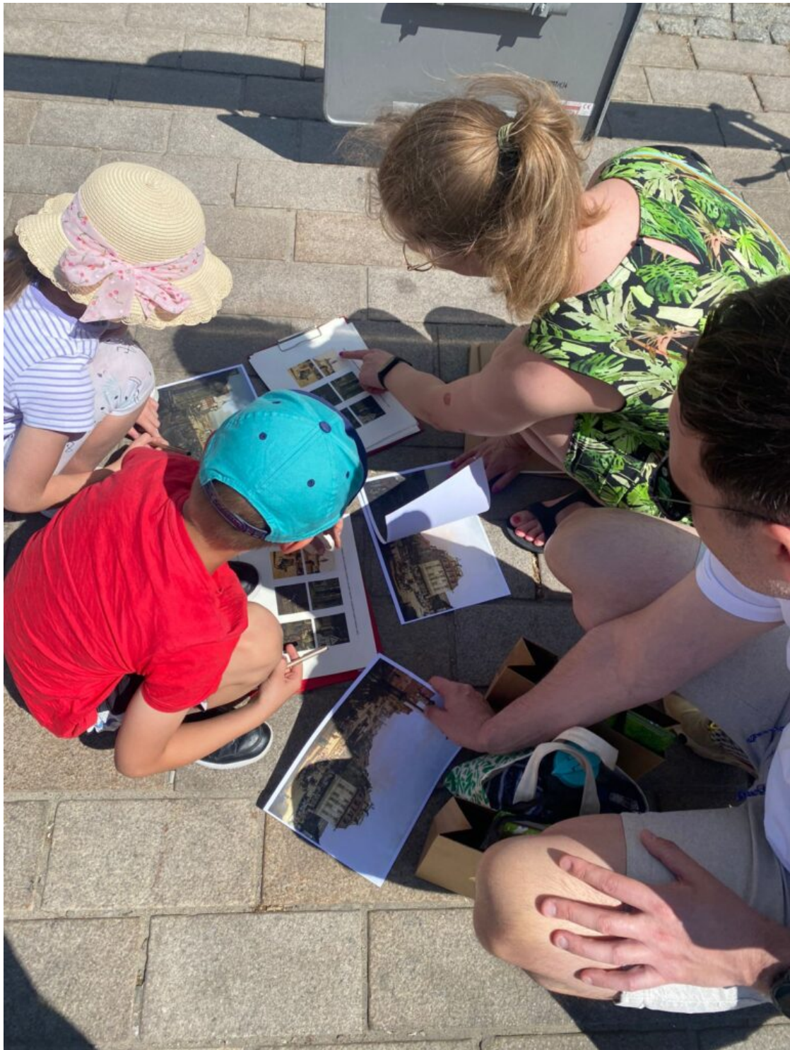
„Odkrywamy tajemnice Traktu Królewskiego” - spacer w ramach obchodów MDOZ 2024