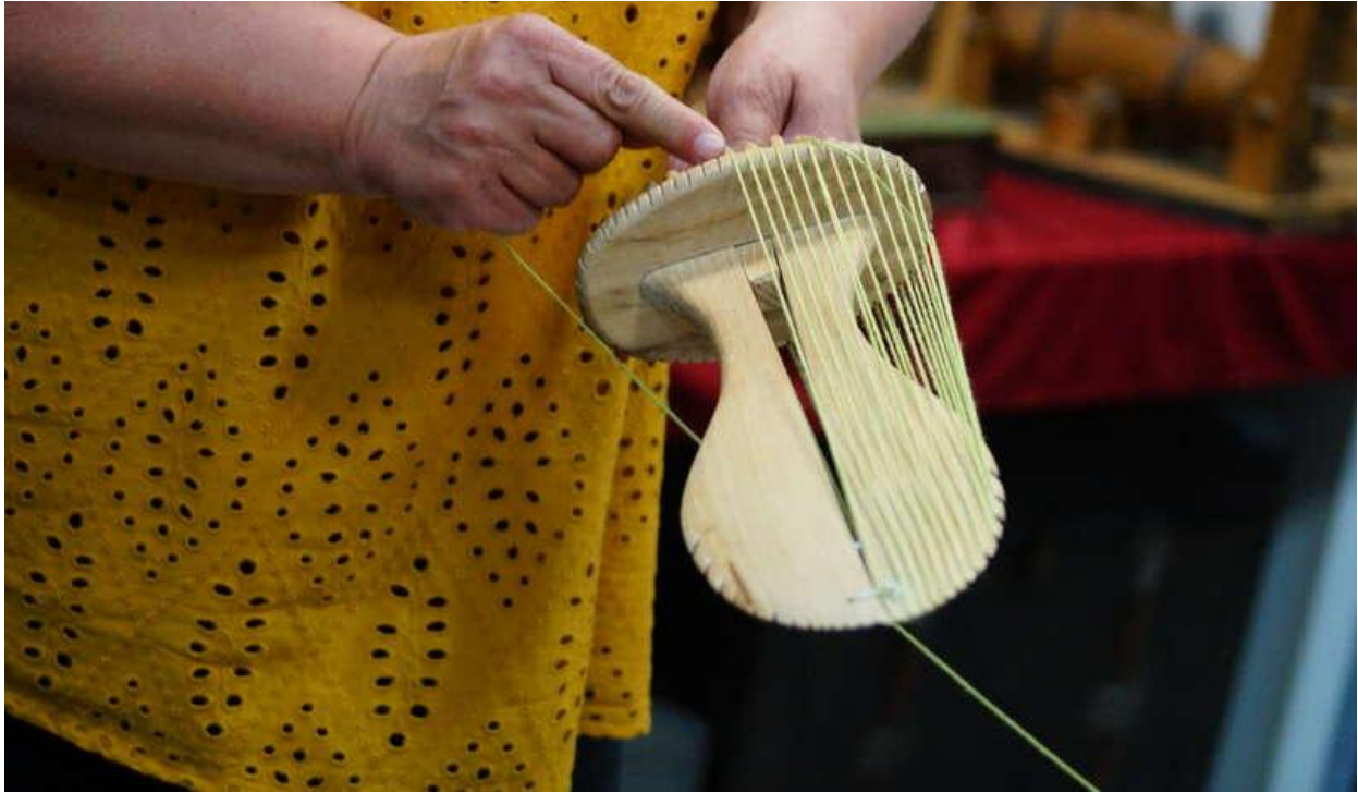
Tkanie rękawicy furmańskiej