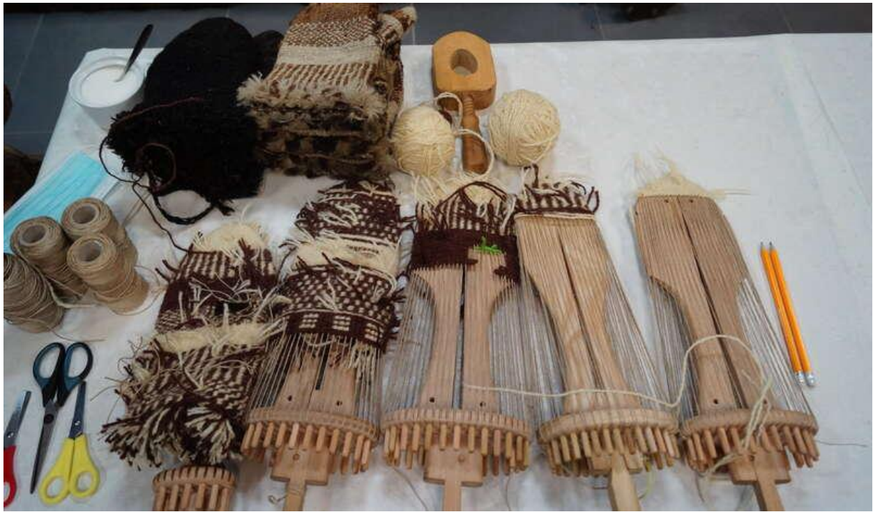
Proces tkania rękawic furmańskich

Rękawice wykonywane są z wełny polskich owiec górskich odmiany barwnej (tzw. czarnych owiec), dzięki czemu są sprężyste, wytrzymałe, a ich wełna nie wymaga farbowania, co zapobiega odbarwieniom i plamom od wody. Tkane są na drewnianych formach, na które naciąga się osnowę, a wątek przeplata wokół niej. Niezwiązane końcówki wełny pozostają wewnątrz rękawicy, tworząc warstwę izolacyjną. Wzory rękawic zależą od umiejętności tkacza, a niektóre z nich są wykończone frędzlami.