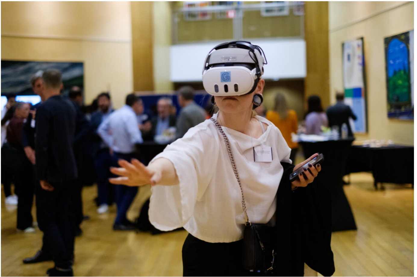
Europejska kampania „ALL DIGITAL Weeks 2024” w Brukseli, prezentacja zespołu kolegiaty pw. św. Marcina Biskupa w Opatowie