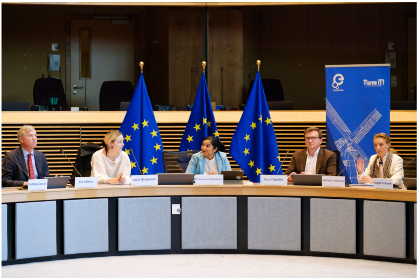
Europejska kampania „ALL DIGITAL Weeks 2024” w Brukseli, prezentacja zespołu kolegiaty pw. św. Marcina Biskupa w Opatowie, fot. Europeana EU