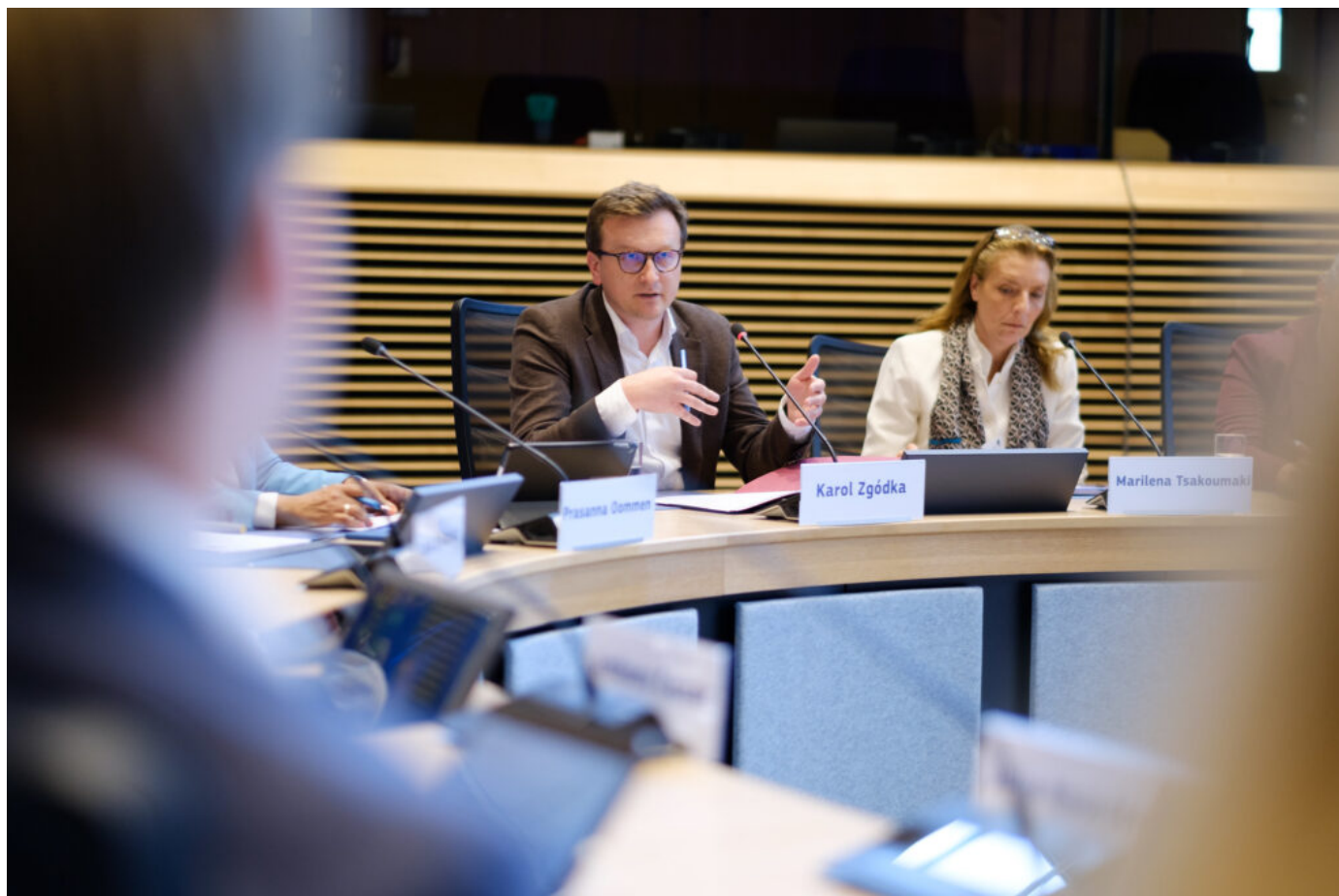
Europejska kampania „ALL DIGITAL Weeks 2024” w Brukseli, prezentacja zespołu kolegiaty pw. św. Marcina Biskupa w Opatowie, fot. Europeana EU