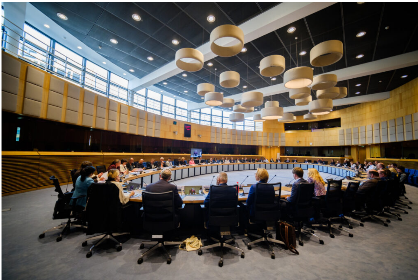
Europejska kampania „ALL DIGITAL Weeks 2024” w Brukseli, prezentacja zespołu kolegiaty pw. św. Marcina Biskupa w Opatowie, fot. Europeana EU