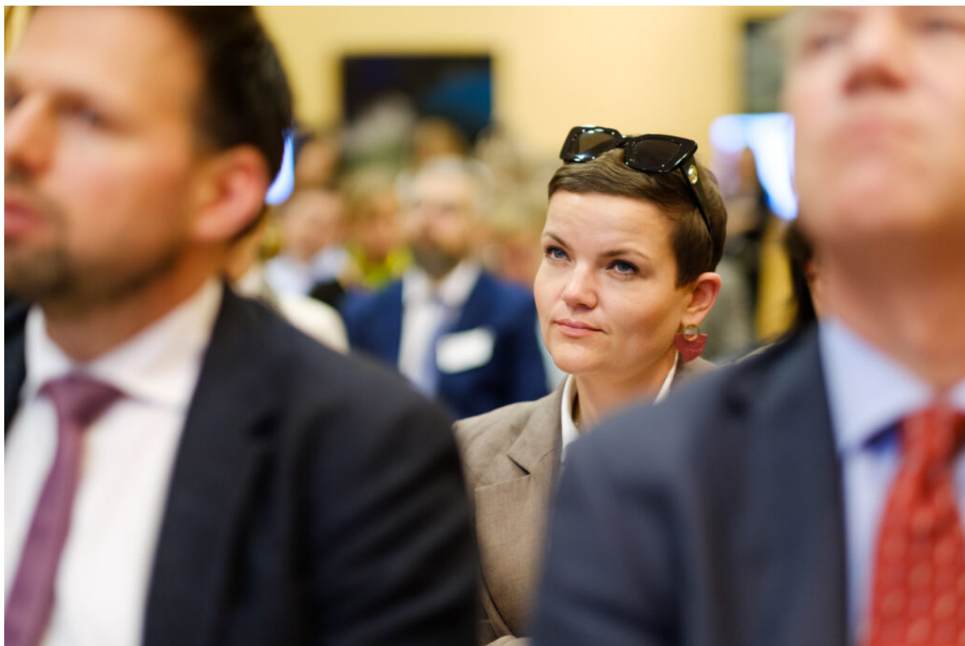
Europejska kampania „ALL DIGITAL Weeks 2024” w Brukseli, prezentacja zespołu kolegiaty pw. św. Marcina Biskupa w Opatowie, fot. Europeana EU