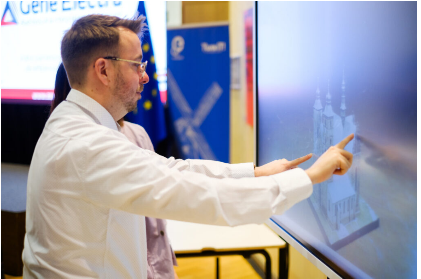
Europejska kampania „ALL DIGITAL Weeks 2024” w Brukseli, prezentacja zespołu kolegiaty pw. św. Marcina Biskupa w Opatowie