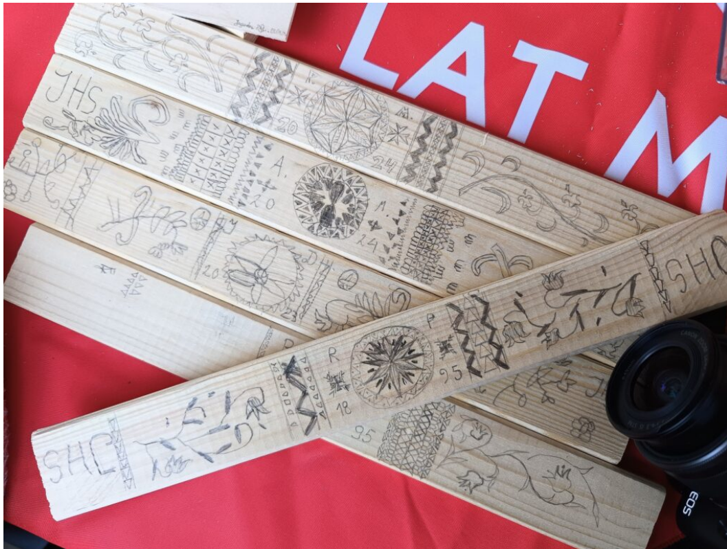
warsztaty stylu zakopiańskiego dla dzieci, obchody MDOZ 2024 w Zakopanem