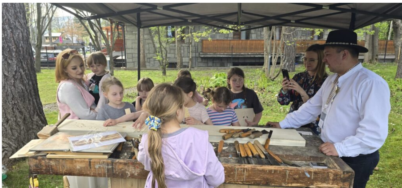
warsztaty snycerskie, obchody MDOZ 2024 w Zakopanem, fot. NID/ Anna Dzwolak