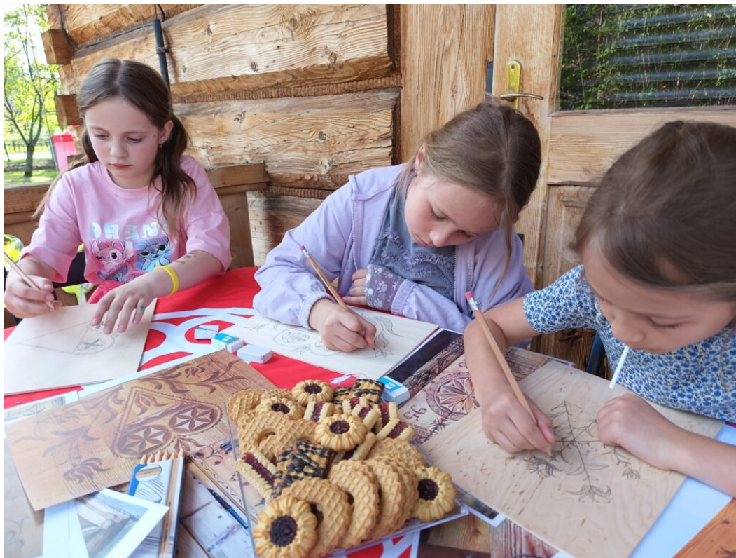
warsztaty dla dzieci, obchody MDOZ 2024 w Zakopanem

Organizacja obchodów Międzynarodowego Dnia Ochrony Zabytków została sfinansowana ze środków Ministra Kultury i Dziedzictwa Narodowego.