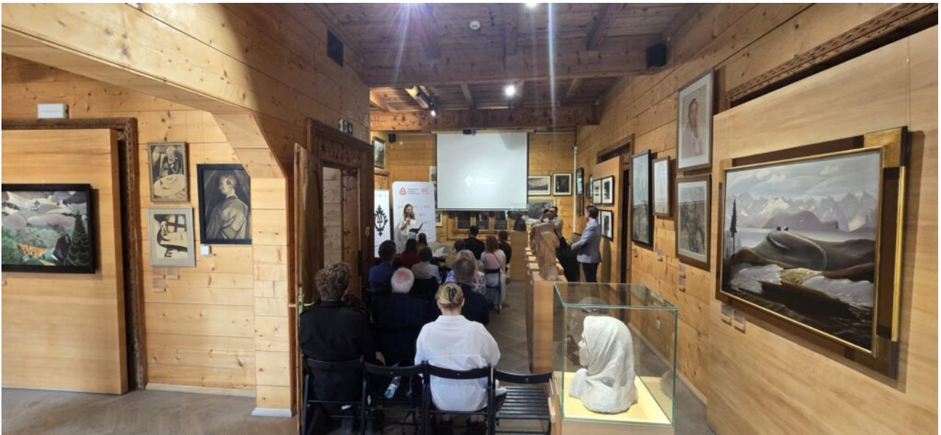
obchody MDOZ 2024 w Zakopanem