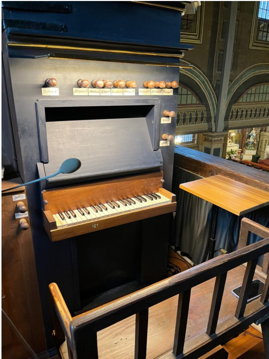
organy w kościele Matki Bożej Bolesnej w Mariańskim Porzecczu