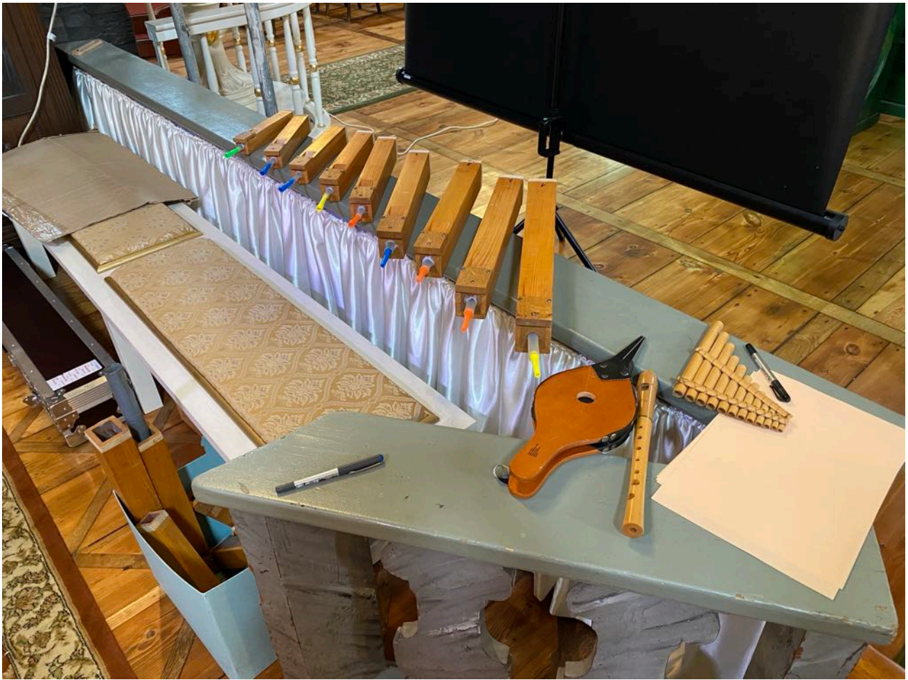
prezentacja zabytkowych organów dla najmłodszych, MODZ 2024 w Mariańskim Porzeczcu, fot. NID/ dr hab. Monika Bogdanowska