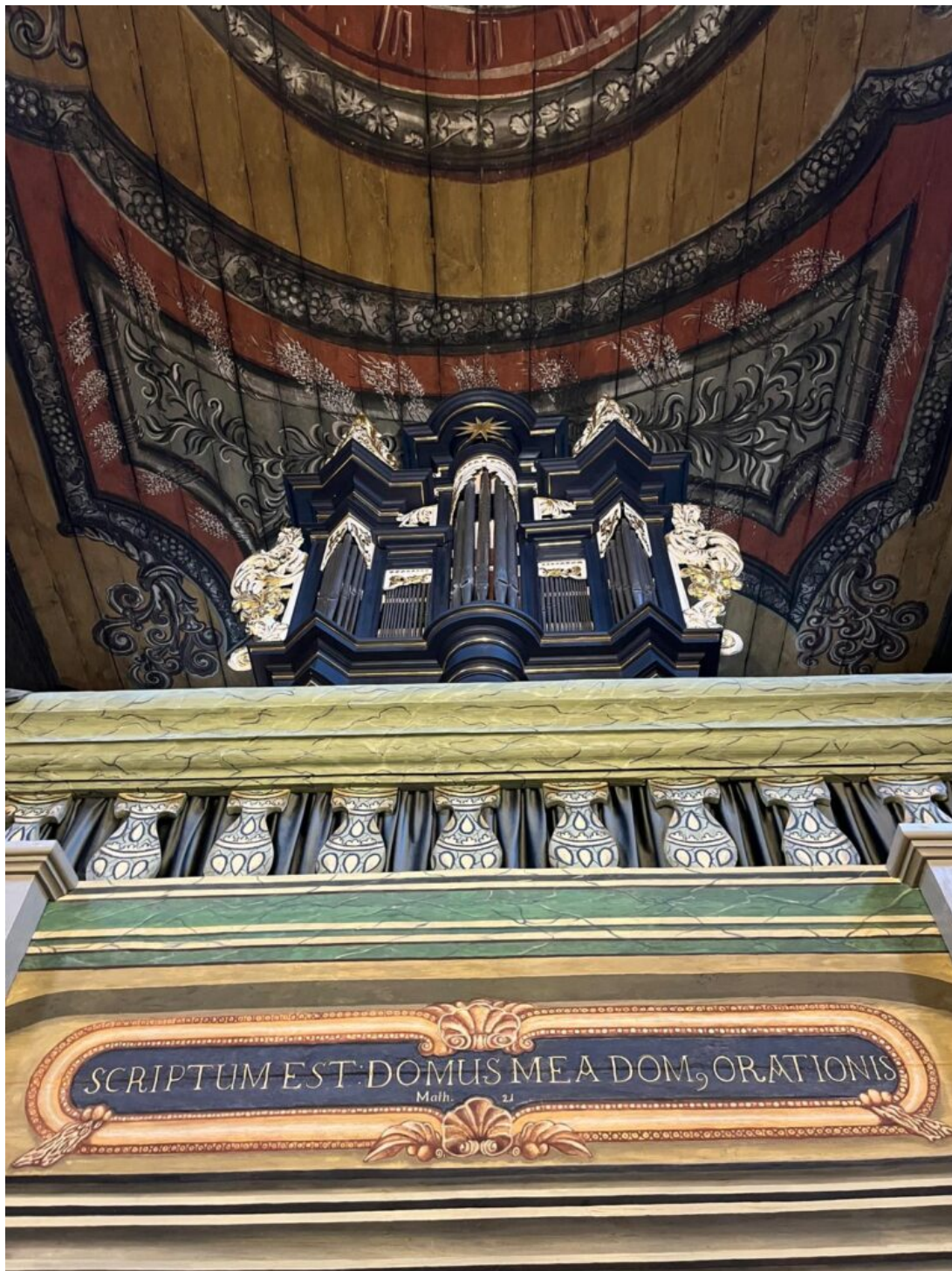
organy w kościele Matki Bożej Bolesnej w Mariańskim Porzeczcu