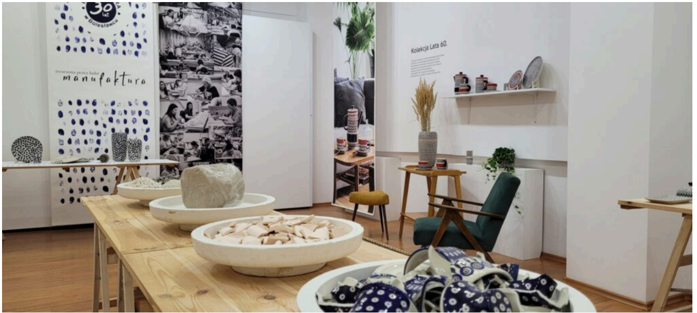
Bolesławiec - ceramika, fot. Muzeum Ceramiki w Bolesławcu