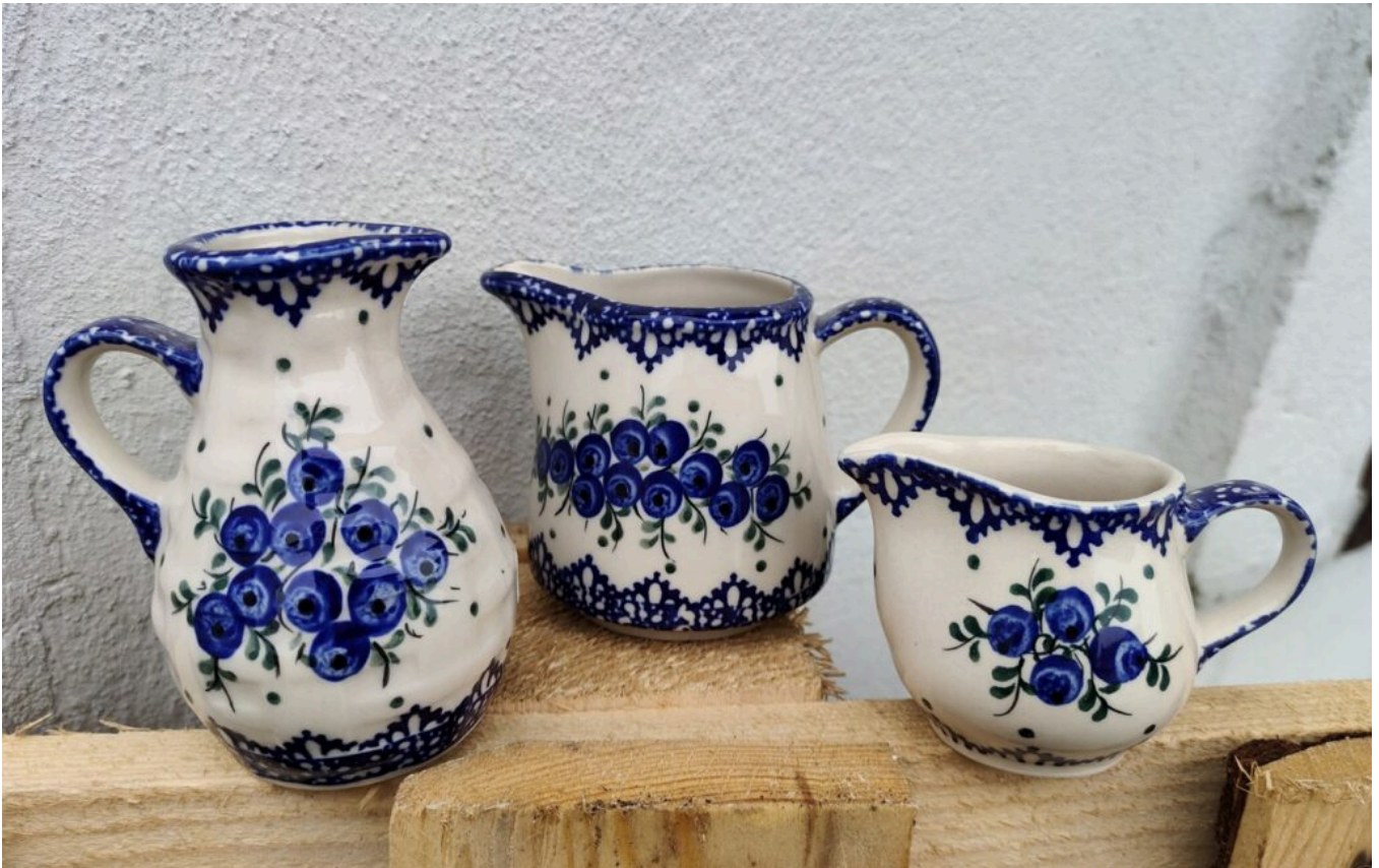
Bolesławiec - ceramika