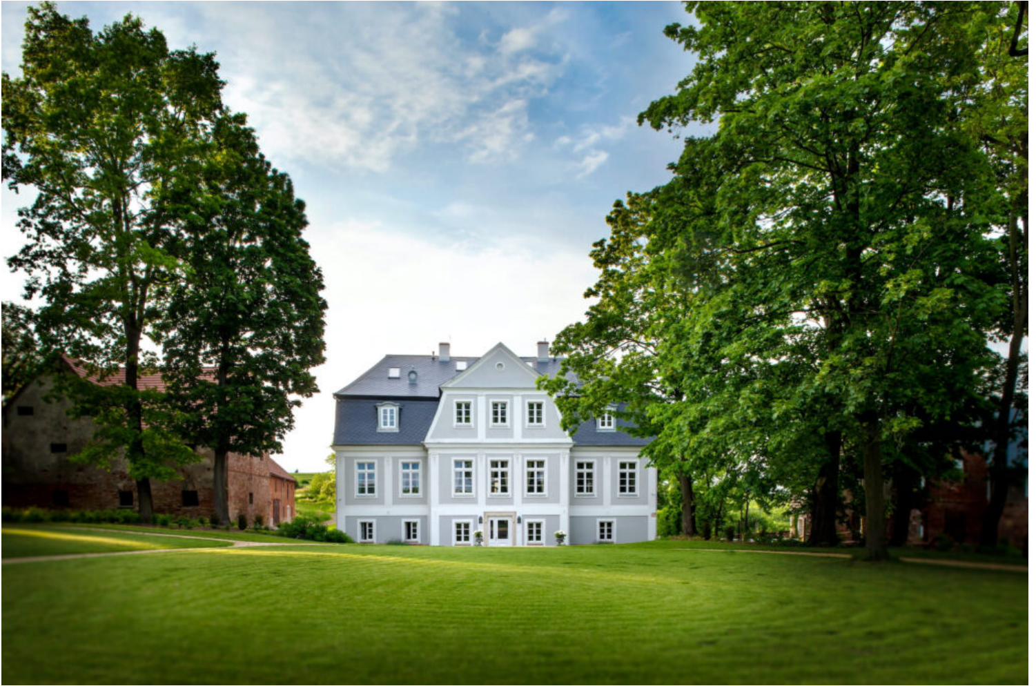
fot. Pałac Kamieniec