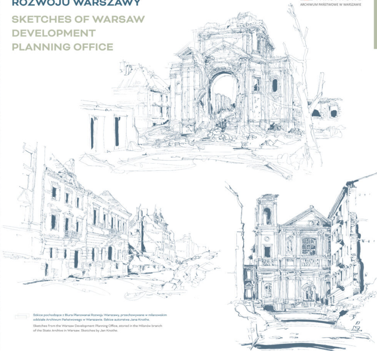
Szkice pochodzące z Biura Planowania Rozwoju Warszawy, przechowywane w milanowskim oddziale Archiwum Państwowego w Warszawie. Szkice autorstwa Jana Knothe. Sketches from the Warsaw Development Planning Office, stored in the Milanów branch of the State Archive in Warsaw. Sketches by Jan Knothe.

ARCHIWA PAŃSTWOWE ARCHIWUM PAŃSTWOWE W WARSZAWIE