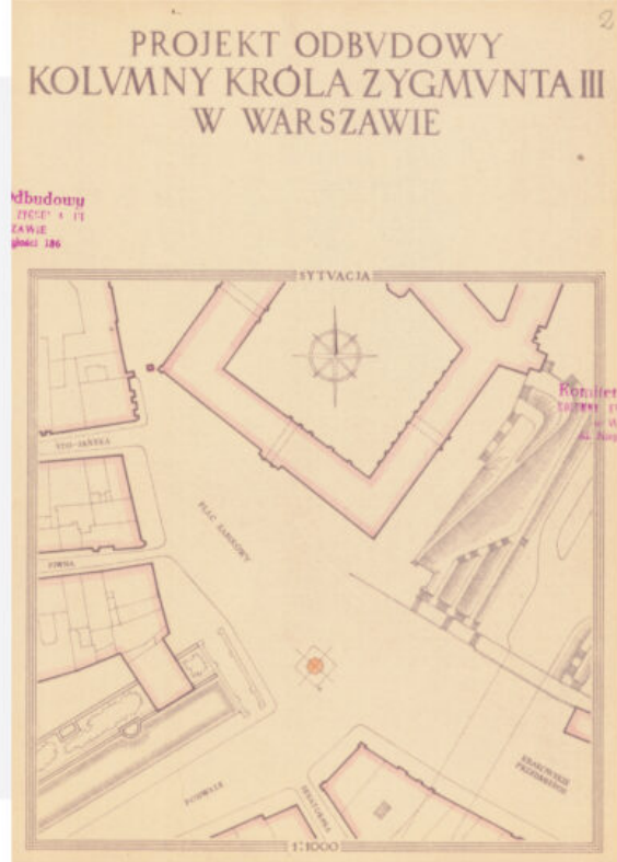
Schemat rekonstrukcyjny i projekt schodów Kolumny Zygmunta Structural Diagram and design for the steps for Sigismund's Column