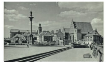
Kolumna Zygmunta, w tle odbudowane Stare Miasto, po 1950 Sigismund's Column with the rebuilt Old Town in the background, post-1950