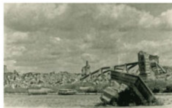
Plac Zamkowy, 1945 r. Castle Square, 1945