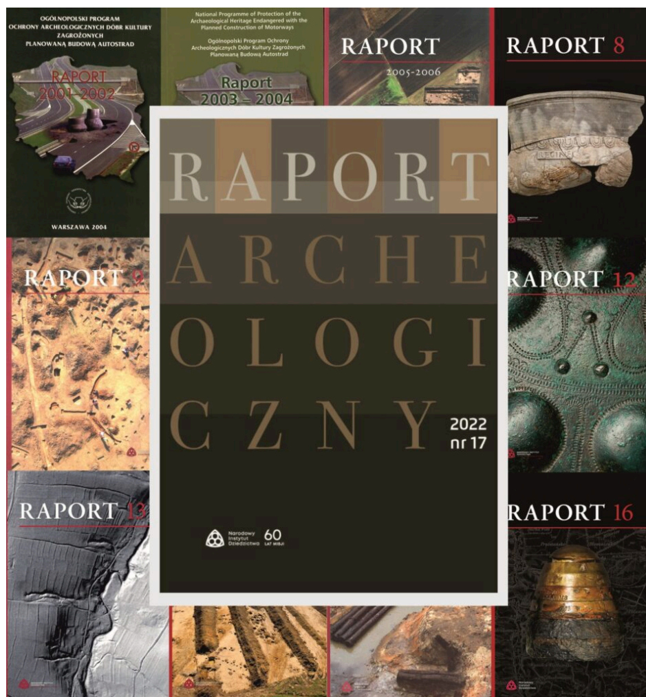
Raport Archeologiczny nr 17, wyd. Narodowy Instytut Dziedzictwa 2022 r.

Prosimy o zapoznanie się z warunkami publikacji na stronie czasopisma raportarcheologiczny.nid.pl oraz nadsyłanie tekstów na adres redakcji raport@nid.pl lub jwrzosek@nid.pl .