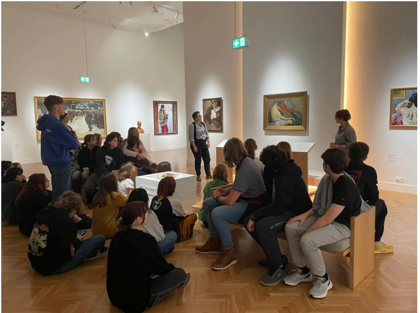
3xP perspektywa; proporcja; przestrzeń - zajęcia październikowe NID4TEENS