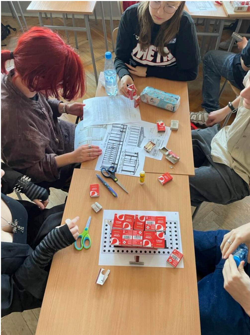
Od zigguratu do gotyckiej katedry - styczniowe zajęcia NID4TEENS