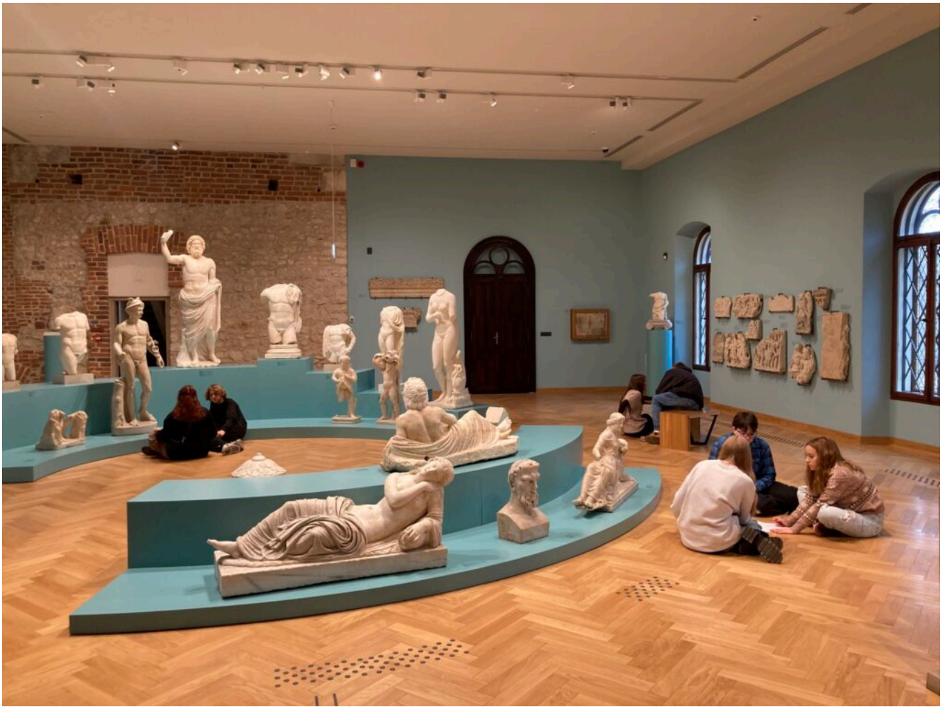
Lepiej jest mieć piękne ciało niż piękny umysł - zajęcia grudniowe NID4TEENS