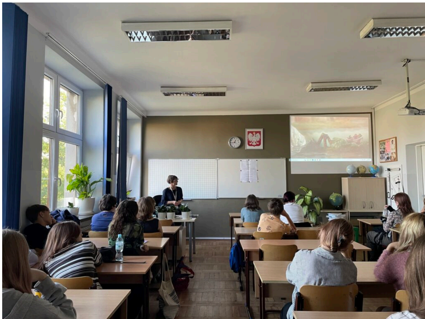
Narodziny zabytku, czyli o czym nam może opowiedzieć Czas - zajęcia wrześniowe NID4TEENS