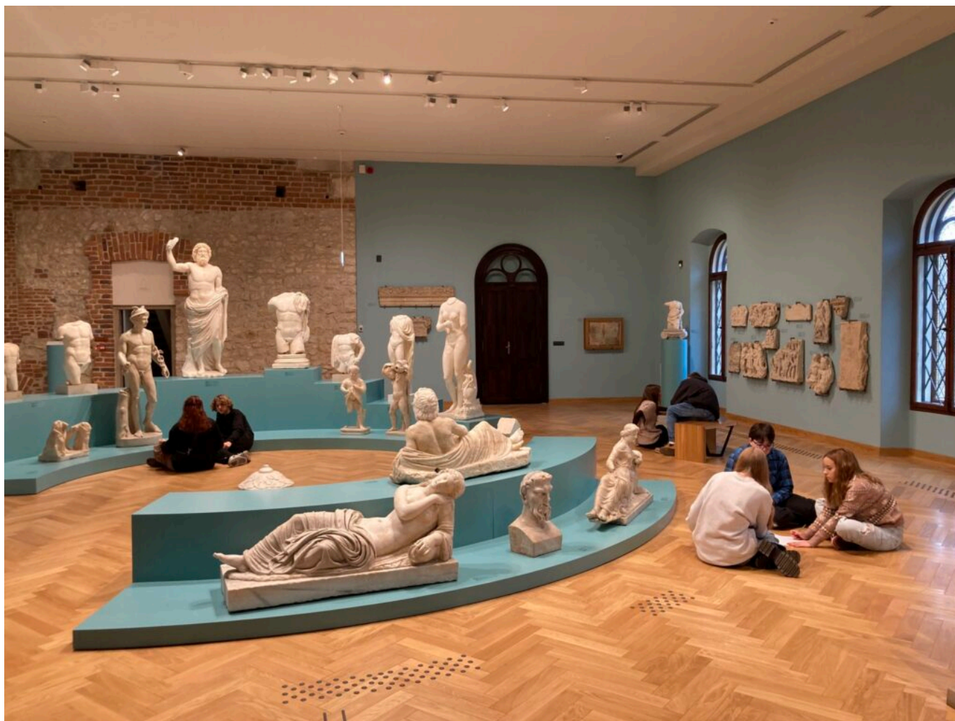
Lepiej jest mieć piękne ciało niż piękny umysł - zajęcia grudniowe NID4TEENS