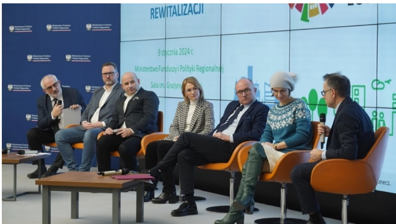
Seminarium Forum Rozwoju Lokalnego, udostępnione dzięki uprzejmości Ministerstwa Funduszy i Polityki Regionalnej, fot. P. Żurek

Pełna relacja i nagranie z 45. Seminarium Forum Rozwoju Lokalnego „Porozmawiajmy o rewitalizacji” są dostępne na stronach FRL oraz Związku Miast Polskich .