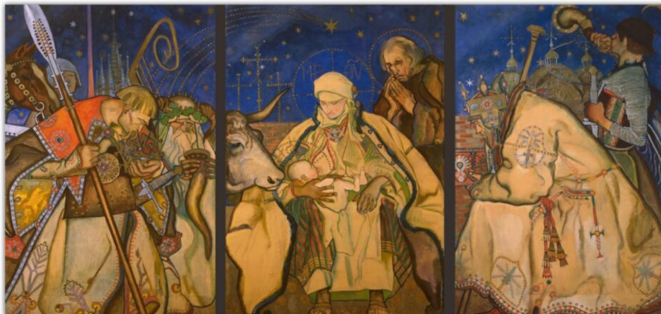
Kazimierz Sichulski "Pokłon trzech króli", tryptyk, 1913 r.

Do dziś praktykowany jest zwyczaj okadzania domu specjalnie poświęconym kadzidłem. Zwyczaj ten ma na celu zapewnienie ochrony przed nieszczęściami i chorobami. W okolicach Przeworska 6 stycznia święcono również czosnek i cebulę. Służyły one później do nacierania rąk i nóg osobom cierpiącym na reumatyzm.