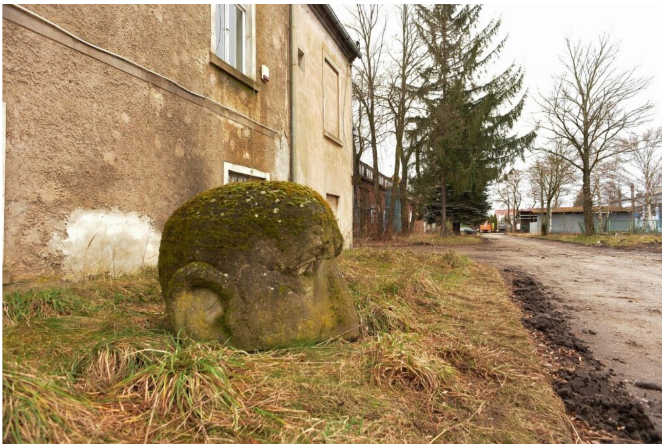
Chocianów, Fabryka Urządzeń Mechanicznych CHOFUM. Rzeźba plenerowa, przedstawiająca ludzką głowę na tle fasady dawnego budynku dyrekcji, 2023 r.