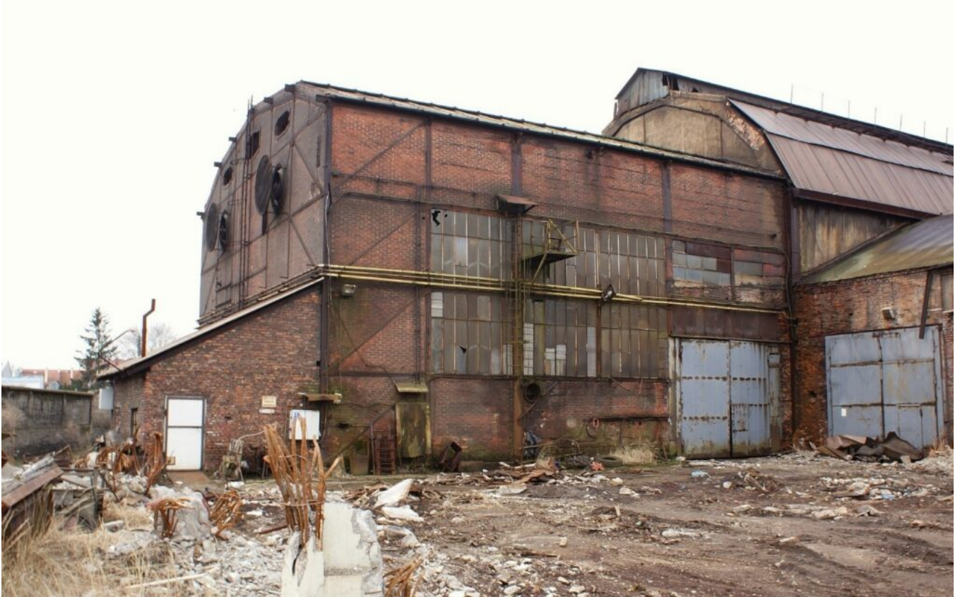
Chocianów, Fabryka Urządzeń Mechanicznych CHOFUM. Fragment hali odlewni w południowo-wschodniej części zakładu. Widok od północnego wschodu, 2023 r.