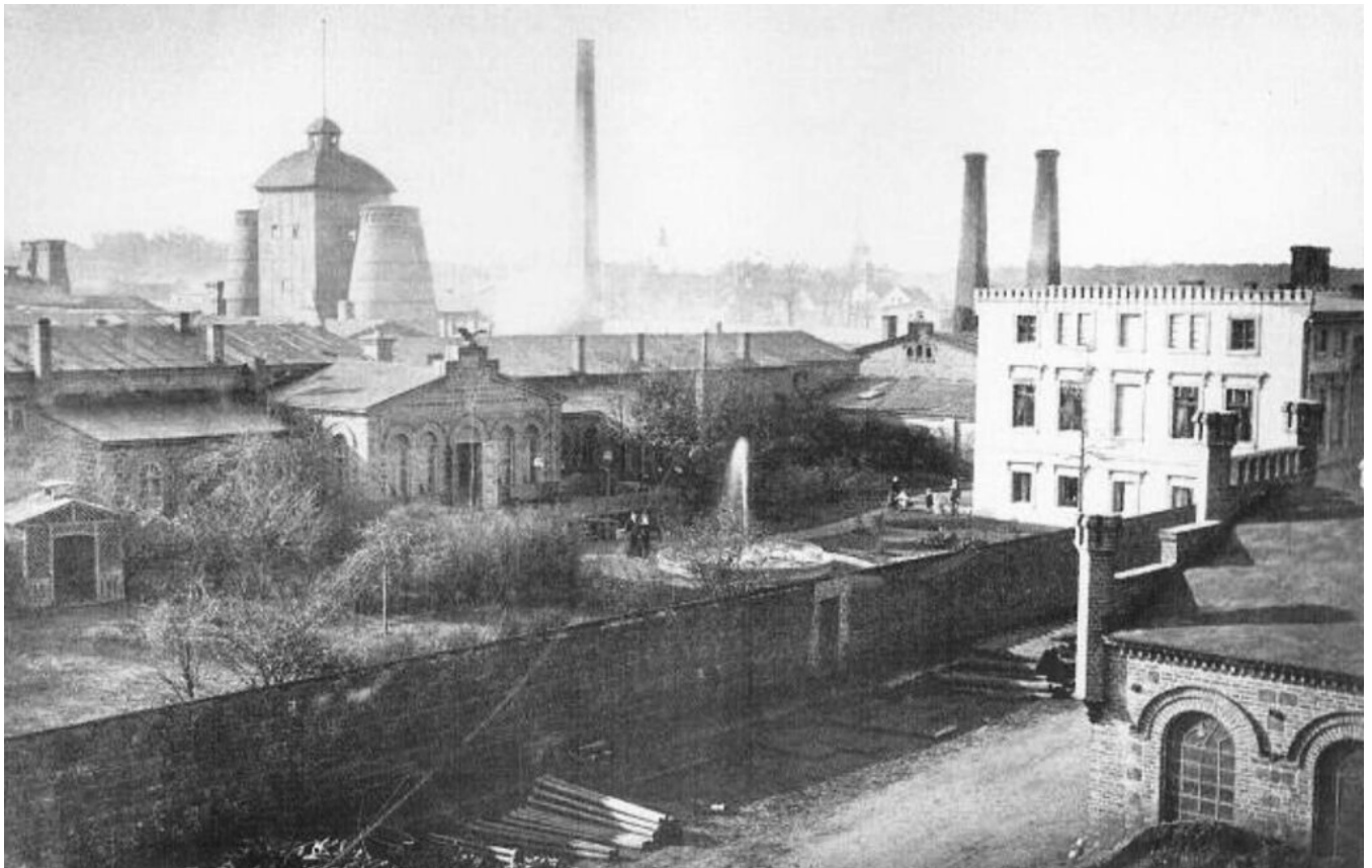
Huta „Maria” (Marienhütte) w Chocianowie, najstarsze zdjęcie zakładu. W głębi, za budynkami biurowymi widać parę charakterystycznych pieców hutniczych i obsługującą je wieżę wyciągową.

Przygotowano na podstawie opracowania mgr. Piotra Roczka, Oddział Terenowy NID we Wrocławiu.