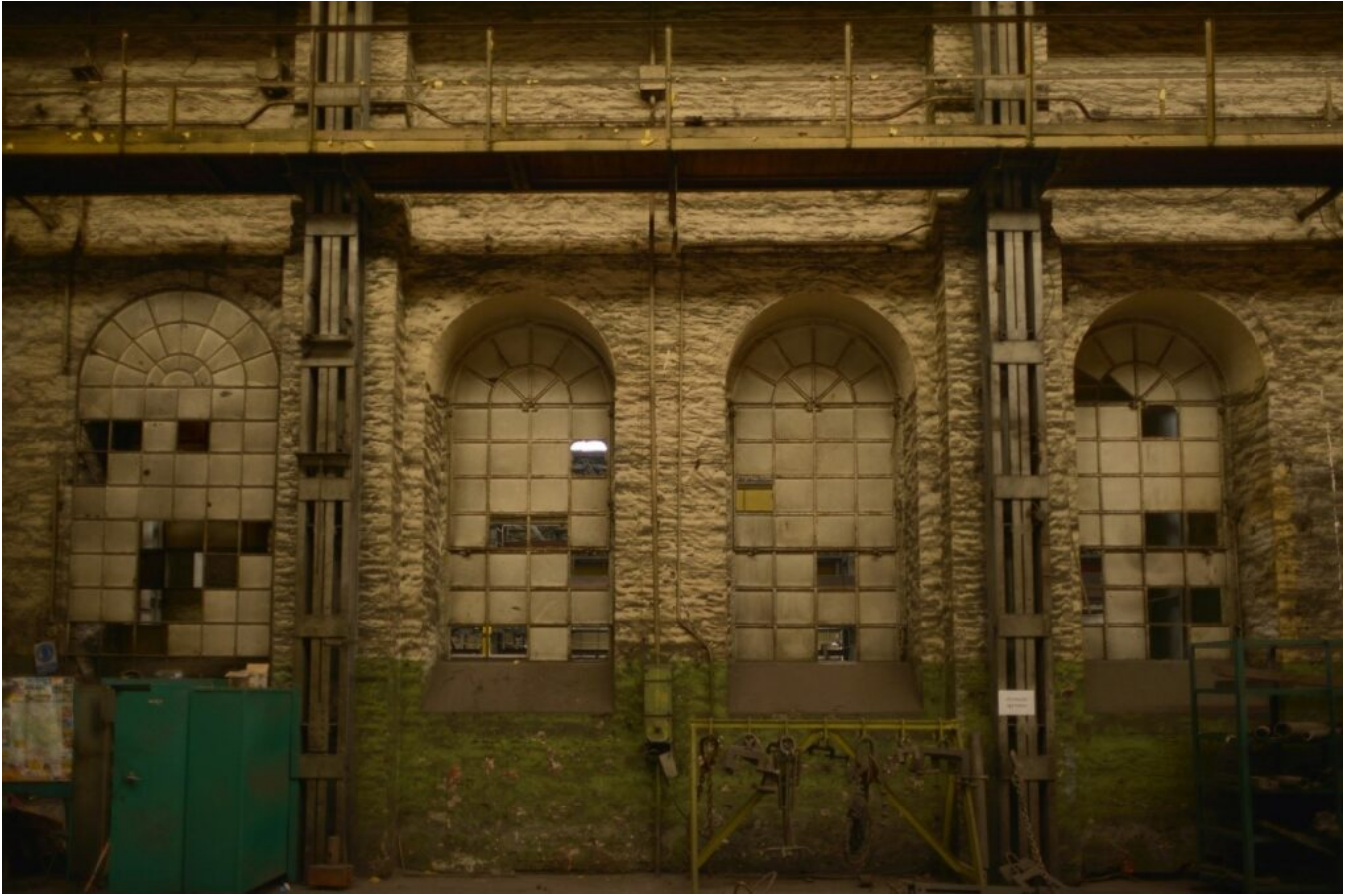
Chocianów, Fabryka Urządzeń Mechanicznych CHOFUM. Fragment wnętrza z zachowaną historyczną ślusarką okien, 2023 r.