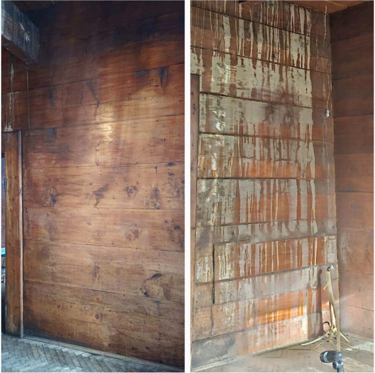
„Dom Doktora”, aktualny stan - grudzień 2023 r.