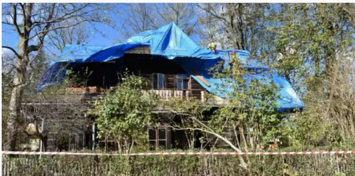
„Dom Doktora”, aktualny stan - grudzień 2023 r.