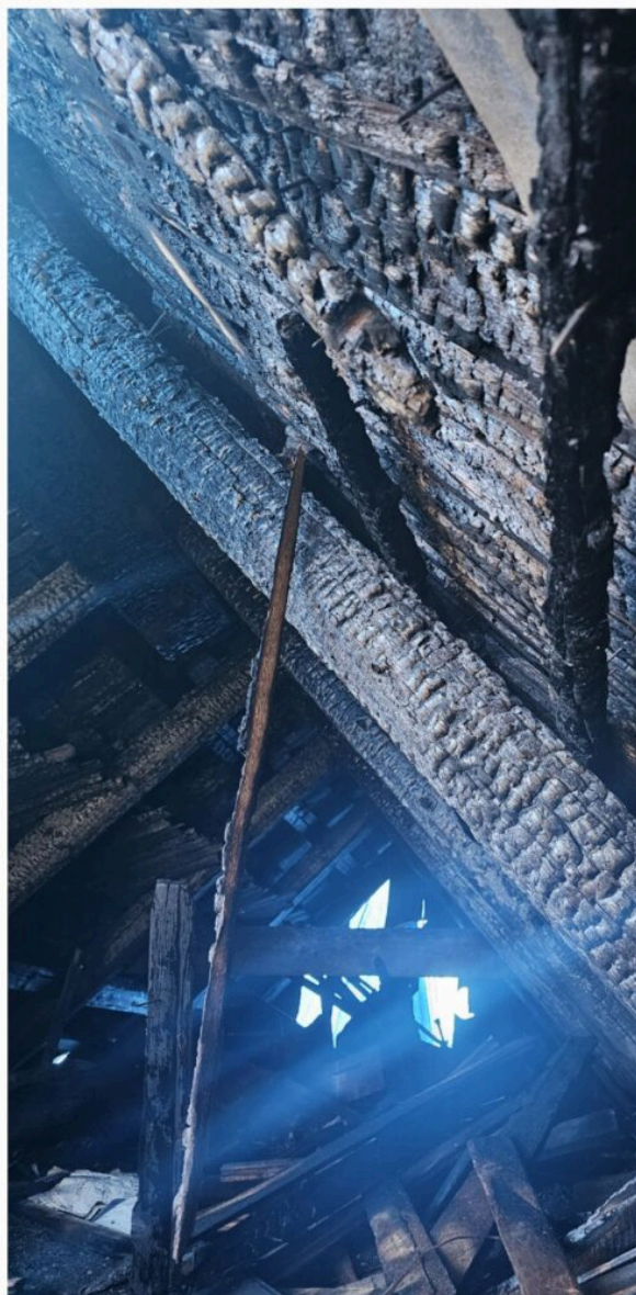
„Dom Doktora”, aktualny stan - grudzień 2023 r.