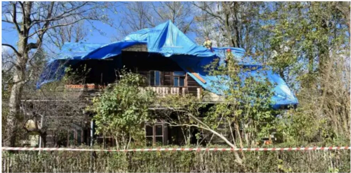
„Dom Doktora”, aktualny stan - grudzień 2023 r.