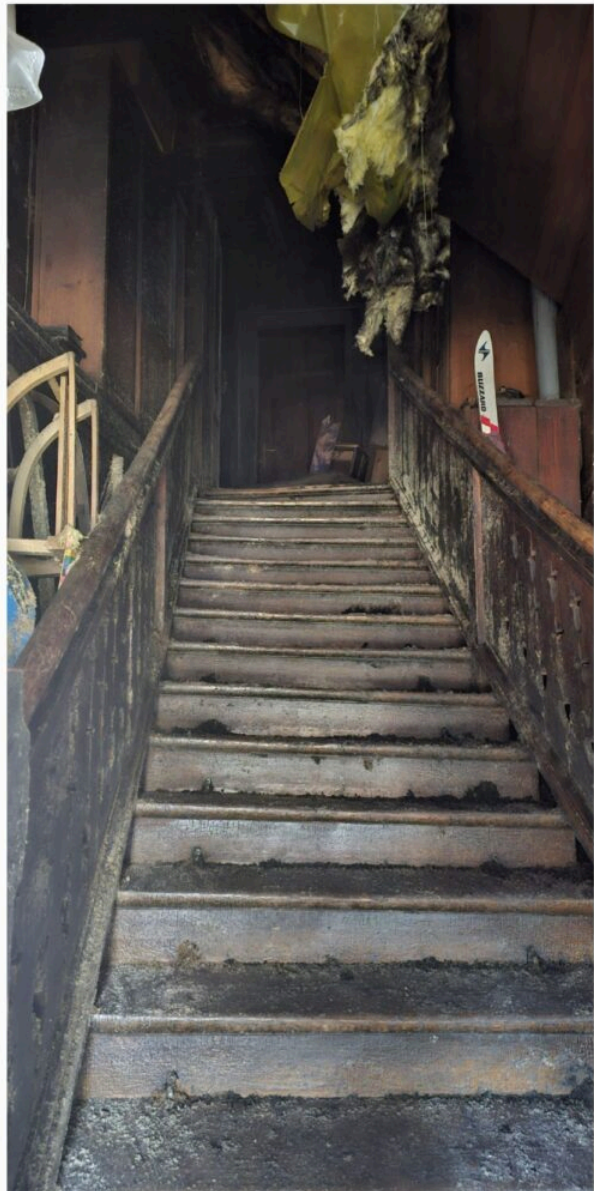
„Dom Doktora”, aktualny stan - grudzień 2023 r.