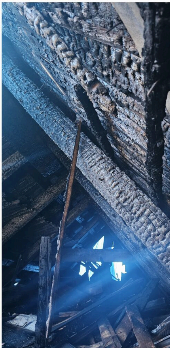
„Dom Doktora”, aktualny stan - grudzień 2023 r.