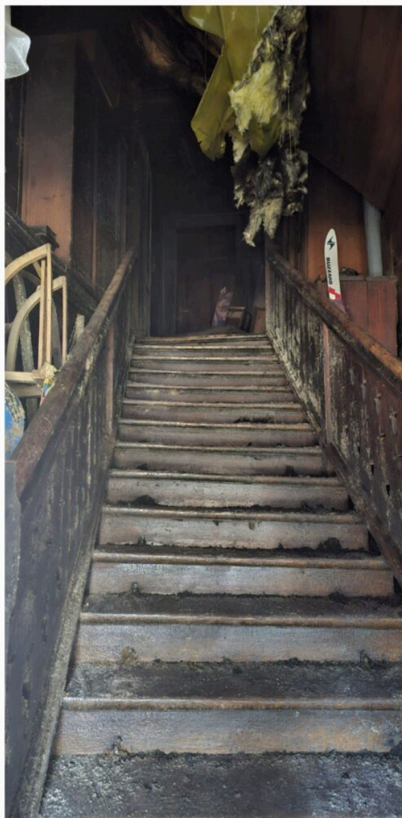
„Dom Doktora”, aktualny stan - grudzień 2023 r.