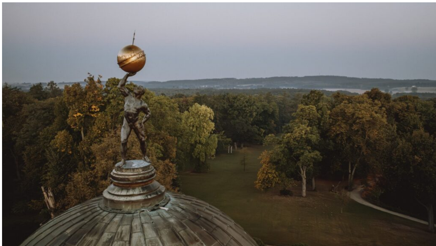
Lubostroń – zespół pałacowo-parkowy