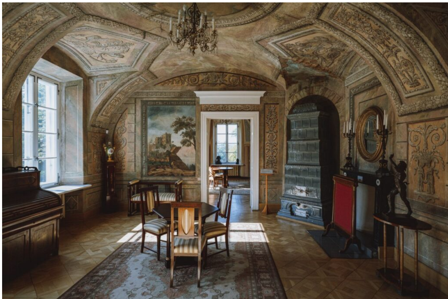
Lubostroń – zespół pałacowo-parkowy