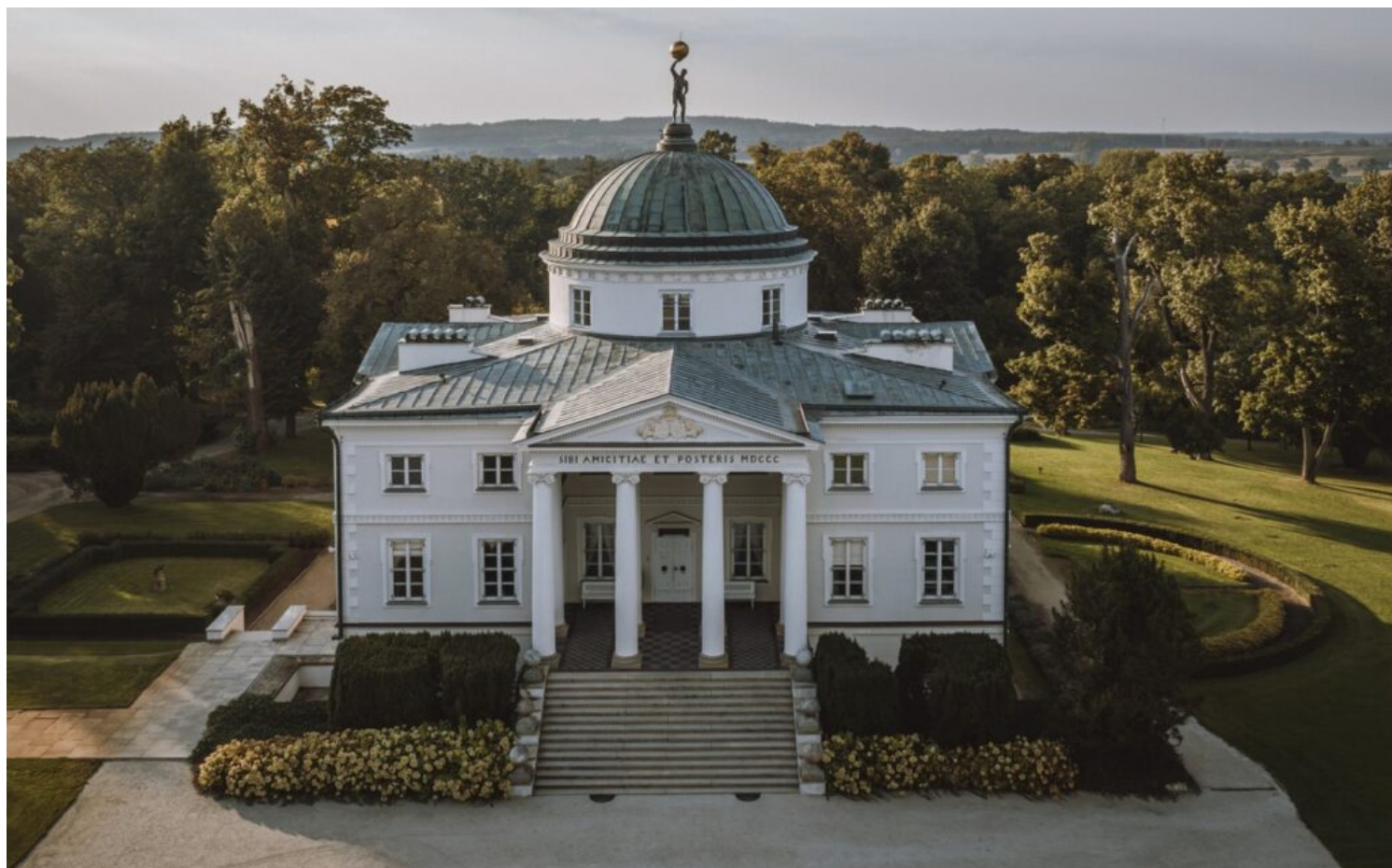
Lubostroń – zespół pałacowo-parkowy