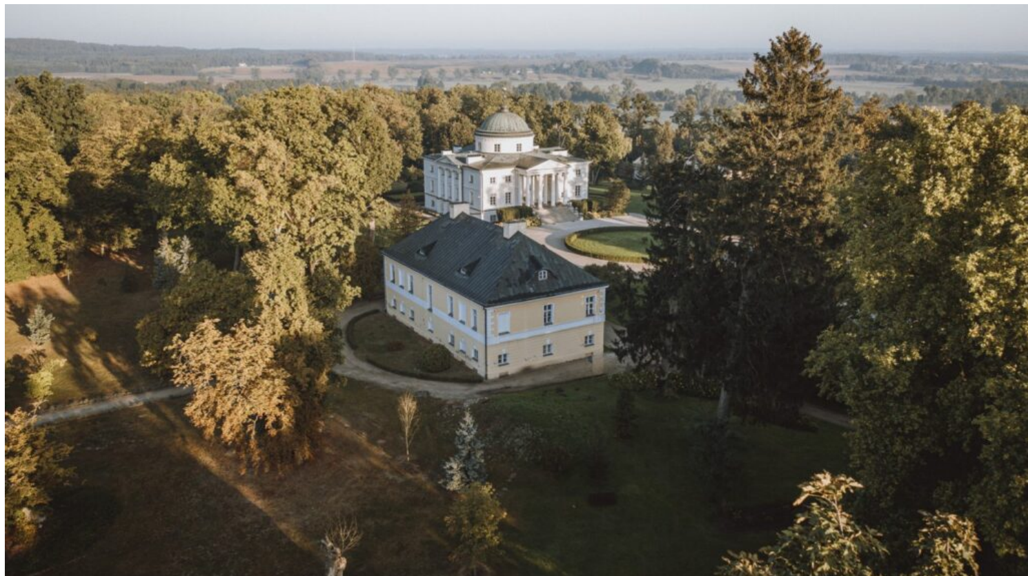
Lubostroń – zespół pałacowo-parkowy, fot. Maciej Jabłoński F11, zb. NID

Więcej na temat historii pałacu w Lubostroniu przeczytasz na portalu zabytek.pl