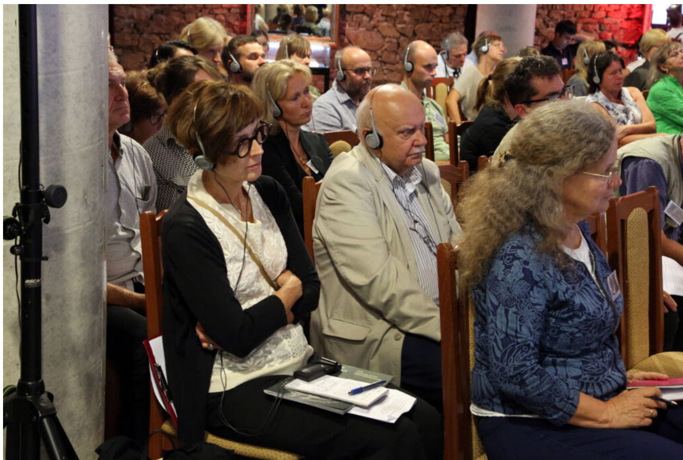
Międzynarodowa konferencja "Archeologia ogrodów historycznych"