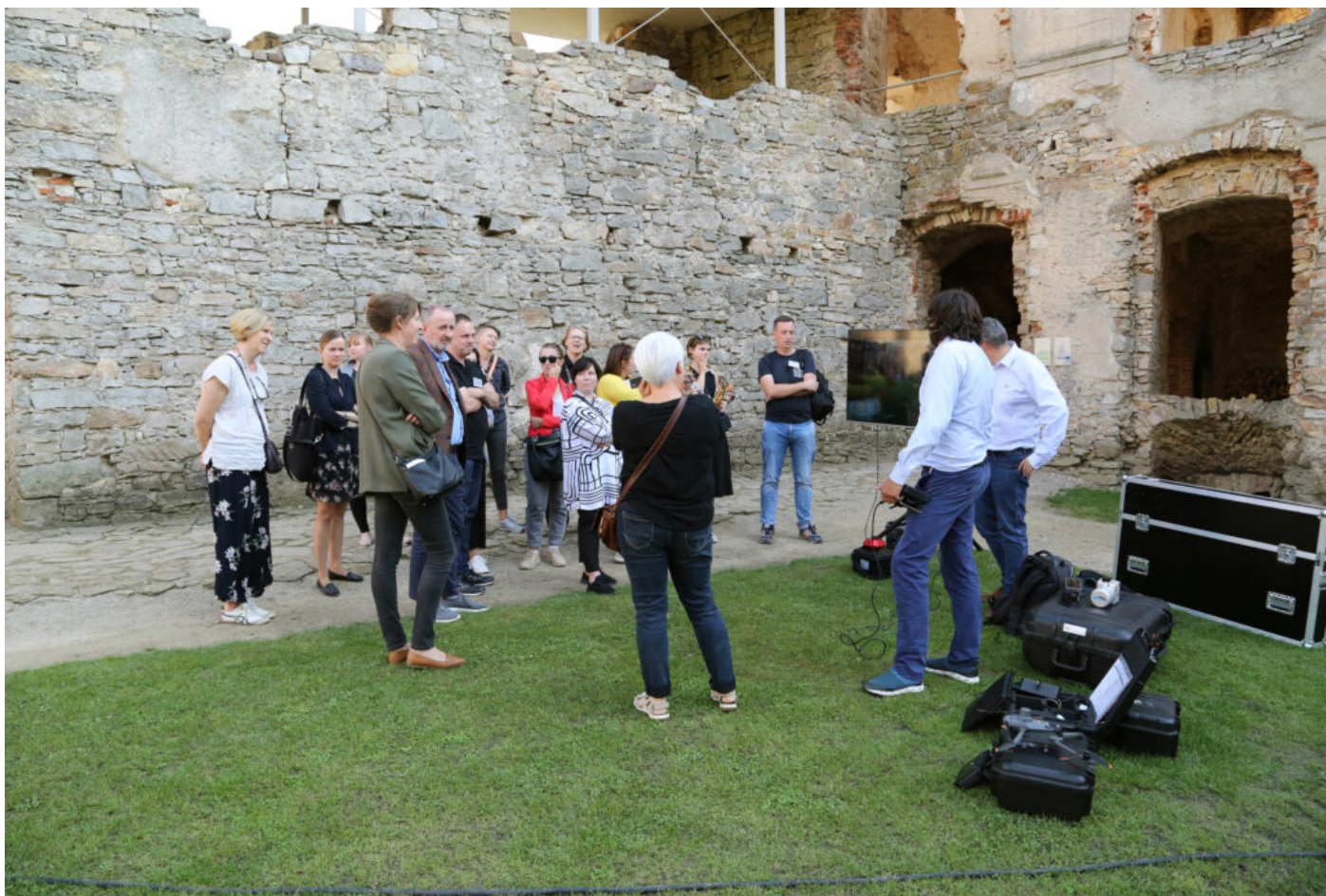
Prezentacja zespołu TPI, Międzynarodowa konferencja "Archeologia ogrodów historycznych", fot. NID/P. Kobek