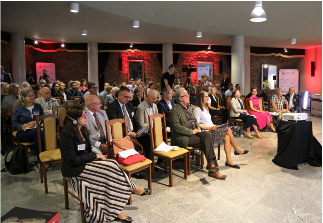
Międzynarodowa konferencja "Archeologia ogrodów historycznych"