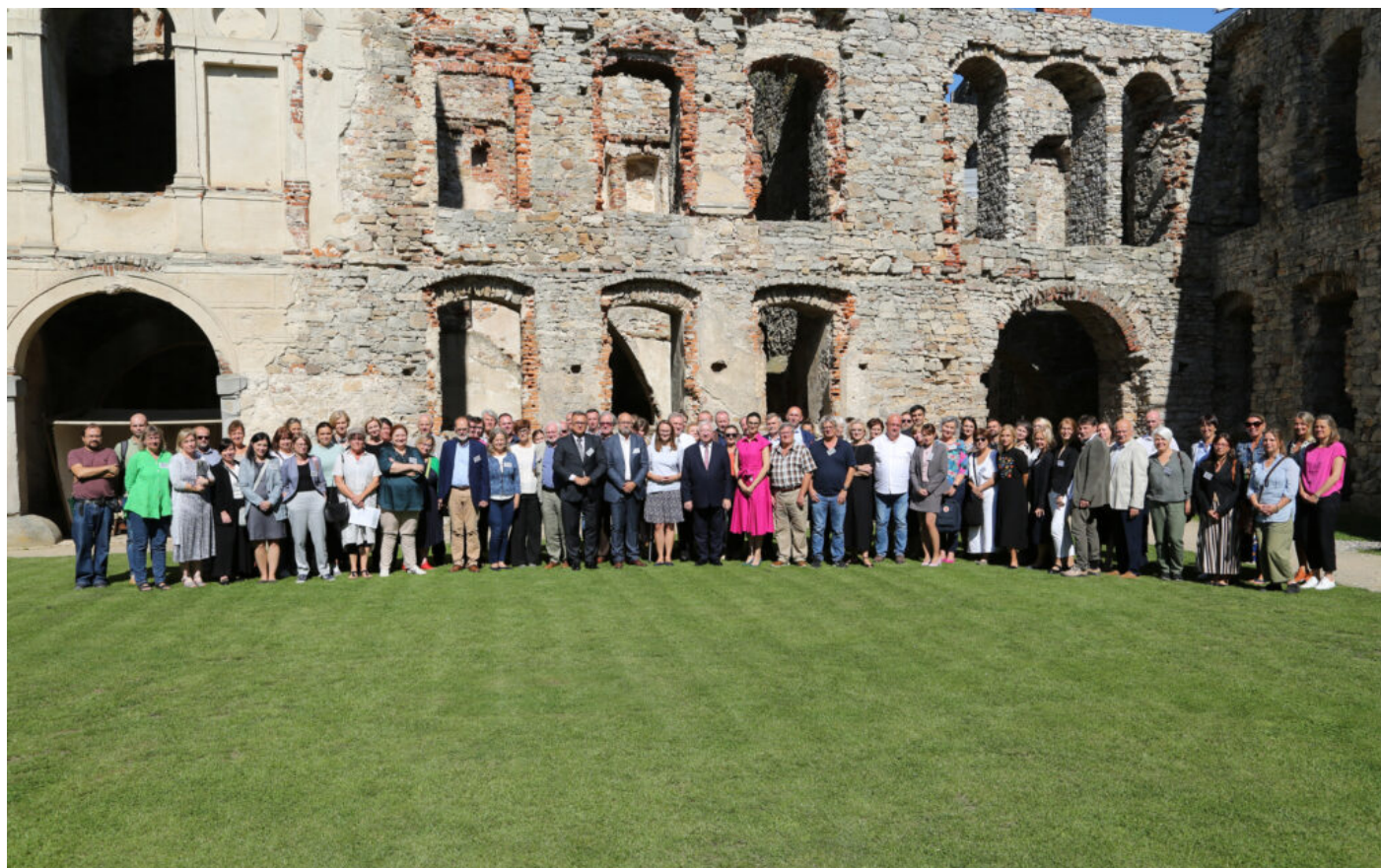
Uczestnicy Międzynarodowej konferencji "Archeologia ogrodów historycznych"