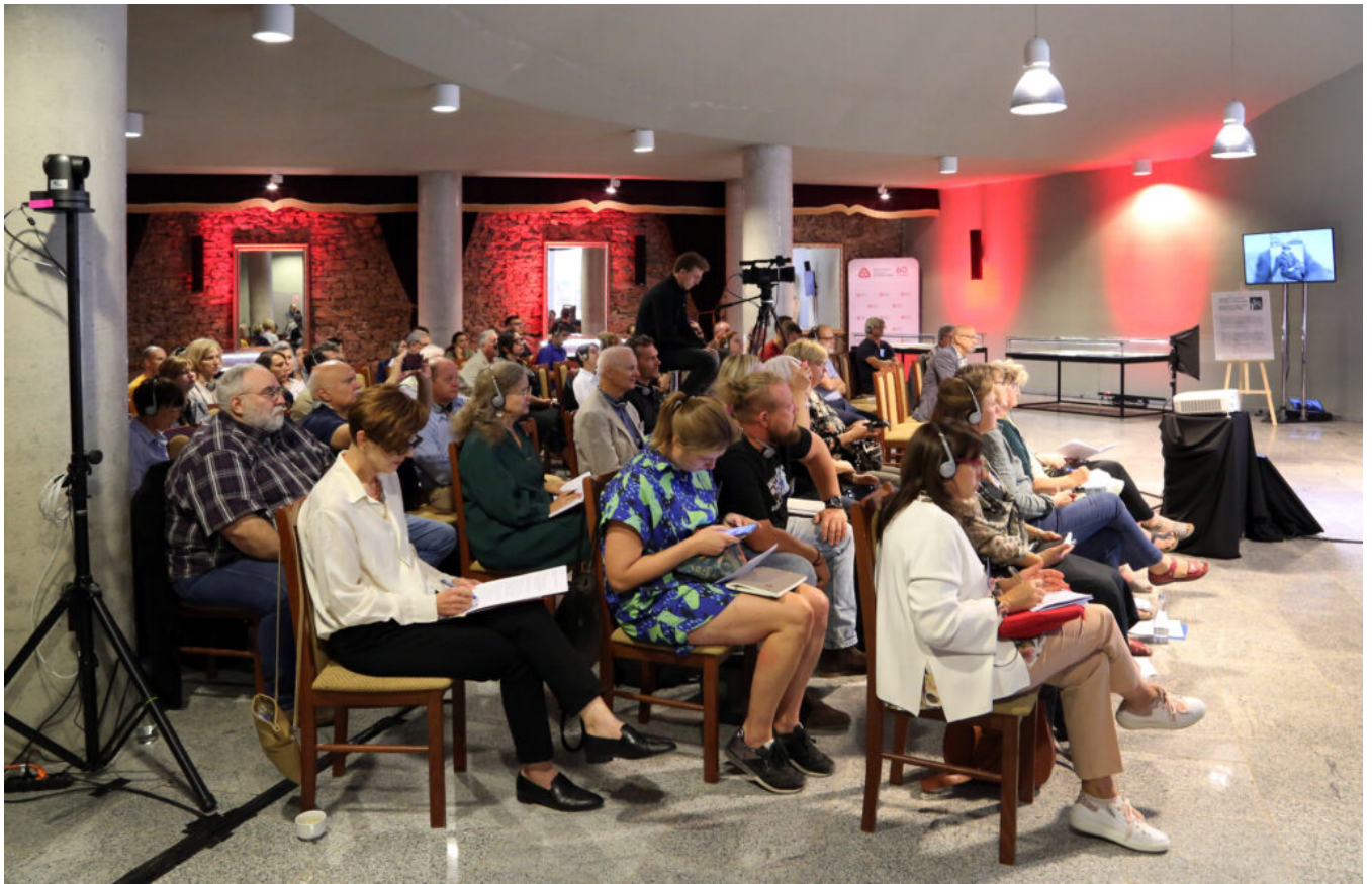
Międzynarodowa konferencja "Archeologia ogrodów historycznych", fot. NID/P. Kobek