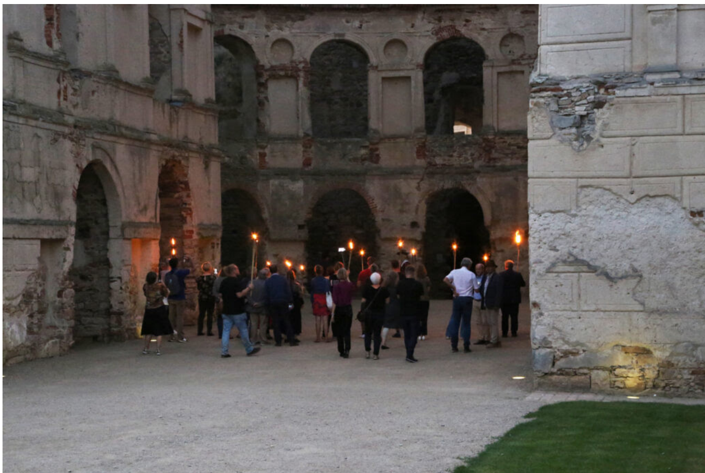
Międzynarodowa konferencja "Archeologia ogrodów historycznych"