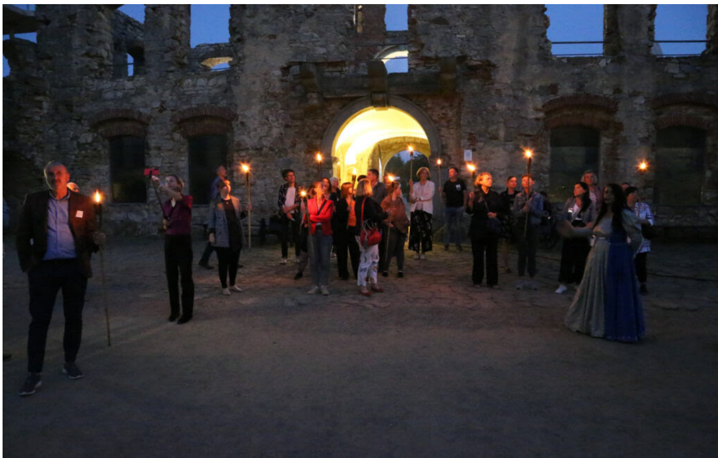
Międzynarodowa konferencja "Archeologia ogrodów historycznych"