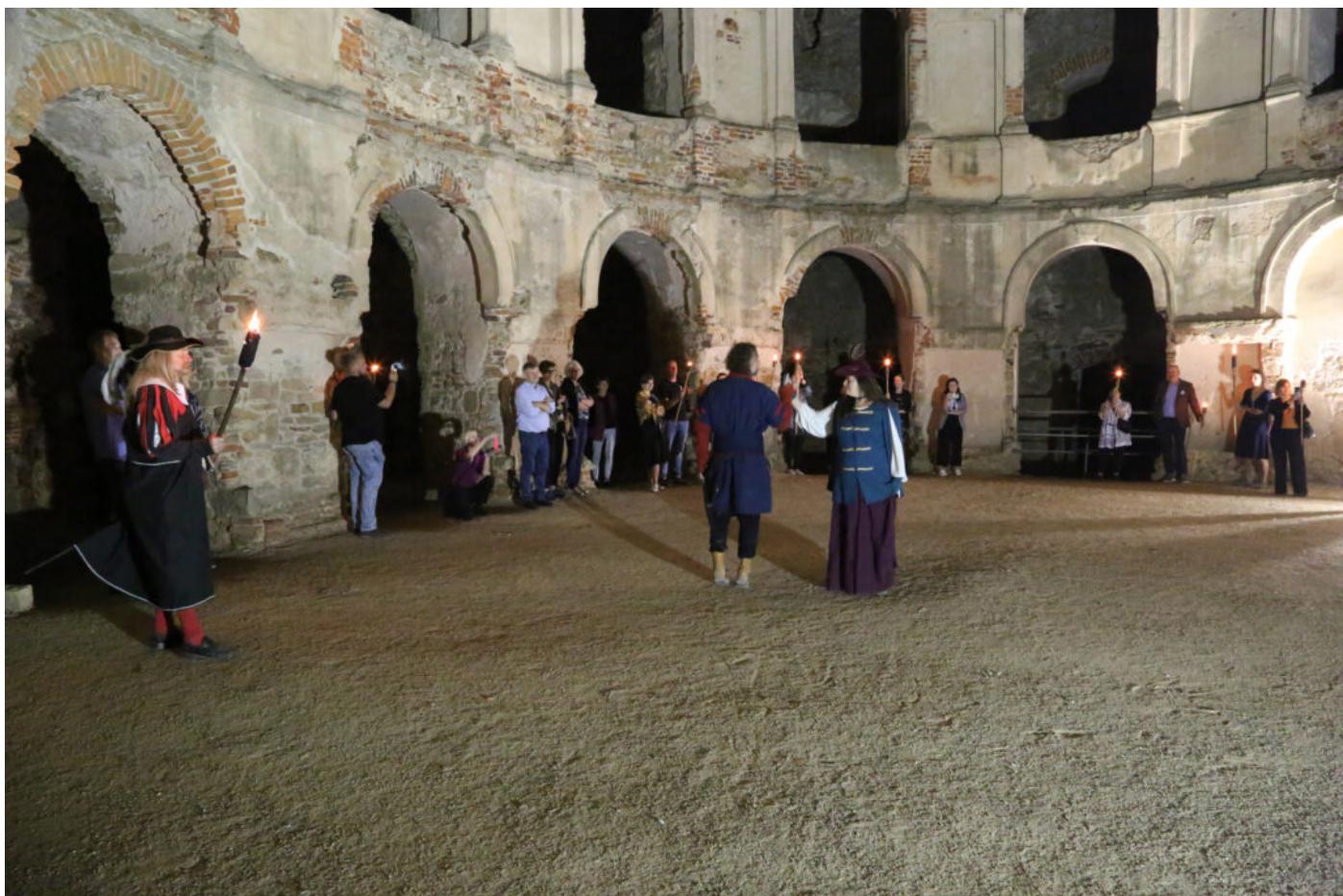
Międzynarodowa konferencja "Archeologia ogrodów historycznych", fot. NID/P. Kobek