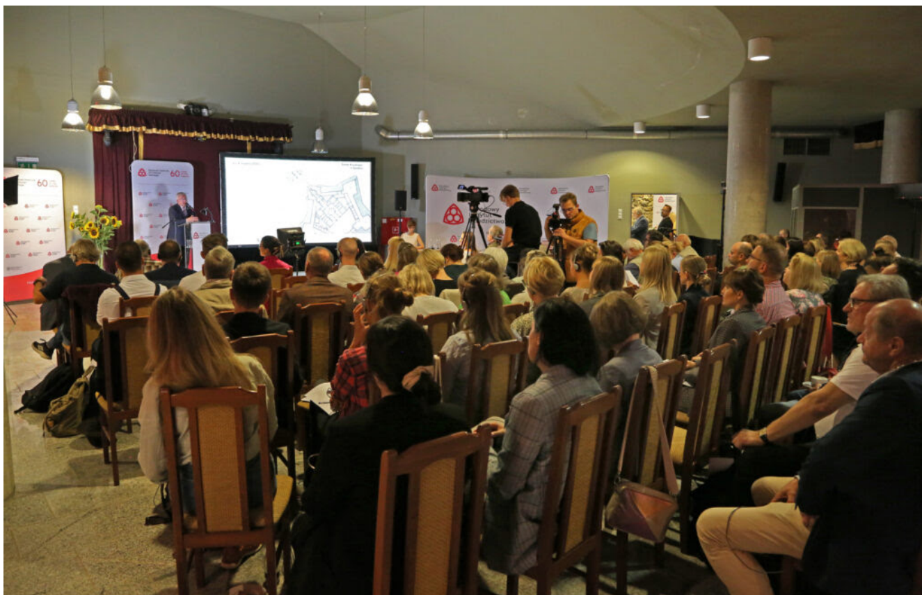
Międzynarodowa konferencja "Archeologia ogrodów historycznych"