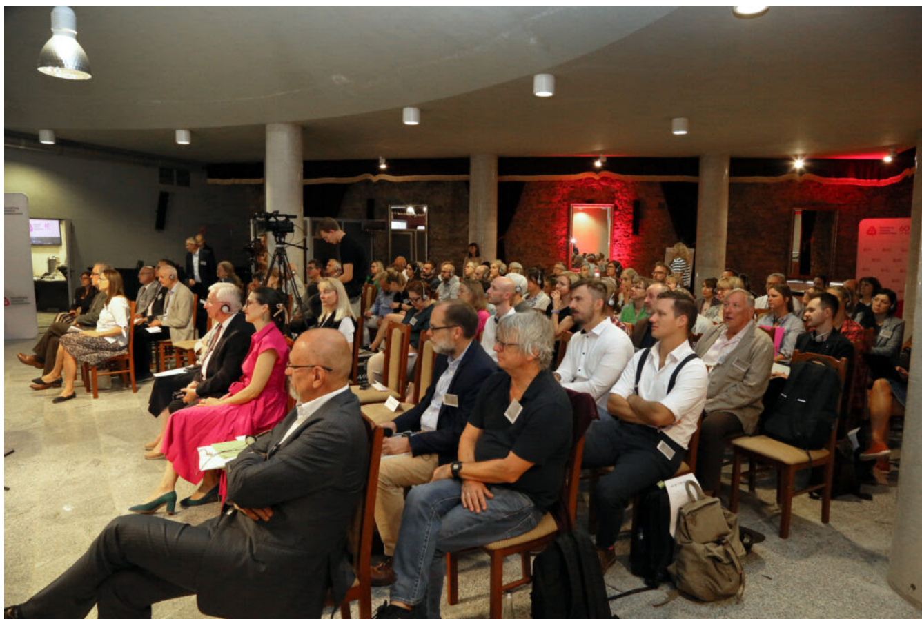
Międzynarodowa konferencja "Archeologia ogrodów historycznych"