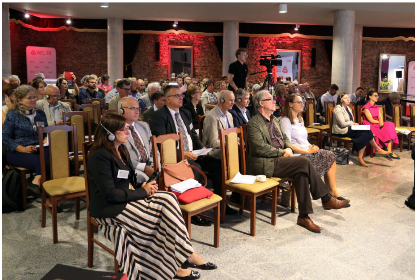
Międzynarodowa konferencja "Archeologia ogrodów historycznych"