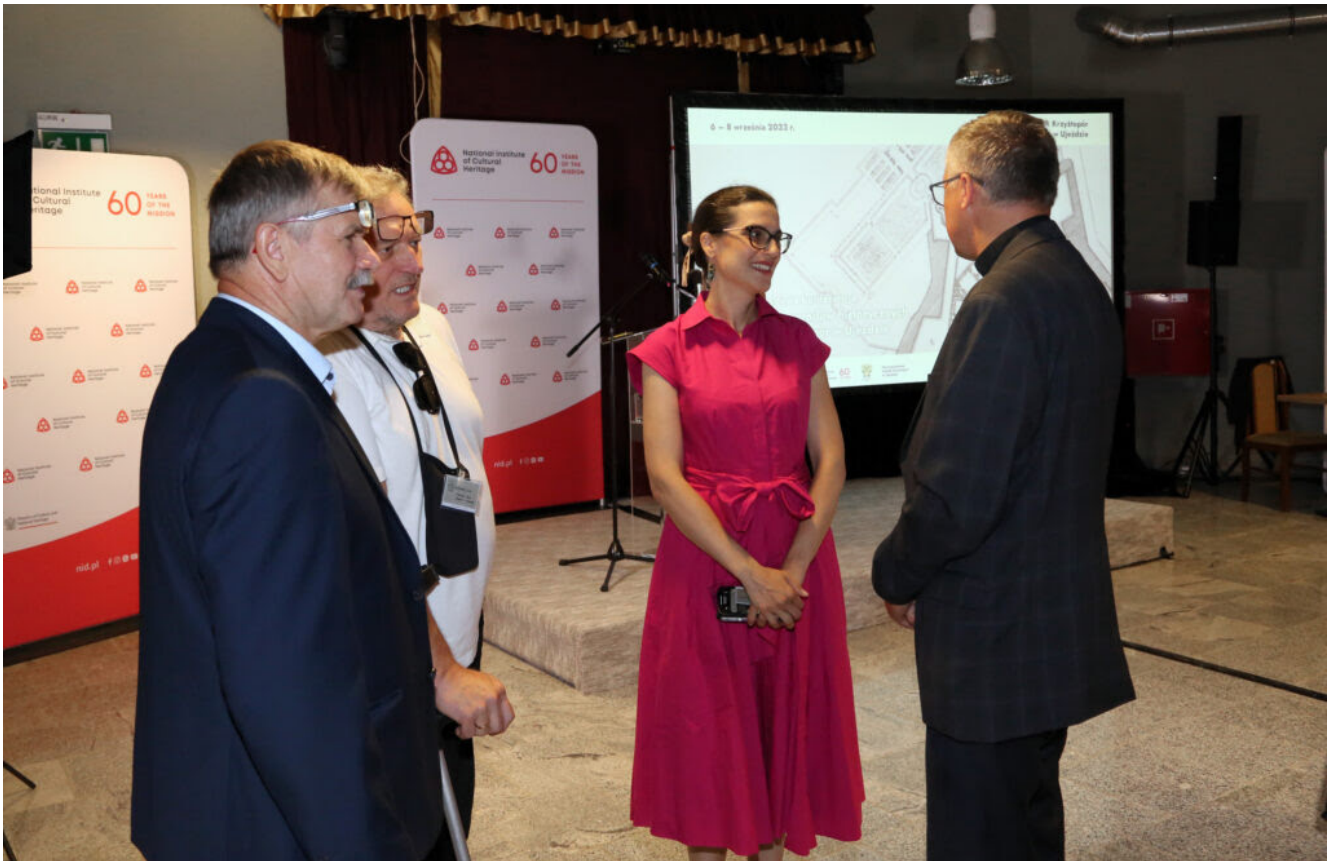
Międzynarodowa konferencja "Archeologia ogrodów historycznych", fot. NID/P. Kobek