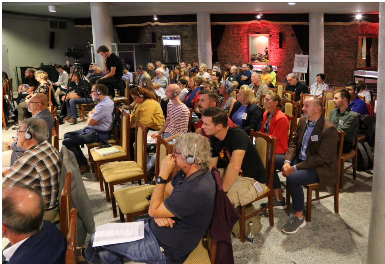
Międzynarodowa konferencja "Archeologia ogrodów historycznych", fot. NID/P. Kobek