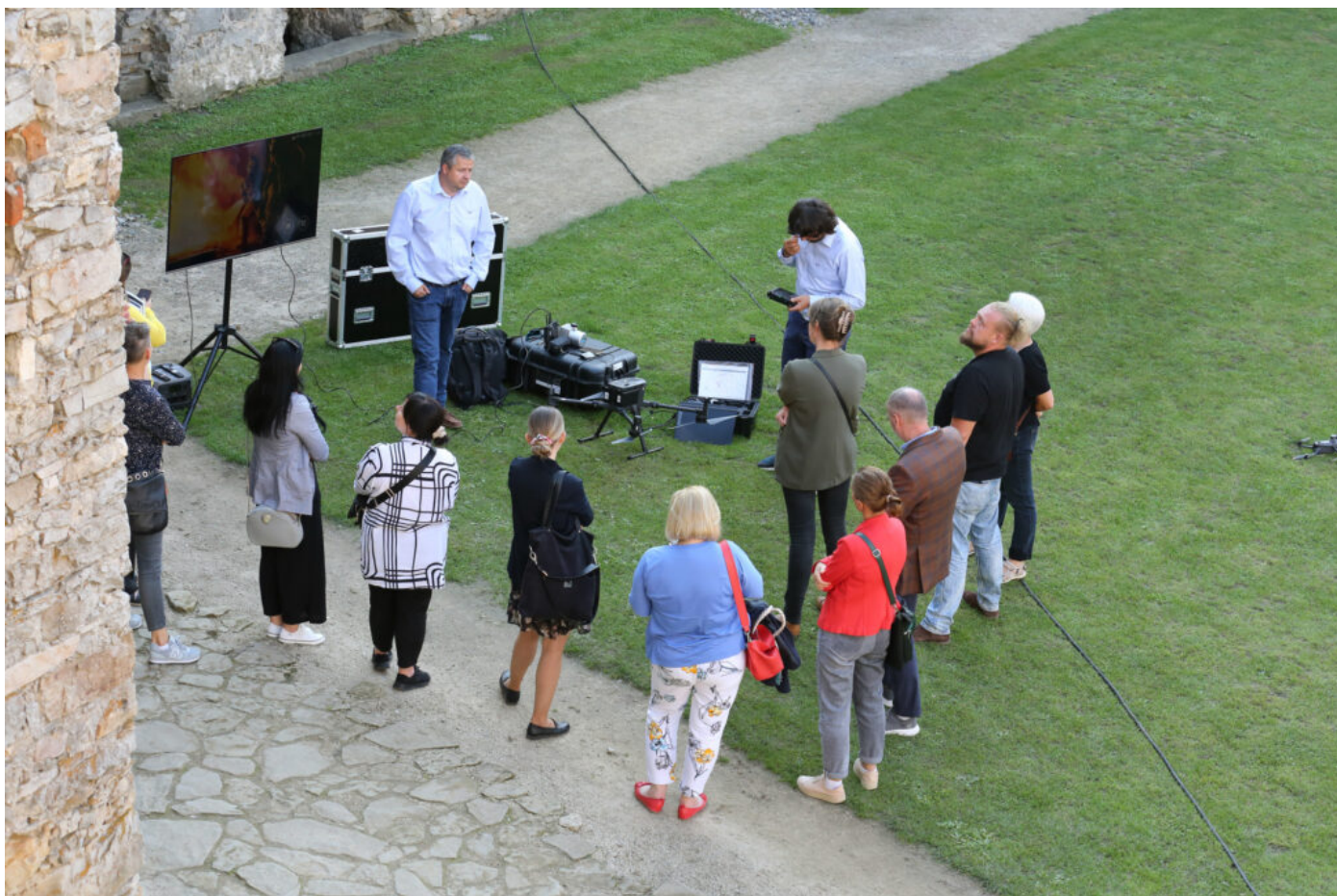
Prezentacja zespołu TPI, Międzynarodowa konferencja "Archeologia ogrodów historycznych", fot. NID/P. Kobek