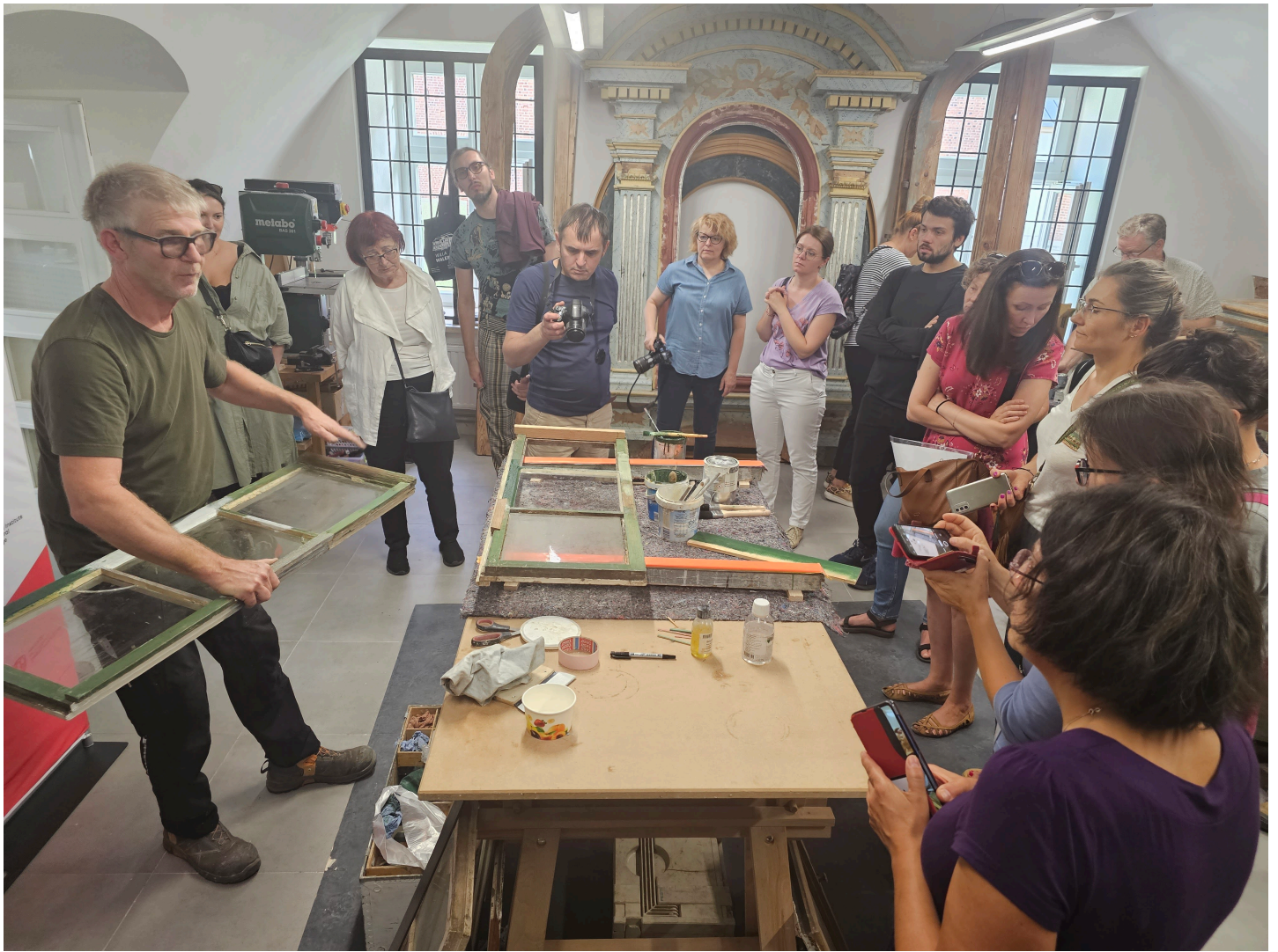
Seminarium „Historyczna stolarka okienna”