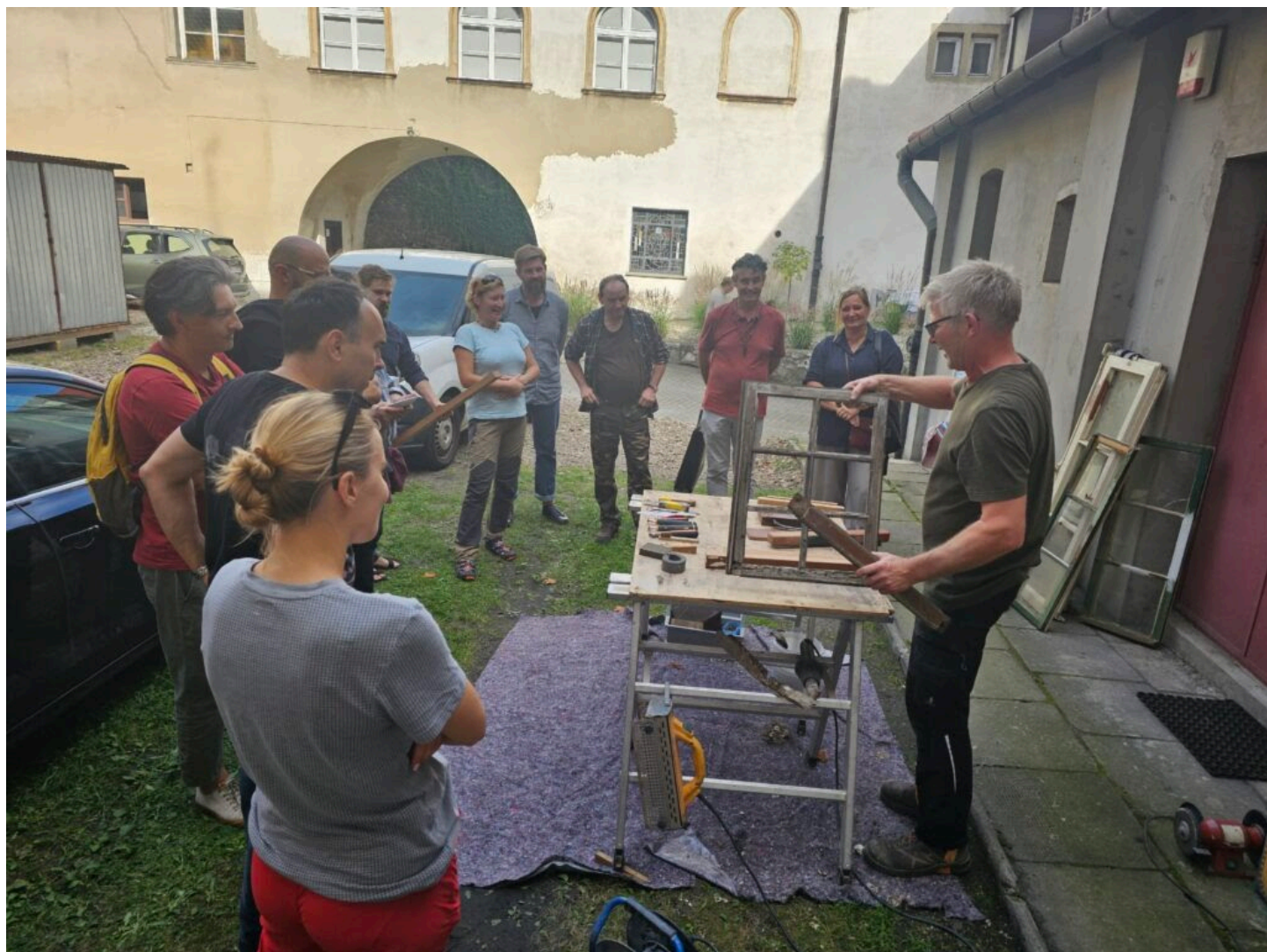
Seminarium „Historyczna stolarka okienna”, fot. NID/A. Dzwolak