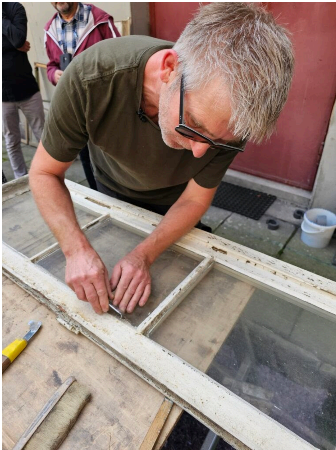
Seminarium „Historyczna stolarka okienna”