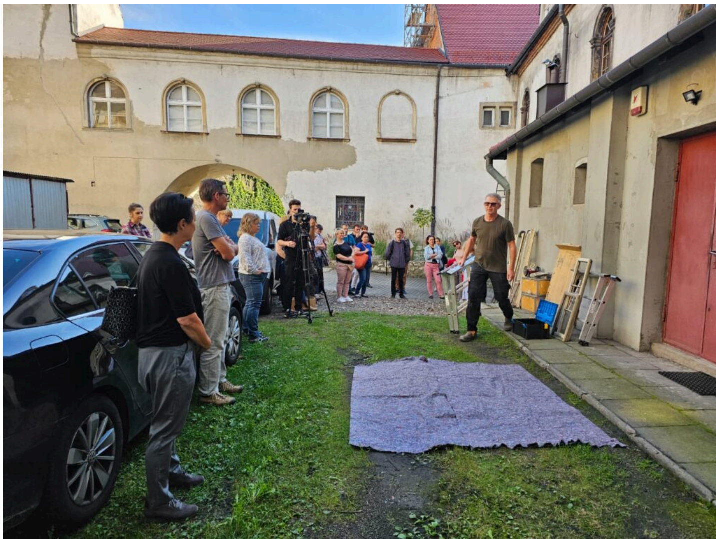
Seminarium „Historyczna stolarka okienna”