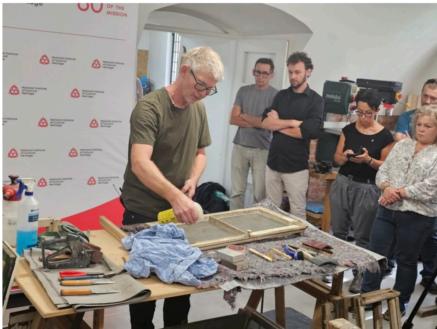
Seminarium „Historyczna stolarka okienna”