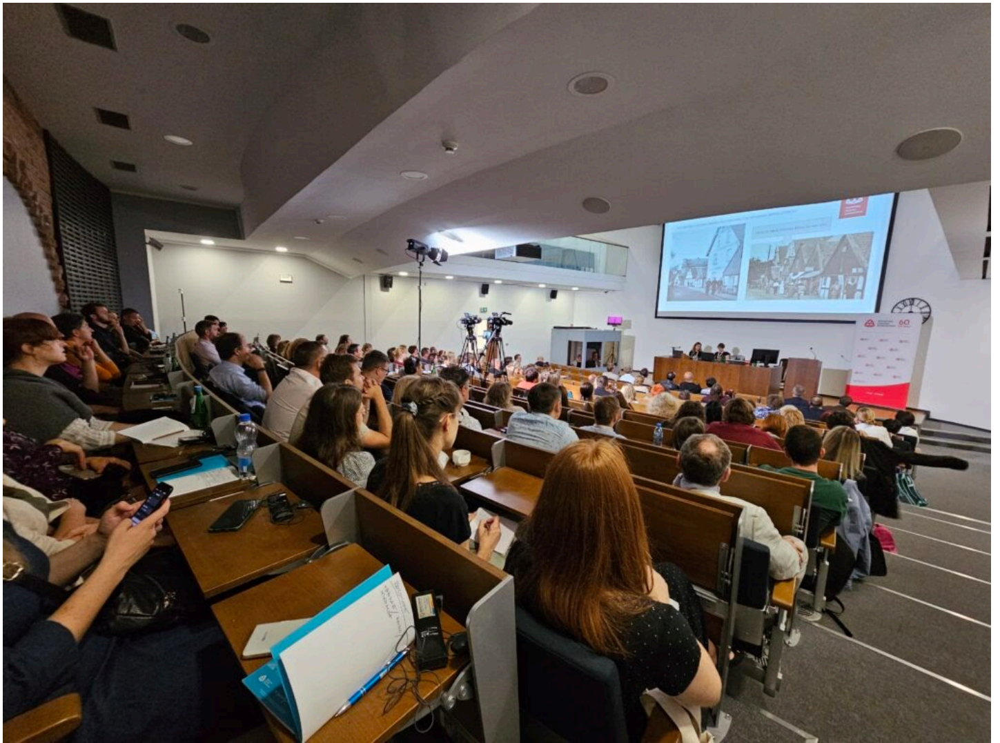
Seminarium „Historyczna stolarka okienna”