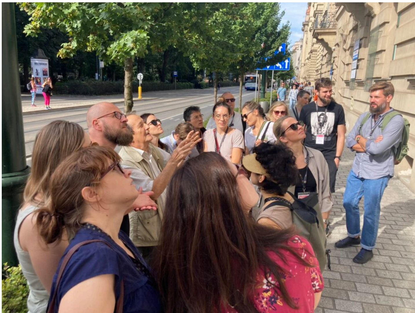
Seminarium „Historyczna stolarka okienna”