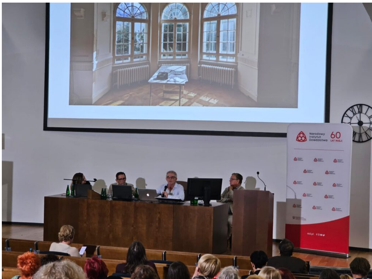
Seminarium „Historyczna stolarka okienna”