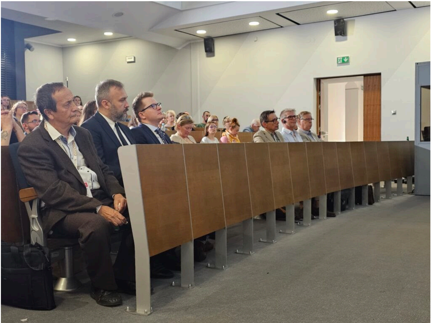
Seminarium „Historyczna stolarka okienna”