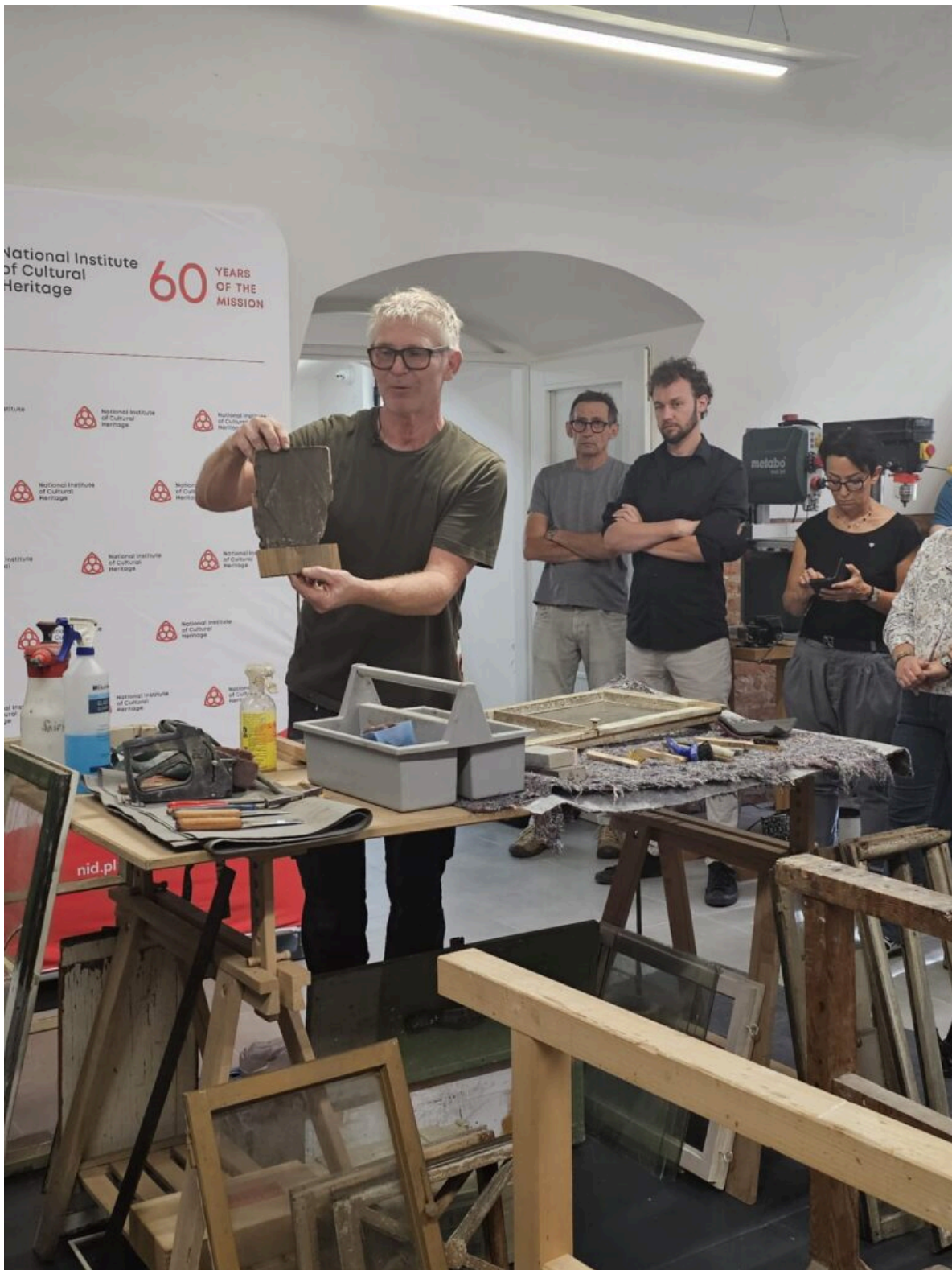
Seminarium „Historyczna stolarka okienna”