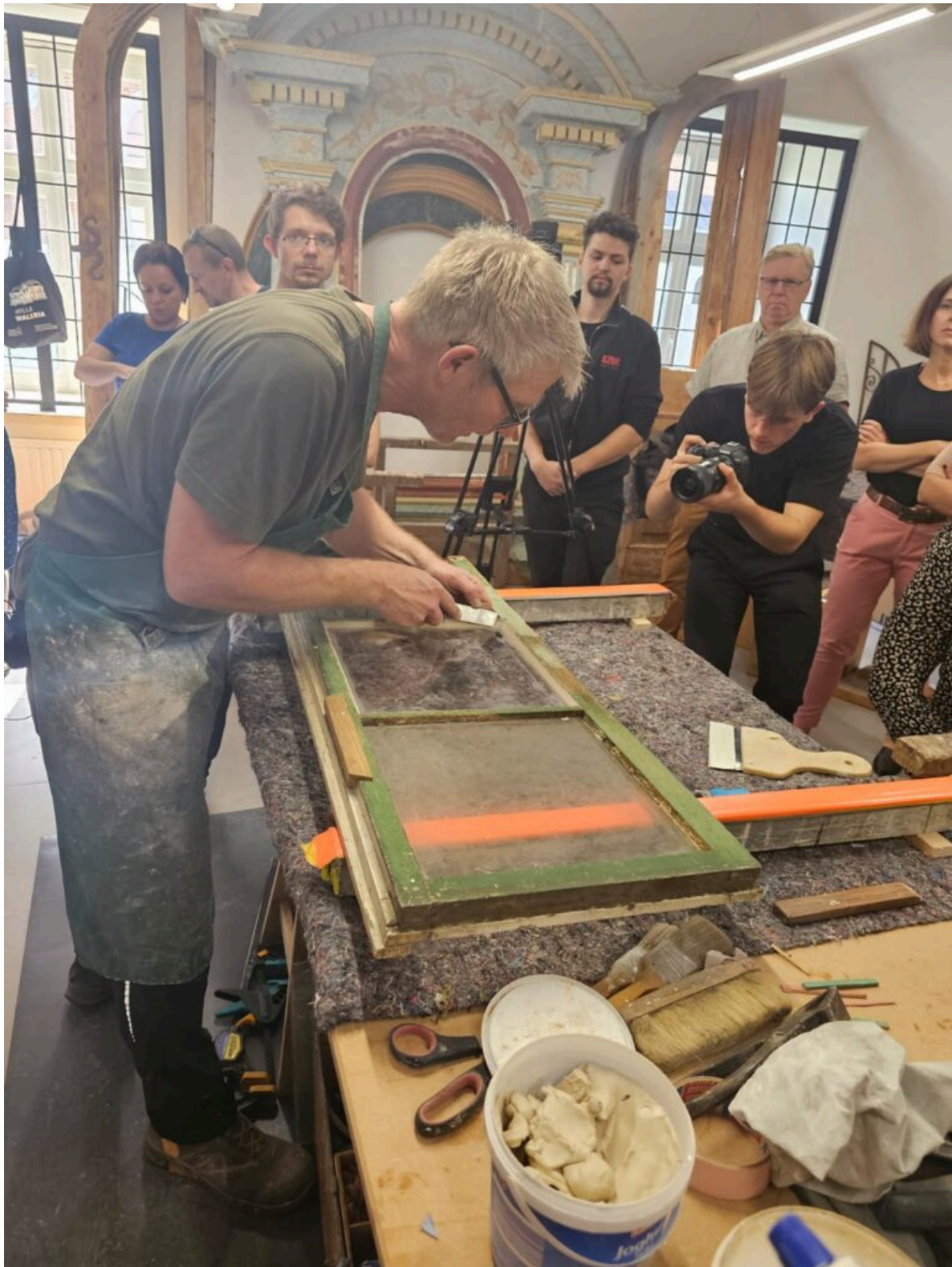
Seminarium „Historyczna stolarka okienna”, fot. NID/M. Wojnowska