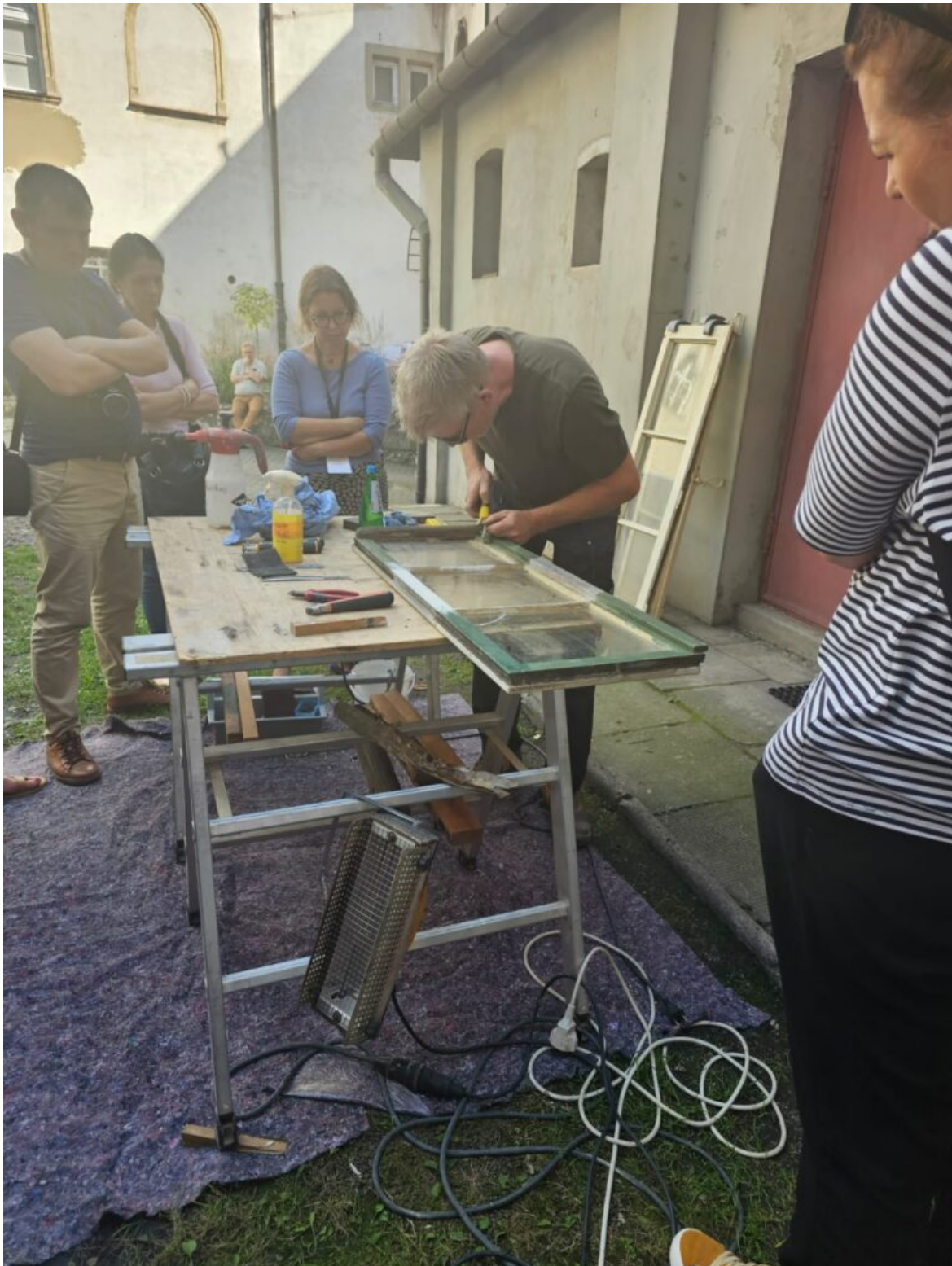
Seminarium „Historyczna stolarka okienna”