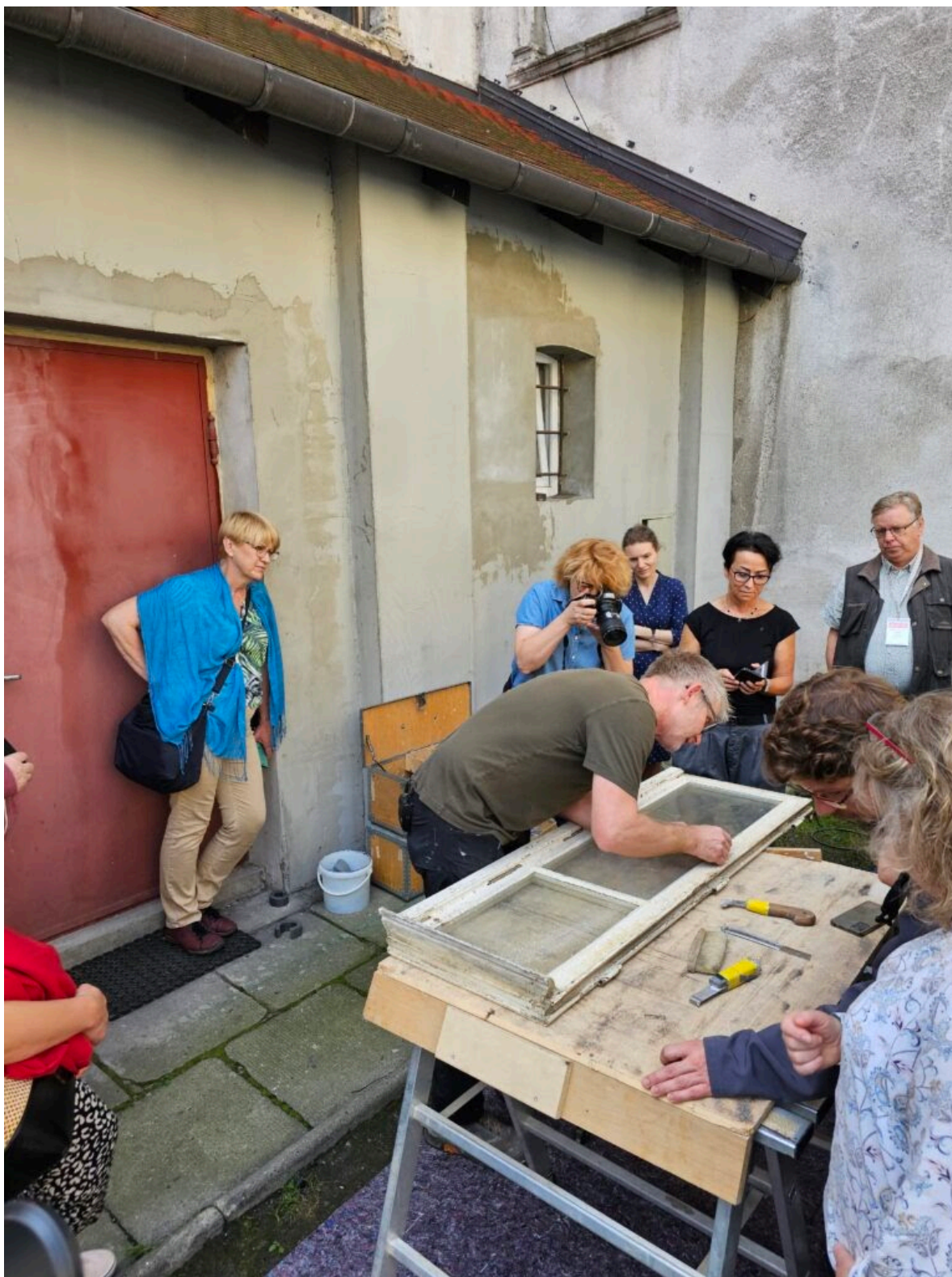
Seminarium „Historyczna stolarka okienna”