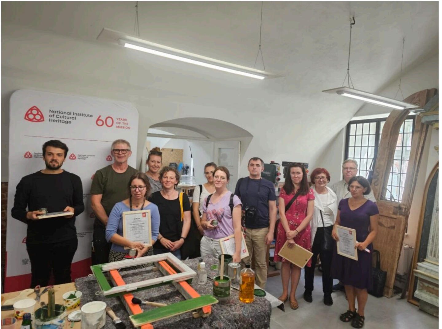
Seminarium „Historyczna stolarka okienna”