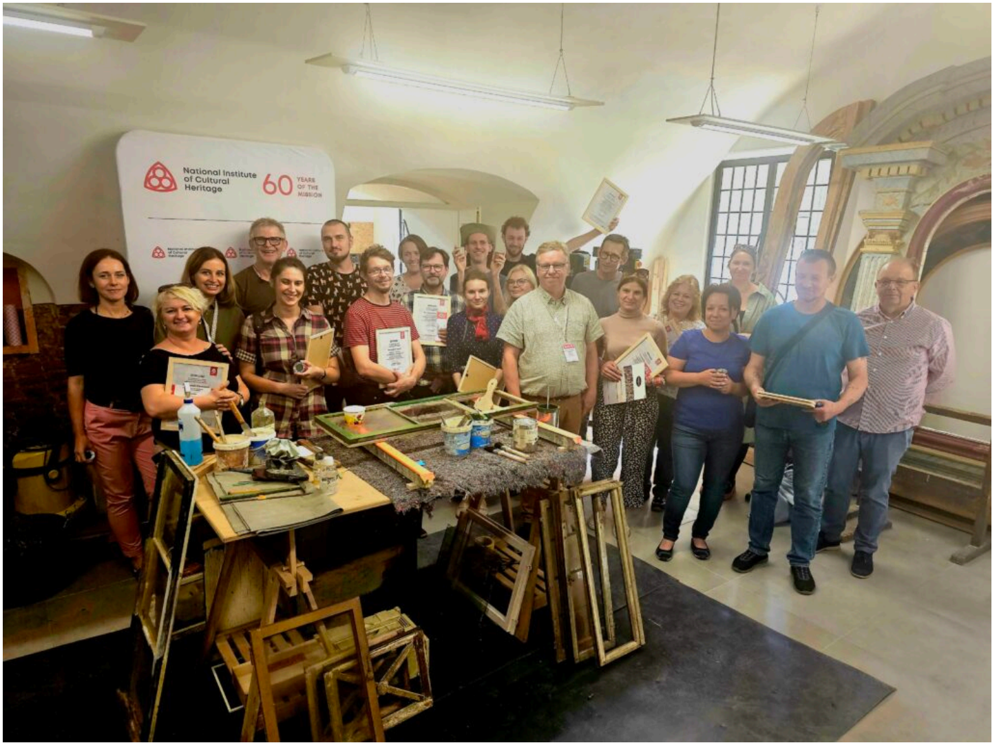
Seminarium „Historyczna stolarka okienna”