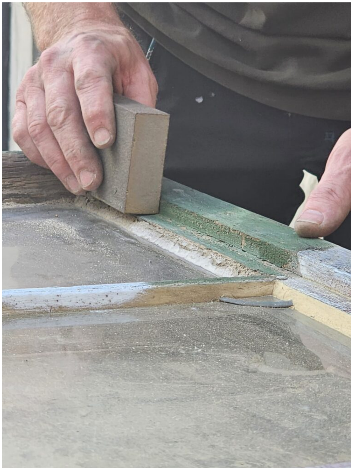
Seminarium „Historyczna stolarka okienna”