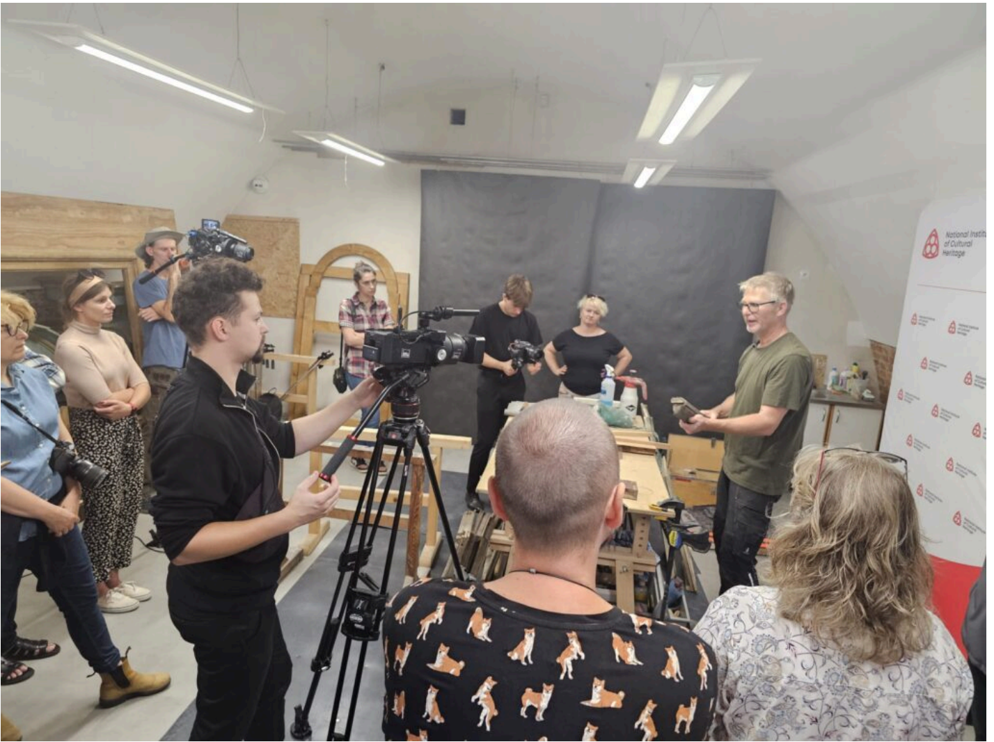
Seminarium „Historyczna stolarka okienna”