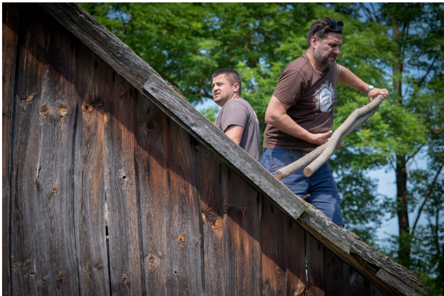
fot. Aga Piotrowska