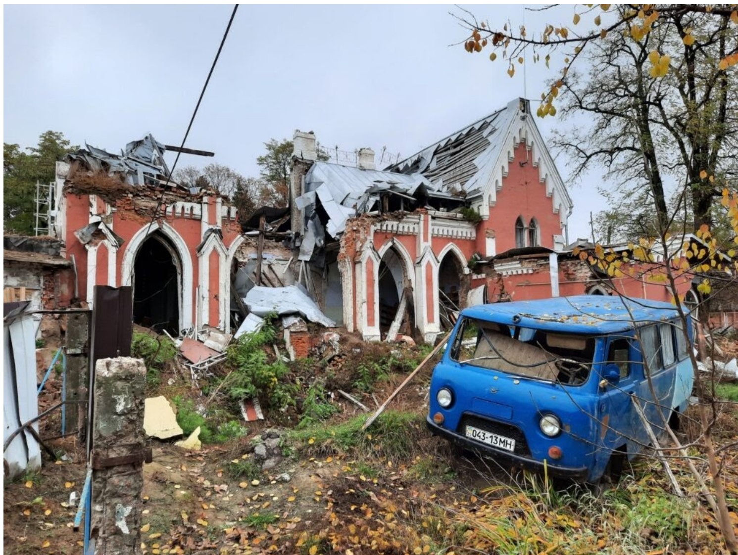
Biblioteka dla Młodzieży w Czernichowie (dawne Muzeum Tarnowskiego z 1902 r.); zniszczona na skutek bombardowania 11.03.2022 r.