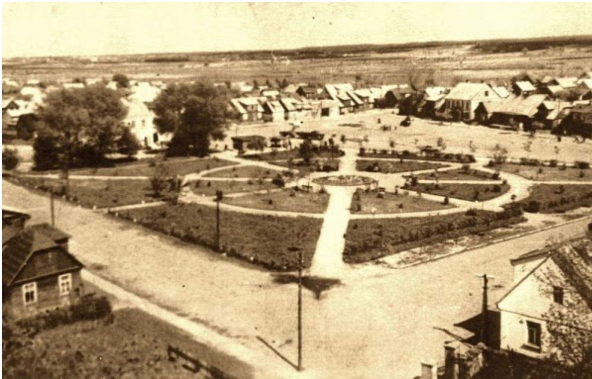
Knyszyn - rynek

Współczesne zmiany w zagospodarowaniu przestrzeni rynków, w większości przypadków, nie pokryły się z oczekiwaniem społeczności, a nawet zaprzeczają intencjom działań rewitalizacyjnych. Zrealizowane projekty wpisują się w dwa przeciwstawne trendy. Pierwszy skupia próby dosłownego powrotu do średniowiecznej formy rynku. Drugi – modernizacje powojennego zagospodarowania i współczesne aranżacje. Nawet pobieżny przegląd realizacji pokazuje, że na terenie całego kraju, powstały miejsca bardzo podobne względem siebie, sprawiające wrażenie jakby projekt oparty był na jednym wzorcu, którego priorytetem była wymiana nawierzchni na solidny, importowany materiał oraz ustawienie fontanny i ławek, ewentualnie dosadzenie filigranowych form roślinnych. Realizacja wielu projektów prowadzi do zatracenia historycznego charakteru wnętrz urbanistycznych, ich indywidualnych cech, określających tożsamość każdego miejsca.