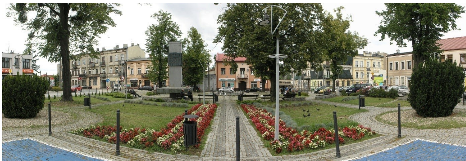
Brzeziny, woj. łódzkie