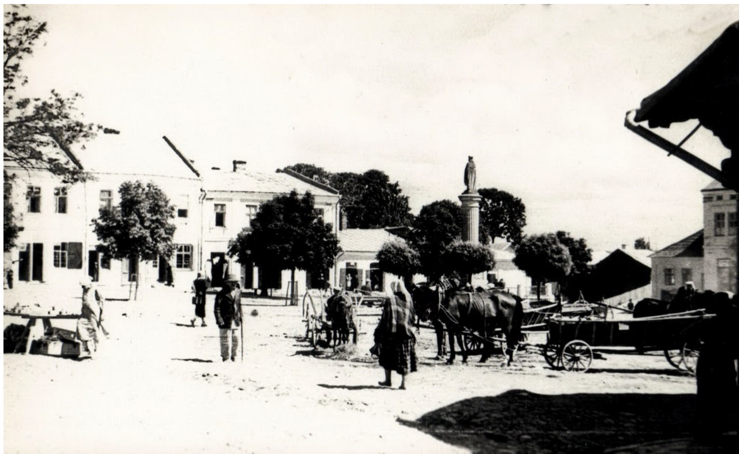
Dynów - rynek