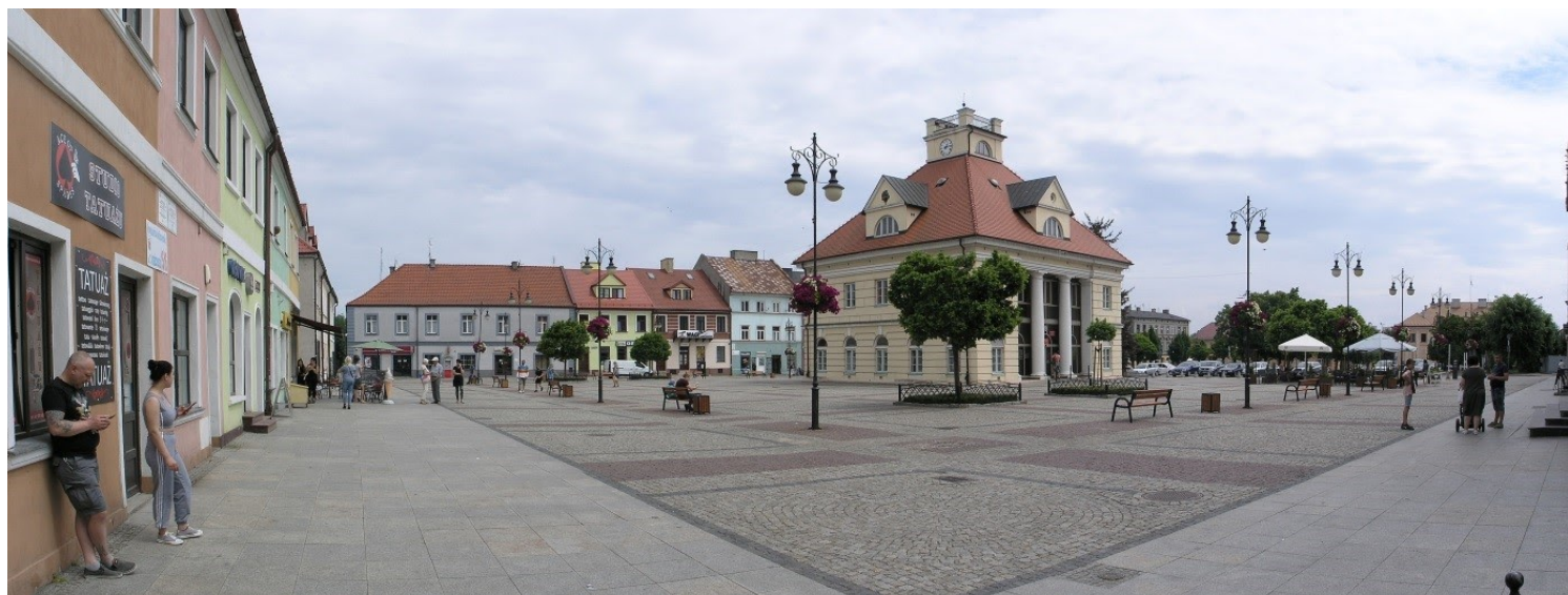
Łęczyca, woj. łódzkie