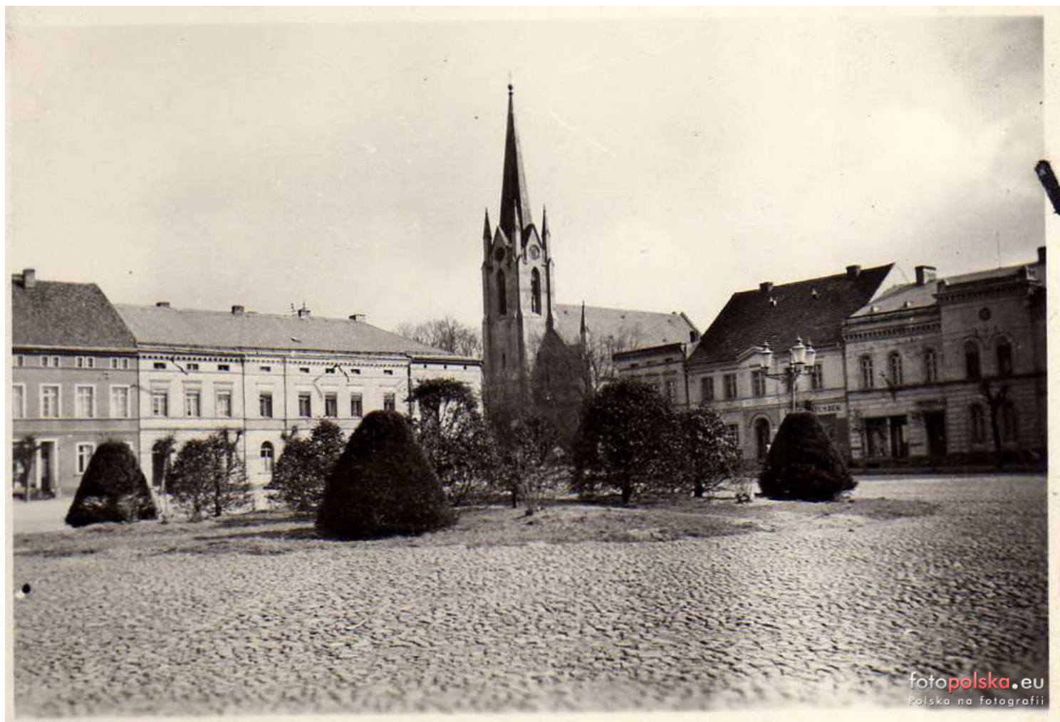
Bojanów - rynek przed 1941 r.