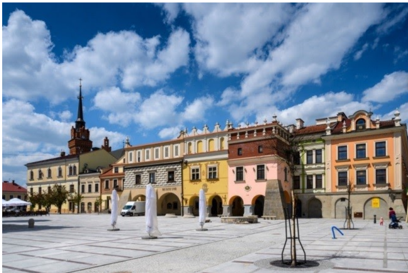
Tarnów, woj. małopolskie