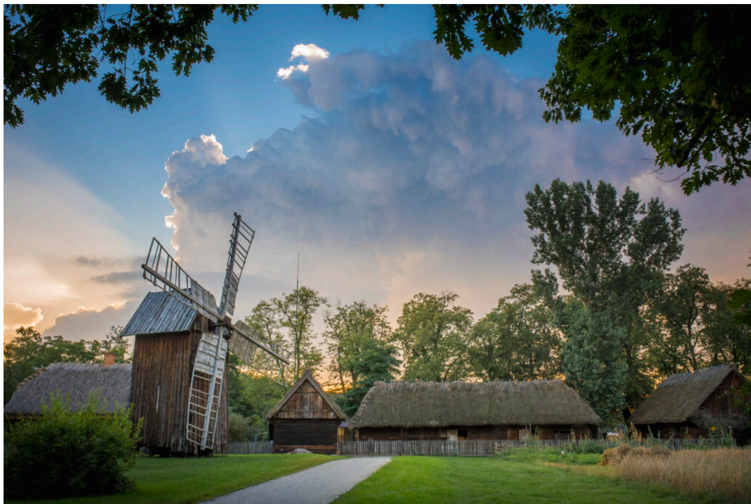
Muzeum Rolnictwa im. ks. Krzysztofa Kluka w Ciechanowcu, fot. Artur Warchala