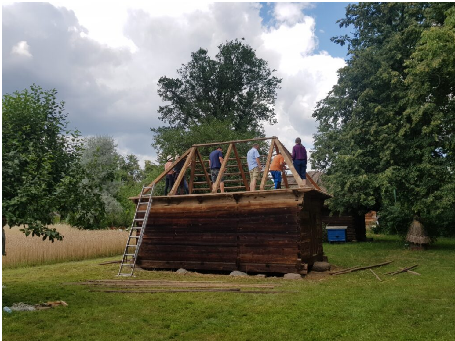
Muzeum Rolnictwa im. ks. Krzysztofa Kluka w Ciechanowcu