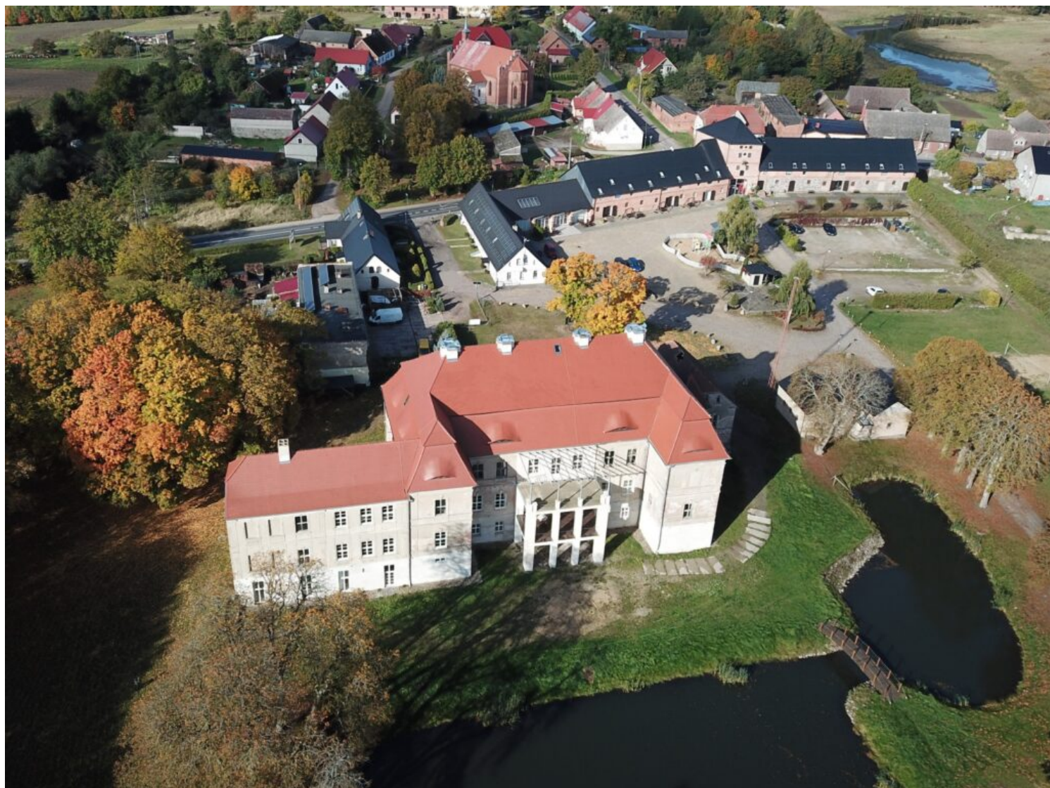
Zespół pałacowo-folwarczny w Siemczynie