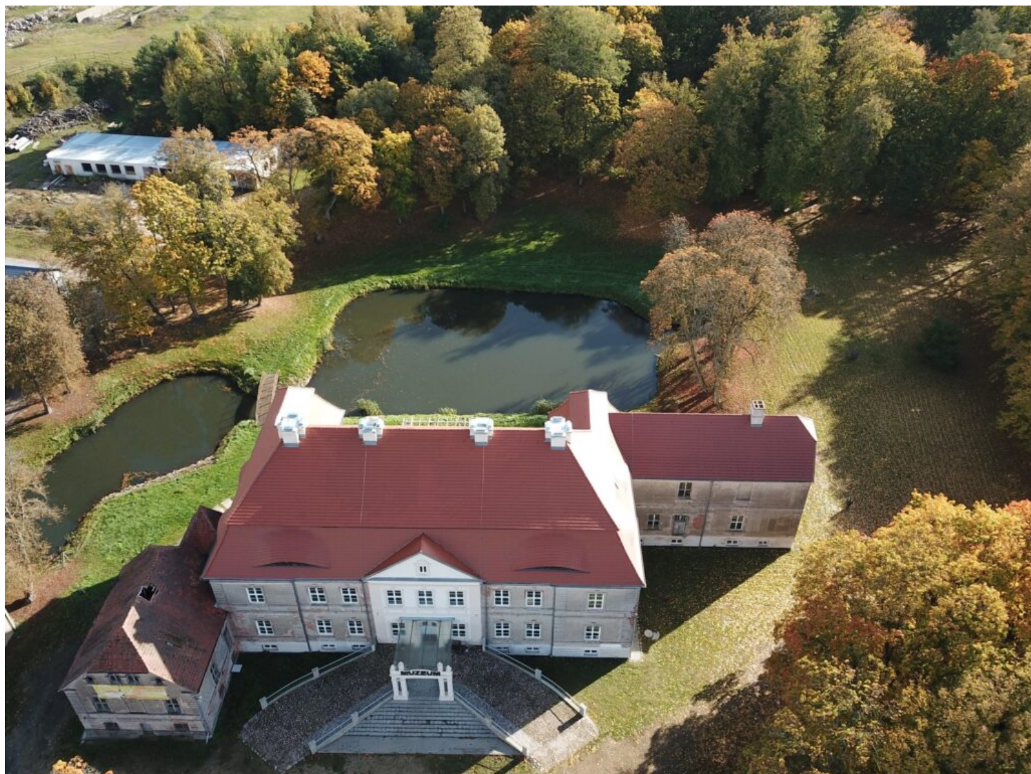
Zespół pałacowo-folwarczny w Siemczynie