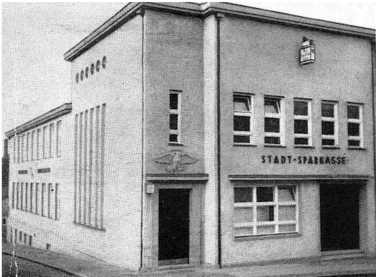
Czaplinek, fot. B. Słomiński