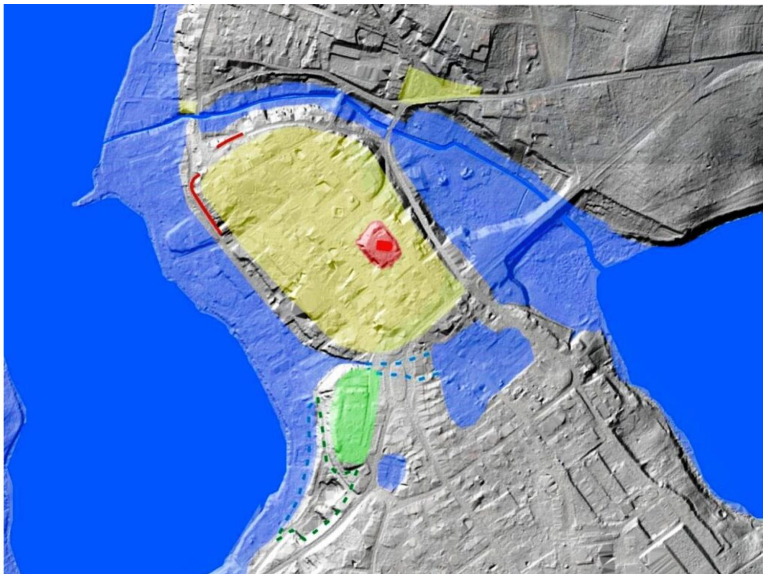
Mapa Czaplinka