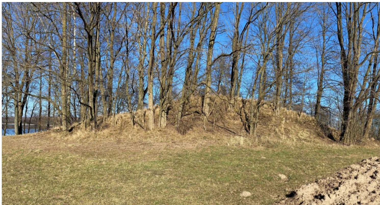
Czaplinek, fot. A. Bosy