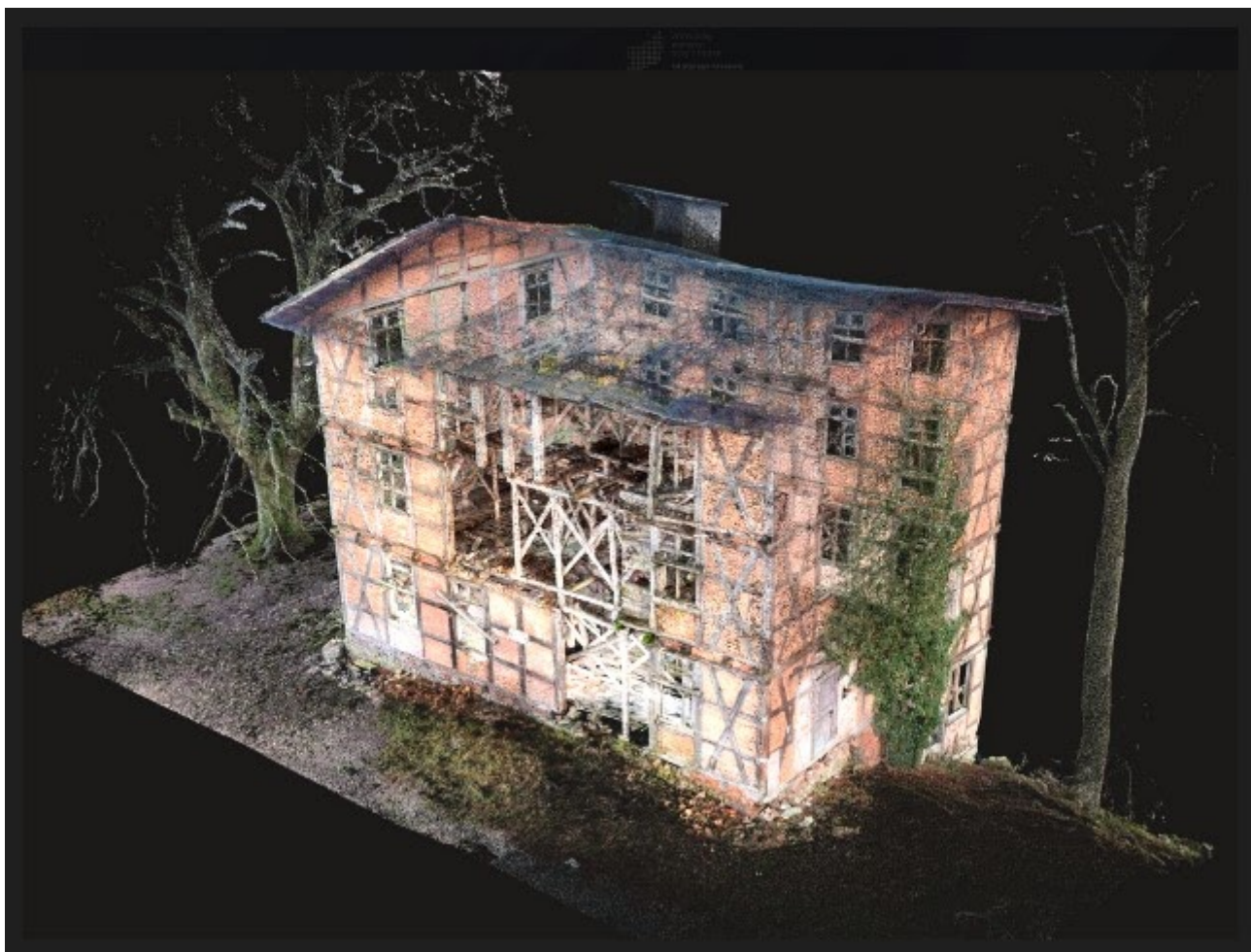
Zabytkowy młyn, Głęboczek, fot. A. Witek