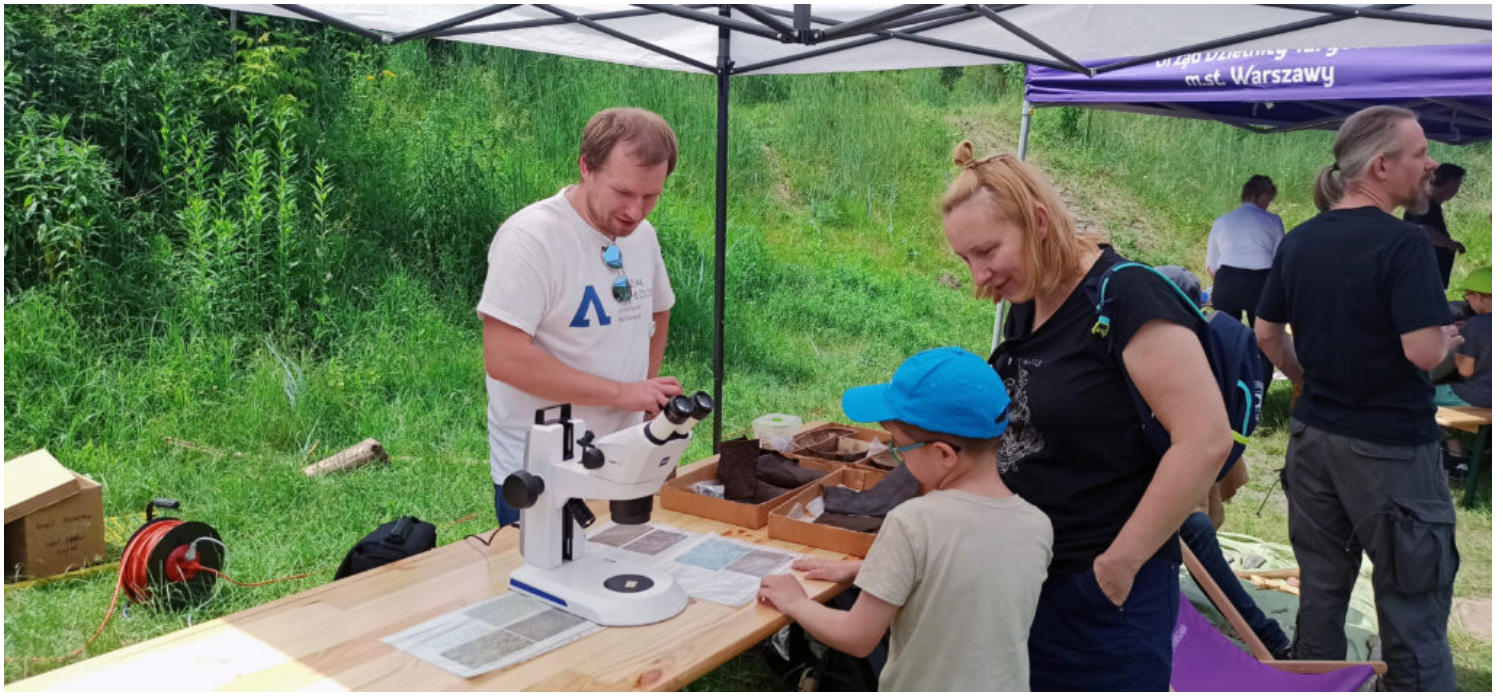
"Ludzie Ognia", Muzeum Archeologiczne, Oddział Muzeum Miejskiego Wrocławia, fot. Tomasz Gąsior