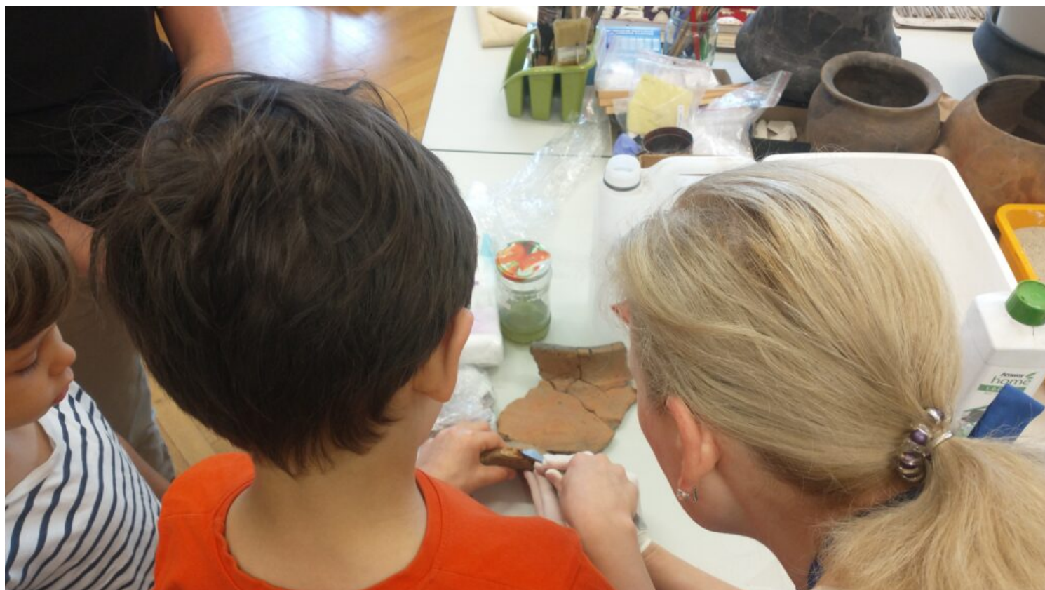
Grodzisko na Bródnie, fot. Marcin Wagner