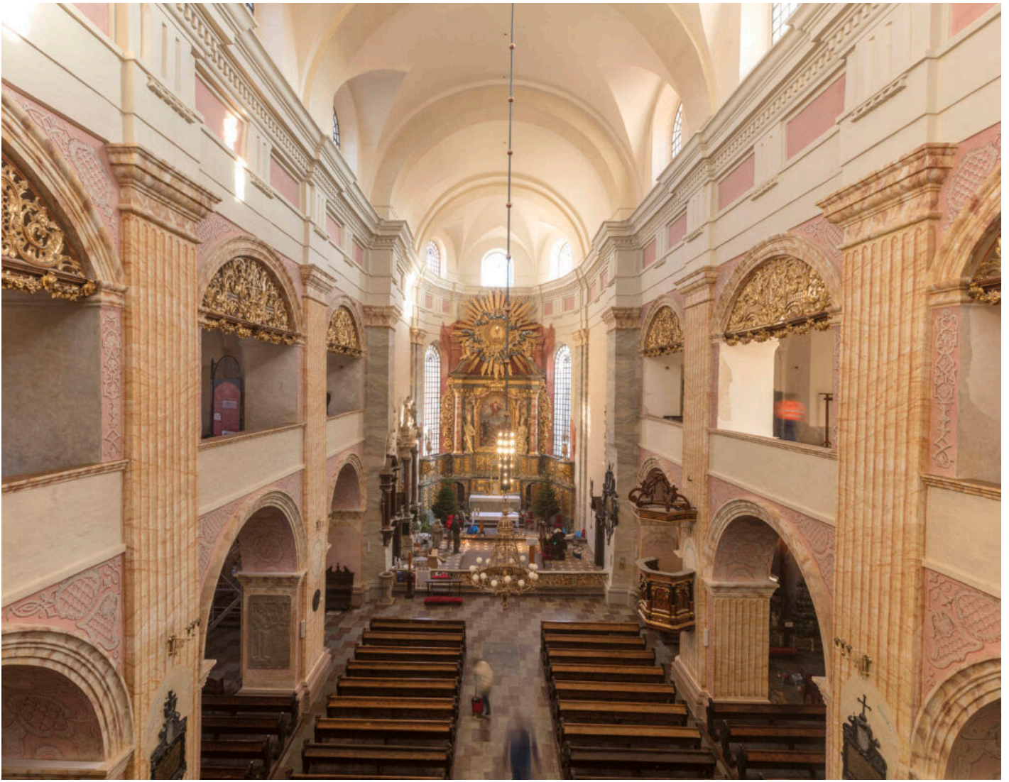
Fot. Damian Kwiecień, Gorek Restauro Sp. z o.o. Sp. k.