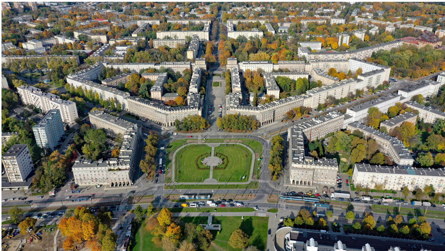
Nowa Huta