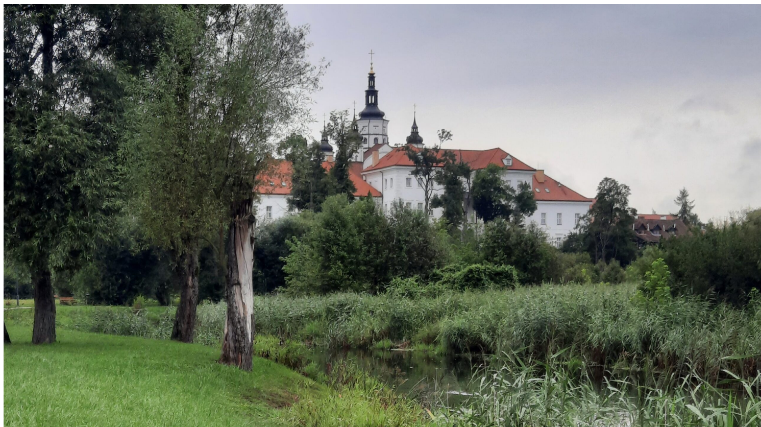
Widok na monaster od strony wschodniej, fot. A. Wawrzyńczuk, NID