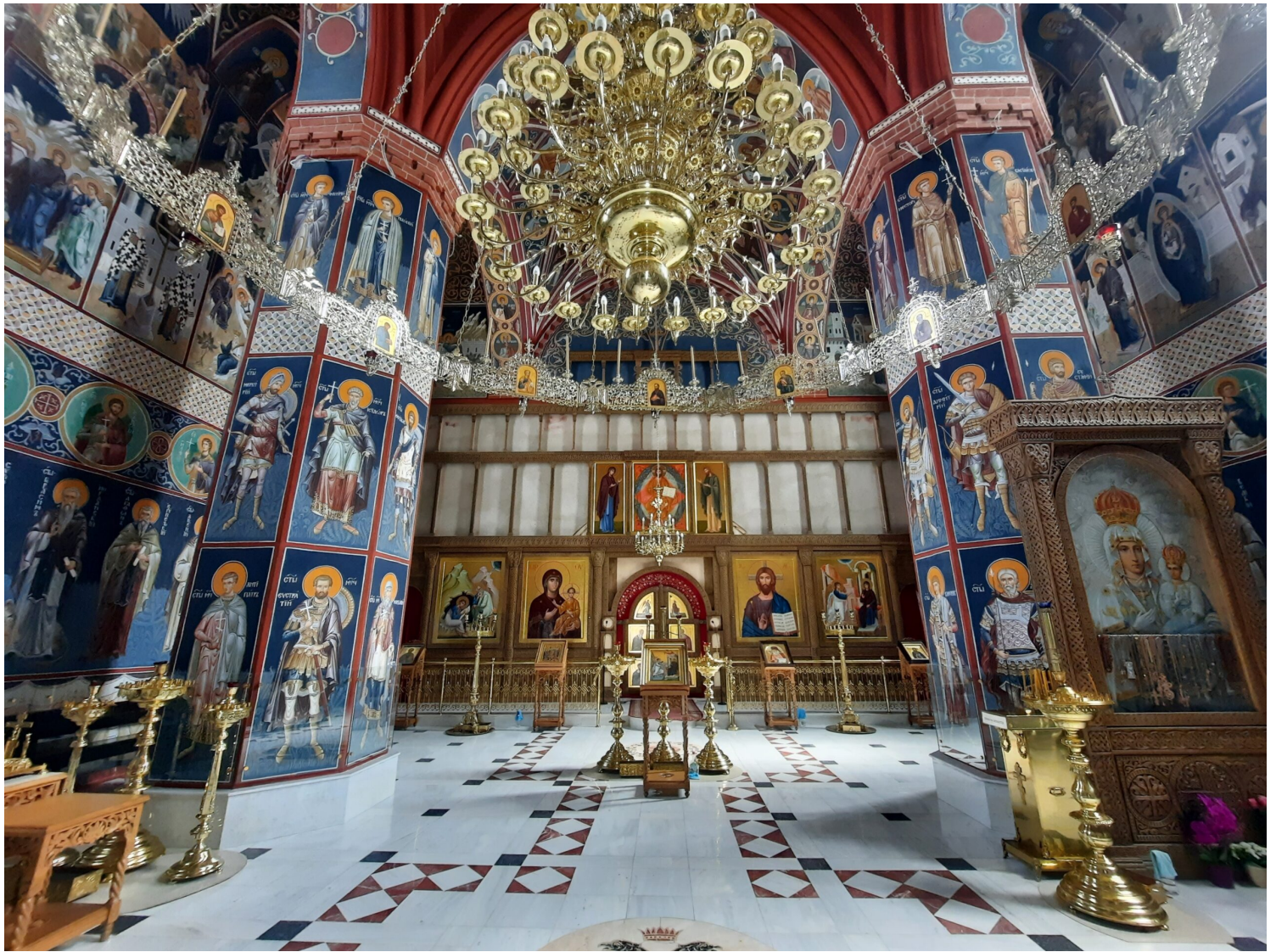
Wnętrze cerkwi Zwiastowania Najświętszej Marii Panny